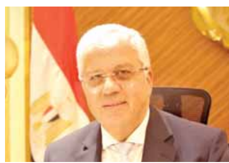
د. أيمن عاشور

التى أطلقتها الرئيس عبدالفتاح السيسى، حيث تم توقيع المشروع بين وزارة التعليم العالى والبحث العلمى ممثلة فى أكاديمية البحث العلمى والتكنولوجيا ووزارة الدفاع ممثلة فى مركز البحوث الطبية والطب التجديدى، وذلك خلال عام ٢٠٢١. ويهدف المشروع إلى رسم خريطة جينية مرجعية للشعب المصرى، تتضمن تحديد العوامل الجينية المؤثرة فى الاستجابة لأسباب الأوبئة، وكذلك تحديد المؤثرات الجينية المرتبطة بتأثير الأدوية وعلاج الأمراض المختلفة، مما يساهم فى تفعيل الطب الشخصى Personalized Medicine والطب الدقيق Precision Medicine. ويساهم فى تحديد الأشخاص الأكثر عرضة للإصابات الفيروسية والأكثر عرضة للانكسارات الصحية العنيفة التى تتطلب رعاية صحية خاصة، كما يهدف المشروع إلى دراسة «الجينوم المرجح» لقدماء المصريين وكذلك دراسة الجينات المتعلقة ببعض الأمراض، مثل أمراض القلب والأورام السائدة لدى المصريين، وكذلك الأمراض الوراثية الشائعة فى مصر.