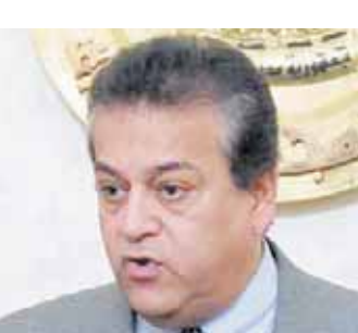
د. خالد عبدالغفار

وأوضح أن وزير الصحة شدد على ضرورة تكثيف الرقابة على أماكن تصنيع وصالحية جميع الأجهزة الطبية وتوافر كافة المستلزمات الطبية، والالتزام بالهجوم وضبط النفس أثناء التعامل مع الجمهور سارية، والتأكد من مدى التزام المنشآت الصحية الغذائية والعاملين بها بالممارسات الصحية الجيدة، كما شدد أيضاً على تكثيف أعمال مكافحة الحشرات في حال حدوث أي حوادث طارئة، بالإضافة إلى متابعة البلاغات بجميع المحافظات بصفة مستمرة كل نصف ساعة، وإعداد التقارير لمتابعة وتقييم الموقف خلال أيام العطلة. القوافل الطبية تشمل كافة التخصصات الطبية، بالإضافة إلى تواجد عدد من العيادات المتنقلة التي تقدم خدمات المبادرات الرئاسية للصحة العامة ١٠٠ مليون صحة» وذلك في الأماكن العامة والمتنزهات والكشاش والحدائق، مشيراً إلى تكثيف تواجد فرق التوعية والتواصل المجتمعي بجميع محافظات الجمهورية لتقديم التوعية الصحية للمواطنين، فضلاً عن تعريفهم بآماكن وخدمات المبادرات الرئاسية للصحة العامة ١٠٠ مليون