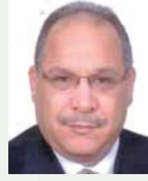
بقلم: حسين حلمي