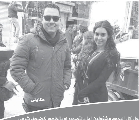
جعل كل النجوم مشغولين إما بالتصوير أو بالظهور كضيوف شرف، كل ذلك في إطار تغيير الموضوعات التي تناقشها الدراما... نجوم وفنون « ترصد أهم ملامح الموسم الرمضاني.