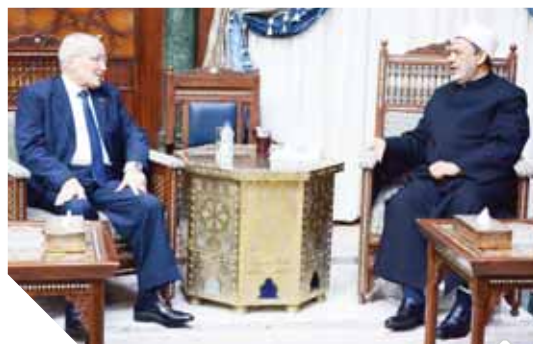
شيخ الأزهر خلال استقباله وزير الإنتاج الحربى

أكد الدكتور على عبدالعال رئيس مجلس النواب مائة العلاقات المصرية الترانزيتية وتطلعه لزيادة التبادل التجارى بين البلدين الشقيقين فى القارة السمراء ليكون بحجم العلاقات السياسية التى تربط البلدين، وأشاد «عبدالعال» فى كلمته أمام البرلمان الترانزيتى أمس بأواصر الثقة والمحببة بين الشعبين، مشيراً إلى ضرورة العمل على تعزيز القدرات الوطنية للدول الأفريقية، فضلاً عن تعزيز أسس التنمية المستدامة بما يوفر فرص عمل للشباب ويهدم الطريق نحو أفريقيا أكثر استقراراً ورخاء. واقتراح رئيس البرلمان فى كلمته إنشاء جمعية برلمانية لدول حوض النيل لتحقيق التعاون والتكامل فيما بينها، وتكون منبراً حراً لشعوبها وجزراً يعبر بين الدول الأفريقية ودول حوض النيل إلى آفاق التنمية والأزدهار.