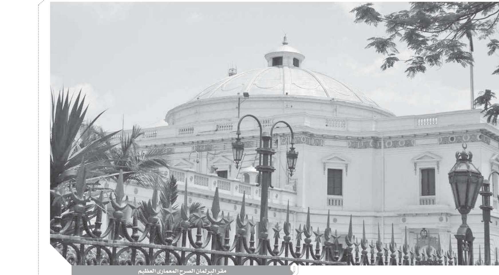
مقر البرلمان الصرح المعماري العظيم

شخصية وعلى جانبها يماين خديشان صغيران فوجدت بسقف القاعة زخارف ثنائية وهندسية منبهة وقد تم ترميم هذه القاعة على نفقة وزارة التربية والتعليم وتحت إشراف وزير الأثار بعد أن وتبع مساحه هذه القصور 23 هكتارا، وهي جميعاً تمثل ثروة عقارية وتاريخية مهمة وما زال الخديو يحتفظ بكل عناصره المعمارية والجمالية، إلا أن حديثه للشاسمة ثنائية وهندسية ملونة ويحيط بإبنائه لابنته اللبنانية لزوجته الثالثة للخديو إسماعيل، جشم ملونة ويحيط بالأسقف إزاز يشتمل على زخارف كتابية فخمة بالجهة الشمالية لها ثلاثة أبواب