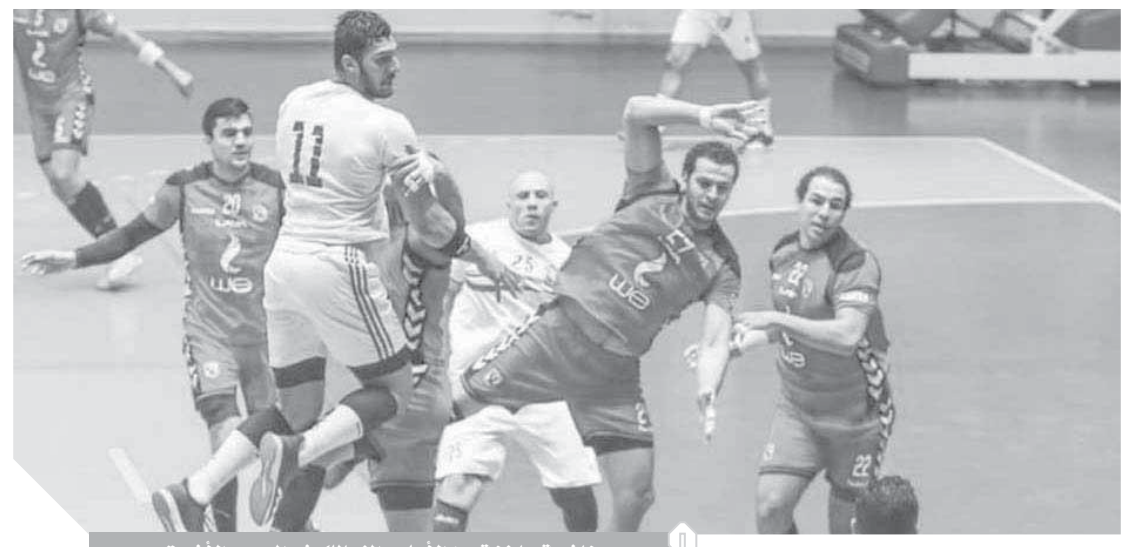
منافسة ساخنة بين الأهلي والزمالك في السوبر الإفريقي