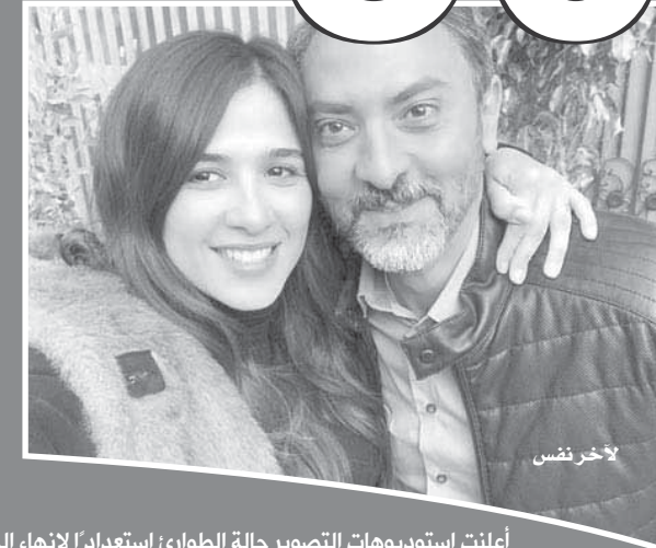
أعلنت استوديوهات التصوير حالة الطوارئ استعداداً لانتهاء الحلقات الأولى من المسلسلات المقرر عرضها في المارثون الرمضاني.

ملاحم كثيرة تغيير في الموسم الجديد أهمها تغيير الخريطة التناصية تماما، بالإضافة إلى لوجو الفنانين للحلقات المنفصلة المتصلة نظراً لعدم الانتهاء من كتابة السيناريو حتى الآن. وهو ما