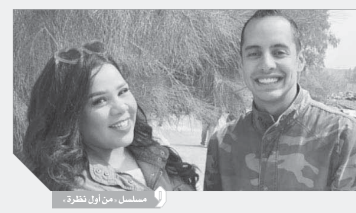
مسلسل، من أول نظرة.