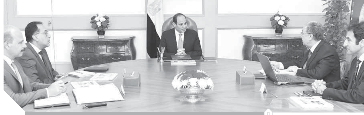
جانب من اجتماع الرئيس السيسي برئيس الوزراء والدكتور محمد شاكر وزير الكهرباء