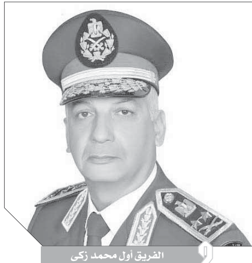
الفريق أول محمد زكى

السيد الرئيس، عبدالفتاح السيسي.. رئيس الجمهورية، القائد الأعلى للقوات المسلحة، يسعدني أن أبعث إلى سيادتكم بأسمى آيات التهاني بمناسبة الاحتفال بذكرى ليلة الإسراء والمعراج تلك الليلة المباركة التي كرم الله سبحانه وتعالى بها نبي الأمة محمداً صلوات الله عليه وسلامه عليه بإسراءه من البيت الحرام إلى المسجد الأقصى ومعاجزه إلى السموات العلى، متمنياً لسيادتكم موفور الصحة، وأن يعيد هذه الذكرى المباركة على الوطن وشعبه بكل الخير والبركات والأمن والاستقرار. ورجال القوات المسلحة وهم يهنئون سيادتكم بهذه الذكرى العظيمة، يؤكدون إيمانهم المطلق بالقيم السامية والمبادئ النبيلة التي تركها فينا نبي الأمة في الدفاع عن أرضنا ودينتها وسلامتها وحماية شعبها العظيم، وعقيدتهم