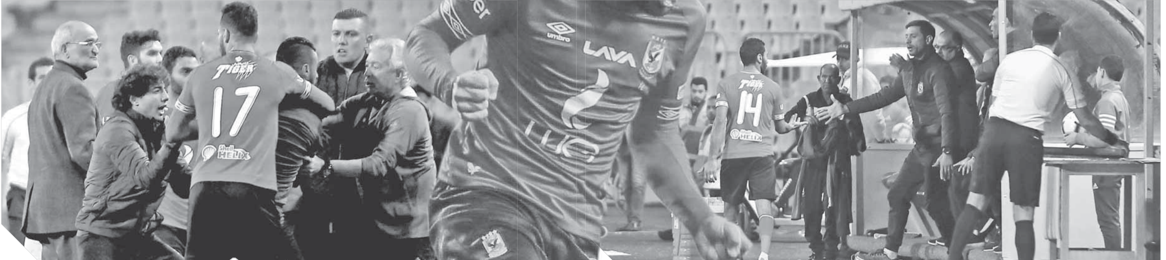
مشاركة قوية بين لاعبي الأهلي والاتحاد

تغريم «الشحات».. و«لاسارتى» يدافع عن التدوير أمام الاتحاد ..ورقصة «رمضان».. وضربة «علام» كلمة السر فى اشتباكات برج العرب