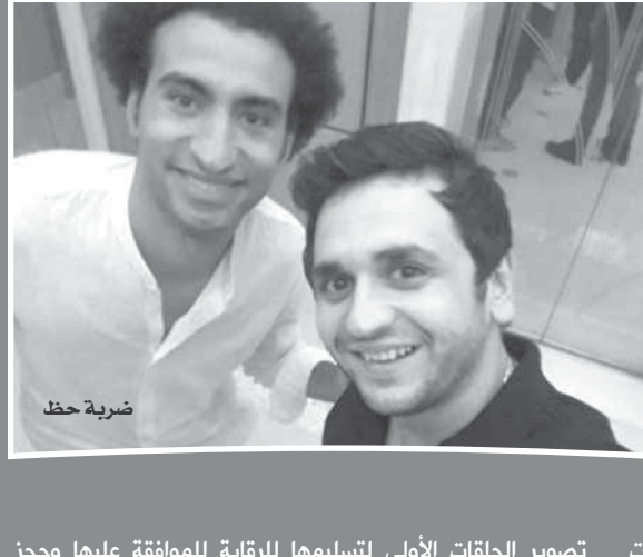
تصوير الحلقات الأولى لتسليهما للرقابة للموافقة عليها وحجز مواعيد المشاهدة على القنوات الفضائية.

ملاحم كثيرة تغيير في الموسم الجديد أهمها تغيير الخريطة التناصية تماما، بالإضافة إلى لوجو الفنانين للحلقات المنفصلة المتصلة نظراً لعدم الانتهاء من كتابة السيناريو حتى الآن. وهو ما