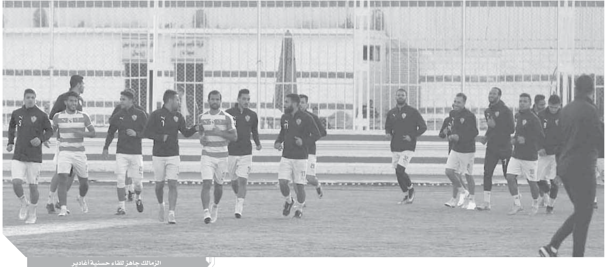
الزمالك جاهز للقاء حسنية أغادير