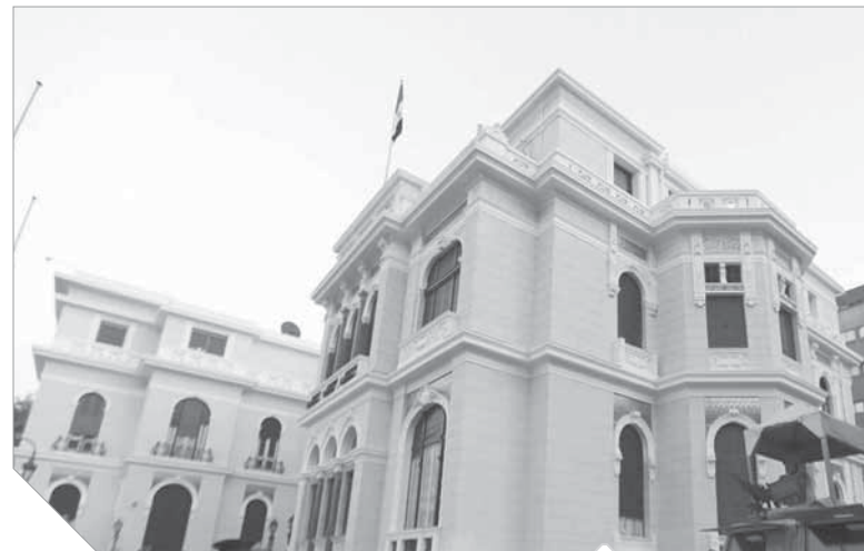
قصرشويكارهانم أصبح مقر الحكومة

في واحد من أجمل قصور القاهرة بق مقرر مجلس الوزراء، وزعم الأسوار المحيطة به إلا أنها لم تستطع إخفاء معالم القصر الجميل الذي ما زال يحمل اسم الأميرة شويكار حفيدة إبراهيم باشا ابن محمد على. هذا القصر مثل غيره من القصور التاريخية بوسط القاهرة يسمح حالياً بحلول عام 2020 لتحتضن مقصراً جديداً للوزارة. أما القصر الذي بناه الأمير إبراهيم هاشم ووالدتها هي الأميرة نجوان حفيدة أحمد رفعت باشا الابن الأكبر لإبراهيم باشا بن محمد على. كانت الأميرة شويكار سيدة مجتهد من الطراز الأول، وكان لها العديد من الأعمال الخيرية منها إنشاء أول جريدة نسائية في مصر سنة 1945 باسم المرأة الجديدة وكانت مجلة ثقافية وأدبية، وكان قصدها استقبال العديد من الشخصيات الهمة حيث كانت تقعد به يوم الأحد من كل أسبوع ما كان يورده باسمها والعلوان وكان السيد عفت كان زعيم الدولة وسليمان من أفراد أسرة محمد علي، بالإضافة إلى خليف سونيا، الأولى في رأس السنة الميلادية والثاني يوم عيد ميلاد الملك فاروق في 11 فبراير. وزعم أن تاريخ بناء القصر ليس معروفاً بالتحديد، إلا أن المراجع التاريخية أكت أنه انتهى أوائل القرن العشرين في الفترة