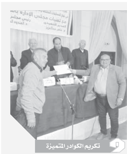
تكريم الكوادر المتميزة