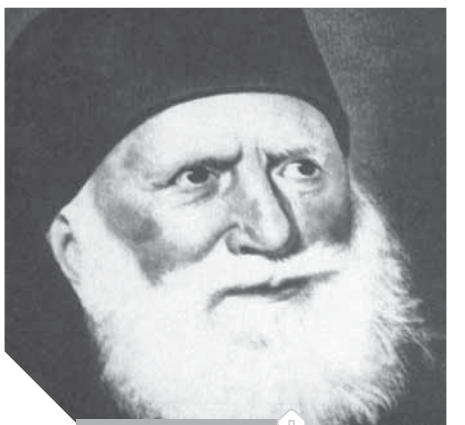
محمد علي باشا