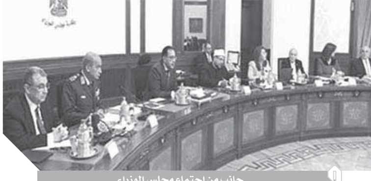
جانب من اجتماع مجلس الوزراء

أينها أكبر. وأكد الدكتور مصطفى مدبولي رئيس الوزراء أن تكلفة الزيادات الجديدة تصل إلى 60 مليار جنيه، مشيراً إلى أنها غير مسبوبة وتتضمن إطلاق أكبر حركة ترقيات للعاملين بالدولة. كما وافق المجلس على مشروع قرار بقانون في شأن تقرير حد أدنى للعلاوة الدورية للمخاطبين بقانون الخدمة المدنية، ومنع علاوة خاصة لغير المخاطبين بقانون الخدمة المدنية، وتقرير فئة مالية مقطوعة للعاملين بالدولة.