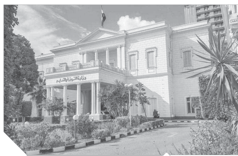
قصر بنات الخديو إسماعيل أصبح مقر وزارة التربية والتعليم

في مربع تبلغ مساحته 600 × 900 متر تقع عدة وزارات جميعها تشغل قصورا قاهرة إسماعيل الخديو إسماعيل لبنائه اثلاث، بالإضافة إلى قصور أخيه البارونات لإسماعيل المفتش، هذه القصور منها ما يعتبر أثراً وجهتها تتمتع بقيمة تاريخية ومعمارية كبيرة، ومن الأثر أيضا إخلاؤها عن بداية العالم الجديد لتصبح فرسا رائعة للاستثمار. وكان الخديو إسماعيل قد قد قام بإنشاء 3 قصور لبنائه، كل واحد منها يقع على مساحة 9 أهدنة، الأول لابنة باتشي «فاقة»، والتي تزوجت من مصطفى باشا ابن إسماعيل صديق المعروف المفتش وتشغله وزارة التربية والتعليم، والثاني لابنته «الأميرة جميلة»، زوجة محمد باشا بن كنج شاهين ناظر الجهادية عام 1879، وتشغله الآن 3 وزارات هي الإسكان في مبنى القصر نفسه، ووزارتها البحث العلمي والتكنولوجيا على أرض حديقة. أما القصر الثالث فكان 2 الأميرة فريدة، زوجة مصطفى باشا، وتشغله وزارة الإنتاج الحربي، وكان هذا يطلق عليها اللغة العربية، لأن الزخارف الفنية فيه شحكة، صادرت الدولة هذه القصور وأصبحت مقراً للوزارات. وتحولت إشراف وزارة الأثار بعد أن وتبع مساحه هذه القصور 23 هكتارا، وهي جميعاً تمثل ثروة عقارية وتاريخية مهمة وما زال الخديو يحتفظ بكل عناصره المعمارية والجمالية، إلا أن حديثه للشاسمة ثنائية وهندسية ملونة ويحيط بإبنائه لابنته اللبنانية لزوجته الثالثة للخديو إسماعيل، جشم ملونة ويحيط بانشائه لابنته اللبنانية لزوجته الثالثة للخديو إسماعيل، جشم ملونة ويحيط بالأسقف إزاز يشتمل على زخارف كتابية فخمة بالجهة الشمالية له ثلاثة أبواب