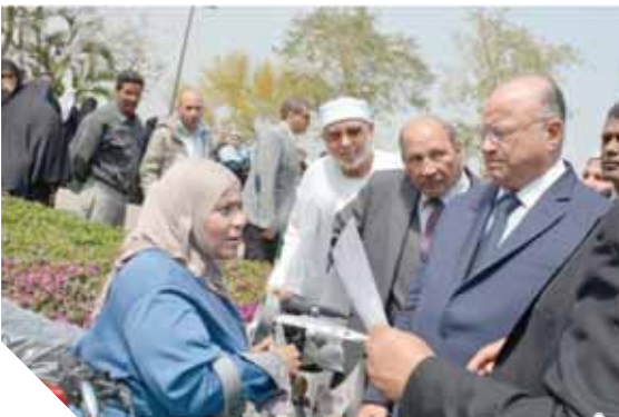
محافظ القاهرة خلال توزيع 35 دراجة بخارية

نظمت محافظة بالتعاون مع مديرية التضامن الاجتماعي بالقاهرة والاتحاد الإقليمي للمعاقات والأهلية، وأكد المحافظ خلال الحفل، تفعيل محافظة القاهرة لسياسة ضخمة لعدد 29 عروسة مقبلة على الزواج من غير القادرات وتوفير سبل الحياة لهم بالتعاون مع المجتمع المدني.