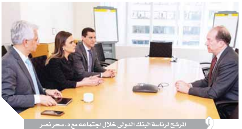
المرشح لرئاسة البنك الدولى خلال اجتماعه مع د. سحر نصر

اتفق الأزهر الشريف ووزارة الإنتاج الحربى على تعزيز التعاون بينهما والاستفادة من الإمكانيات التصنيعية والتكنولوجية لشركات الإنتاج الحربى، جاء ذلك خلال لقاء فضيلة الإمام الأكبر الدكتور أحمد الطيب شيخ الأزهر الشريف والدكتور محمد سعيد العصار وزير الدولة للإنتاج الحربى، تم خلال اللقاء استعراض دور الإنتاج الحربى فى تطوير كفاءة المعاهد الأزهريّة، حيث نفذت شركة الإنتاج الحربى للمشروعات والاستشارات الهندسية 14 معهداً أزهرياً خلال 2018-2017، وتقوم حالياً بإنشاء 50 معهداً وترمم 160 معهداً أزهرياً على مستوى الجمهورية لعام 2019-2018.