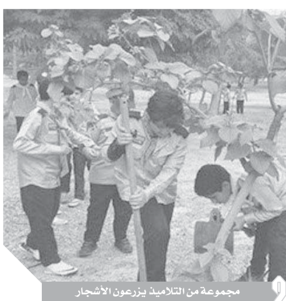
مجموعة من التلاميذ يزرعون الأشجار

ولفت إلى أنه تم تنفيذ نماذج من مشروع زراعة مليون شجرة مثمرة في محافظات القاهرة - الجيزة - البحر الأحمر - الشرقية - البحرية - الإسكندرية - الدقهلية - المنوفية - بنى سويف - المنيا - قنا - سوهاج -