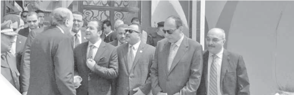
مدير أمن القليوبية يستقبل وفد حقوق الإنسان بالبرلمان لتفقد مراكز الشرطة بالبحافطة

صلا، وهو الأمر الذي أشاد به النواب، مؤكداً أن ذلك أول قسم يكون به زاوية للصلاة، وأكد رئيس لجنة حقوق الإنسان أنه لأول مرة يتم دمج الضباط في قطاع حقوق الإنسان، للتعامل والاستماع إلى بىال بعض السيدات. وتعمد «عابد»، خلال الزيارة التفقدية، إلى يسأل بعض المواطنين «التواجدين بمقر التوثيقية لتقديم بلاغات»، على أفراد، عن كيفية تعامل المسؤولين بالقسم معهم، ومدى حسن معاملتهم وسرعة تلقيهم للخدمات، وهو الأمر الذي رد عليه المواطنون، بأن التعامل داخل القسم جيد، وأن هناك حرصاً كبيراً على حسن المعاملة وسرعة تلبية خدماتهم وفقاً للقانون.