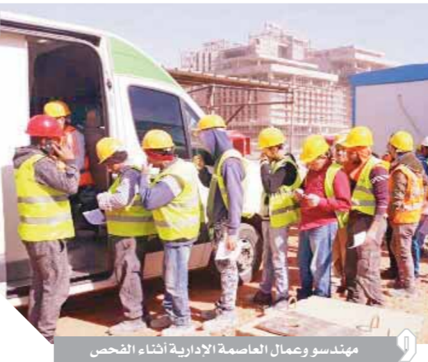
مهندسو وعامل العاصمة الإدارية أثناء الفحص