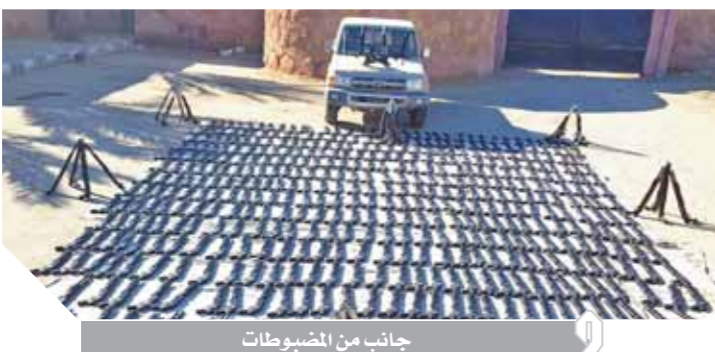
جانب من الضبوطات