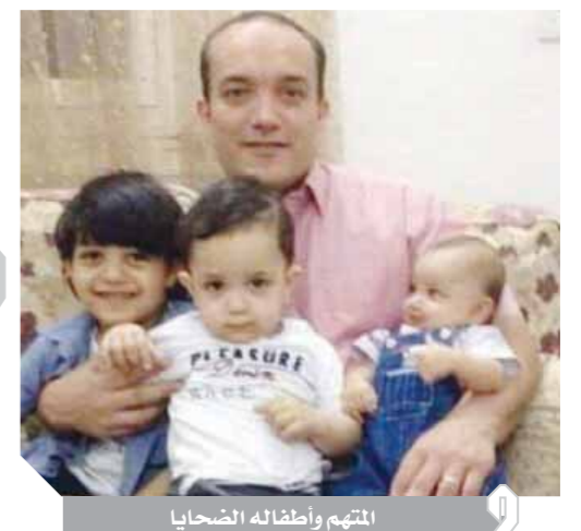
المتهم وأطفاله الضحايا