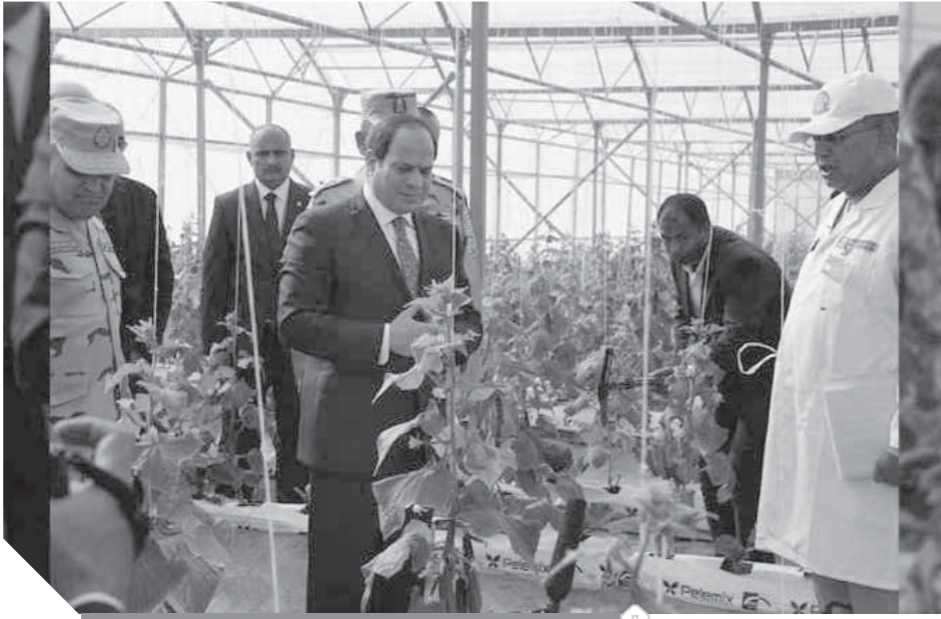
الرئيس السيسي يتفقد مشروع الصوب الزراعية

إنتاجها 7 أمثال الزراعات العادية.. وتخفيض أسعار الخضر والفاكهة