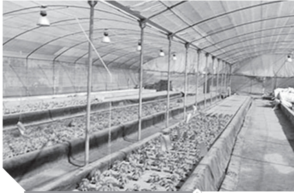
إنشاء مجتمعات زراعية تنموية متكاملة