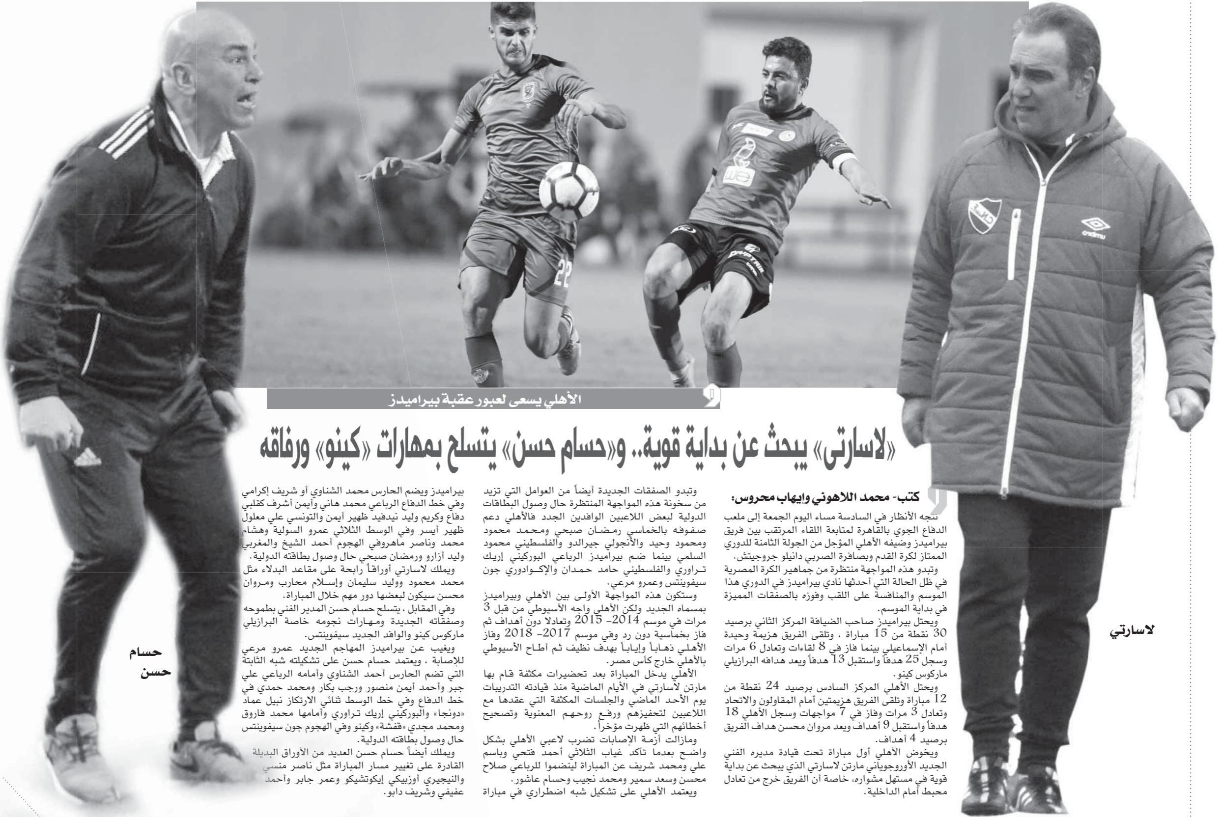
الأهلي يسعى لعبور عقبة بيراميدز