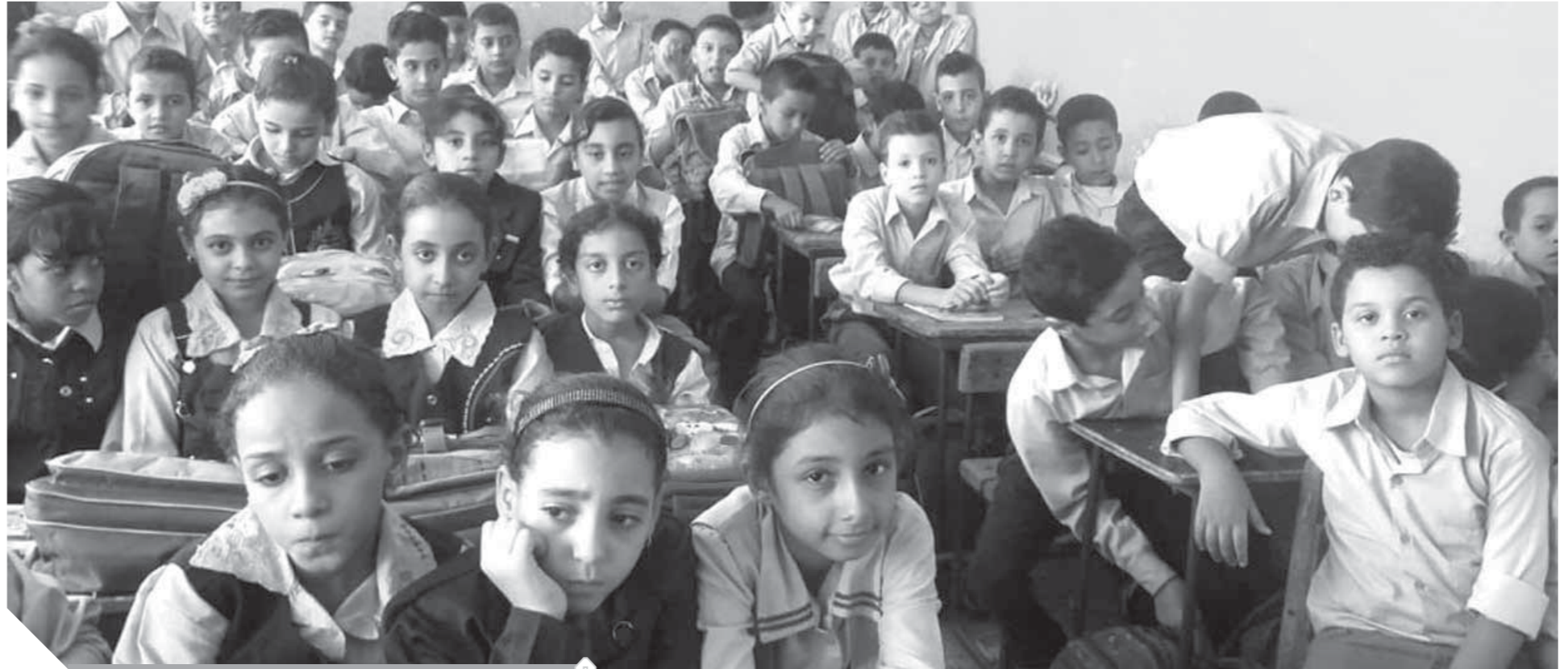
العملية التعليمية بحاجة شديدة إلى جراحة عاجلة