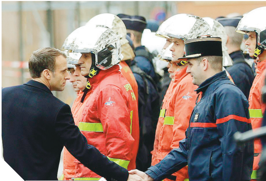
ماكرون مع قواته