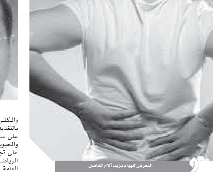
التعرض للهواء يزيد آلام المفاصل

تتأذى من آلام مبرحة ويحتاج علاج الروماتويد إلى راحة المفاصل والعضلات مع استخدام الأدوية المضادة للالتهابات والمضادة للروماتيزم والمسكنة للألم مدة طويلة وفي بعض الحالات الشديدة تستخدم الأدوية التي تعمل على جهاز المناعة والعلاج بهذه الأدوية. وتستخدم الأشعة تحت الحمراء في علاج بعض الأمراض الروماتيزمية البسيطة والتقلصات العضلية في الأصحاء الذين يتأثرون ببرد الشتاء وكذلك مرضى الروماتيزم المزمن حيث تعمل الحرارة على تقليل الإحساس بالألم في المفاصل المعرضة للأشعة وتقليل التقلص العضلي الذي يحدث دائماً نتيجة التعرض للبرد. وكذلك الأشعة الحرارية يزيل بقايا الالتهابات ويجردها عن طريق الكليتين ويمكن أيضاً استخدام الوسائد الكهربائية وحرارة الماء الساخن وزجاجة الماء الساخن والكمادات الساخنة وكمادات شمع البرافين كوسائل علاج للحرارة ويُعد العلاج البيئي أحد أنواع العلاج الحديثة التي يتم اللجوء إليها، وذلك من خلال الرجوع إلى ما تحويه البيئة وتتضمنه بين جدرانها من مقومات وعناصر تصلح للاستخدام في علاج آلام الروماتيزم والمفاصل التي ظهرت وانتشرت في الآونة الأخيرة دون استخدام أية أدوية أو كيميائيات. وتتواءم أماكن العلاج البيئي ما بين العيون المعدنية والكبريتية والرمال الدافئة، وتنتشر في بعض المناطق بمصر مثل حلوان والواحات والغردقة وسفاجا وسينا.