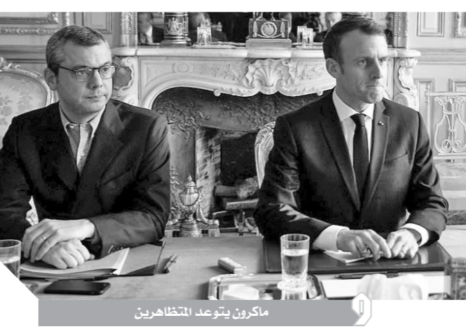
ماكرون يتوعد المتظاهرين

وقال فيليب ثمانية «ممثلين» للقاء في مكتبه، لكن اثنين فقط حضرا خرج أحدهما بعد إخباره بأنه لا يستطيع أن يدعو كاميرات التلفزيون لثبث اللقاء مباشرة للأمة. وتوجه الرئيس الفرنسي إيمانويل ماكرون إلى قوس النصر ليقدم الأضرار التي لحقت بالميدان الشهير خلال أحداث الشغب، مباشرة بعد عودته إلى باريس، قادماً من الأرجنتين. وأظهرت لقطات تلفزيونية الجزء الداخلي من قوس النصر؛ حيث تحطم جزء من تمثال ماريان، وهو رمز للجمهورية الفرنسية، كما كتب المحتجون على القوس شعارات مناهضة للرأسمالية ومطالب اجتماعية. واستهدف بعض المحتجين قوس النصر في باريس، ودعوا ماكرون للاستقالة، وكتبوا على واجهة القوس الذي يعود تاريخه للقرن التاسع عشر عبارة «ماكرون ارحل». وأعلنت وسائل إعلام فرنسية وقوع حالة وفاة ثالثة على خلفية الاحتجاجات؛ حيث قتل سائق إحدى السيارات نتيجة تصادم ثلاث سيارات.