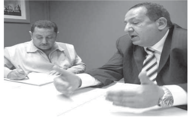
أبوعلى، أثناء حديثه لـ«الوفد»