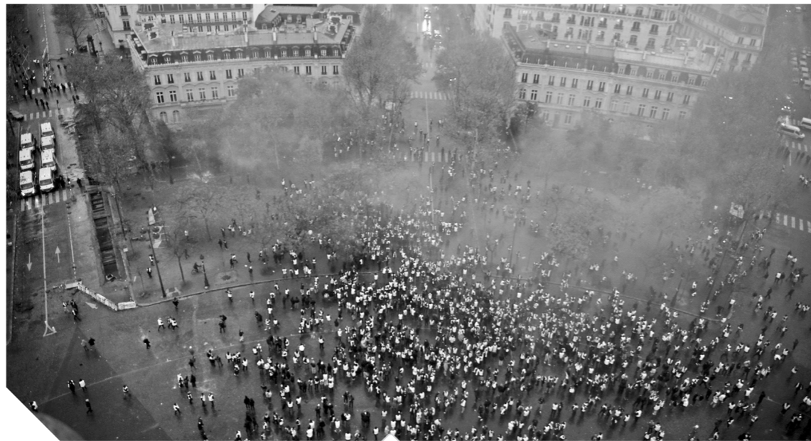
جانب من مظاهرات باريس

الحكومة على إغلاق جادة الشانزليزيه أمام السيارات بينما قام رجال الأمن بتفتيش المحتجين وفحص بطاقات هويتهم، قبل السماح لهم بالدخول إلى المنطقة أملاً في تجنب تكرار أحداث العنف التي وقعت الأسبوع الماضي دون أن تتجح في ذلك. وسعى ماكرون لاحتواء غضب المحتجين، واعدا بإجراء محادثات على مدى ثلاثة أشهر حول الطريقة المثلى لتحويل فرنسا إلى اقتصاد قليل استخدام الكربون دون اتخاذ إجراءات تضرب الفقراء والطبقة الوسطى بشدة. وأشارت التصريحات التي أطلقتها خلال الأسبوع الجاري غضب المحتجين ولم تقنعهم، ورد بعضهم بالقول «هراء» و«كلام فارغ»، ويقومون بتمركزين في بعض الطرق والدورات.