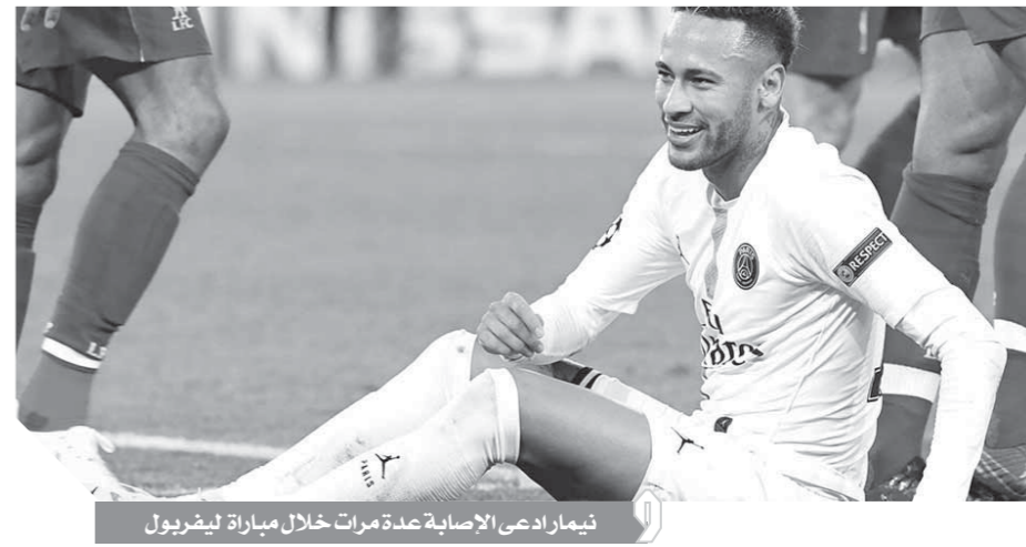
نيمار ادعى الإصابة عدة مرات خلال مباراة ليفربول

استمر هكذا سيتذكره الناس بأنه ممثل وليس لاعب رائع». وأضاف: ما قام به أمام ليفربول كان شيئاً سيئاً، أتفههم لماذا كان يورجن كلوب محبطاً من سقوط لاعبي باريس سان جيرمان المتكرر، ما قام به اللاعبون أمر مستفز حقاً. وأتم حديثه قائلاً: لاعبو باريس سان جيرمان يجب أن يكونوا محرجين من أنفسهم فقد ظلوا يمثلون في أرض الملعب ويتحدثون إلى عائلاتهم وزوجاتهم، المكان الوحيد للتحدث هو روضة الأطفال.