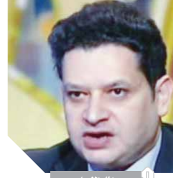
د. محمد معيط

كشف الدكتور محمد معيط وزير المالية، عن التفاصيل الكاملة لأسباب صدور قرار تعديل سياسة الدولار الجمركي بالنسبة للسلع الضرورية الترفيهية مقابل تثبيته عند 16 جنيهًا بالنسبة للسلع الاستراتيجية والضرورية بداية من أول ديسمبر 2018 حتى 31/12/2018، وأكد معيط «خلال مؤتمر صحفي عقده أمس بقصر وزارة المالية أن اللجوء إلى تعديل سياسة الدولار الجمركي يأتي حماية لأرزاق الناس وحماية لكل فرصة عمل لأي مواطن من الضياع» على حد قوله، وقال إن ذلك يتحقق من خلال حماية الصناعة الوطنية وتعميقها. مؤكداً أن الهدف من القرار زيادة فرص العمل وزيادة الإنتاج.