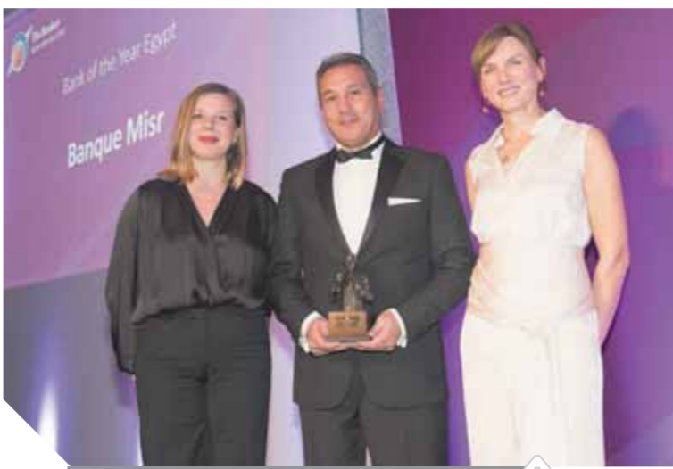
مجلس إدارة البنك الأهلي المصري

عن العام الذي سبقه، ووصل معدل العائد على متوسط الأصول إلى 1.33%، وبلغ إجمالي الأرباح في 2016/2017 14.1 مليار جنيه قبل خصم الضرائب بنسبة نحو 38.4% عن العام المالي الذي سبقه، وبلغ صافي الربح لـ 8.2 مليار جنيه محققاً نسبة نمو 48.5% وبعد سداد مبلغ 5.9 مليار جنيه للضرائب، وبلغ معدل العائد في ذلك العام على متوسط حقوق الملكية إلى 16.31%.