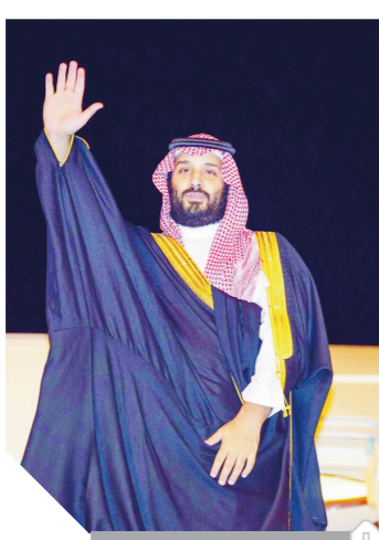
الأمير محمد بن سلمان

كتب- سحر رمضان: أعلن البيان الختامى لقمة قادة دول مجموعة العشرين التى اختتمت أعمالها فى العاصمة الأرجنتينية بونوس آيرس، أن القمة ستعقد فى اليابان العام المقبل، فيما تستضيف المملكة العربية السعودية اجتماعات قمة عام 2020. وقال البيان الذى نقلته وكالة الأنباء السعودية واس: «تشكر الأرجنتين على رئاستها مجموعة قمة العشرين وعلى استضافة مؤتمر قمة بونوس آيرس الناجح، وتطلع إلى عقد اجتماعات القمة فى اليابان فى عام 2019، وفى المملكة العربية السعودية فى عام 2020». كما انضمت السعودية للجنة الثلاثية «الترويكا» فى مجموعة العشرين، التى ترأسها اليابان بصفتها رئيس المجموعة لعام 2019، والأرجنتين بصفتها الرئيس السابق، والسعودية بصفتها الرئيس اللاحق للمجموعة فى عام 2020. وقال البيان الختامى «تطلع للقمة المقبلة فى اليابان عام 2019 والمملكة العربية السعودية 2020». ووافقت قمة مجموعة العشرين على إصلاح منظمة التجارة العالمية، لكن 19 منهم فقط، واتفقا على دعم اتفاقية باريس التى تحارب تغير المناخ.