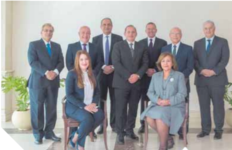
مجلس إدارة البنك الأهلي المصري

خطة زمنية تتوافق مع خطة الدولة، ولفت «عكاشة» إلى أن مشاركة البنك الأهلي في تلك المبادرة القومية يأتي ضمن دعمه المستمر لتحقيق رؤية مصر 2030 في محاورها والتي تتضمن الاهتمام بتمتع كافة المواطنين بحياة صحية سليمة آمنة من خلال تغطية صحية ووقائية شاملة.