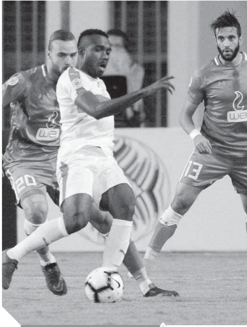
خروج الزمالك من البطولة العربية صدم جماهيره