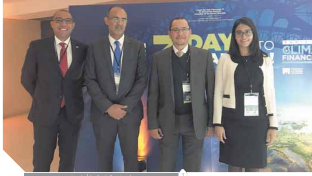
مجلس إدارة البنك الأهلي المصري

ويقيم التجاري الدولي في الفترة التي تسبق انعقاد اجتماع الجمعية العامة للأمم المتحدة - والمقرر عقده في نيويورك في سبتمبر 2019 - بالعمل مع المؤسسات ذات الصلة على إعلان توقيع أو تأييد مؤسسات أخرى للانضمام للمبادرة.