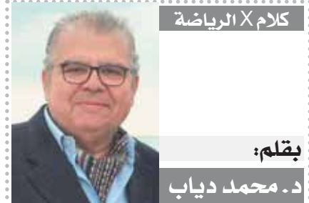
بقلم: محمد دياب