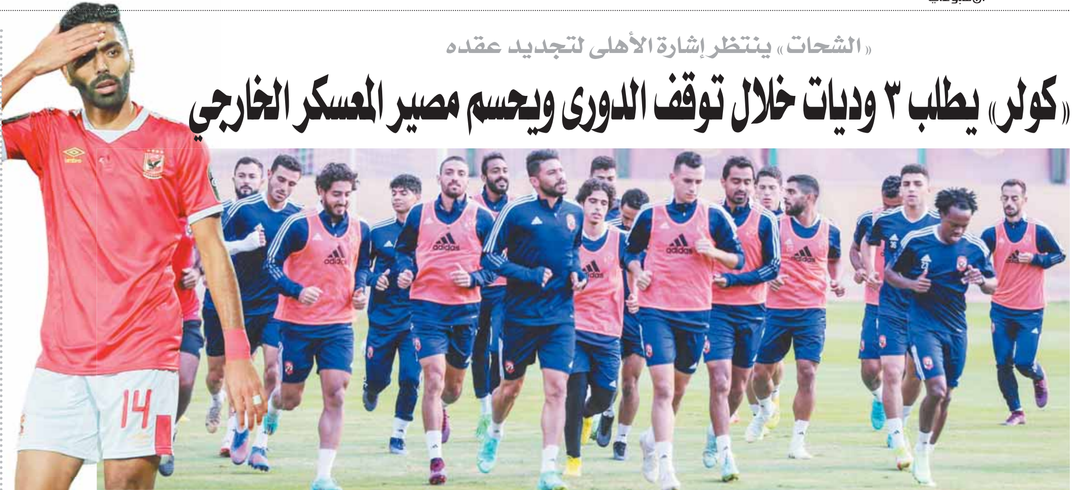
الأهلى يدرس خوض معسكر خارجي خلال توقف الدوري

كولر الذى طلب فى وقت سابق خوض ٣ مباريات ودية فى فترة توقف الدوري، وسيكون أول لقاء للأهلى أمام طلائع الجيش يوم ٢ ديسمبر المقبل فى الجولة الخامسة بعد تأجيل مباراة الاتحاد السكندري التى كانت يوم ٨ نوفمبر الجارى إلى يوم ١٢ ديسمبر المقبل. وعلى صعيد آخر، يترقب حسين الشحات جناح الفريق موقف إدارة القلعة الحمراء بشأن تجديد عقده الذى ينتهى بنهاية الموسم الحالي. الشحات تلقى اتصالات مؤخرًا من جانب الأندية للحصول على خدماته فى شهر يناير المقبل على سبيل الإعارة لحين نهاية عقده من بينها أحد الأندية السعودية تتردد أنه الأهلي السعودي. ويتنظر الشحات إشارة القلعة الحمراء لتجديد عقده مع الأهلي، خاصة أن اللاعب أبلغ المقربين إليه أنه يرغب فى الاعتزال داخل