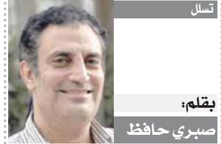
بقلم: صبري حافظ

كتب- محمد اللاهوتى: يتربص مسئولو النادي الأهلي القرار النهائى للمدير الفنى السويسرى مارسيل كولر، لتحديد خوض الفريق الأول لكرة القدم معسكر خارج مصر خلال فترة توقف الدوري من عدمه. ومن المنتظر أن يمنح كولر لابعيه راحة لمدة ٤ أيام بعد خوض مران استشفائى اليوم الخميس عقب مباراة الداخلية التى أقيمت أمس الأربعاء بالجولة الثالثة للدورى. ويدرس الأهلي طرح فكرة المعسكر الخارجى بعد أن تم تأجيلها مع بداية فترة الإعداد خاصة بعد تعذر استخراج تأشيرات السفر إلى هولندا التى كان مقرراً أن تستضيف المعسكر وقتها. وتلقى مسئولو الأهلي بالفعل بعض العروض لخوض معسكرات فى منطقة الخليج، تشمل بعض الوديات ولكن الإدارة الحمراء تترقب موقف