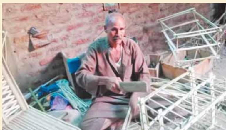
الجريد من شكل واحد إلى عدة أشكال متنوعة، موضحاً أن الأدوات المستخدمة لتقطيع الجريد، وأدوات بدائية وغير مكلفة، وهي تتكون من السكين، ومسامير التخريم، وقطع خشبية للثق، مع استخدام القدمين والأيدى أثناء عملية التصنيع والتي يتم الاعتماد عليها بشكل كبير.

وطالب الرجل الخمسيني، بإدراج صناعة الجريد ضمن مبادرة الدولة لتنمية المشروعات الصغيرة، الحرفية، ودخولها المبادرة الرئاسية «حياة كريمة»، خاصة أن قرى الصعيد ما زالت تستخدم الجريد حتى في سقف وتعريش المنازل وأحواش المواشى، وتفضل صناعة الجريد عن غيرها من الصناعات.