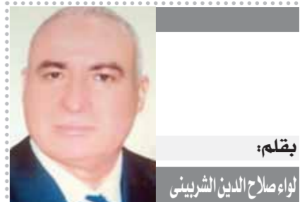
لقلم: لواء صلاح الدين الشربيني