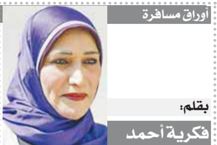
لقلم: فكرية أحمد