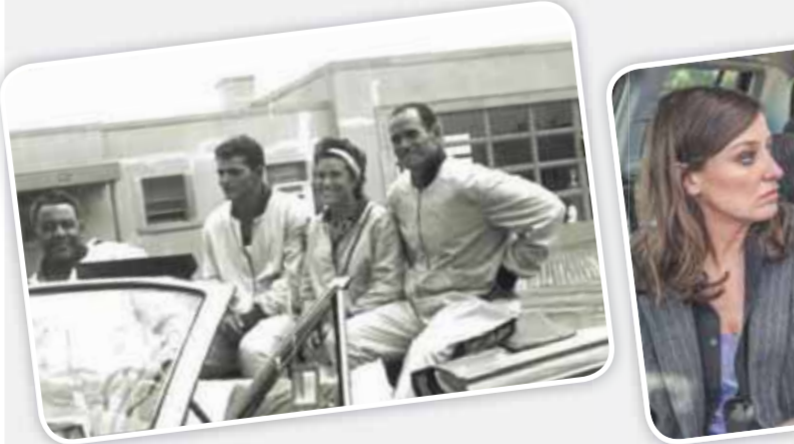
من نقطة الأصل