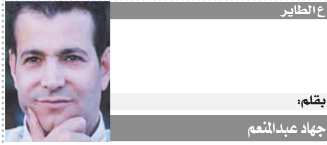
بـقلم: جهاد عبد المنعم

25 عاما منذ إنطلاقه لأول مرة عام 1996، وقد حظي Cairo ICT باهتمام ورعاية شخصية من الرئيس عبدالفتاح السيسي، الذي أسبغ رعايته على المعرض خلال آخر 7 دورات، وافتتح فعالياته بنفسه 6 مرات متتالية، وأطلق من خلاله عدة مبادرات محلية وإقليمية لدعم خطط واستراتيجيات التحول الرقمي في مصر ودول الشرق الأوسط وإفريقيا. ينطلق معرض القاهرة الدولي للتكنولوجيا Cairo ICT 2021، في دورته الخامسة والعشرين للمعرض في الفترة من 7 إلى 10 نوفمبر داخل مركز مصر للمعارض الدولية بالقاهرة الجديدة، تحت شعار The Digital Challenge. يتمتع المعرض بمكانة إقليمية ودولية مرموقة كونه مصدر الإلهام الأكبر للمهتمين بقطاع التكنولوجيا والاتصالات على مدار