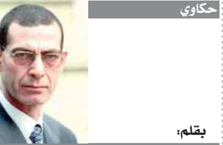
بقلم: د. وجدى زين الدين

كتب - ولاء وحيد: حدثت الإسماعيلية، والذي أسفر عن مقتل شخص وإصابة اثنين آخرين، وانتقل فريق من النيابة العامة لمعاينة مسرح الجريمة. وتجرى الأجهزة الأمنية تحقيقات موسعة فى واقعة إقدام أحد الأشخاص على قتل عامل ظهرًا بأحد شوارع الإسماعيلية للوقوف على ملابسات الحادث. وتباشر النيابة العامة التحقيقات فى الواقعة وطلب التحريات وانتداب الطب الشرعى لإعداد تقرير الصفة التشريعية لبيان أسباب الوفاة. وكشفت التحقيقات الأولية أن مرتكب الواقعة مهتر نفسياً بالإسماعيلية «سبب» حجزه بإحدى المصحات للمعالجة من الإدمان» قام بالتعدى بساطور على عامل مدامى إلى فصل رأسه.