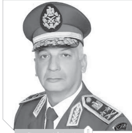
الفريق أول محمد زكي

مناقشة عدد من الملفات والموضوعات ذات الاهتمام المشترك في ضوء علاقات الشراكة والتعاون العسكري بين القوات المسلحة لكلا البلدين في العديد من المجالات. وتأتي زيارة الفريق أول محمد زكي القائد العام للقوات المسلحة وزير الدفاع والإنتاج الحربي إلى البرتغال تلبية للدعوة الموجهة من السيد جوا جوميز كرافينها وزير الدفاع البرتغالي لدعم علاقات التعاون العسكري بين البلدين.