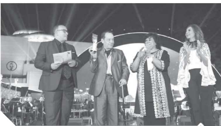
وزيرة الثقافة أثناء تكريم الموسيقار الكبير حلمي بكر