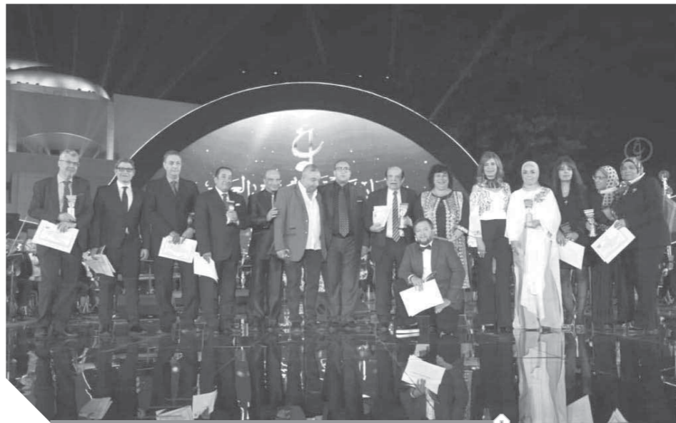
وزيرة الثقافة تتوسط المكرمين