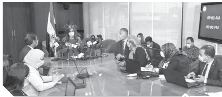
غرفة عمليات وزارة الهجرة تتابع انتخابات النواب

ترأسَت السفارة نبيلة مكرم وزيرة الدولة للهجرة وشؤون المصريين في الخارج، غرفة عمليات الوزارة لمتابعة مشاركة المصريين بالخارج في المرحلة الثانية للانتخابات مجلس النواب ٢٠٢٠، والتي انطلقت أمس، بطباعة وإرسال بطاقات الاقتراع وإرسالها لمقار البعثات الدبلوماسية منذ التاسعة صباحاً، حسب التوقيت المحلي لكل دولة. وقالت «مكرم» إن المشاركة في انتخابات مجلس النواب حق دستوري لكل مصري بالخارج وما لسانه من تحرك المصري بالخارج تجاه المشاركة في الانتخابات البرلمانية في مرحلتها الأولى يعكس حرص المصريين بالخارج على المشاركة في تشكيل السلطة التشريعية، على الرغم من الظروف التي يمر بها العالم في مواجهة فيروس كورونا. وأشارت وزيرة الهجرة إلى دور غرفة العمليات لمتابعة انتخابات مجلس النواب ٢٠٢٠، المتمثل في الرد على كافة استفسارات المصريين بالخارج المتعلقة بالعملية الانتخابية وإعلامهم بآليات المشاركة في الاستحقاقات