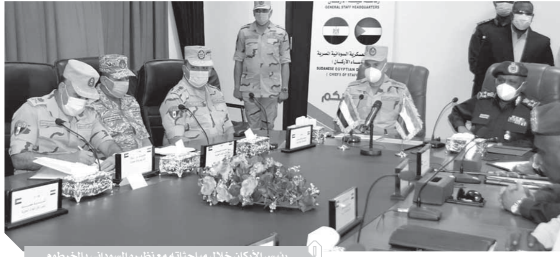
رئيس الأركان خلال مباحثاته مع نظيره السوداني بالخرطوم

عاد إلى أرض الوطن الفريق محمد فريد رئيس أركان حرب القوات المسلحة والوفد المرافق له بعد انتهاء زيارته لدولة السودان، ليبحث أوجه التعاون مع الجانب السوداني الشقيق، وقد أسفرت المباحثات عن إعداد إطار توافقي تناول سبل تعزيز التعاون العسكري والأمني بين مصر والسودان والعمل المشترك في مجالات التأهيل والتدريب وتبادل الخبرات وتأمين الحدود ومكافحة الإرهاب والتأمين الفني والصناعات العسكرية. وكان الفريق محمد فريد رئيس أركان حرب القوات المسلحة قد أجريت له مراسم استقبال رسمية بالعاصمة السودانية «الخرطوم»، والتقى وزير الدفاع السوداني ورئيس هيئة الأركان للقوات المسلحة السودانية وناقش الجانبان عدداً من الملفات ذات الاهتمام المشترك وسبل دعم علاقات التعاون العسكري والتدريب المشتركة ونقل وتبادل الخبرات العسكرية بين البلدين. وأكد وزير الدفاع السوداني عمق العلاقات التي تربط بين مصر والسودان وتطابق وجهات النظر تجاه التحديات الأمنية التي