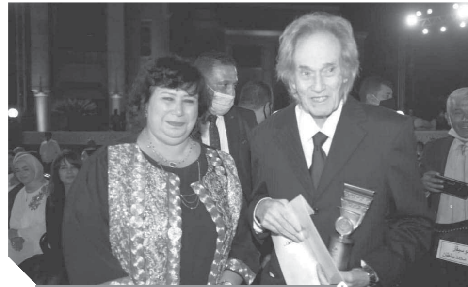
الدكتورة إناس عبد الدايم وزيرة الثقافة مع الموسيقار للحن محمد سلطان