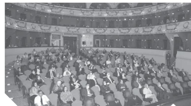
الحضور التزموا بالاجراءات الاحترازية