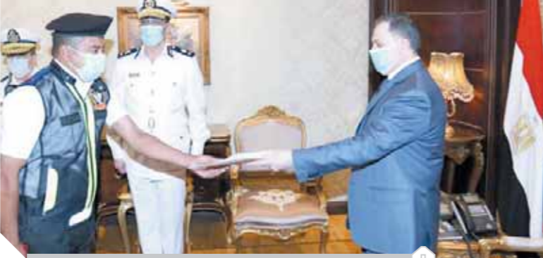
وزير الداخلية يستقبل أمين الشرطة بطل موقعة طفل المرور

الطفل و٤ من أصدقائه، بالتمتر على رجل مرور بمنطقة المعادى، تعود تفاصيل تلك الواقعة عقب انتشار مقطع فيديو على مواقع التواصل الاجتماعى منذ أيام لطفل يقود سيارة فى أحد شوارع منطقة المعادى، ويقامه سائراً على أمين شرطة من قوة المرور عندما طالبه بإظهار رخصة القيادة، ورصدت «وحدة الرصد والتجسس بإدارة البيان بكتب العام» تداولاً واسعاً لمقطع مصور لطفل يقود سيارة استوقفه فرد شرطة بالإدارة العامة للمرور لسؤاله عن تراخيص السيارة والقيادة، وقد أساء الطفل إليه وتعدى عليه.