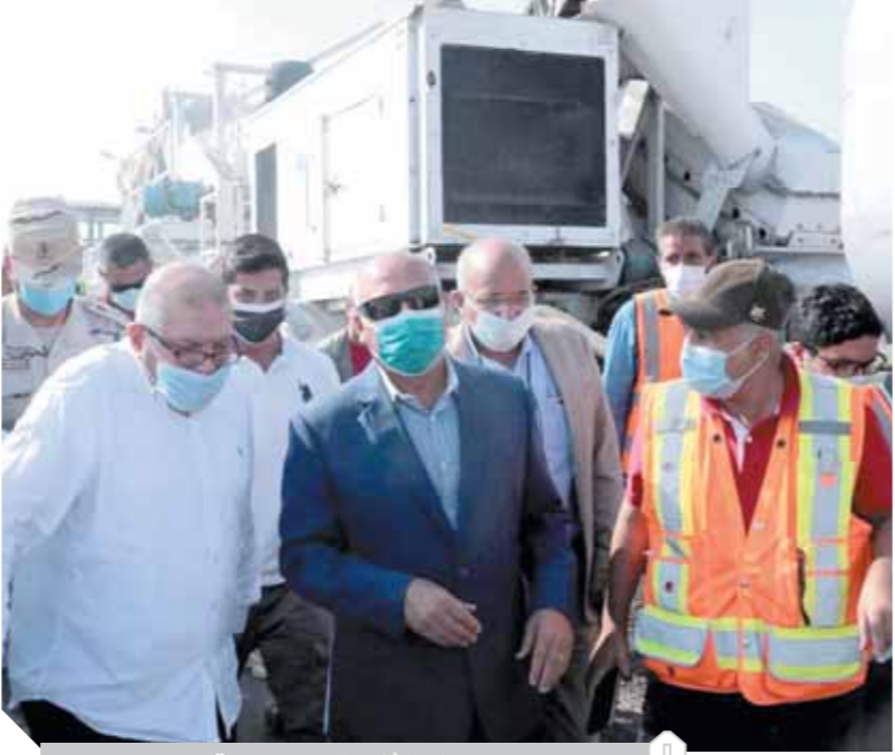
وزير النقل أثناء تفقده محور قوص

كتب - أحمد دراز وشيرين عجمي ومحمد عبد الصبور،