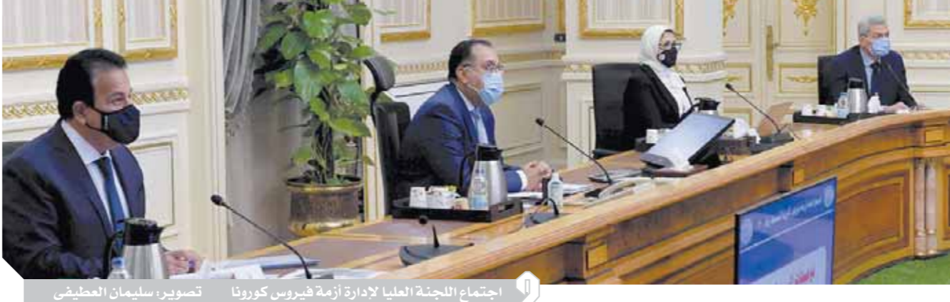
اجتماع اللجنة العليا لإدارة أزمة فيروس كورونا

«مدبولى»: إجراءات صعبة فى حالة عدم الالتزام بالإجراءات الاحترازية