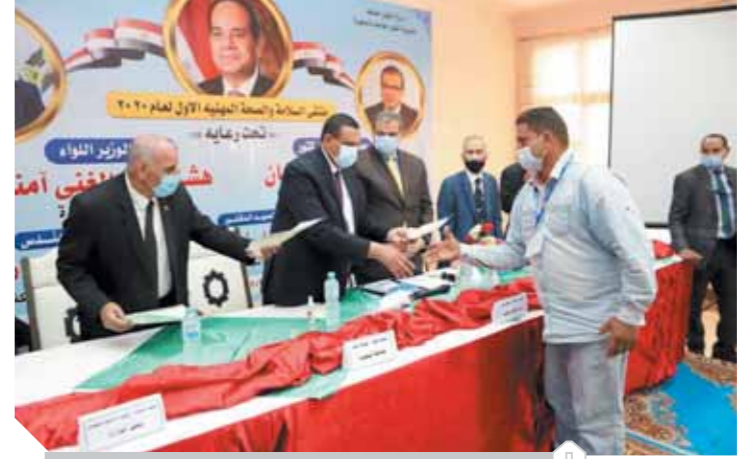
سعثان أثناء توزيع شهادات أمان على العمالة بالبحيرة

وجه الرئيس عبدالفتاح السيسي الحكومة بإنشاء ٥٠٠ ألف وحدة سكنية داخل المدن الكبرى وعواصم المحافظات لصالح البرنامج القومي «سكن لكل المصريين». وكان «السياسي» اجتمع مع رئيس مجلس الوزراء الدكتور مصطفى مدبولي ووزيرى التنمية المحلية والإسكان ومستشار الرئيس للتخطيط العمرانى ورئيس الهيئة الهندسية للقوات المسلحة. وصرح السفير بسام راضى المتحدث الرسمى لرئاسة الجمهورية بأن الرئيس تابع مخطط التطوير العمرانى للمحافظات وحصر الأراضى الفضاء على مستوى الجمهورية. ومن جهة أخرى تلقى «السياسي» اتصالاً هاتفياً عبر تقنية الفيديو كونفرانس من المستشار الألمانية أنجيلا ميركل، وتناول عدداً من الموضوعات ذات الصلة بالعلاقات الثنائية الاستراتيجية بين البلدين الصديقين،