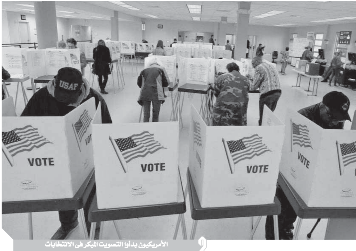
الأمريكيون بدأوا التصويت المبكر فى الانتخابات

فى المقابل، كشفت استطلاع آخر شمل ٥٠٠ من أصحاب الأعمال و١٠٠٠ مستثمر، أجرى من منتصف أكتوبر، أن ٥٥ بالمئة من أصحاب الأعمال أرادوا أن يفوز ترامب، بينما كان ٥١ بالمئة من المستثمرين يدعمون بايدن.