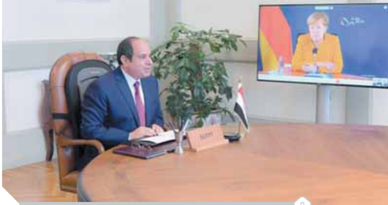
الرئيس السيسي خلال اتصال المستشار الألمانية

مشيدة بجهود «السياسي» الفعالة والموضوعية والحكيمة في حماية الحريات الدينية والتعايش السلمي بين الأديان والحضارات. وأكد «السياسي» أن القيم الدينية السامية لا علاقة لها بالتطرف والإرهاب، مشيراً إلى أهمية صياغة عمل جماعي على المستوى الإقليمي والدولي للتصدي لخطاب الكراهية والتطرف، وذلك باشتراك المؤسسات الدينية المختلفة مع جميع الأطراف بهدف نشر قيم السلام الإنساني وترسيخ أسس التسامح والتعايش السلمي بين الشعوب، وإحلال لغة الحوار المشترك والاحترام المتبادل والتصدي للتعبس والخلاف.