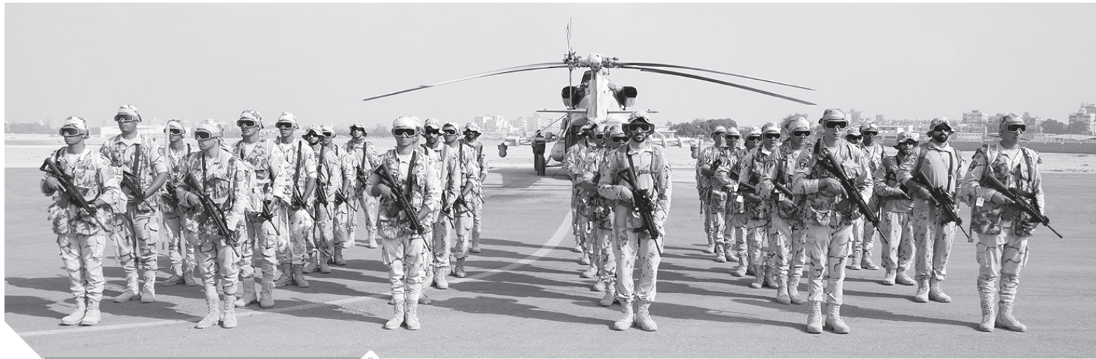
التدريبات المصرية الإماراتية ، صقور الليل