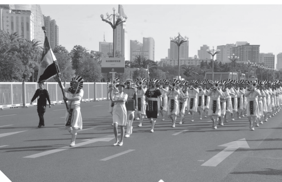
جانب من مشاركة الموسيقىات العسكرية فى الصين

كتب - محمد صلاح وأبو زيد كمال وسامية فاروق: