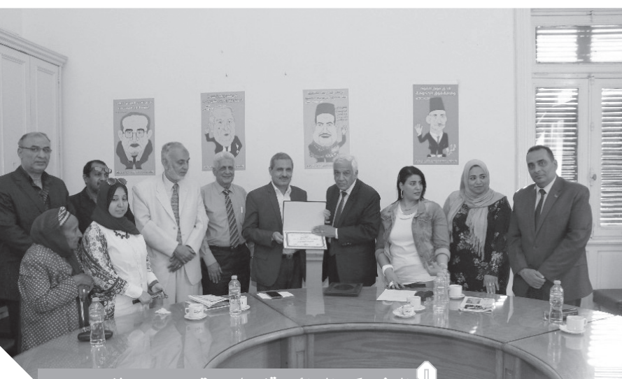
الوفد يكرم الروائى «قنديل»

وأشار إلى أن المستشار بهاء الدين أبوشقة رئيس الوفد، يهتم دور الثقافة فى نشر الوعى، لافتاً إلى أن رئيس الوفد قام بتكريم الدكتور يسرى عبدالجواد، رئيس اتحاد الكتاب العرب، فى مقر الحزب من قبل وذلك لدوره فى إحياء الثقافة المصرية.