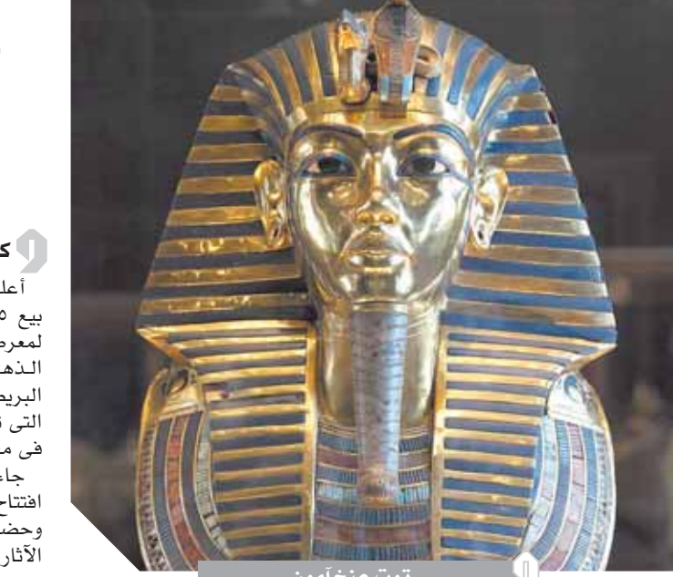
توت عنخ آمون

الحفيدة الثامنة للورد كارنرفون، ونجم الكرة لاعب وست بروميتش البيون الإنجليزي، ولم يتمكن اللاعبون المحترفون في بريطانيا محمد صلاح ومحمود تريزيجه واحمد المحمدي من الاحتفال لارتباطهم بالمشاركة في المباراة بين فريقى ليفربول وأستون فيلا صباح اليوم التالي لافتتاح المعرض. يضم المعرض ١٥٠ قطعة أثرية من مقتنيات الملك الشاب بينها عدد من تماثيل الأوشاشي المذهب والصناديق الخشبية والأواني الكانونية وتمثال الكا الخشبي المذهب.