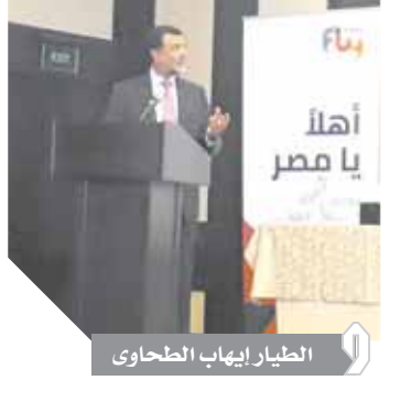
الطيار إيهاب الطحاوى

دشنت شركة «فلاي إيجيبت»، أولى خطوطها الداخلية، لتبدأ في حجز أول رحلاتها ليوم ٢٣ نوفمبر. وقال كاين إيهاب الطحاوى، الرئيس التنفيذي للشركة: إن الشركة بدأت بطائرتين في عام ٢٠١٥، ثم حدث تطور وتجاوز عدد الركاب ٩٠ ألف شخص في العام، وحاليا بلغ العدد مليون راكب في العام، يتجهون إلى ٧٦ وجهة أوروبية، و٨ داخلية، ٧٤ طائرات، و٢٠% من التشغيل منظم إلى الكويت والسعودية والأردن.