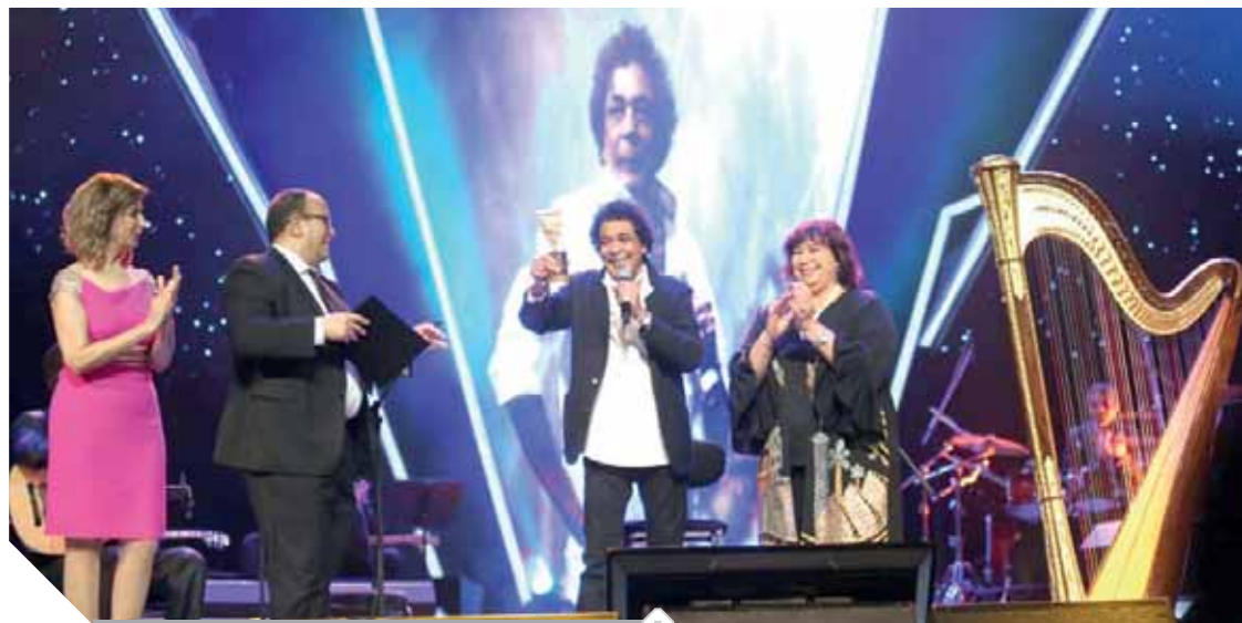
وزيرة الثقافة، ومدير، على مسرح الأوبرا