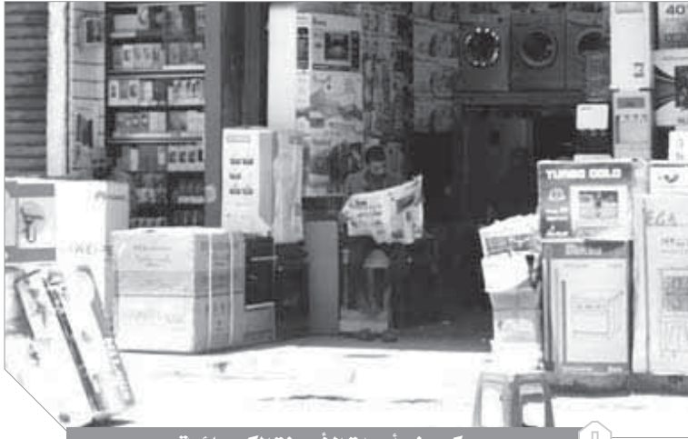
ركود في أسواق الأجهزة الكهربائية

وأشار الخبير الاقتصادي إلى أن تلك الأوضاع تغيرت كثيراً عن الأوقات السابقة، كما تم التخلص من فكرة وجود سعرين للدولار في مصر «الموازي والرسمي»، وتابع: الفترة التي تم العمل فيها بنظام الدولار الجمركي ربما كانت فترة انتقالية شهد فيها السوق تذبذباً واضحاً في سعر العملات، ومن ثم تم وضع نظام الدولار الجمركي لعدم تأثر الأسعار، لكن الوضع حالياً لا يستدعي وجود سعر للمحاسبة الجمركية وسعر للمحاسبة المصرفية.