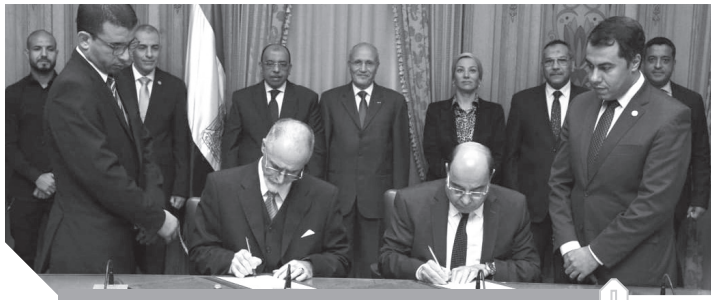
خلال توقيع مذكرة التفاهم مع الشركة السويسرية

ومن جانبه، أشار اللواء محمود شعراوى، وزير التنمية المحلية إلى المستوى المتميز لمصانع تدوير المخلفات التى يتم تصنيعها بشركات الإنتاج الحربى وأن لديها قدرات تصنيعية كبيرة وخبرات بشرية ذات كفاءة عالية يمكن أن يتم الاستفادة منها لتطوير منظومة تدوير المخلفات وإدخال خطوط جديدة وتصنيع معدات وآلات حديثة