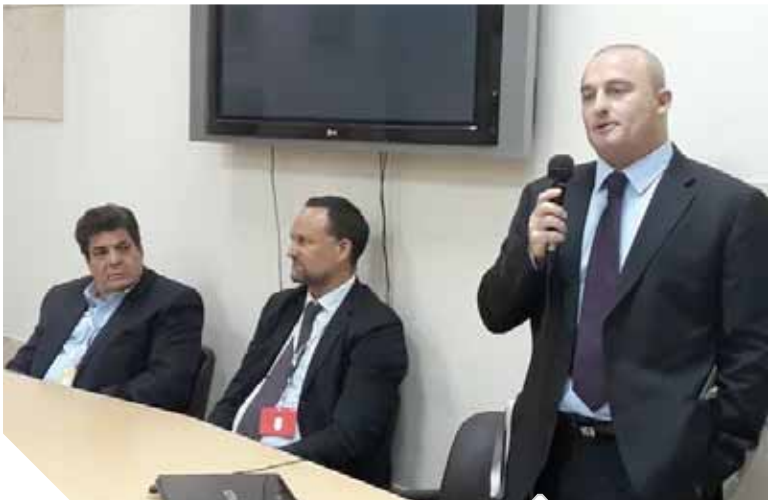
لجنة تسويق السياحة الثقافية خلال الاجتماع

إلى أن حالة الاستقرار والأمن والعلاقات الدبلوماسية بين مصر وإيطاليا، والجهد المبذول من جانب القيادة السياسية ممثلة في الرئيس عبدالفتاح السيسي تعد دافعا مزيماً للقطاع السياحي الحكومي والخاص لبذل مزيد من الجهود لتنمية الحركة الوافدة بهدف دعم الاقتصاد الوطني، وخلق المزيد من فرص العمل بالقطاع السياحي خاصة في صعيد مصر الذي يملك أكثر من ثلث آثار العالم، وهي ميزة تجعل منه مقصداً سياحياً بلا منازع حول العالم.