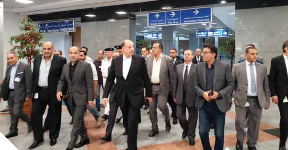
وزير الطيران يتفقد الاستعدادات النهائية لمطار شرم الشيخ قبل التشغيل التجريبي