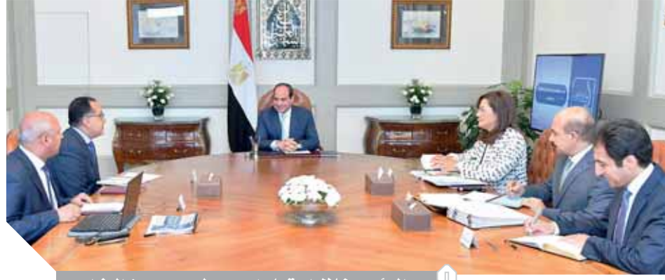
الرئيس خلال اجتماعه بمدبولي وعدد من الوزراء

كما وجه السيسي في هذا الإطار بسرعة الانتهاء من التعاقدات مع الشركات العالمية الموردة للقطارات والجرارات الجديدة لتحقيق التطور والارتقاء المنشود في الخدمات المقدمة لركاب هيئة السكك الحديدية، فضلاً عن سرعة الانتهاء من تنفيذ خط مونوريل العاصمة الإدارية الجديدة لربطها بكل من القاهرة الجديدة ومدينة ٦ أكتوبر ومختلف ضواحي القاهرة، بالإضافة إلى البدء في إجراءات تنفيذ خط القطار السريع المقرر أن يربط