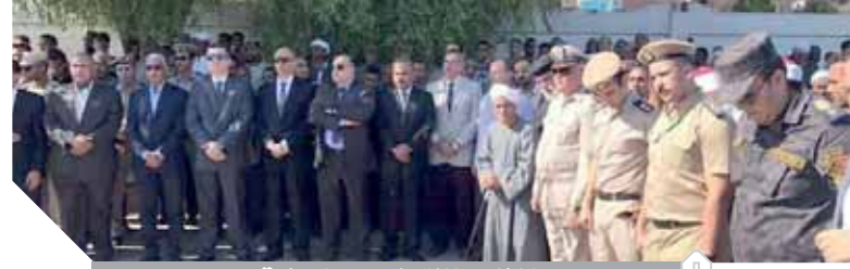
خلال جنازة رئيس مباحث قوص