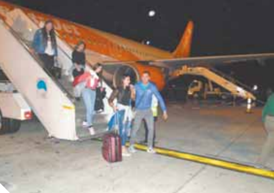
مطار مرسى علم يستقبل رحلة، إيزي جيت،