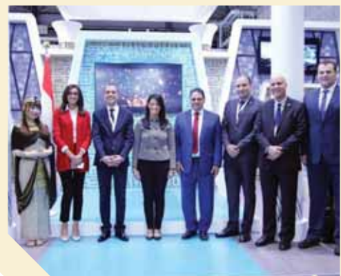
وزيرة السياحة خلال تقعد مصر للطيران باليابان

شاركت مصر للطيران بجناب متميز في فعاليات معرض «الجاتا» للسياحة والسفر Japan Expo Tourism 2019 الذى يقامته هيئة الازور يوم 27 أكتوبر، ويقام في دورته هذا العام في أوساكا ويعتبر هذا المعرض السياحي أحد أكبر المعارض السياحية على مستوى العالم والذي يتم تنظيمه بالتعاون مع منظمة السياحة العالمية، ويحضر عدد كبير من المعارضين من مختلف الدول ويمثل كبرى شركات الطيران العالمية، ومنظمى الرحلات والعديد من الخبراء في مجال السياحة والسفر. حضر الافتتاح الدكتور رانيا المشاط وزيرة السياحة والمهندس أحمد يوسف رئيس هيئة تشييد السياحة ونائب السفير المصرى الياباني وقاموا بجولة تفقدية تضمنت زيارة الجناح المصرى، وقد أشادوا بالريادة الذى تقوم به مصر للطيران ومجهوداتها المموسة في دعم السياحة المصرية وتعزيز تواجدها ليس فقط في السوق اليابانى بل في العديد من الأسواق الهامة على المستوى العالم.