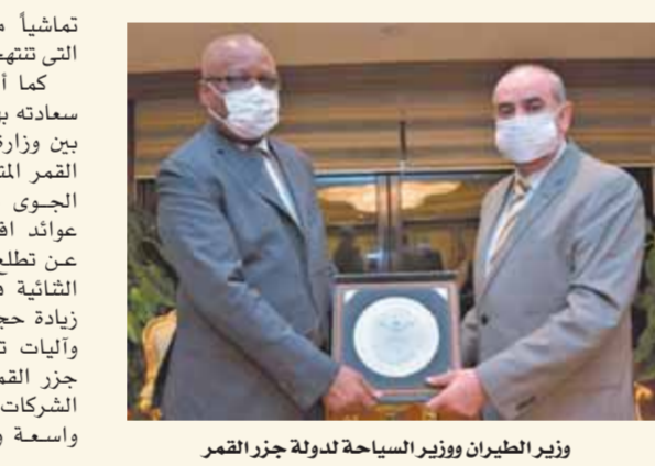
وزير الطيران ووزير السياحة دولة جزر القمر

العربية والأفريقية والعالمية. والاستفادة من الخبرات المصرية المتميزة لدعم الخطط التنموية للحكومة القمرية.. كما أشى الوزير بالإجراءات الاحترازية والوقائية المطبقة في مطارات جمهورية مصر العربية. ومن جانبه أعرب سفير دولة القمر المتحد عن تقديره للعلاقات المثمرة بين البلدين في صناعة النقل الجوي، مشيداً بالتطوير الذي حققه قطاع الطيران المدني خلال الفترة الحالية، مؤكداً تطلع بلاده إلى مزيد من التعاون حيث إن هناك علاقات متقدمة من مصر منذ عقود عديدة في العديد من المجالات فضلاً عن مواصلة التنسيق والتشاور المستمر بين البلدين.