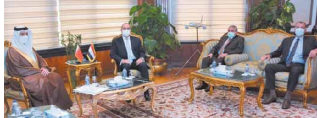
قيادات وزارة الطيران خلال مباحثاتهم مع وفود السفارتين البريطانية والبحرينية

وجميع شركاتها التابعة تسعى بشكل دائم ومستمر إلى تعزيز العمل المشترك مع الدول العربية من أجل تطوير صناعة النقل الجوي من خلال تحديث البنية التحتية المشتركة وفتح آفاق جديدة لهذا التعاون المثمر بما يرمي إلى تحقيق التكامل وتحقيق الأهداف التنموية ومن جانبه أكد سفير البحرين على أهمية الدور التسيقي الفعال الذي تقوم به وزارة الطيران في تبادل المعرفة والرؤى بين الأشقاء العرب بما يسهم في زيادة الحركة الجوية وخلق فرص استثمارية واعدة تزيد من حجم الحركة الجوية والسياحية بين الدول العربية متطلعا إلى مشاركة وزارة الطيران المدني وشركائها التابعة بمعرض البحرين الدولي المقام في مملكة البحرين العام القادم.