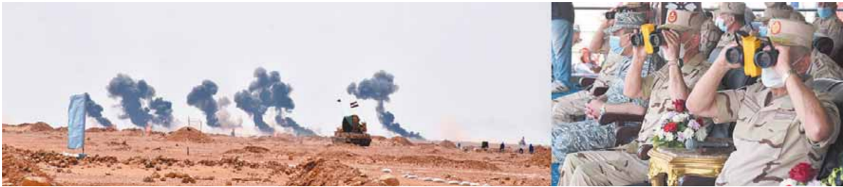
وزير الدفاع يشهد ختام المناورة «رعد - ٢٢».

المشاركة من استعداد قتالي عال، فضلاً عن المهارة في استخدام أحدث وسائل التعاون والسيطرة الفنية والاربابية لتنفيذ المهام المخططة والطارئة أثناء مراحل المعركة، كذلك القدرة على استخدام أحدث نظم التحكم والتوجيه لمختلف الأسلحة والعتاد والسرعة في اكتشاف وتحديد الأهداف الميدانية والتعامل معها، وناقش رئيس أركان حرب القوات المسلحة عدداً من القادة والضباط في أسلوب تنفيذهم للمهام والواجبات المكلفين بها، وفرض عدد من المواقف التكتيكية المفاجئة للتأكد من قدراتهم على اتخاذ القرار السليم لمواجهة التغيرات المختلفة أثناء إدارة العمليات، يأتي ذلك في إطار حرص القيادة العامة للقوات المسلحة للحفاظ علىجاهزية القتالية للأفراد والعتاد بما يسهم في تنفيذ كافة المهام التي توكل للقوات المسلحة من أجل الحفاظ على الوطن وصون مقدراته.