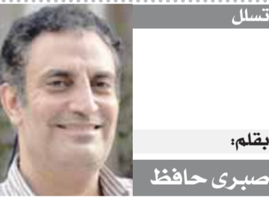
بقلم: صبرى حافظ