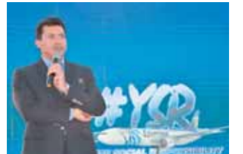
وزير الشباب خلال مشاركته في المؤتمر

كتب- عبد الخالق خليفة: قامت مصر للطيران بدور الناقل الرسمي لمؤتمر المسؤولية المجتمعية للشباب (youth responsibility social) لعام ٢٠٢١، في دورته الثانية والذي أقيم تحت رعاية وزارات «الشباب والرياضة، الاتصالات وتكنولوجيا المعلومات، الهجرة، الأهرامات بمنطقة الصوت والضوء».. وشارك في المؤتمر أكثر من ٢٠٠٠ شاب وأكثر