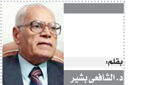
بقلم: د. الشافعى بشير