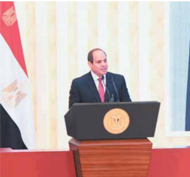
«السيسى» خلال الاحتفال بعيد القضاء