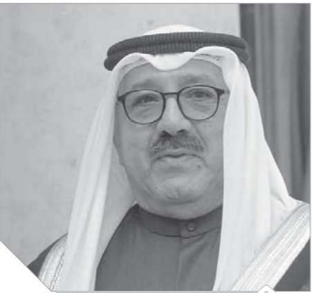
الشيخ ناصر الصباح