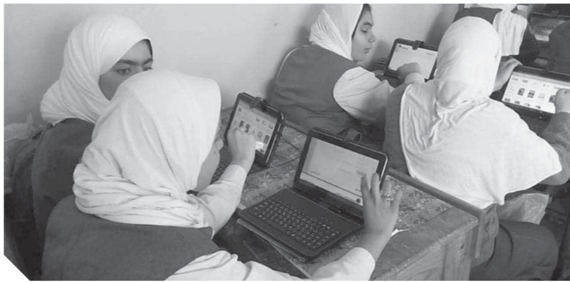
كتب - ناصر فياض:

للشهادتين الإعدادية والثانوية خلال العام الدراسي الجديد. موضحة أن عملية أداء الامتحانات تتم بشكل مجاني دون فرض أي رسوم على الطلاب بكافة المراحل التعليمية، سواء كان الامتحان ورقياً أو إلكترونياً، وذلك حرصاً من الدولة على إتاحة فرص التعليم المجاني لكافة الطلاب باعتباره حقاً يكفله لهم الدستور والقانون. كما شدد على استمرار الإعفاءات المقررة على طلاب الفئات المستثناة من الرسوم المدرسية، موضحة التزام كافة المدارس بالقرار الوزاري رقم ٤٥ لسنة ٢٠٢٠، بشأن ضوابط الإعفاءات المقررة للطلاب. ونفى المركز الإعلامي ووزارة التربية والتعليم والتعليم الفني، ما يتردد عن إجبار أولياء الأمور على دفع تبرعات لصالح صندوق «تحيا مصر» أو أي جهة أخرى، وأنه لم يتم إصدار أي قرارات أو توجيهات للمدارس بهذا الشأن، موضحة التزام المدارس بالتعليمات الصادرة عن الوزارة بمنع وحظر قبول أي تبرعات سواء كانت عينية أو مالية من أولياء الأمور أو الطلاب نهائياً، مع اتخاذ كافة الإجراءات القانونية حيال المدارس المخالفة لتلك الضوابط والتعليمات.