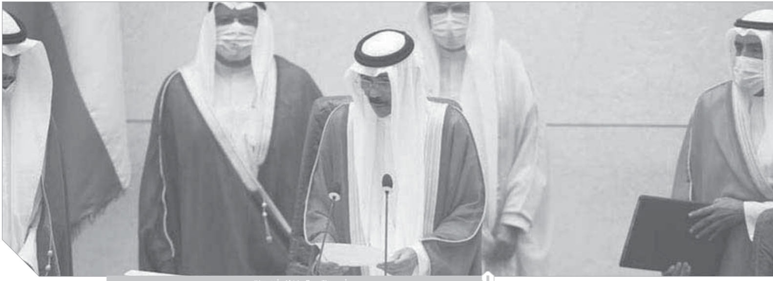
أمير الكويت خلال أداء القسم

تدور التساؤلات حول هوية ولي العهد الجديد، منذ أداء الشيخ نواف الأحمد الصباح (٨٣ عاماً)، اليمين الدستورية أمام مجلس الأمة، ليصبح بذلك أميراً للكويت.