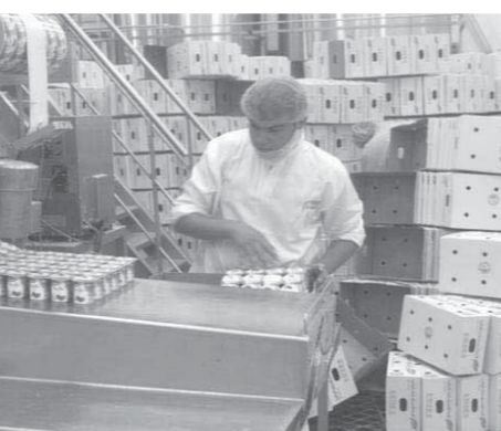
٣,٥ مليار دولار تحققتها مصر من صادرات الصناعات الغذائية لعام ٢٠١٩