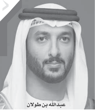
عبدالله بن طولان

المحاور الرئيسية الثلاثة للتقرير، ويبدو أكد وزير الاقتصاد عبدالله بن طوق المري، أن تحقيق دولة الإمارات للمركز الأول عالمياً في مؤشر الشراكة بين القطاع الحكومي والخاص، يعتبر تأكيداً على يقين حكومة دولة الإمارات الراسخ بأهمية الشراكة بين القطاعين الحكومي والخاص، والمبنى على توجيهات القيادة الرشيدة بتعزيز دور القطاع الخاص كونه أحد الأركان الهامة في اقتصاد الدولة، والعمل على اعتماد سياسات حكومية منفتحة تعزز من الأداء الاقتصادي للقطاع الخاص.