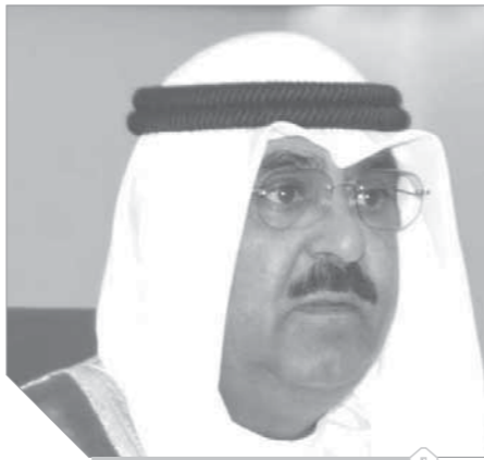
مشعل الاحمد الصباح

ناصر المحمد (٧٩ عاماً) هو الابن الثاني للشيخ محمد الأحمد الجابر الصباح، وابن أخ الأمير الحالي. كذلك يطمح الشيخ أحمد الفهد الصباح، الرجل صاحب النفوذ الكبير رياضياً، إلى الوصول للسلطة في الكويت. تقلد الفهد (٥٧ عاماً) مناصب سياسية ورياضية عديدة داخل البلاد منها نائب رئيس مجلس الوزراء للشؤون الاقتصادية، ووزير الدولة لشؤون الإسكان ووزير الدولة لشؤون التنمية، ووزير الإعلام، ووزير الطاقة، ورئيس اتحاد كرة القدم، ورئيس اللجنة الأولمبية الدولية، فيما يتبوأ حالياً منصب رئيس المجلس الأعلى الآسيوي ورئيس اتحاد اللجان الأولمبية الوطنية «أونوك». ابتعد الفهد عن الكويت في السنوات الماضية بسبب خلافات مع الأمير الراحل، وتظل المخاربات متاحة أمام أمير الكويت الجديد، الذي لم يحسم بعد أمر خلافته.