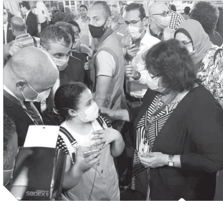
وزيرة الثقافة خلال افتتاح معرض الكتاب بالإسكندرية