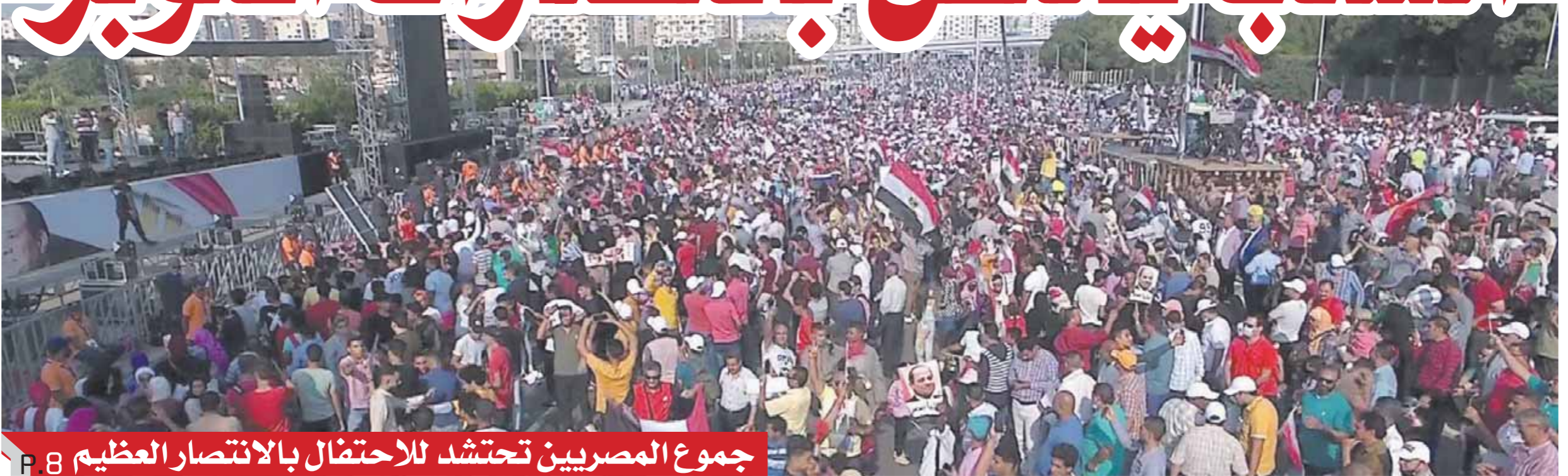
جموع المصريين تحتشد للاحتفال بالانتصار العظيم P.8