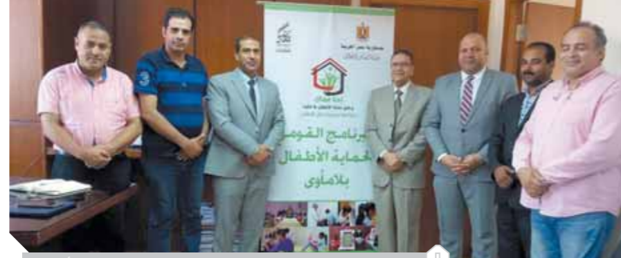
وقد منظمة الشكاوى الحكومية خلال زيارته مركز رعاية الأطفال