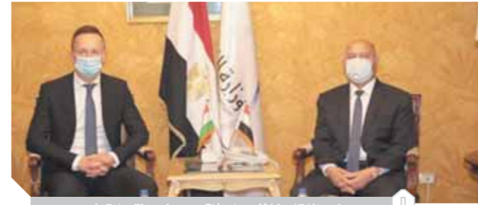
وزير النقل خلال مباحثاته مع وزير التجارة المجرى

التعاون المثمر بين مصر والمجر وروسيا، على صفقة تصنيع وتوريد ١٣٠٠ عربة سكة حديد جديدة للركاب، التي تعد الصفقة الأكبر والأضخم في تاريخ عقد حديد مصر، وفي تاريخ التعاون المصرى الروسى المجرى، والموقعة بين هيئة السكك الحديدية المصرية وشركة ترانسماش الروسية، الممثل للحائلف الروسى المجرى، بقيمة مليار و١٦ مليوناً و٥٠ ألف يورو التي يعولها بنك إكزيم المجرى. وأكد وزير الخارجية والنقل النهوى أهمية العلاقات المجرية المصرية، وبالتعاون المشترك فى عدد من المجالات، خصوصاً مجالات النقل، مشيداً بنمو الاقتصاد المصرى وبالتطور الكبير فى البنية التحتية بها، وبما يتم تنفيذ من