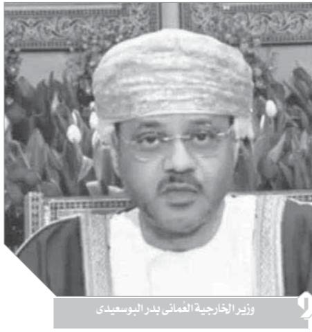
وزير الخارجية العُماني بدر البوسعيدى

كما استعرض وزير الخارجية العُماني خلال كلمته، أن السلطنة اتخذت هذا العام خطوات مهمة نحو إعادة هيكلة الجهاز الإداري للدولة وتحديثه دعماً لمتطلبات المرحلة على طريق مسيرة التنمية الاقتصادية، وفي إطار