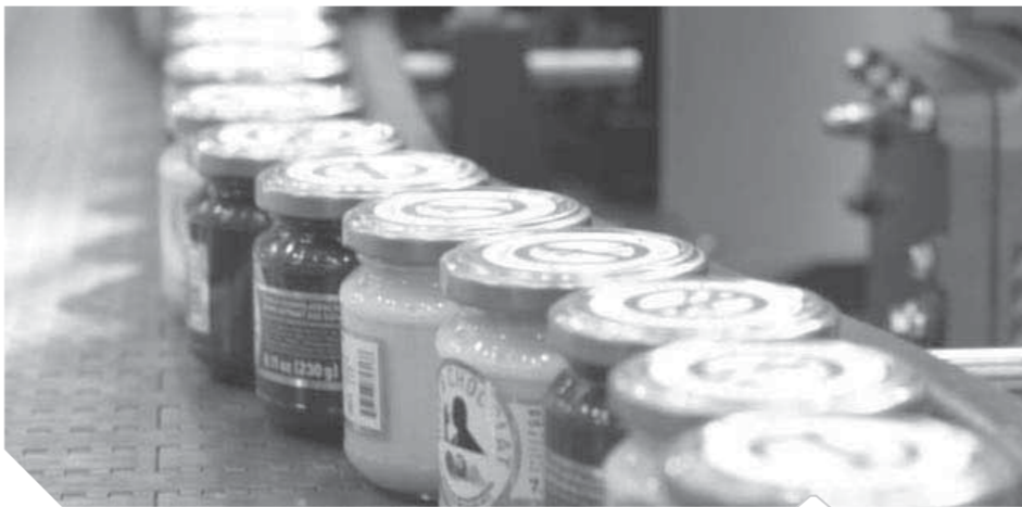
الصناعات الغذائية المصرية

وأشار عضو لجنة الزراعة إلى أن الدولة تدعم ويشكل قوى تطوير الصناعات الغذائية عبر دعم الاستثمارات وتيسير القروض للشركات الصغيرة والناتشة بتلك المجال في ظل تحقيقها أرباحاً وعائدات كبيرة، والمحصول البدائي يتعرض للفقد والتلف ولكن عندما يتحول إلى صناعة يساهم في تشغيل عمالة وتسرّع ثمنه وستحقق أرباح من تلك الصناعة مثل صناعة العصائر والمشروبات من الفواكه فهي من أكثر القطاعات انتشاراً وتحقيقه للأرباح في الصناعات الغذائية. كما أن تحسين استراتيجيات التطوير لتلك الصناعات سيساهم بشكل كبير في خلق فرص عمل للشباب وتوفير عملة صعبة للبلاد.