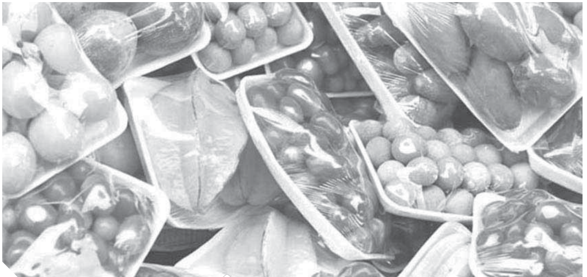
الصناعات الغذائية كثر استراتيجي للصناعة المصرية