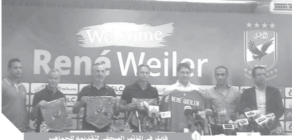
فايلر في المؤتمر الصحفي لتقديمه للجماهير