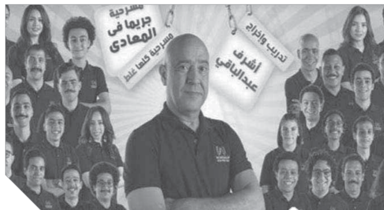
العرض المسرحي جريمة في المعادي