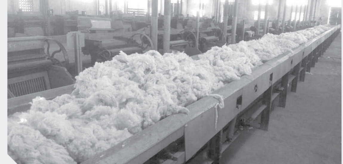
بدء إجراءات منظومة قطاع الغزل والنسيج

ومع بعض التفاؤل قد تحسن الأمر مع بدء التطبيق في بنى سويف وفقاً لخطة الوزارة بالبدء بالقيام تليها بنى سويف، والأمر يحتاج إلى الانتظار لمعرفة مدى ما سوف تحققة التجربة من نجاح من عدمه إلا أنه قد يؤثر سلباً على تجربة تطوير قطاع الغزل والنسيج. ثاني المجالات التي اقتحتها الوزارة هو فكرة برنامج جسور لإقامة جسر تجاري بين مصر وأفريقيا من العين السخنة إلى ميناء مومباسا وعبر مؤتمر موسع مع الشركاء من المصدرين والمستوردين. وكان من المقرر أن يتم اختيار شركة عالمية تدير المنظومة، غير أن الأنباء الواردة حتى الآن لا تبشر بإنجاز تم في هذا الاتجاه بل على العكس بدأت أصوات تنطلق تؤكد احتمالية تعثر التجربة، نظراً لظروف عدة منها ارتفاع تكلفة الشحن والرسوم التي تفرض في الموانئ المصرية وعدم وجود أسطول نقل مصري جيد حتى الآن. التجربة الأخيرة هي الاستعانة بالقطاع الخاص في إدارة الشركات التابعة لقطاع الأعمال العام، وكان المقروض البدء بشركة مصر الجديدة للإسكان والتعمير وأيضاً حتى الآن لم تظهر بوادر شركات مقترحة للإدارة، ما يشير إلى تعطل الفكرة إلى الآن وقد يمتد الأمر لبعض الوقت.