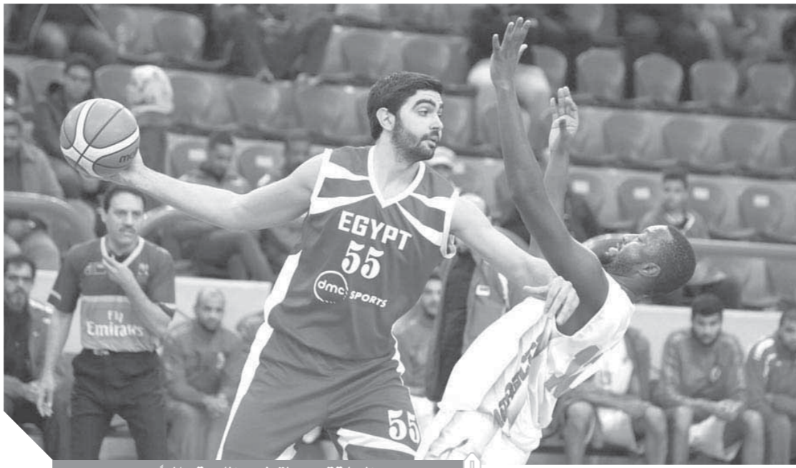
السلة تسعى لتطوير اللعبة عالميا

العام القادم. وقال «عبدالمطلب»: تواجدنا في فعاليات كأس العالم، لحضور الجمعية العمومية لانتخاب هامان نيانج رئيسا للاتحاد الدولي، وحضور ورش العمل الخاصة بتطوير الاتحادات وبطولات الأندية على الصعيدين القاري والعالمي وخصوصا أن أفريقيا تشهد انطلاق بطولة دوري الأبطال برعاية دوري المحترفين الأمريكي، وكذلك حضور حفل افتتاح كأس العالم والمباراة الافتتاحية، لما يمثله تواجد ممثلين لمصر من أهمية في هذه البطولات.