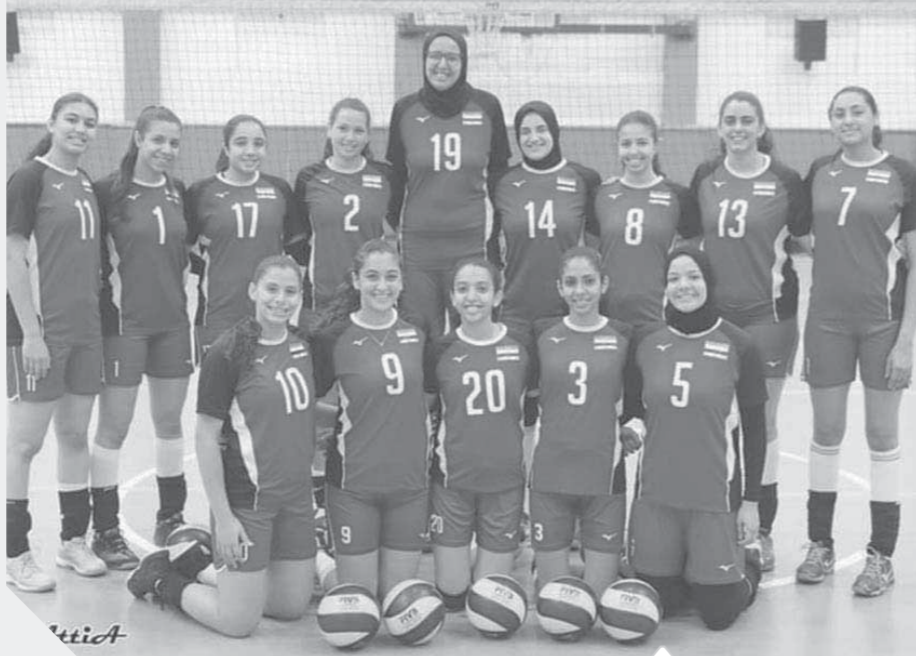
ناشئات الطائرة يسنن للفوز بالبطولة

وأشار إلى أن منتخبات المجموعة الأولى والثانية وعلى رأسهم مصر بدأوا في التواجد على الإسماعيلية وتم تخصص أماكن لهم بالفنادق المظلة على بحيرة التمساح واتاحة الفرصة أمامهم للتدريب على صالات نادي القناة المغطاة، وأوضح أنه يتوقع حضور جماهيري كبير لفعاليات البطولة، خاصة مباريات مصر أمام بورتوريكو والكاميرون والصين والبرازيل أيام ٥ و٦ و٧ و٩ سبتمبر المقبل. وتضم المجموعة الأولى منتخبات مصر والبرازيل والصين والكاميرون وبورتوريكو.. فيما تضم المجموعة الثانية منتخبات إيطاليا وكوريا الجنوبية وأمريكا وكندا والمكسيك، والمجموعة الثالثة منتخبات روسيا وبيلاروسيا والارجنتين وتاييلاند ورومانيا، والرابعة منتخبات تركيا واليابان وبيرو وبلغاريا والكونغو الديمقراطية.