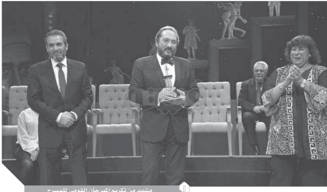
مشهد من تكريم المهرجان القومي للمسرح