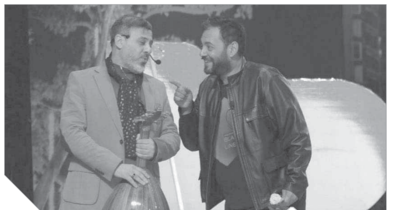
مشهد من عرض سيرة الحب