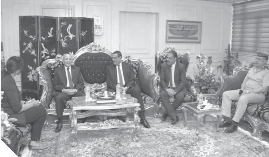
العصار وقيادات محافظة البحيرة خلال مشاورات إنشاء المستشفى وكلية الطب

وفى ختام اللقاء قام محافظ البحيرة بإهداء درج المحافظة لوزير الإنتاج الحربى تقديراً لجهوده فى دعم المشروعات التى تنفذها الوزارة على أرض المحافظة.