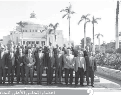
أعضاء المجلس الأعلى للجامعات