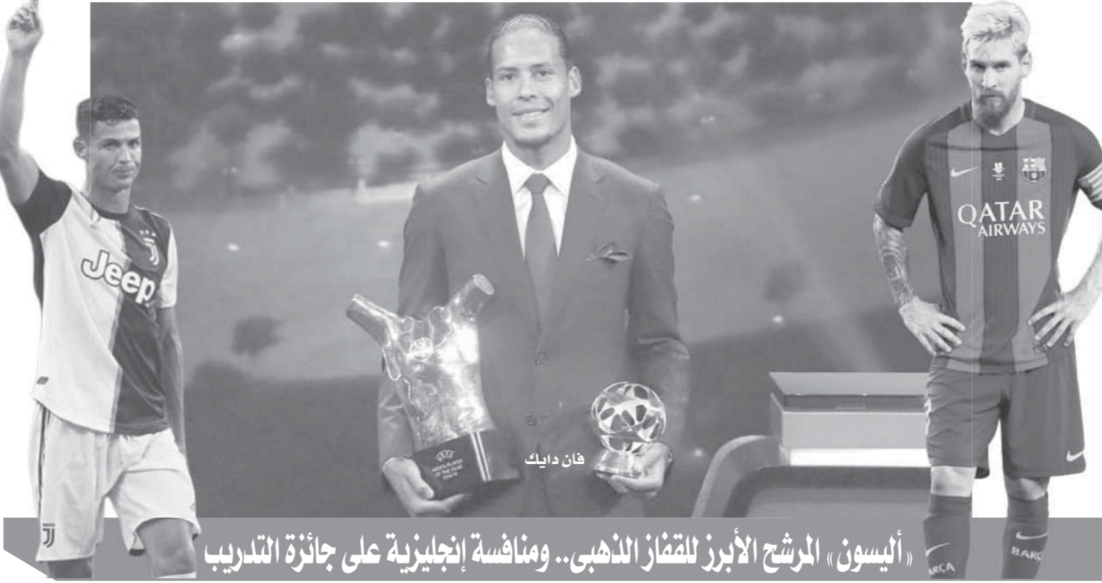
«اليسون» المرشح الأبرز للقميص الذهبي.. ومنافسة إنجليزية على جائزة التدريب

وفرض فان دايك نفسه بكل قوة مساهما في مشوار تاريخي للريز في المنافسة على لقب الدوري الإنجليزي بصمد ٩٧ نقطة، إلا أن مانشستر سيتي انتصر في النهاية بفارق نقطة وحيدة، عوض «فيرجيل» الإخفاق المحلي بإنجازات قارية، حيث تأهل مع منتخب بلاده لنهائي نسخة الأولى لدوري أمم أوروبا،