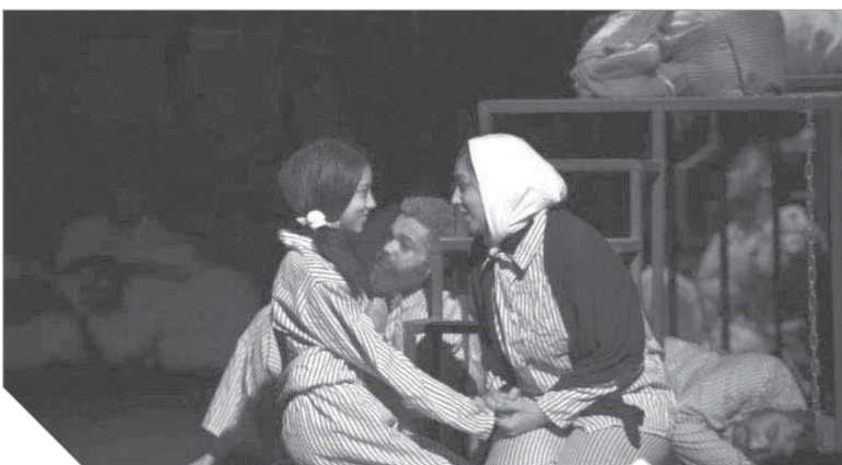
مشهد من العرض سونيبور