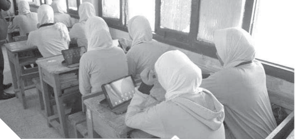
استمرار امتحانات الثانوية الجديدة بالتابلت