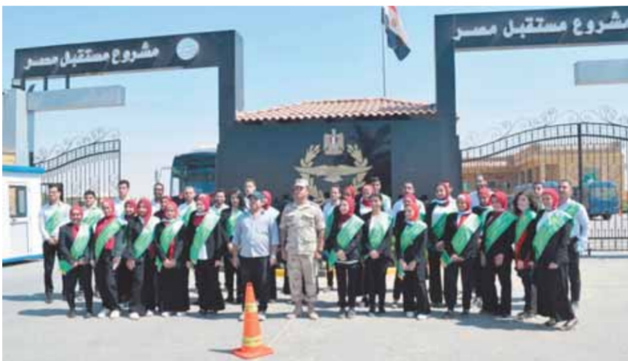
وفد طلاب جامعة القاهرة خلال الزيارة