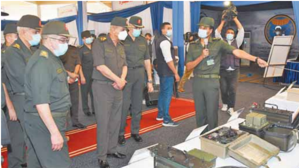
وزير الدفاع خلال الجولة

المعنوية والقتالية العالية لرجال إدارة الأسلحة والذخيرة وإصرارهم على الوفاء بالمهام المقدسة المكلفين بها، مؤكداً أن القوات المسلحة ماضية بكل قوة نحو تطوير قدراتها