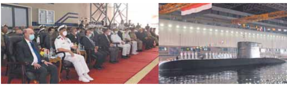
قائد القوات البحرية يتابع وصول الغواصة الألمانية

وكلية الدفاع الجوى طلبة جامعة الإسكندرية، وأعداد غفيرة من مواطنى محافظة الإسكندرية. وشهدت سواحل مدينة الإسكندرية قيام القوات البحرية بعرض بحرى ضم أكثر من خمسين وحدة بحرية مختلفة من غواصات وحاملات وفرقاطات ولشبات متعددة الحمولات والمهام شاهدة أعداد غفيرة من المواطنين وذلك احتفالاً بوصول الغواصة (S-٤٤).