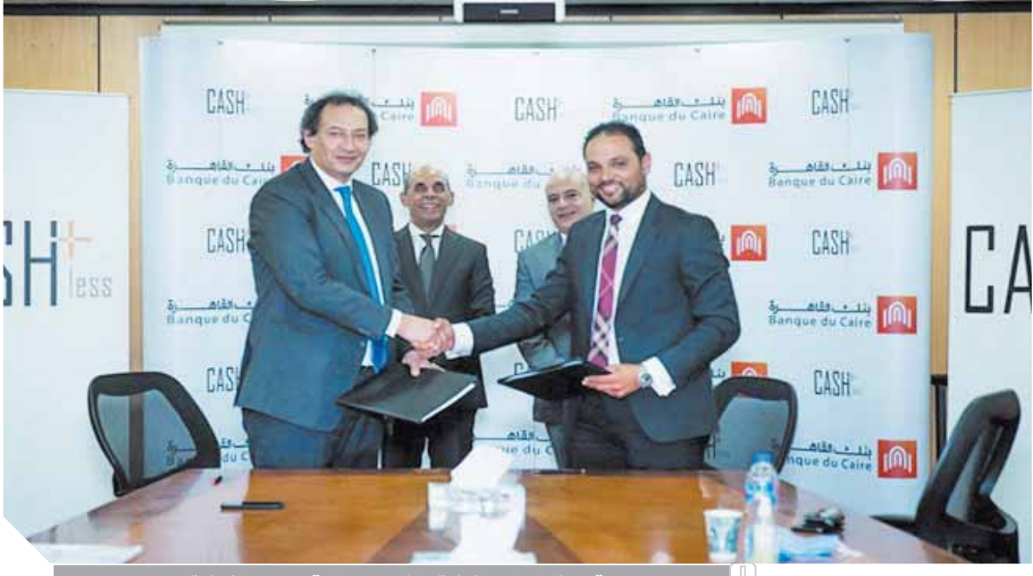
قيادات البنك والشركة خلال مراسم توقيع عقد الشراكة