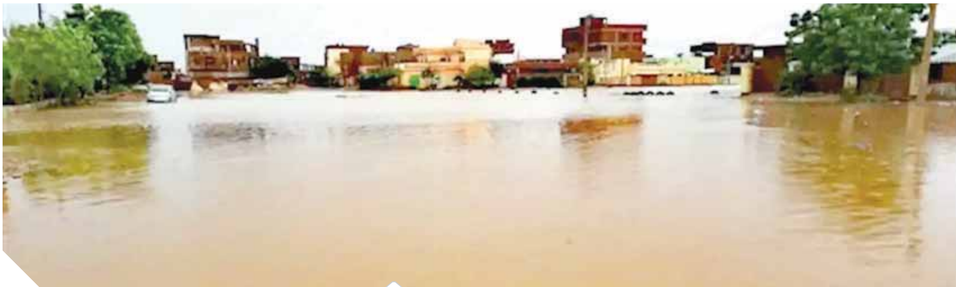
انهيار سد «بوط» في السودان تسبب في تدمير مئات المنازل