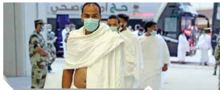
الحجاج يغادرون بعد أداء طواف الوداع

كتبت. تهانى شعبان: أكد وزير خارجية الكويت الشيخ د. أحمد ناصر الحمد الصباح، أن قرار وقف رحلات الطيران من مصر سيكون محل مراجعة خلال الفترة القادمة. واتفق الوزيران على أن يتواصل وزير الصحة فى البلدين لتحديد الإجراءات الكفيلة بعودة الأمور إلى طبيعتها تسهيلاً لعملية التنقل والتواصل بين البلدين الشقيقتين.