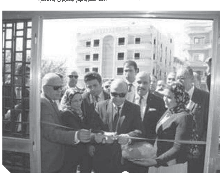
وزير العدل في أحد الافتتاحات

تفعيل دور لجان الإشراف على مصحات علاج الإدمان والتعاطي وإنشاء مكاتب المساعدة القانونية للأشخاص ذوي الإعاقة