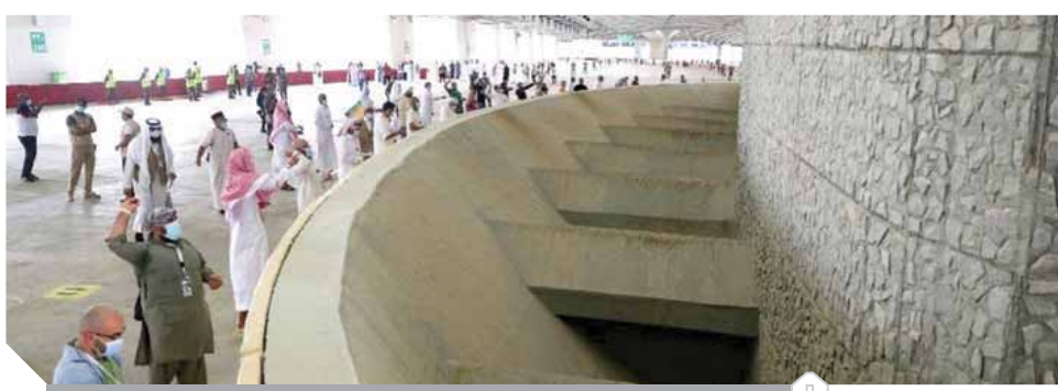
الحجاج خلال رمى الجمرات

دون عقبات أو صعوبة وهى أمان تام فى ظل توفير كافة الخدمات الطبية ووسائل التعميم اللازمة لضيوف الرحمن واتخاذ كافة الإجراءات الاحترازية اللازمة رغم الظروف الاستثنائية وانتشار جائحة كورونا. وأكد مفتى الجمهورية أن نجاح موسم الحج جاء بفضل التنظيم التاجح للحج والخدمات والمجهودات الكبيرة التي تقدمها المملكة للحجيج رغم ما يعانيه العالم من انتشار جائحة كورونا.