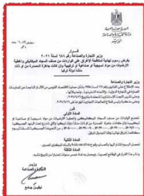
قرار وزارة التجارة والصناعة رقم ٢٨٤

وهو الأمر الذي أزعج كثيراً الشركات الأجنبية المنافسة لها. الإغراق التركي بعد أن توأت مجموعة النساجون المركز الأول على مستوى العالم في الإنتاج والتصدير وبعد أن وصلت صادراتها لأكثر من ١٢٠ دولة حول العالم، ويكفي أن تشاهد الإقبال الهائل من المتعاملين الأجانب في قطاع السجاد، سواء تجار أو مستوردون أم وكلاء على جناحها الضخم في أكبر معرض للسجاد في العالم وهو معرض «دومتيكس» والذي يقام سنويا بمدينة هانوفر الألمانية لتترك المكانة العالمية الرفيعة التي وصلت إليها صناعة السجاد المصرية الضخمة التي يفخر بها كل مصري بفضل مجموعة النساجون الشرقيون.. وصولها إلى المركز الأول عالمياً في الإنتاج والتصدير لم يرض كثيرين من منافسها والذي بدأوا في الاستعانة ببعض الموزعين المحليين من خلال منحهم حوافز وتسهيلات في الأسعار والكميات لإغراق السوق المحلي في مصر وإحداث تأثيرات سلبية على مبيعات النساجون الشرقيين الآخذة في النمو بعددلات سوقية غير مسبوقة، استغلت الشركات التركية اتفاقية التجارة الحرة الموقعة بين البلدين وقاموا بإغراق السوق المحلي بمنتجات السجاد التركي ويكفيك ان تذهب إلى منطقة الأزهر لترى الكم الهائل من السجاد التركي الذي يباع بأسعار مغرقة ومنافسة غير عادلة تسببت في إلحاق خسائر كبيرة بمجموعة النساجون الشرقيين. نمو ضخم في الواردات تؤكد الإحصائيات الصادرة عن مصلحة الجمارك المصرية ان نسبة واردات تركيا من السجاد مقاربة ببابي