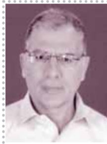
رؤى د. مصطفى محمود