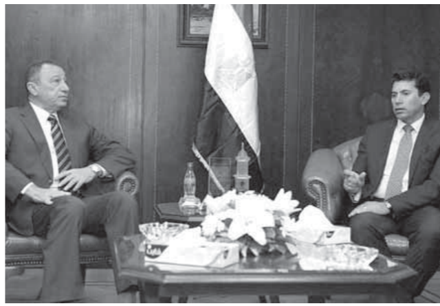
وزير الرياضة في اجتماعه مع مجلس الأهلي

بدأت اللجنة المشكلة من الجهاز المركزي للمحاسبات مهام عملها بالتعاون مع اللجنة المشكلة من قبل وزارة الشباب والرياضة، حيث توجهت اللجنة مباشرة إلى مقر الاتحاد المصري لكرة القدم لمراجعة أعمال اتحاد الكرة. وكان وزارة الشباب والرياضة قد أعلنت بأنه قد تم تشكيل لجنة على أعلى مستوى تضم في عضويتها مجموعة من قيادات الوزارة وبمشاركة الجهات الرقابية لإجراء مراجعة لأعمال الاتحاد المصري لكرة القدم عن الفترة الماضية في إطار المراجعة الدورية والتي سوف يتم تطبيقها بشكل زمني لباقي المؤسسات والهيئات الرياضية.