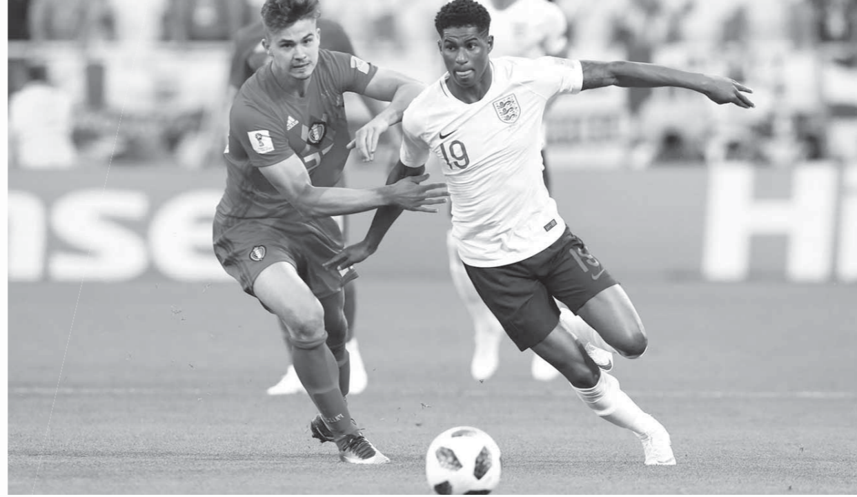
إنجلترا قدمت عروضاً جيدة في المونديال حتى الآن

ومن المقرر أن يعتمد المنتخب السويدي على تشكيلته المعتادة في مباراة اليوم، والتي تضم أولسن في حراسة المرمى وأمامه ليوستيج، ليندولف، جرانكفيست، أوجوستينسون، وفي الوسط كلاسون، لارسون، إيسكدال، وفي الهجوم فورسبرج، بيرج، توافونين.