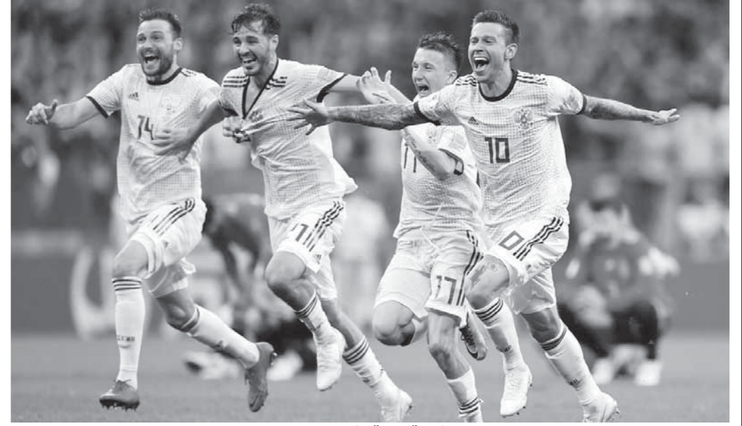
فرحة عارمة للاعبين روسيا