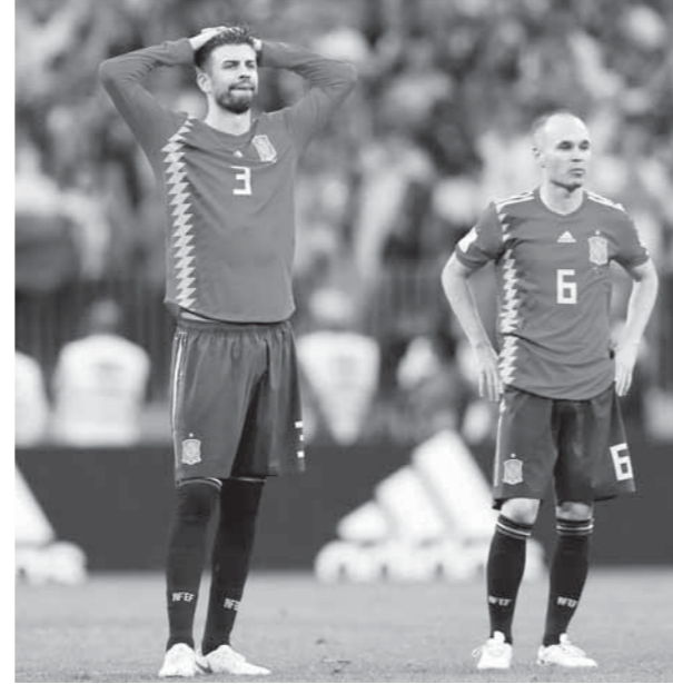
الحزن يسيطر على لاعبي إسبانيا

وأضاف: حتى الآن لعبنا بشكل جيد، وفزنا بكل مبارياتنا في المجموعة، أنا متأكد