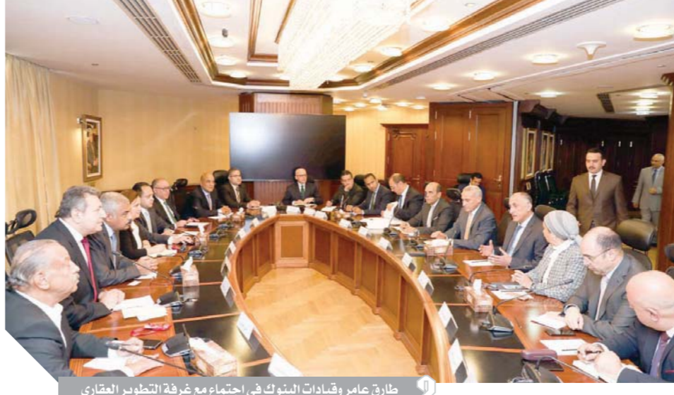
طارق عامر وقيادات البنوك في اجتماع مع غرفة التطوير العقارى

العقارى من خلال اتاحة تمويل للأفراد الطبيعيين ذوى الدخل المتوسط بعد أقصى ٥٠ مليار جنيه.. ويوجه المحافظ بتشكيل لجنة مصغرة تضم ممثلاً عن البنك المركزى والبنوك العاملة فى السوق المصرى والمطورين العقاريين لبحث آليات تمويل تسهيل التمويل العقارى. أصدر البنك المركزى مبادرة مبلغ ٢٠ مليار جنيه مصرى لتنشيط التمويل العقارى بأسعار عائد مخفضة شملت محدودى ومتوسطى الدخل ولاقت المبادرة إقبالاً كبيراً