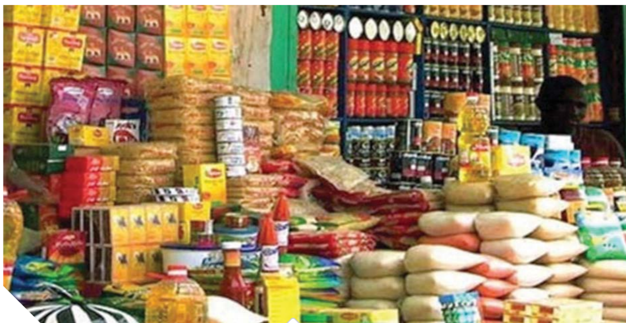
توفير السلع الغذائية في المجمعات الاستهلاكية