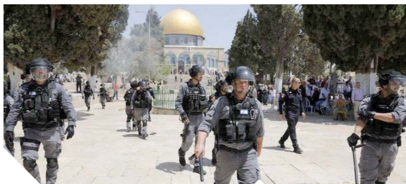
قوات الاحتلال تقتحم المسجد الأقصى

الذي يمنع دخول جولات سياحية خلال العشر الأواخر من شهر رمضان المبارك، وأوضح الكسواني أن قوات الشرطة الإسرائيلية والوحدات الخاصة اعتدت على المصلين والمعتكفين في المسجد الأقصى المبارك.