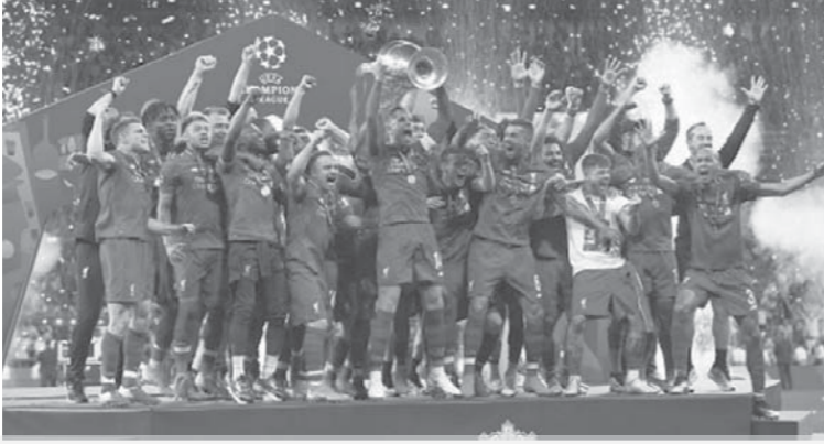
الريدينز يحصد اللقب السادس في تاريخه.. ويفض الشراكة مع برشلونة والبايرن

«مو»: ضحيت كثيراً من أجل مسيرتي.. وفريقنا أصبح لا يصدق