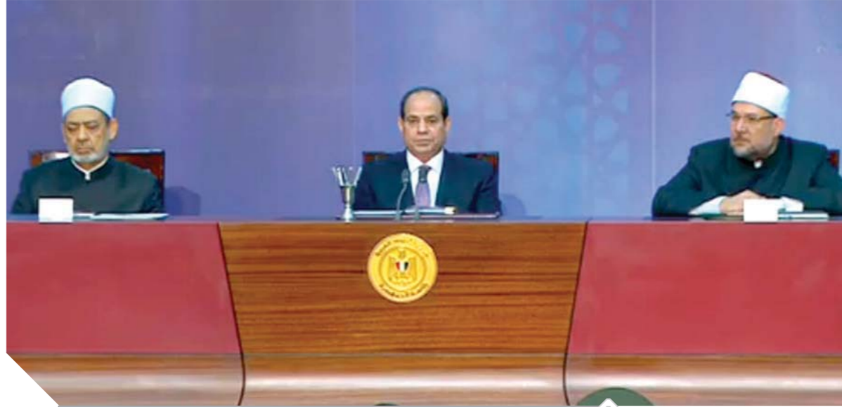
الرئيس وفضيلة الإمام الأكبر شيخ الأزهر ووزير الأوقاف أثناء احتفالية ليلة القدر

شيخ الأزهر: «الإسلام فوييا» كلمة لقيطة يستخدمها الغرب لصناعة التخويف من الإسلام وزير الأوقاف: الجماعات الإرهابية تطلق دعوات مشبوهة لتفكيك الدول