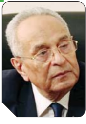
بهاء الدين أبو شوق