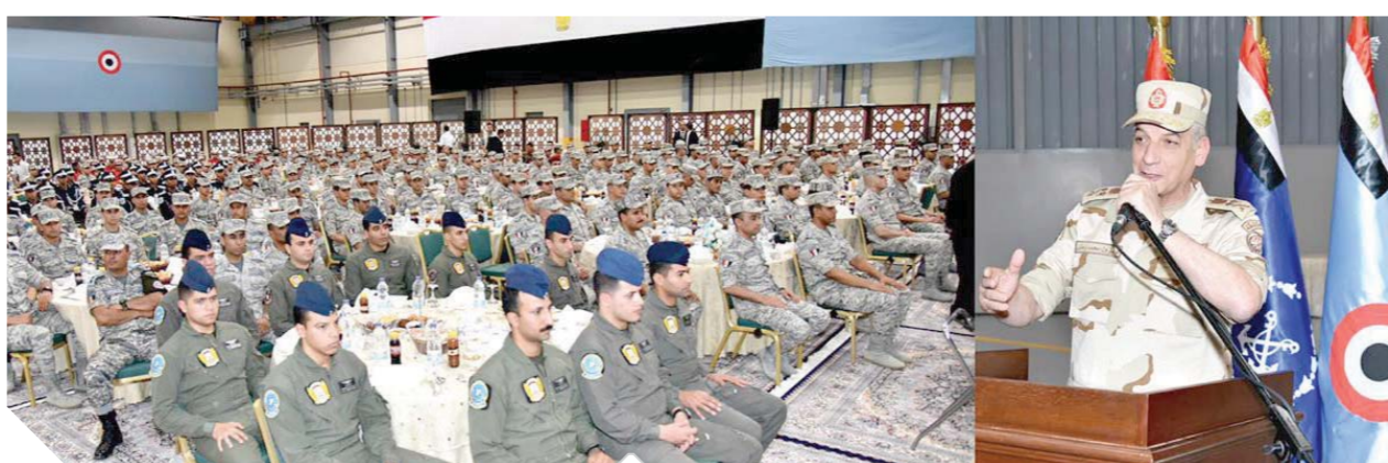
وزير الدفاع خلال لقائه مقاتلي وطلاب الكلية الجوية

من رجال القوات الجوية تقديراً لأدائهم بمهامهم بتقان وإخلاص. حضر اللقاء الفريق محمد فريد رئيس أركان حرب القوات المسلحة وعدد من كبار قادة القوات المسلحة.