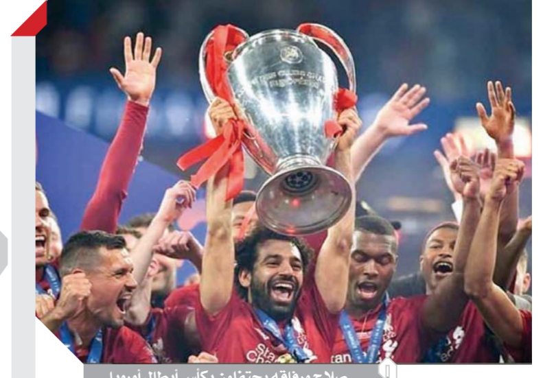
صلاح ورفاقه يحتفلون بكأس أبطال أوروبا

كتب - عبدالرحيم أبوشامة: أكد الدكتور مصطفى مدبولى رئيس مجلس الوزراء الحرص على متابعة نتائج أعمال لجنة حصر التصرفات بمنطقة الساحل الشمالى الغربى، المشكلة بتوجيه من رئيس الجمهورية. وشدد خلال اجتماعه باللواء ناصر فوزى، رئيس المركز الوطنى لتخطيط استخدامات أراضى الدولة، على الاهتمام بتدليل كافة المعوقات التى تواجه عملية تخطيط المنطقة وفى مقدمتها تعدد جهات الولاية، وتحقيق التنظيم الأمثل للتعاملات والتصرفات فى هذه المنطقة الواعدة، ووجه بسرعة تحصيل المديونيات المستحقة على الجهات لاستيفاء حقوق الدولة. وعرض اللواء فوزى تقريراً مفصلاً حول أعمال اللجنة، مشيراً إلى موقف حصر التصرفات التى تمت على مختلف الأراضى بمنطقة الساحل الشمالى الغربى، والموقف التنفيذى والقانونى الحالى لكل منها مع اختلاف جهات الولاية، وهى هيئات المجتمعات العمرانية، والتنمية السياحية، ومحافظة مطروح. كما كشف عن مقترحات اللجنة بشأن التعامل مع مختلف