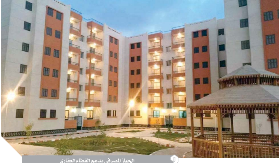
الجهاز المصرفى يدعم القطاع العقارى

حيث ساهمت في دعم شريحة كبيرة من المجتمع مما كان له مردود اجتماعى أيضاً. أشاد المطورون العقاريون بالجهود المتواصلة التي يقوم بها البنك المركزى المصرى لتنشيط السوق المركزى المصرى، لافتين إلى المشاركة الفعالة للبنك المركزى المصرى في الاجتماع الذى عقده رئيس مجلس الوزراء في مارس الماضى بحضور وزير الإسكان والمرافق والمجمعات العمرانية، وروساء البنوك والمطورين العقاريين ليبحث معاً مخططة شملت العقارى وتنظيم آليات التمويل الخاصة به.