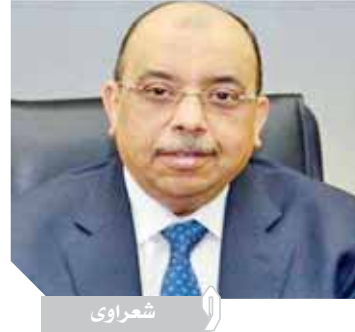
شعراوى نقلة نوعية غير مسبوقة فى آليات الاستفادة مواطنى الريف المصرى من الخدمات الإجرائية التى تقدمها عدة جهات على

كتب - سيد العبيدى: كشف اللواء محمود شعراوى وزير التنمية المحلية، عن بدء الإجراءات التنفيذية لإنشاء مجمعات الخدمات الحكومية فى القرى المستهدفة ببرنامج تطوير الريف المصرى ضمن المرحلة الجديدة للمبادرة الرئاسية حياة كريمة. قال اللواء محمود شعراوى: إن هذه المجمعات تأتى تنفيذياً للتكليف الذى أصدره الرئيس عبدالفتاح السيسى من خلال متابعته لخطط المرحلة الأولى للبرنامج والتى تشمل ٥١ مركزاً إدارياً تضم نحو ١٤٠٠ قرية. وأوضح وزير التنمية المحلية، أن مجمعات الخدمات الحكومية المزمع تنفيذها تعد