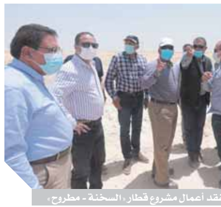
وزير النقل يتفقد أعمال مشروع قطار السخنة - مطروح.

كتب - أحمد دراز وشيرين جمعى، أكد المهندس كامل الوزير وزير النقل، أن السرعة التصميمية لقطار مشروع قطار السخنة/ مطروح تبلغ ٢٥٠ كم فى الساعة والسرعة التشغيلية للقطار الكهربائى السريع ٢٣٠ كم/الساعة والكطارات الكهربائبة الإقليمية ١٦٠ كم فى الساعة. كما أكد أن المشروع يشمل على عدد ٢٠ محطة منها عدد ٨ محطات للقطار السريع وعدد ١٢ محطات إقليمية وأن القطار السريع يتميز بسعة نقل للخط مما يقلل الأزدحام المرورى، ويحقق أماناً أعلى للركاب وتأثيراً أفضل على البيئة ويساعد على التنمية الاقتصادية ويعزز البنية التحتية للمنطقة ويساعد على احتواء الزحف العمرانى.