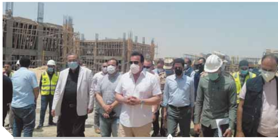
د. خالد عبدالغفار خلال الجولة التفقدية

كتب - زكى السعدنى: قام الدكتور خالد عبدالغفار وزير التعليم العالى والبحث العلمى، صباح أمس، بتفقد جامعة بنها الأهلية بمدينة العبور، برفقة الدكتور ناصر الجيزاوى القائم بأعمال رئيس جامعة بنها، والدكتور أنور إسماعيل مساعد الوزير للمشروعات القومية. خلال جولته، استمع الدكتور خالد عبدالغفار إلى شرح تفصيلى حول مكونات مبانى الجامعة وأطلع على معدلات التنفيذ، موجهاً بضرورة الانتهاء من تجهيز كافة مبانى الجامعة وفقاً للخريطة الزمنية المحددة، لتكون جاهزة لاستقبال الطلاب. وتفقد وزير التعليم العالى مبانى الكليات التى تضم المدرجات وفصول التدريب والمعامل وورش التدريب والمكاتب الإدارية. وأشاد الوزير بمعدلات الإنجاز للأعمال الإنشائية التى تسير وفقاً للجدول الزمنية المحددة، مؤكداً أن المشروعات القومية التى تشهدها مصر لم تكن لتحدث لولا دعم الرئيس عبدالفتاح السيسى رئيس الجمهورية الذى بولى المشروعات القومية فى التعليم العالى والبحث العلمى اهتماماً بالغا، وزلت كافة الصعاب لتسهيل مهمة إنجاز المشروعات الجديدة.