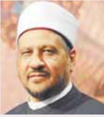
د. مجدى عاشور مستشار مفتى الجمهورية

شربت ناسياً وأنا صائم، فما الحكم؟ وهل هناك فارق في ذلك بين صوم الفرض وصوم النفل؟ أولاً: يفسد الصوم بدخول شيء كالأكل والشرب، ودخول شيء من خارج الجسد إلى الجوف من منفذ مفتوح طبعياً أثناء المدّة من طلوع الفجر إلى غروب الشمس. ثانياً: اختلف الفقهاء في فاعل ذلك ناسياً، فذهب جمهور الفقهاء من الحنفية والشافعية والحنابلة إلى عدم بطلان الصوم من أكل أو شرب ناسياً في الصيام، سواء كان الصوم فرضاً أو نفلاً؛ لجديده ابن عمر، قال: قال النبي: «مَنْ أَكَلَ نَاسِيًا وَهُوَ صَائِمٌ، فَلَيْسَ بِصَوْمِهِ، فَإِنَّمَا أَطْعَمَهُ اللَّهُ وَسَقَاهُ»، (صحيح البخاري/ ٦٦٦٩). وخالف المالكية في ذلك، ففرقوا بين صيام الفرض والنفل، فقالوا: مَنْ نَسِيَ فِي صَوْمِ الْفَرْضِ فَأَكَلَ أَوْ شَرِبَ، بَطَلَ صَوْمُهُ وَعَلَيْهِ الْقَضَاءُ، لَكِنَّ فِي صَوْمِ النَّفْلِ وَالنَّفْلِ فَإِنَّمَا يَتَمُّ صَوْمُهُ، وَلَا قَضَاءَ عَلَيْهِ. والخلاصة: أن الأصل في المسلم حين قيامه بأداء العبادات أن يكون متيقظاً ومستحضراً لأركانها وشروطها، لكن إذا وقع منه شيء بسبب النسيان والسهو كالأكل أو الشرب في أثناء صوم رمضان أو غيره، فعليه أن يتَّعِبَ صِيَامَهُ، وَلَا شَيْءَ عَلَيْهِ كَمَا هُوَ مَذْهَبُ جُمْهُورِ الْفُقَهَاءِ، وَسِوَاهُ أَكْبَارِ الصُّوْمِ فَرَضًا أَوْ نَفْلًا.