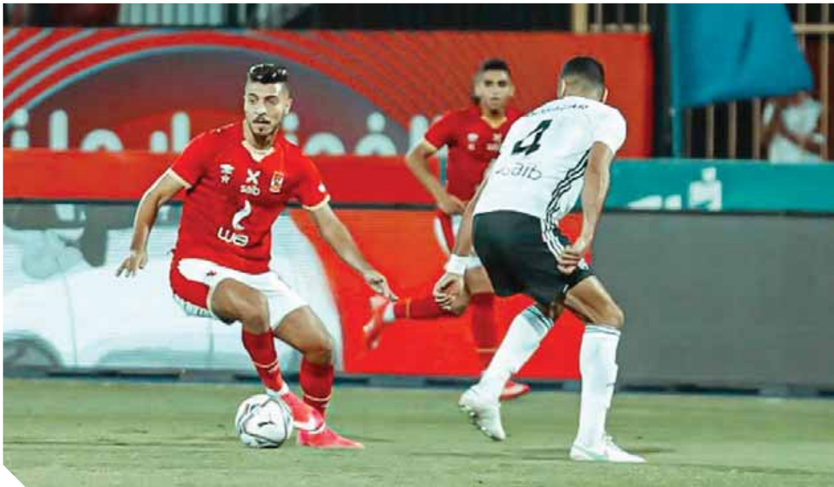
الأهلى يتطلع لمصالحة جماهيره أمام المحلة