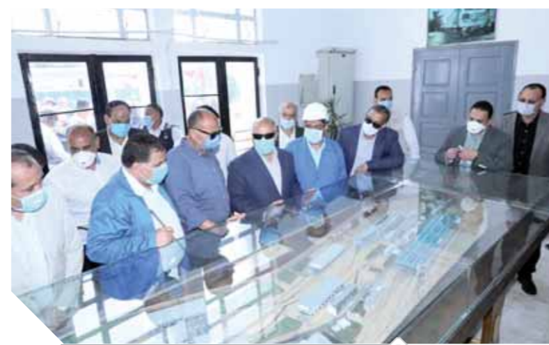
وزير النقل خلال تفقده نماذج الجرارات الجديدة

كما تقصد الوزير العربية النموذج الأولى من واقع عربتين تم الانتهاء من تصنيعهما وتم عمل الاختبارات عليها والمعتمدة بعمل مجرى، وجرى اختبار إحدى هذه العربات على خطوط السكة الحديد المصرية، وذلك ضمن صفقة توريد ١٣٠٠ عربة سكة حديد جديدة للركاب تم التعاقد عليها مع شركة ترانسماش الروسية الممثل للحلفاء الروسى المجرى بقيمة ١٦٦ مليونا و ٥٠ ألف يورو. صرح الوزير بأن هناك عدد ٣٣ عربة سكة حديد جديدة أخرى يتم تصنيعها حالياً فى روسيا، وكان من المخطط وصولها نهاية الشهر الحالى ولكن سيتم توريدها قبل نهاية الشهر القادم بسبب الظروف الخاصة بكورونا على أن يتوالى وصول باقى الدفعات بمعدل ٢٥ عربة شهرياً.