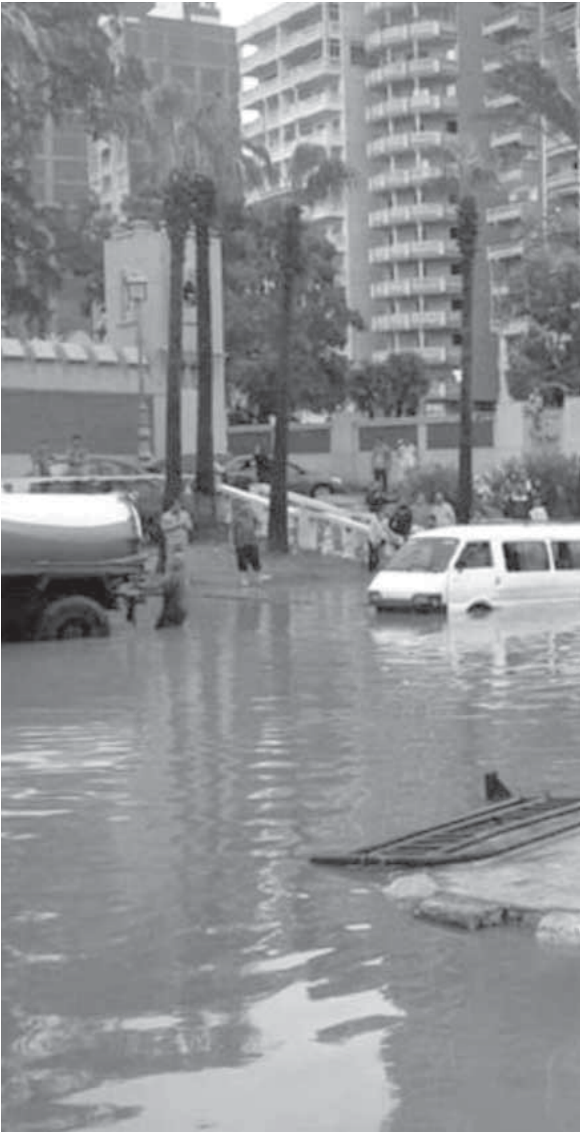
مياه السيول تغرق القاهرة الجديدة

يذكر أنه عند تصميم مدينة الشيخ زايد القريبة من القاهرة تم إنشاء نظام صرف للمطر بها في الشوارع وأعلى أسطح الممارات، هذه المياه تستخدم لرى حدائق المدينة، فالأما لا يتم تعميم هذه التجربة للاستفادة من تجارب الدول الأخرى للاستفادة من مياه السيول والأمطار رافة بصمر والمصريين؟