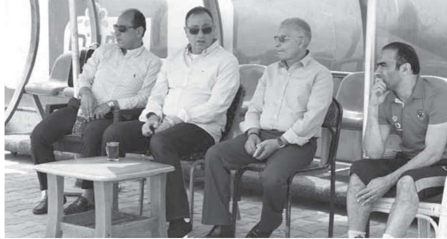
الخطيب في مران الأهلي