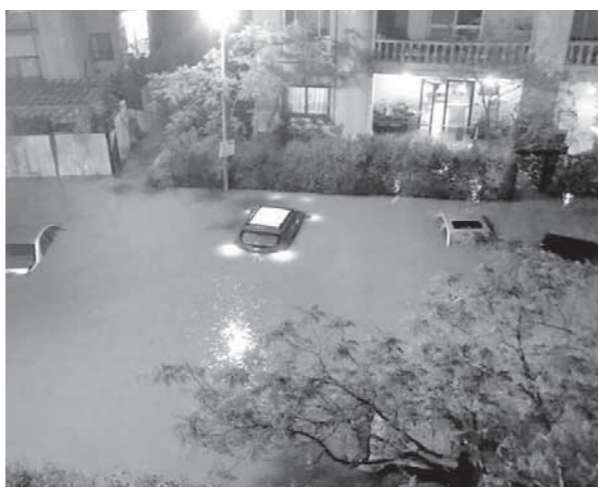
غرق سيارات المواطنين فى التجمع الخامس

وعلى الجانب الآخر، أظهرت الصور سوء كثافة البنية التحتية لمدينة القاهرة الجديدة وخاصة حتى التجمع الخامس الذى يعتبر من أرقى أحياء العاصمة فى الوقت الحالى، رغم عدم مرور عشرين عاماً على بناؤه، ما يدل على سوء التخطيط والتصميم لبناء هذه المدن الجديدة، ويعطى جرس إنذار للجميع قبل البدء فى إنشاء أى مدينة جديدة. ورغم ذلك فإنه فى فبراير الماضى، أعلن الدكتور مصطفى ممدولى، وزير الإسكان والمرافق والمجمعات العمرانية، أن إجمالي الاستثمارات بمشروعات الطرق المنفذة بمدينة القاهرة الجديدة، بلغ حوالى 5.65 مليار جنيه، منها 1.65 مليار جنيه بخطة العام المالى -2017-2018، و4 مليارات جنيه بخطة العام المالى -2018-2019. فى هذا الصدد، قال الدكتور سامح العلالى، عميد كلية التخطيط العمرانى الأسبق بجامعة القاهرة، إن الفرق بين بناء مصر الجديدة منذ أكثر من مائة عام، وبناء مدينة