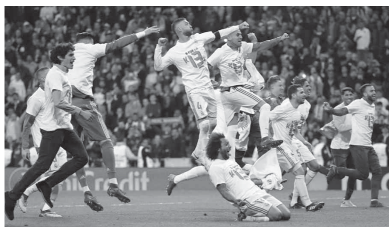
احتفالات لاعبي ريال مدريد بتأهل للنهائي

سجل هدفين.. وأتم تصريحاته «لا يوجد فريق ضعيف يصل لنهائي دوري الأبطال. سنتنظر أي فريق يفوز من المباراة الأخرى». فيما قال الألماني يوب هاينكس، المدير الفني للملاق البافاري خلال تصديدها لشبكة «سكاي سبورتنس»: لقد لعبنا مباراة رائعة وكنا الفريق الأفضل بشكل عام خلال المباراتين معاً، أما إذا قدمت شروطاً أول بمستوى عالٍ، ثم تلقت هدفاً بهذه الطريقة في بداية الشوط الثاني فمن الصعب العودة، بالطبع كان الخطأ كبيراً، ولكنني لن أتحدث مع أولريتش». وعن أخطاء الحكم التركي شاكير، قال الألماني: «ركلة جزاء على مارسيلو نعم من الواضح أنها ركلة جزاء، لكننا أضعنا العديد من الفرص، لذلك لا حاجة للشكوى من الحكم، وأتم: «أشعر بخيبة أمل اليوم، ولكن أيضاً فخور بفرقتي، وقد أظهر فرقتي بعض الشخصية، ولكن على حساب سرعتنا، فقدنا بعض الفرص أمام المرعى وكان نافاس أفضل لاعب في ريال مدريد خلال اللقاء». واتفق معه توماس مولر، قائد بايرن ميونخ، الذي رفض اللقاء اليوم على الصعيد الشخصي، توجد أبعاد لخسارتنا، لقد لعبنا بشكل أفضل في مباراة الذهاب، لكن لم نتكمن من ترجمة ذلك إلى أهداف وفوز». وأضاف: «اعتقد أن التحكم قام بعمل جيد جداً، نحن لم نخسر بسببه.. كيلور نافاس (حارس ريال مدريد) قدم أداء رائعاً، وتقديمه في مناسبات عديدة، وهذا لعب دوراً محورياً في حسم المباراة لصالحهم».