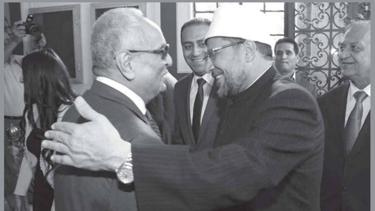
المستشار بهاء الدين أبو شقة يستقبل محمد مختار جمعة وزير الأوقاف