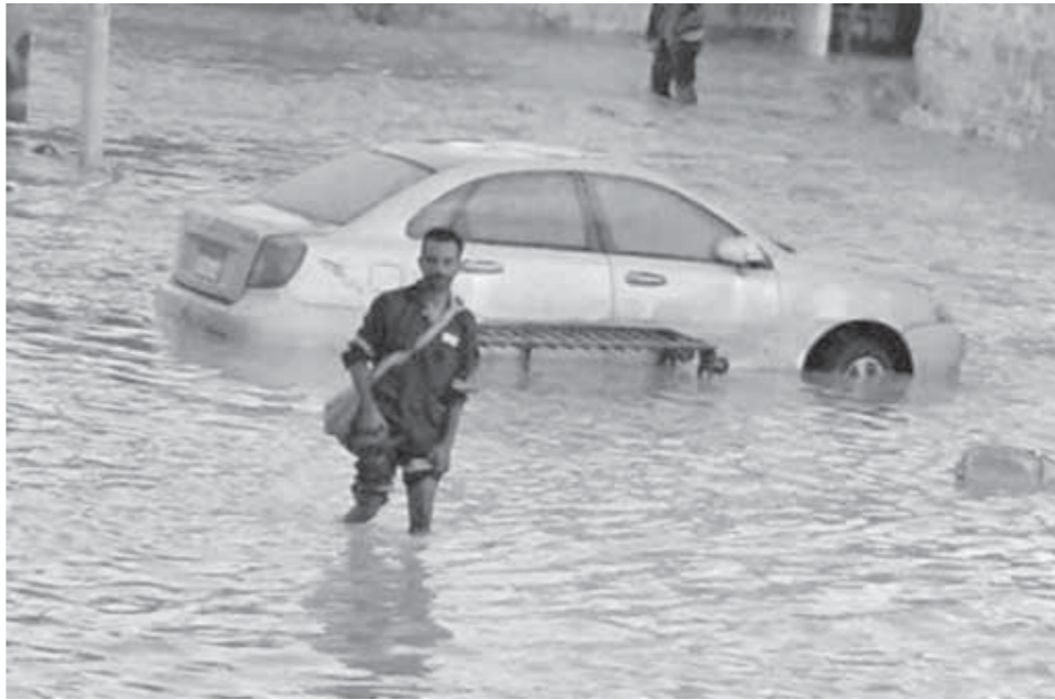
مواطن يحاول عبور الشارع وسط مياه السيول

وتهدد السيول مناطق عديدة فى محافظتى الإسكندرية ومطروح، أشهرها منطقة زاوية عبدالقادر التى لا يمر عام دون أن تغرق فى مياه السيول أيام طوال. وتتقطع مجارى السيول عدداً غير قليل من الطرق وخطوط السكك الحديدية، منها خط سكة حديد قنا - سفاجا الذى يتعرض سنوياً للاجتياح نتيجة سيول وادى سفاجا وسمنة، وهو نفس ما يحدث لطريق سفاجا- قنا، والطريق الممتد شرق مناطق الاستصلاح من حلوان حتى الكريمان، وطريق قنا - سوهاج - الفردفة وكذلك الطريق الرئيسى شرق الشيخ - طابا وطريق القصور - قنا، وطريق النفق الدولى - نويبع، طريق أبورديس - وادى فيران، وطريق الشيخ فضل- أبو جاد، وطريق إدفو- مرسى علم.