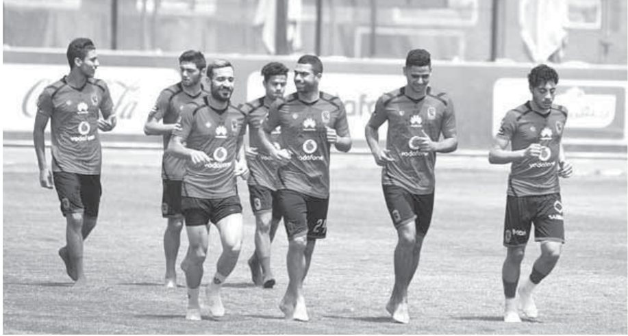
الأزمات تحاصر الأهلي قبل مباراة الترجي