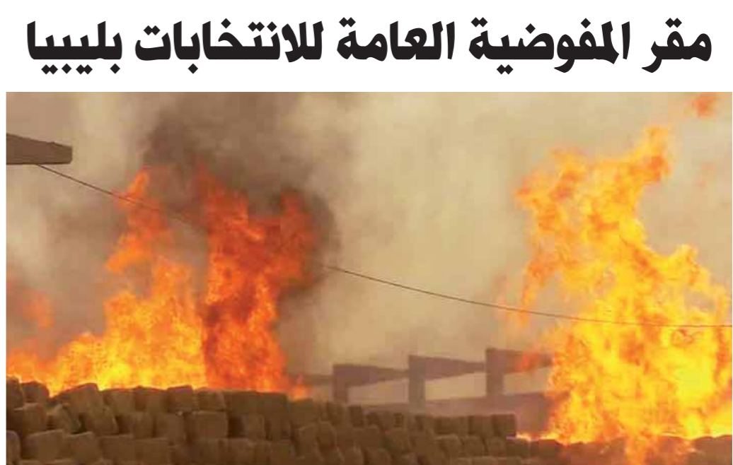
الدخان يتصاعد من مقر مفوضية الانتخابات فى ليبيا