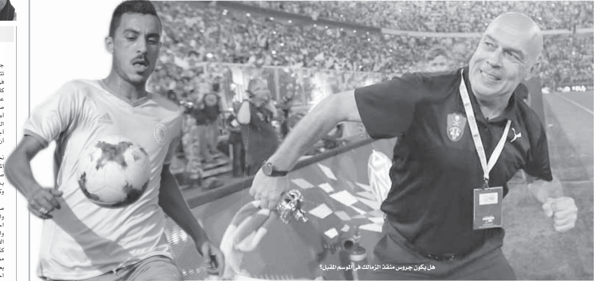
هل يكون جروس منقذ الزمالك في الموسم المقبل؟