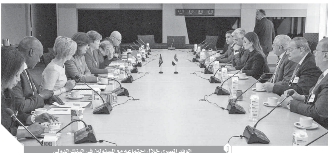
الوفد المصري خلال اجتماعه مع المسؤولين في البنك الدولي

التي يقوم بها الصندوق لسياسات الإصلاح الاقتصادي، والتي تتم خلال يوليو القادم، وتقوم لجنة صندوق النقد الدولي بمراجعة