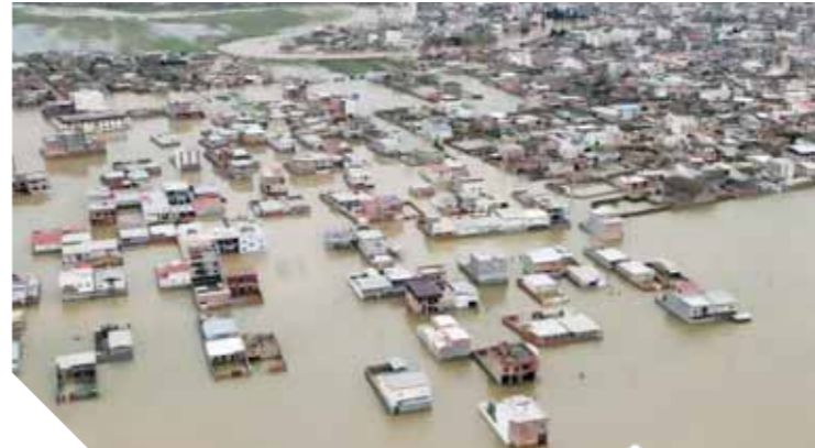
مناطق غمرتها المياه بشكل كامل في إيران بسبب الفيضانات