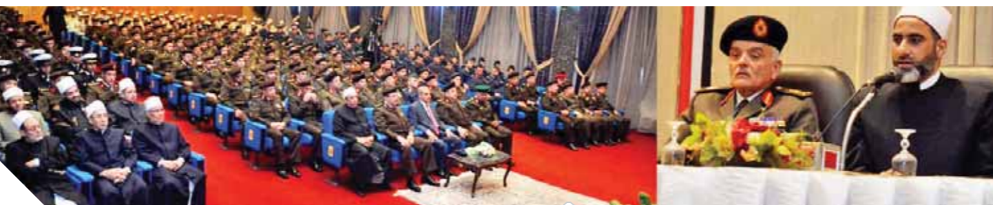
جانب من احتفالات القوات المسلحة بذكرى الإسراء والمعراج

أن المولى عز وجل اختص مصر بأن جنودها خير أجناد الأرض في الكفاح والنضال من أجل المبادئ السامية والقيم النبيلة وتسمكهم بشريعة الله السمحة وسيرة نبيه الكريم. وألقى اللواء أ.ح. السيد على العالي مساعد رئيس أركان حرب القوات المسلحة كلمة نيابة عن الفريق أول محمد زكي القائد العام للقوات المسلحة وزير الدفاع والإنتاج الحربي، أكد خلالها أن الاحتفال بذكرى الإسراء والمعراج يذكرنا دائماً