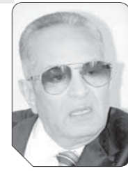
بهاء الدين أبو شققة