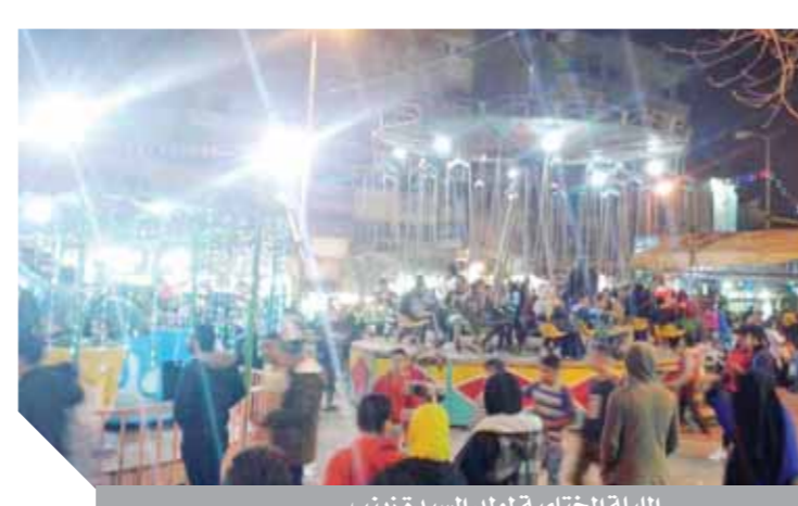
الليلة الختامية لمولد السيدة زينب

توفرت في الخيام وأمام المحلات، ولم تقتصر الطعام على الفتة واللحوم فقط ولكن كان هناك من يقوم بتوزيع سندوتشات فول وطعمية، وعبوات البسكوت والمعصائر والتمر باللبن، والفطير