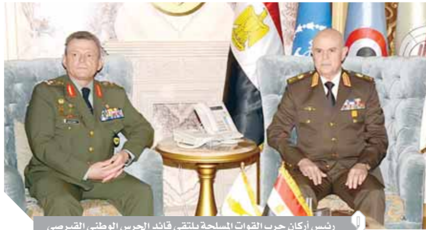
رئيس أركان حرب القوات المسلحة يلتقى قائد الحرس الوطني القبرصي