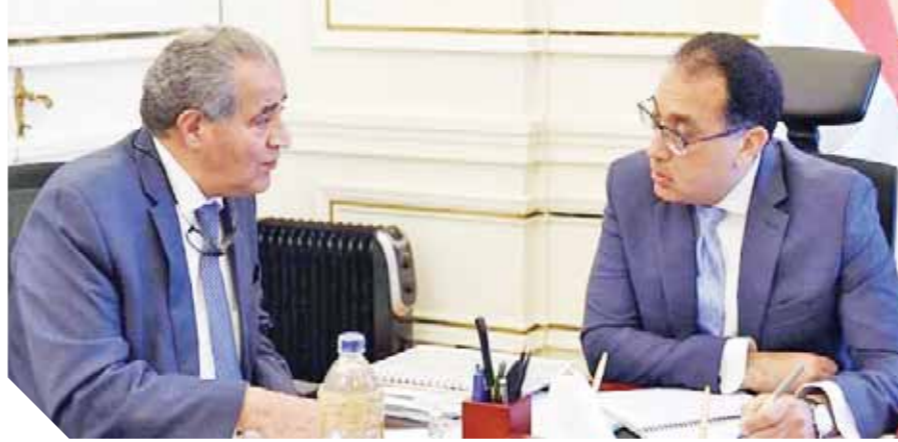
الرئيس الوزراء خلال اجتماعه مع وزير التموين