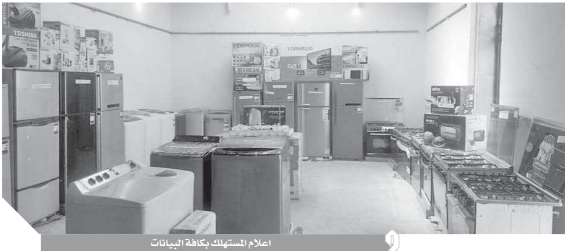
اعلام المستهلك بكافة البيئات

خلال العام الأول من تاريخ الاستلام. كما نصت اللائحة التنفيذية لقانون حماية المستهلك على تنظيم عمل جهاز حماية المستهلك بحيث يتولى إدارته مجلس إدارة، يمثل السلطة المهيمنة على شؤونه، واتخاذ القرارات لتحقيق أهدافه، وله على الأخص إقرار السياسات والاستراتيجيات الخاصة بنظام حماية حقوق المستهلك، ووضع لوائح تنظيم العمل به وتنظيم أمانته الفنية وشؤونه المالية والإدارية، ووضع هيكل تنظيمي للجهاز يتناسب مع أنشطته ويخدم مجالات العمل به، وتشكيل لجان فحص المنازعات التي تقع بين المستهلكين وبين الموردين أو المعلنين والنتيجة عن تطبيق أحكام القانون.