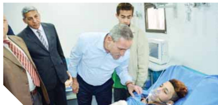
محافظ الإسماعيلية يطمأن على مصابي الحريق