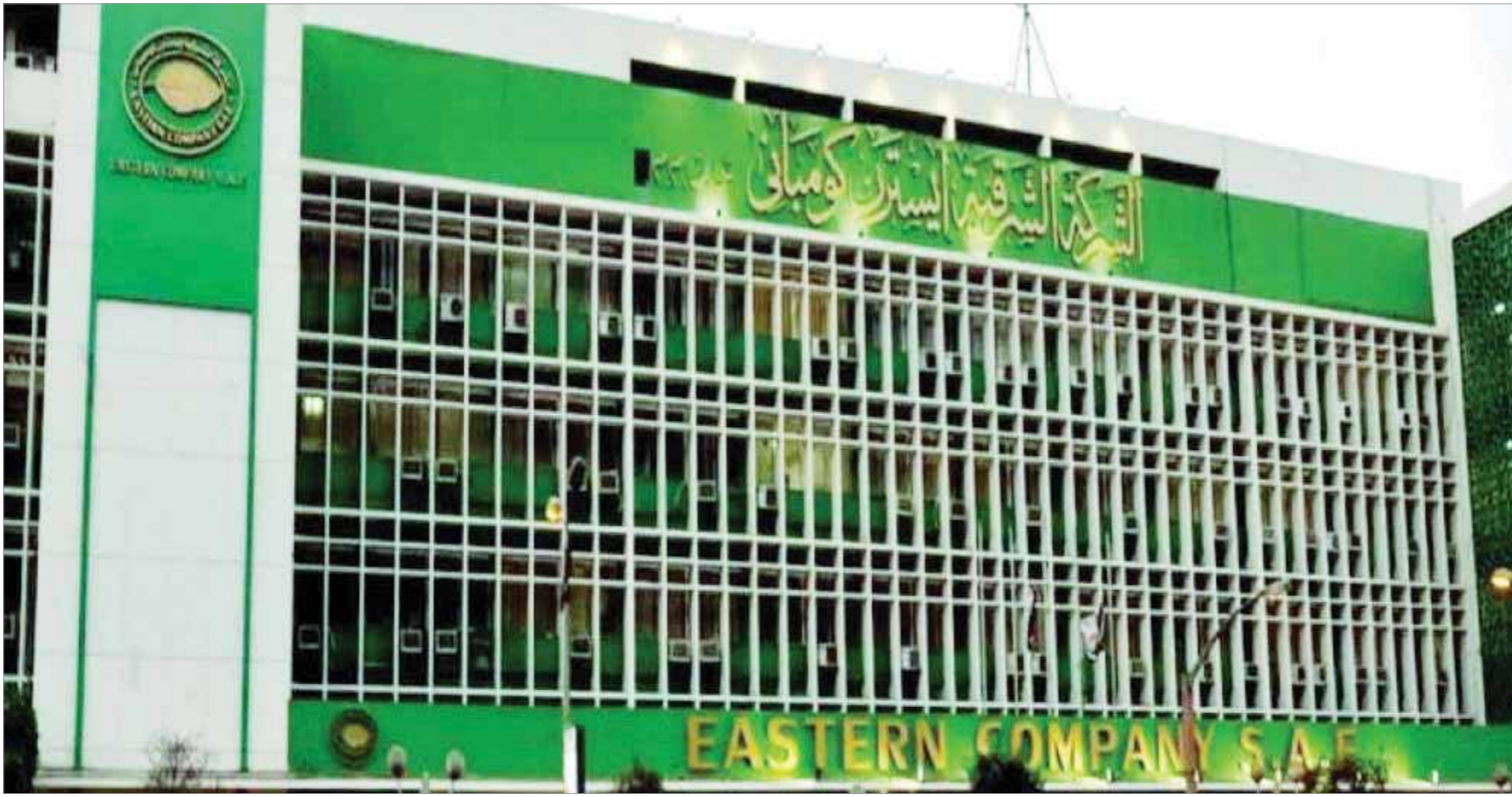
كتب- صلاح السعدني: