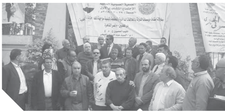
عمومية للعلميين في الشارع بعد غلق المقر

كل المتسبين هي غلق المقرات وأعمال الشعب بصحبة البلطجية، وشطب عضوية البعض وتوقيف لجنة برئاسة النقيب وعضوية 4 من أعضاء الجمعية لاستكمال تحديد العضويات التي سيتم شطبها، وتمكين النقيب من ممارسة مهام منصبه وتجديد الثقة فيه، وتحويل كل المخالفين للنقابة العامة وأن تشكل هيئة المكتب من النقيب ورؤساء النقابات الفرعية. في المقابل دعا أعضاء المجلس إلى عقد جمعية عمومية للتصديق على ما اتخذوه من قرارات بشأن عزل النقيب وشطبه من سجلات النقابة وإحالة المخالفات للنقابة، كما قرروا التعاضد مع شركة أمن لحماية مقرات النقابة، يأتي هذا في ظل إصدار عدد من النقابات الفرعية بيانات شجب واستنكار لما شهده النقابة من أحداث الأمر الذي يؤثر بالسلب على العلميين وسمعتهم في الشارع ولدى أجهزة الدولة وكذلك في الخارج داعين إلى تهدئة الأمور وضبط النفس للوصول إلى حلول للخروج من الأزمة التي طالت النقابة في الفترة الأخيرة.