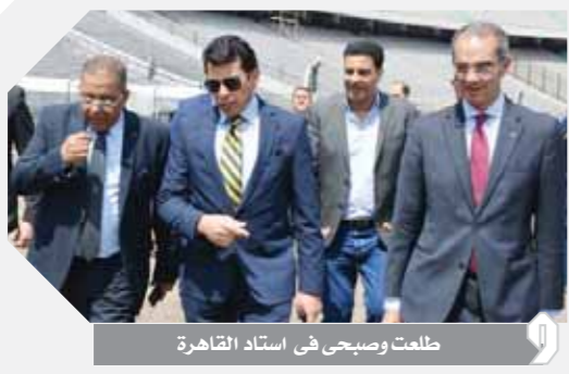
طلعت وصباحي في استاد القاهرة

التقى الدكتور أشرف صبحي وزير الشباب والرياضة، مع كل من الدكتور عمرو طلعت وزير الاتصالات وتكنولوجيا المعلومات، واللواء خالد عبدالعالم محافظ القاهرة، حيث تم خلال اللقاء متابعة سير العمل، وآخر الاستعدادات النهائية لجميع الاستادات التي سوف تستضيف فعاليات بطولة الأمم الإفريقية المقرر انعقادها في مصر في يونيو المقبل. كما تم استعراض التجهيزات الفنية النهائية لاستاد القاهرة الدولي، حيث ستقوم الشركة المصرية للاتصالات بربط جميع الاستادات المشاركة في البطولة بشبكة من الألياف الضوئية مع الاستادات بما يتيح تغطية