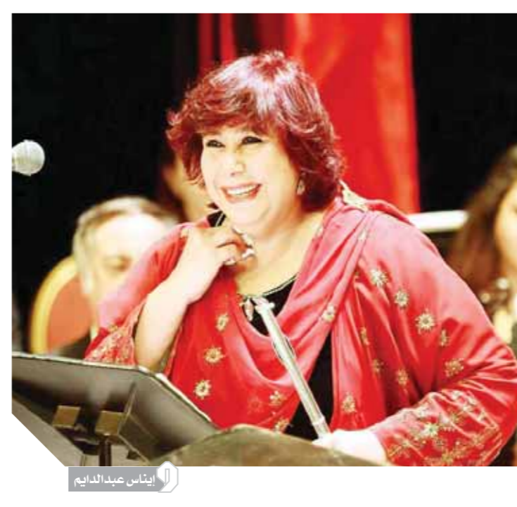
إيناس عبد الدايم