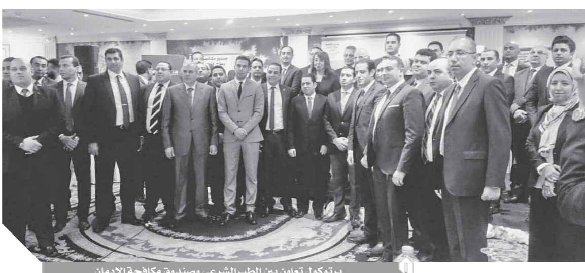
بروتوكول تعاون بين الطب الشرعى وصندوق مكافحة الإدمان

وأشارت إلى أنه تم الارتقاء بأعداد المراكز العلاجية من (12) مركزاً فى عام 2015 إلى (22) مركزاً فى عام 2018، وستتم إضافة (5) مراكز علاجية جديدة خلال العام الحالى لنصل إلى (27) مركزاً علاجياً. وأضاف: استفاد من خدمات العلاج (116 ألف) مريض إدمان فى عام 2018