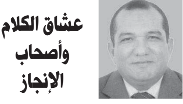
عشاق الكلام وأصحاب الإنجاز

الافتتاحات التي تجري كل يوم... والمشروعات التي يبدأ العمل فيها... كلامها يثر المرصين... فالمشروعات الجديدة بلا فائدة... والمشروعات التي تمت وبدت تؤتي ثمارها هي خطل سابقة... الاثنان لديهم سواء... بلا فائدة... أو مقولة... المهم أن ينتقدوا... المهم أن يجدوا شيئاً يتحدثون فيه... فالطرق عملناها قبل كده وهانعمل... والمدن الجديدة ليست بدعة بنيناها من قبل وسنبني غيرها... المهم تسببونا نكلم... القضية لديهم أن يتكلموا باستمرار... والذي يعشق الكلام يكره أصحاب الإنجازات... يكره من يبني ويرصف ويطور ويعالج... عشاق الكلام يريدونها مصطبة... مكملة... نافلة تفسلف واستعراض قدرة على صياغة الجمل... كل ما يهمهم أن يعيشوا دور المنتقد... الحائق... الرافض... وأحياناً التائر... ونظرة إلى أصحاب مجالس الكلام لا تجد بينهم صاحب فضل واحد على البلد... كلهم كانوا فقراء وأغنهم حرفة الكلام... بعضهم باع نفسه... وياع زملايه في يوم من الأيام... عندما اقتضت مصطلحاتهم أن يبيعوا باعوا بسهولة... مشكلتهم اليوم أنهم لا يجدون من يشتري خدماتهم... فكل قرش يوجه لمصلحة الشعب... كل قرش يوجه للبناء لصالح الأبناء... وليس للأبناء ليرضوا... هؤلاء المتسلسلون ضمير كبير علينا أن نتحمله كما نتحمل آلام المرض... لأنهم لا يفرون على بسى عما تفعله الجزيرة والشرق والى بسى سواء كانوا في الداخل أو في الخارج... تتحملهم ولا تلتصق إليهم.