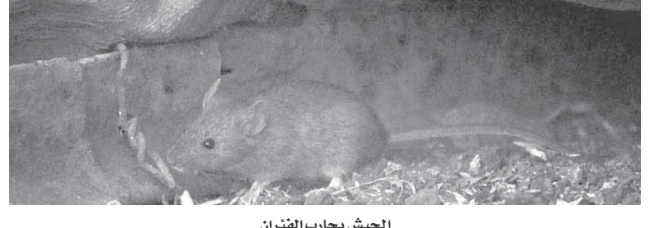
الجيش يحارب الفئران

الهند عام 2005 و2012، ومن هنا كان رهانه لتولى رئاسة الوزراء وقد كسب الرهان.