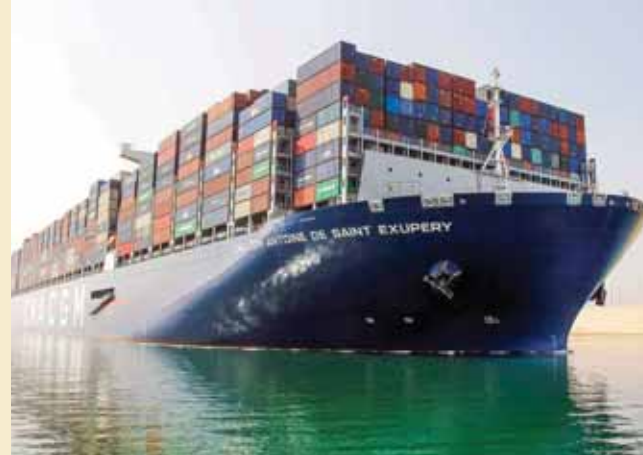
أكبر سفينة حاويات في العالم تعبر قناة السويس

استقبال الأجيال الجديدة من السفن الضخمة» وأكد مميش زيادة في معدلات مرور السفن وحمولاتها وأرجع ذلك لمشروعات التطوير المستمرة بالمجرى الملاحي و رفع كفاءة منظومة الخدمات الملاحية المقدمة للسفن العابرة من خلال مرشدين يمتلكون خبرة فنية لا تقدر بثمن ومساعدات ملاحية عالية الكفاءة ورجال آكفاء يعملون ليل نهار من أجل رفعة قناة السويس كرافد رئيسي للدخل القومي.