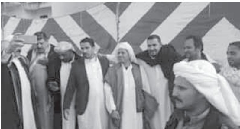
جانب من المؤيدين للمرشح الرئاسى موسى مصطفى

وتقديم التنازلات من جميع الأطراف وتغليب مصلحة سوريا للحفاظ على ما تبقى من مؤسسات الدولة، وإعادة إحياء ما تسدع منها، وقال «عصمت»، إن الحملة أعدت رؤية بشأن الأوضاع في اليمن، والتي أصبحت تصنف باعتبارها دولة فاشلة بامتياز، بمعنى أن الدولة موجودة، ولكنها لا تستطيع أداء أى من أدوارها؛ بسبب النفوذ الإيراني الذى تخلل الأوضاع الوطنية وطاولة المفاوضات التى تستوعب طائفية، ليرتبط استقرار الأوضاع بوقف هذه التدخلات والعودة إلى مخرجات الحوار الوطني وإيجاد حلول للأزمة الإنسانية والعمل على إيجاد خطوط لإصلاح المساعدات للمدنيين.