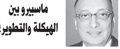
ماسيرو بين الهيكلية والتطوير!