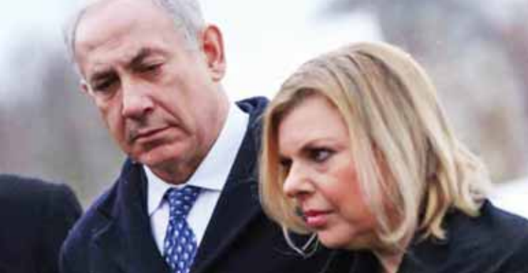
نتنياهو هو وزوجته سارة

إسرائيلي قدم له نتينهاو امتيازات مقابل تحسين صورته في الإعلام. وكان نتينهاو عرضة لشبهات فساد خلال توليه رئاسة الحكومة الإسرائيلية بين عامي 1996-1999، وهو في السلطة منذ العام 2009.