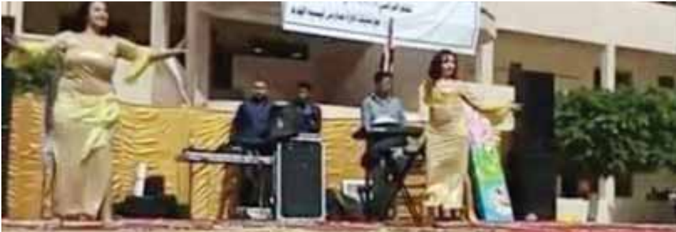
الراقصات على المسرح فى مدرسة لبسية الهرم