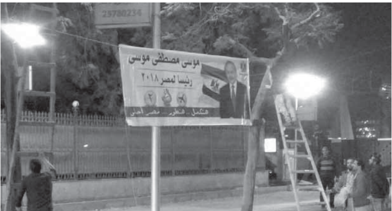
حملات دعائية لتأييد موسى مصطفى موسى

وقال المتحدث الرسمى، إن إيران هي إحدى الدول التى تعمل على زعزعة الاستقرار في المنطقة وتهديد سلمها الأهل، من خلال التمدد والتوسع وبسط نفوذها في عدة عواصم عربية،