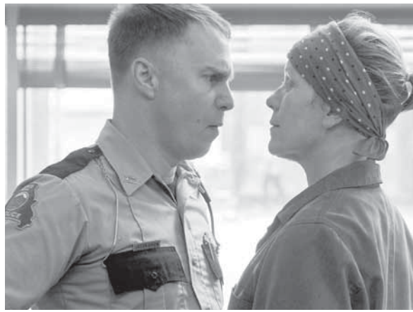
لوحات خارج إيبينج ميسورى

23 فيلم قضية رقم 23، درامى فرنسى - لبنانى