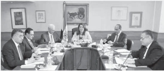
غادة والى تتراس اللجنة العليا للمعاشات الاستثنائية

والى، في تصريحات لها أمس، أن الحالات التي تمت الموافقة عليها تشمل الشهداء والمصابين من أبناء محافظة شمال سيناء من المدنيين الذين أصيبوا على أيدي جماعات الإرهاب والتطرف. كشفت الوزيرة أنه سيتم تكريم رجال الشرطة الذين استشهدوا أثناء تأدية عملهم تقديراً لجهودهم المتميزة طوال فترة خدمتهم ومحاولة التخفيف عن أسرهم، كما سيتم تكريم الحاصلين على أوسمة في مجال العمل العام.