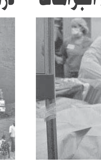
مخاوف من سرقة كميات من سائل النخاع الشوكى أثناء الجراحات

عندما تخضع لآى جراحة وتضطر فيها للتعرض لتخدير كامل أو حتى نصفى، احذر، فقد تتم سرقة كميات من سائل النخاع الشوكى، حيث ظهرت مؤخرا عصابات دولية تجند الأطباء بالمستشفيات لسحب سائل النخاع الشوكى أثناء إجراء الجراحات بما فيها حقن التخدير النصفى التي تلعلى للسيدات فى النخاع الشوكى أثناء الولادة، وفى باكستان أوقفت الشرطة عصابة تخصصت فى استئراج الفقراء خاصة من النساء وسحب كميات هذا السائل الشوكى مقابل وعود بتقديم مهر للزواج، ويتم بيع هذه المادة الحيوية فى السوق السوداء فى بلدان أخرى منها دول خليجية لاستخدامه خلال عمليات زرع للنخاع الشوكى.