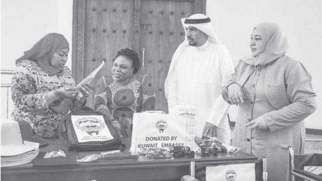
الكويت تحرص على تقديم المساعدات الإنسانية