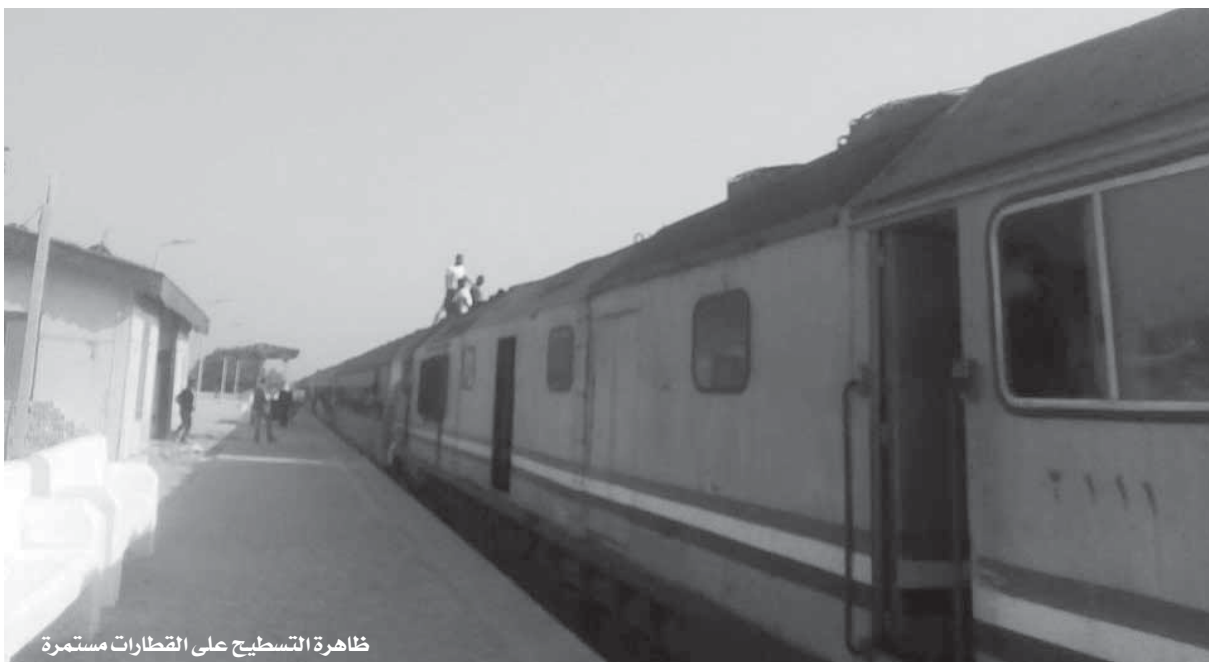
ظاهرة التسطيط على القطارات مستمرة

منظر يشع، رجل كبير السن في حالة سيئة يحك بالناس ويتنقل بينهم، والأمر الأكثر غرابة ليس فقط تلك المناظر البشعة، لكن هناك مجموعة من الشباب تتراوح أعمارهم بين 15 و20 عاماً يقفون بين العربيات وكان وجوههم تتحدث ويشيرون بنظرات غريبة لمجموعة من الركاب الشباب، وأخذ يروي لهم عن حكاياته مع الركاب المتهربين من دفع التذكرة، ومشاجراته معهم، يشكو من حقوقهم المهذرة؛ بسبب قانون السكة الحديد الذي يرفع شعار «الركاب على حق»، حتى إن الرجل في مواجهات دائمة مع الركاب، مضيقاً: «ولا مرة عرفت أخذ حق».