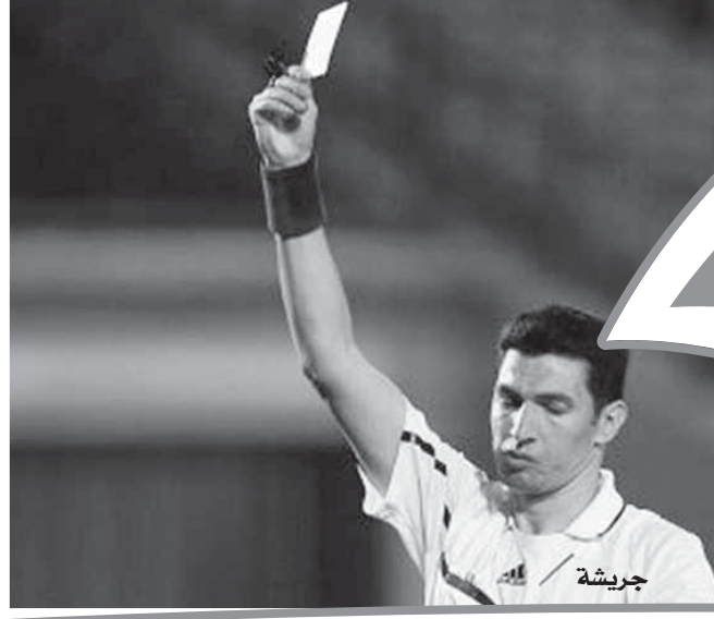
إشراف: أكرم عبد الفتى