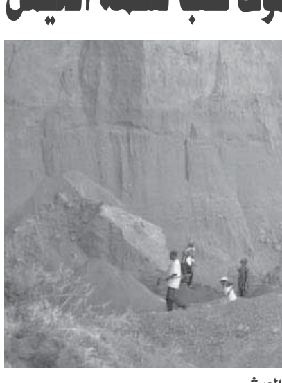
الموت بين الرمال من أجل لقمة العيش

وسط الحفر التي يعملون فيها، الجو هو ما يدفعنا إلى هذا العمل، ودخلنا ضئيل للغاية على الرغم من المخاطر التي نواجهها كل لحظة. وإذا كان هؤلاء الفقراء يموتون من أجل لقمة العيش، فإن هناك مستفيدين، ولا يخسرون شيئاً بل يكسبون، ففي عام 2010، صنّف برنامج الأمم المتحدة للمستوطنات البشرية بلدة ناكورو على أنها البلدة الأسرع نمواً في شرق ووسط أفريقيا، ودفع هذا القرب المستثمرين إلى المنطقة، وبالتالي، ازدهرت صناعة البناء والتشييد، والتي تحتاج بالأساس إلى الرمال، واضطر بعض أصحاب المحاجر إلى إغلاقها في أعقاب مقتل العديد من العمال لديهم تحت الرمال المنهارة، كما تم حظر نشاط محاجر أخرى بصورة قانونية لخطورتها، ويقول مدير الإدارة الوطنية هناك: ليست لدينا مشكلة في تنفيذ القانون وإغلاق المحاجر الخطيرة، ولكننا... ننظر لحياة الآلاف من الشباب الذين سيبتون عاطلين عن العمل!