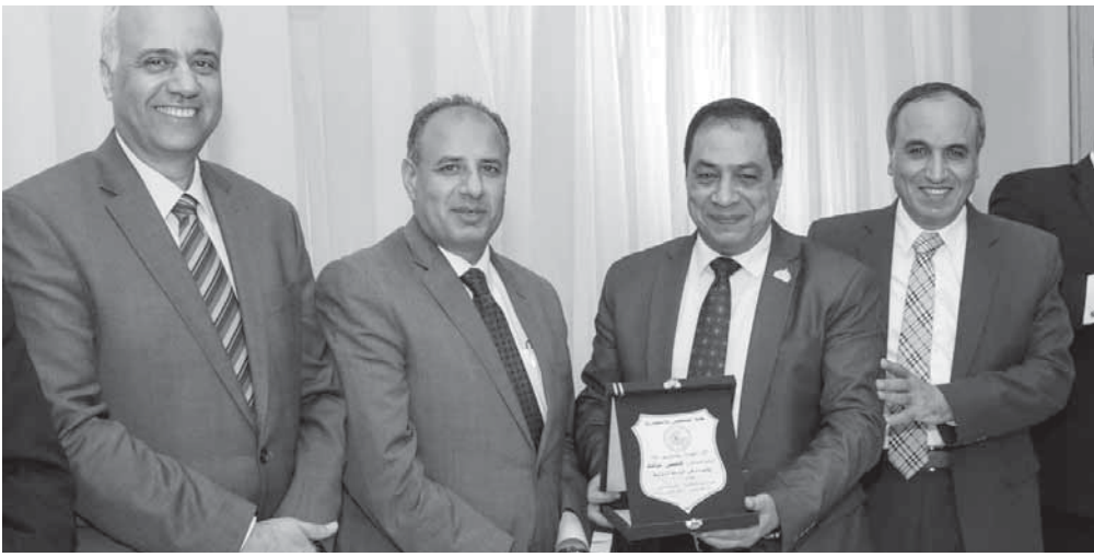
النائب حسنى حافظ يتوسط سلامة وسلمان والكردي