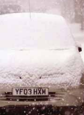
الثلوج تعطل الحركة المرورية في بريطانيا

تسببت أسوأ موجة طقس تجتاح بريطانيا منذ عام 1991 في مقتل 9 أشخاص بينهم طفلة، وأدى اجتياح عواصف تلجئة قادمة من سيبيريا التي أطلق عليها «وحش من الشرق» إلى إغلاق مطارات وطرق وتعطل حركة قطارات، كما تدخلت قوات الجيش لمواجهة الموقف في جميع أنحاء المملكة المتحدة. وتسبب الطقس السيئ في تقطع السبل يمتد من قاندى السيارات في اسكتلندا، وإغلاق آلاف المدارس. ومع ارتفاع مستوى الثلوج إلى نحو 90 سنتيمتراً وانخفاض الحرارة إلى 10,3 درجة تحت الصفر أصدرت