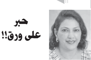
حبر على ورق!!

والحق أنني لست راضياً عن حديث الرئيس عنهم... وهو لا يتحدث إلا في وقت الإعلان عن إنجاز جديد... لماذا نذكرهم هنا... لماذا نذكر صفو الفرحة بالإنجاز أو البناء؟... أقدم أن يتحدث الرئيس للشعب الذي يعمل لمصلحته... أقدم أن يعلن فخره بما أنجزته الأيدي المصرية... أقدم أن يبشر بمستقبل لا يحتاج فيه لغيرنا... أقدم أن يعلن إصراره على استكمال مسيرة البناء والدفاع عن أرض الوطن... أقدم أن يتحدث الرئيس لمن يقدّر إنجازات المصريين في عهده... لا أقدم الحديث عن الرافضين في كل مناسبة... لا أقدم إقصاهم في يوم الفرح الذي لا يعرفون به... ما التقل الذي يملئونه حتى نذكرهم في يوم لا يرضون عنه... علاجهم الوحيد هو التكيف... فإن كانت هناك فئة تهوى الانتقاد دوماً... فهناك الملايين الذين ينتظرون نتائج مشرهم ودعمهم للرئيس... وهؤلاء أولى أن نذكرهم وقت البناء... والوقت الفرغ باكمال البناء.