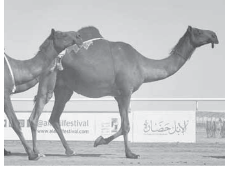
بول مارسيل كويروشك، وهو رحالة هولندي ومستشرق، «الإبل رمز الحضارة العربية.. يعني ما يوجد عرب بدون الإبل ولا يوجد الإبل بدون العرب.. وهذا قلب الجزيرة العربية هذا منبع الحضارة العربية.. اللغة العربية.. وعيني من الأول كانت الإبل موجودة، هذه سفينة الصحراء.. وتنافس عشرات الإبل في مسابقة جمال في السعودية الشهر الماضي، حيث تم استبعاد ما يقرب من 12 بسبب استخدام البوتوكس لزيادة جمالها.

تحت شعار «الإبل تراثنا وفخرنا» شهدت صحراء الدهناء بالسعودية، مسابقة نادرة احتفل خلالها بالإبل التي تتدرق فيها بملايين الدولارات، وجرى الاحتفال بالجمال في طقوس تقليدية في صحراء الدهناء بالقرب من العاصمة الرياض. وكان أعلى الإبل في هذا الحدث جملاً يملكه الأمير عبد الرحمن بن مساعد. ويصف الأمير عبد الرحمن، الذي يملك 50 جملاً، التنافس بين القبائل في مسابقات الإبل النادرة ويقول «نحبها (الإبل)