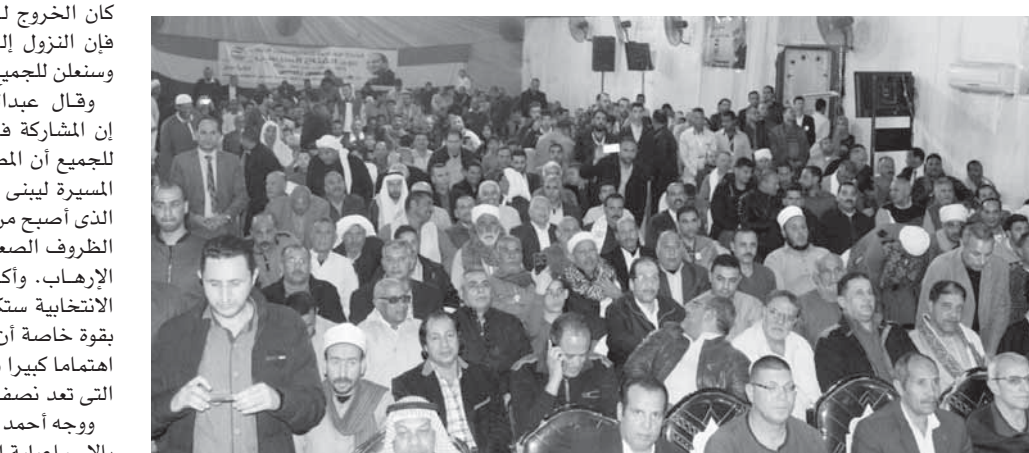
جماهير حاشدة في مؤتمر دعم السيسى بالإسماعيلية