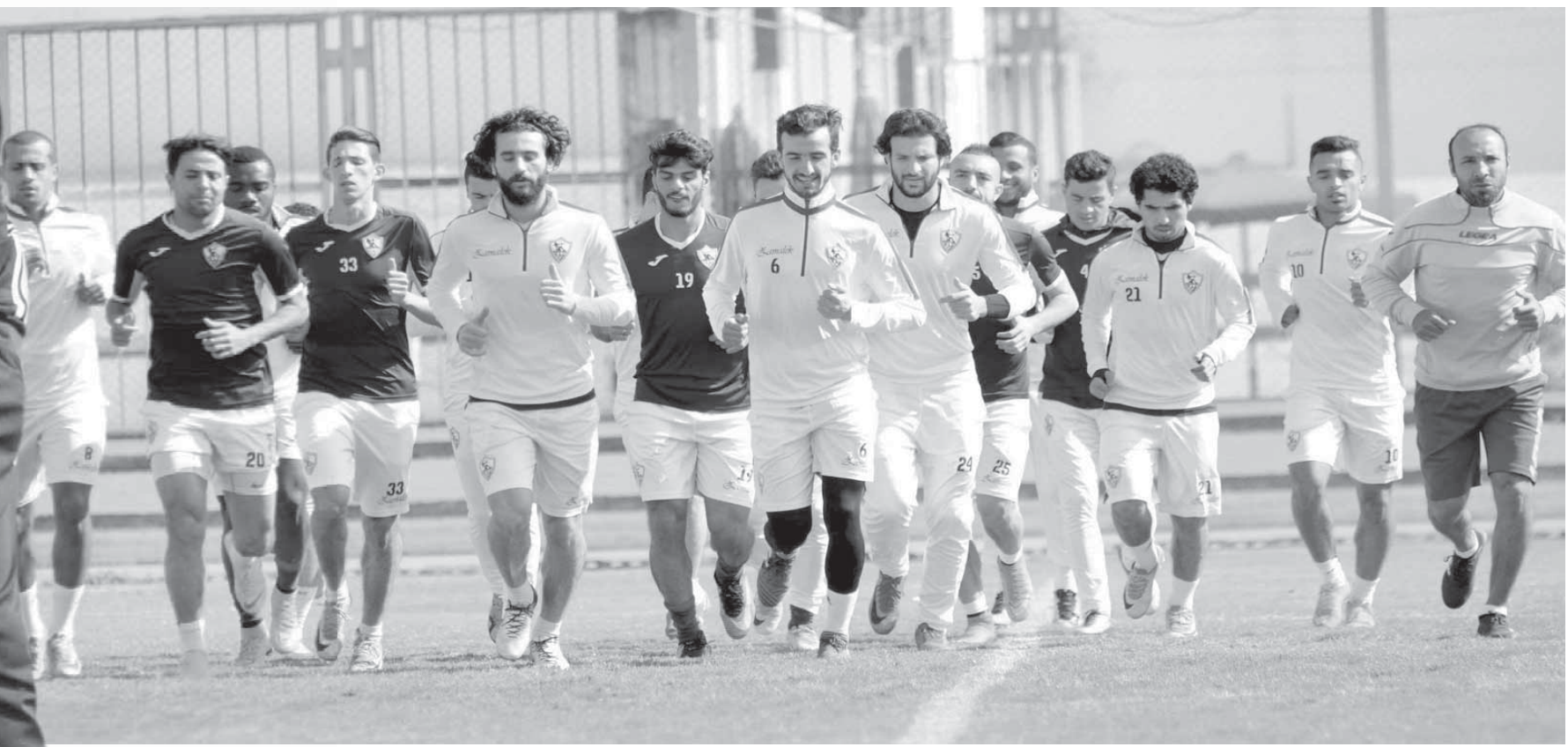
استعدادات مكثفة للزمالك قبل مواجهة بطل إثيوبيا