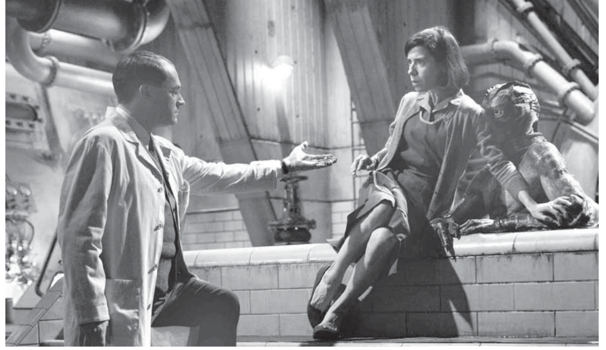
مشهد من فيلم «شكل الماء»