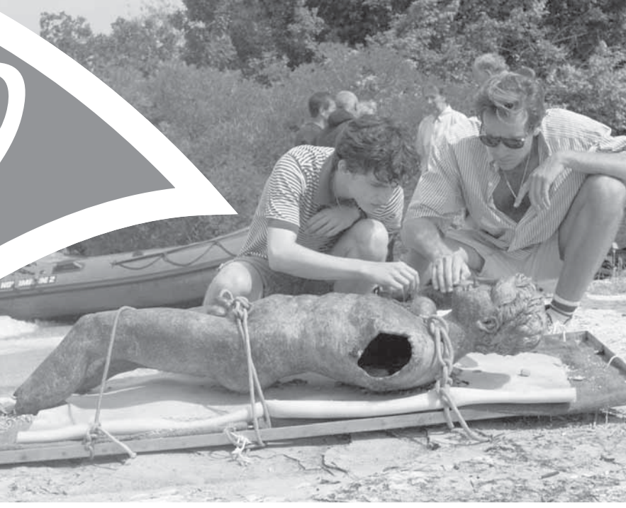
مشهد من فيلم «ناديني بأسمك»