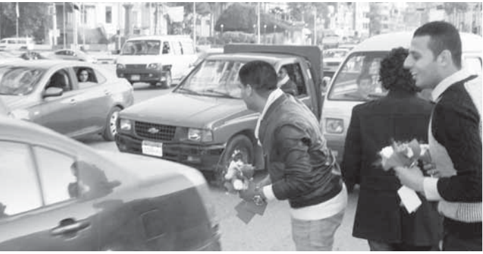
شباب الوفد يقوم بتوزيع الورد على السيارات بالمتصورة