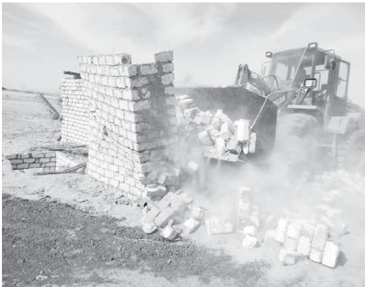
التعديات على اراضى الدولة بالوحدات البحرية

بحالته إلى النيابة العامة. وأكد الداللى أن المحافظة بدأت منذ شهر مايو الماضى حملات متكررة لاستعادة الاراضى المنهوبة بالتنسيق مع الجهات صاحبة الولاية بجميع احياء ومراكز ومدن المحافظة تمت خلالها استعادة عشرات الالاف من الافدنة المنعدى عليها حفاظا على حقوق الدولة والاجيال القادمة. وأضاف اللواء محمد كمال الدالى، محافظ الجزيرة، إن التعديات عبارة عن مبان وغرف وأسوار من البلك الأبيض وسواتر ترابية وأشجار وهساتل نخيل حديثة الزراعة وحفر آبار.