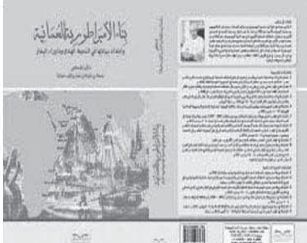
معرض مسقط الدولي للكتاب يشهد فعاليات متعددة وأنشطة حافلة