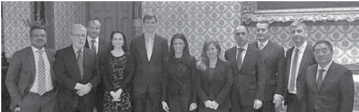
رانيا المشاط تتوسط السفراء

المجال يمثل إضافة كبيرة من شأنها انعاش الحركة السياحية المصرية وتعزيز العديد من الصناعات الأخرى التي لها علاقة بالسياحة.