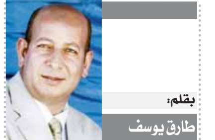
بقلم: طارق يوسف

يوم ١٠ ديسمبر الجاري، ومن المقرر عرضه خلال شهر رمضان المقبل. وقال النجم حمادة هلال، إن شخصية «المداخ 4» هي الأهم في حياته، معتبراً إياها بأنها تيمية حظها، مشيراً إلى أنه يتمنى من الله أن يوقفه ويقدم منها أجزاء كثيرة. وأضاف «هلال» دائماً يهمني في تقديم العمل هو الكتابة ما ألقى قدمه جيداً في الشخصية والعمل ككل، لأن الموضوع ليس متعب على ققط، لكنه متعب على كل من يتواجد في مسلسل المداخ. وتابع، دائماً ما ستأتي المقارنة بين الجزء الجديد والجزء السابق وتكون أصعب لتتركز الناس فيه وحجبتها في العمل، لذلك فأصبح علينا التركيز في العمل للناس الاختلاف، خصوصاً أن المداخ شخصية تستطيع أن تقدم منه أساطير كثيرة وأجزاء أيضاً، فتفاصيل