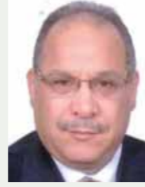
بقلم: حسين حلمي