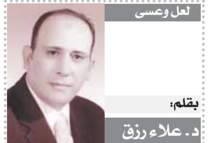
بقلم: د. علاء رزق