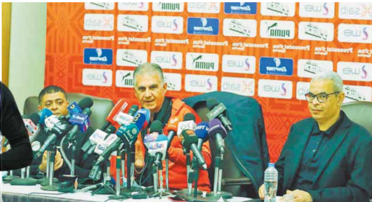
جانب من المؤتمر الصحفي لكيروش