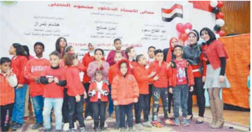
فريق أطفال الكورال من ذوي الهمم