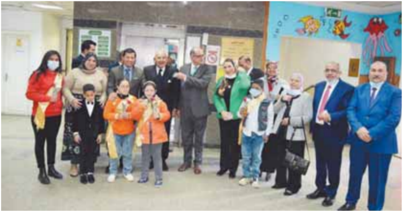
الوزير أشرف صباحي خلال تفقده مركز الطفولة

لا غربة فيما كتبت الحفيدة، فقد ولدت الدكتور سامية بعد رحيل ناجي