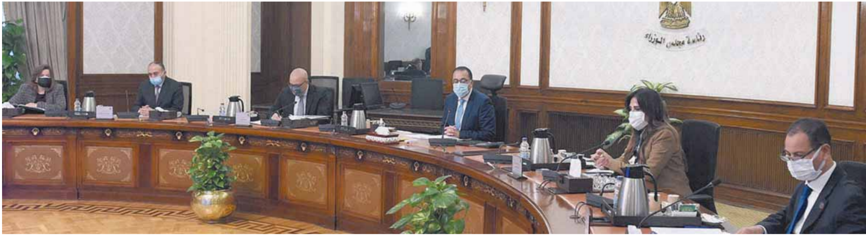
رئيس الوزراء خلال اجتماعه وعدد من الوزراء لتنفيذ تكليفات الرئيس

وكذلك بحضور الدكتور طارق شوقي، وزير التربية والتعليم والتعليم الفني، والدكتورة هالة السعيد، وزيرة التخطيط والتنمية الاقتصادية، والدكتور محمد معيط، وزير المالية، والدكتور صالح الشيخ، رئيس الجهاز المركزي للتنظيم والإدارة، والدكتور رضا حجازي، نائب وزير التربية والتعليم لشئون المعلمين. استعرض الاجتماع الوضع الحالي فيما يتعلق بالعجز في أعداد المعلمين، والاحتياجات الفعلية المطلوبة لسد هذا العجز، موزعة على مراحل التعليم المختلفة، أخذاً في الاعتبار أيضاً الزيادة المتوقعة في أعداد الطلبة على مدار السنوات الخمس المقبلة، وتعويض أعداد المعلمين الذين يحالون إلى المعاش.