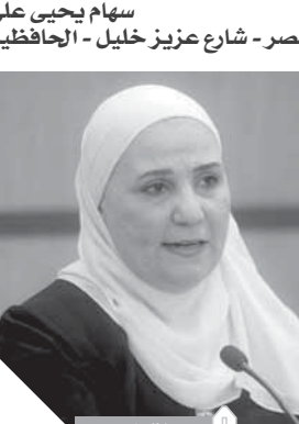
سهام يحيى على شبرا مصر - شارع عزيز خليل - الحافظية

واقفت وزارة الإسكان على منحى شقة بمسكن عثمان عبارة عن غرفة وصالة ولما كانت المساكن الموجودة بها الشقة لا تلائم ظروفى المادية والاجتماعية لأن سنى تجاوزت ٦٩ سنة، لذلك أناشد المهندس عاصم الجزار وزير الإسكان الموافقة على منحى شقة بالإسكان الاجتماعى بالإيجار تكون غرفتين وصالة لظروفي السن وظروفي الصحية في منطقة أقرب من مساكن عثمان.