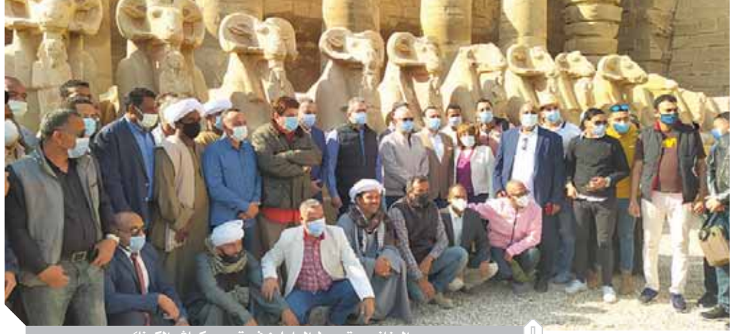
العناني يتوسط العاملين فى ترميم كبش الكرنك

كورونا. وصرح وزير الآثار بأن الوزارة تسعى لتطوير القطاع من خلال التعاقد مع بيت خبرة دولى للتسويق العالمى والاستفادة من النهوض بالسياحة المصرية ووضعا على خريطة العالم بشكل أوسع خلال الفترة المقبلة.