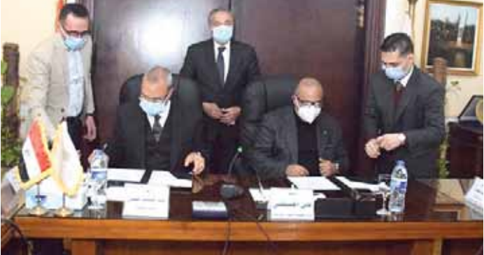
لوجستية على مساحة ١٥ ألف متر، بجانب حديقة على الكورنيش لاستغلالها منطقة ترفيهية بالتعاون مع محافظة القليوبية،

القليوبية، مؤكداً أن التعاون بين وزارة التموين ومحافظة القليوبية والمطورين سيكون له قيمة مضافة حقيقية فى التوسع فى إنشاء المناطق اللوجستية والتجارية على أرض المحافظة مشيراً إلى أنه سبق وتم إعداد خطة استراتيجية بشأن إنشاء المناطق اللوجستية على مستوى الجمهورية، وأنه جارى حالياً تنفيذ العديد من هذه المناطق بالمحافظات المختلفة.