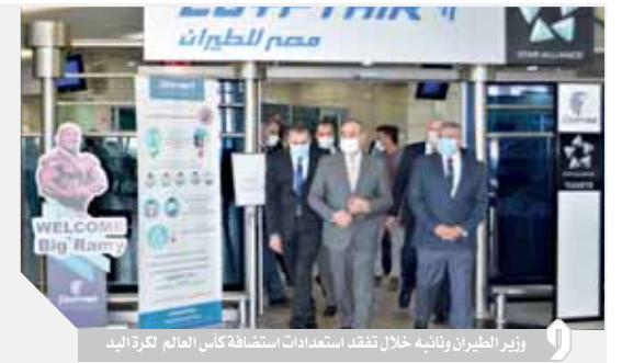
وزير الطيران محمد منار يتفقد استعدادات استضافة كأس العالم لكرة اليد

قدم وزير الطيران محمد منار التهنئة لجميع العاملين ورجال الشرطة بمناسبة حلول العام الجديد وأثنى على جهودهم في ظل انتشار فيروس كورونا المستجد.. جاء ذلك خلال جولة قام بها الوزير والوزير المنتصر مناع نائب وزير الطيران لمركز العمليات التكامل لمصر للطيران (IOCC) ومبنى الركاب رقم (٣) وصالة (٤) بمطار القاهرة الدولية لتابعة حركة العمل داخل المطار، والتأكد من تطبيق كل الإجراءات الاحترازية