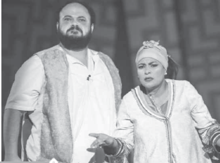
من عروض المسرح القومي في 2018

4 عروض أنتجتها فرقة المسرح الكوميدي خلال هذا العام من بينها 3 عروض مسرحية وهي: «كوميديا البؤساء»، «سيفي مع الموت»، «العشق المسموم»، وأوبريت بعنوان «فرحة شعب».