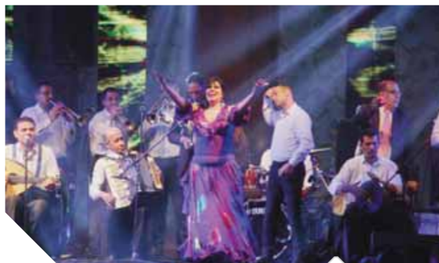
فيفي عبده اثار حالة من الجدل

رشاقفتها بالشكل الذى يسمح لها بأن تمارس الرقص . بينما أكدت ابنتها عزة بعودتها للرقص فى حفل رأس السنة الذى اقيم فى أحد فنادق القاهرة ، ووصف زملاؤها فى الوسط الفننى القرار بأنه مغامرة وجرة كبيرة منها وهى على مشارف العام 66، الفنانة نجوى فؤاد قالت ان قرار فيفى صادم، واضافت انها من اهم راقصات مصر ، وهى مدرسة حقيقية فى الرقص الشرقى لكنها لو كانت فى نفس مكانها لانخرات ان قررت ان تخوض هذه المغامرة فسبقتها الراقصة الراحلة سامية جمال واشتهرت برقصة السبعينات .