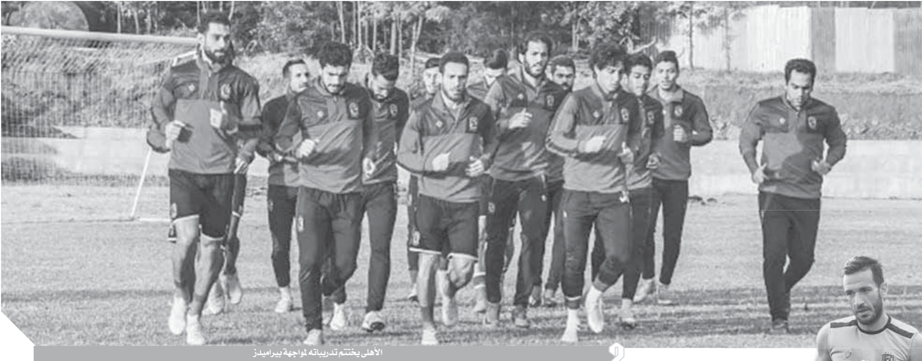
الأهلي يختتم تدريباته لمواجهة بيراميدز