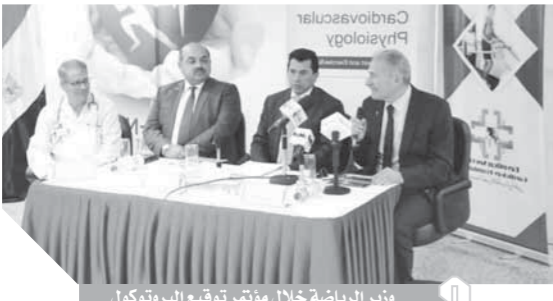
وزير الرياضة خلال مؤتمر توقيع البروتوكول