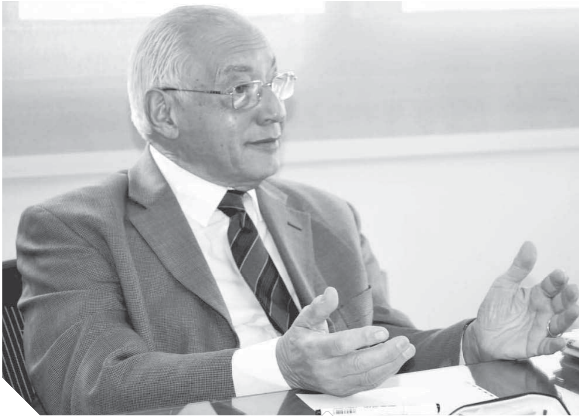
الدكتور على الدين هلال

ويدون دولة قوية لا تنمية ولا استقرار، وتوجد فكرة جوهرية فى ذهنه هى الخوف من سقوط الدول، النزاعات والصراعات الداخلية تزداد وتتحوّل إلى عنف ومواجهات فى الشوارع والتي كانت بدايتها فى مصر إبان 25 يناير 2011 والتي أدت إلى سقوط مؤسسات بالدولة، أما بخصوص ذكره لدولتين شقيقتين مثل السعودية والإمارات فهذا أمر طبيعى، أما بالنسبة لتقطر المقصود أن حتى الدولة المختلفين معها نريد لها الاستقرار ولا نريد لها السوء ولكننا نريد أن تغير بعض سياساتها تجاه مصر والدول العربية الشقيقة.