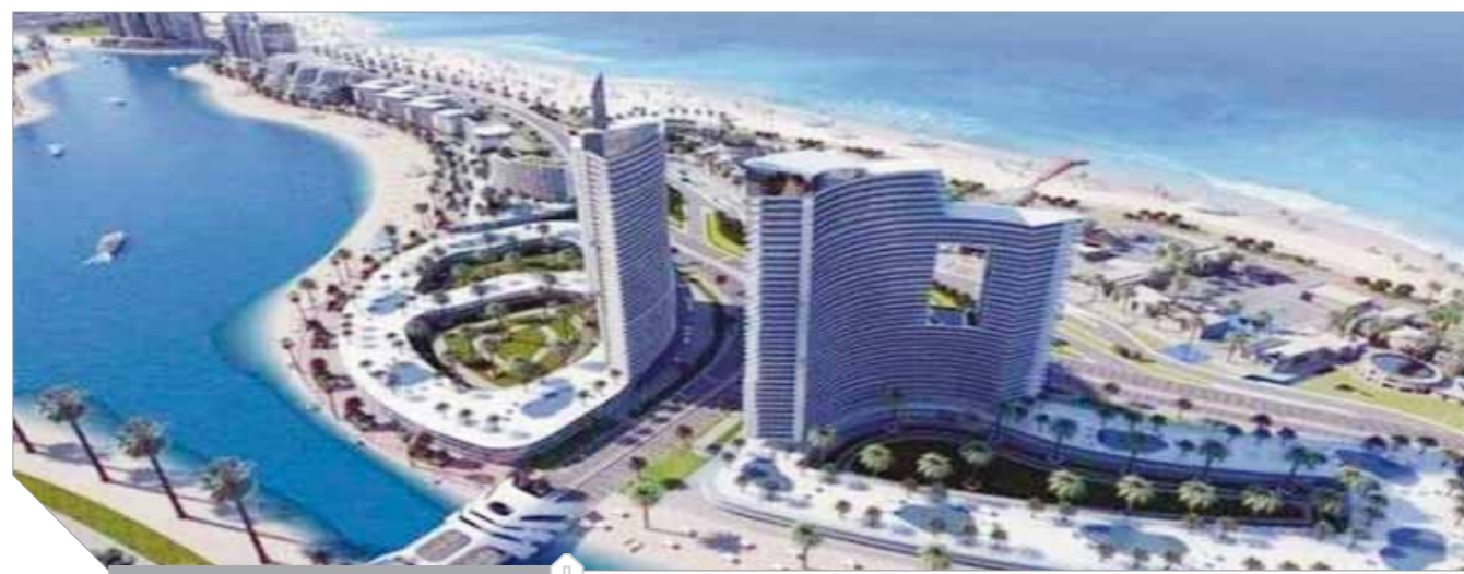
الاستثمار العقاري يقود حركة الاقتصاد

العقار السكنى والتجارى يحتفظان بالصدارة .. ولائحة تنفيذية لقانون منح الإقامة يكسر الركود في شراء العقارات