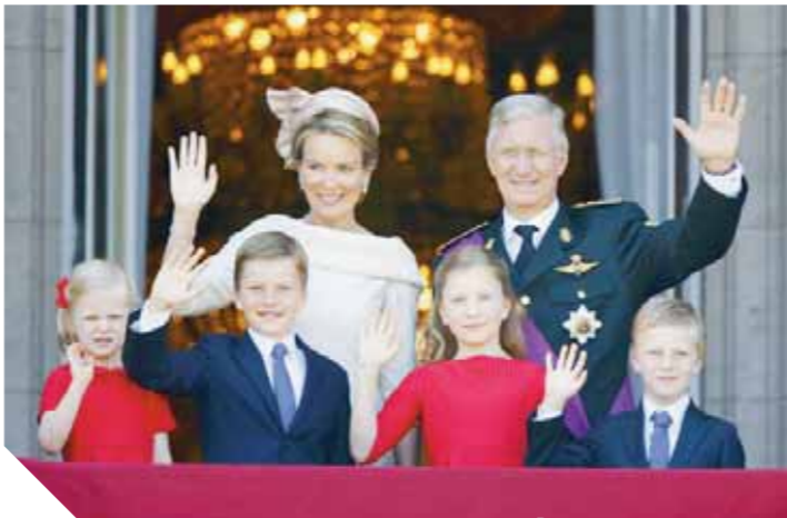
ملك بلجيكا وزوجته وأبنائهما الأربعة

قادمين من محافظة أسوان على متن «هيبية نيلية» وزار الملك وعائلته خلال الرحلة معابد كوم أمبو وإدفو، الى جانب معبد فيلة وعدد من آثار مدينة أسوان. وقامت الأسرة الليلة الماضية بزيارة لمعبد إسنا الأثرى القريب من نهر النيل، كما قامت بجولة سيراً على الأقدام وسط سوق مدينة إسنا، وعلى كورنيش النيل وسط حراسة أمنية مشددة. يذكر أن الأسرة وصلت الى القاهرة مساء الأربعاء الماضى.