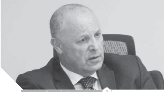
هاني أبو ريدة