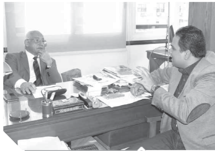
الدكتور على الدين هلال أثناء حوار مع «الوفد».

الوفد حزب الأغلبية بلا منازع ويجب عليه إحياء رموزه التاريخيين