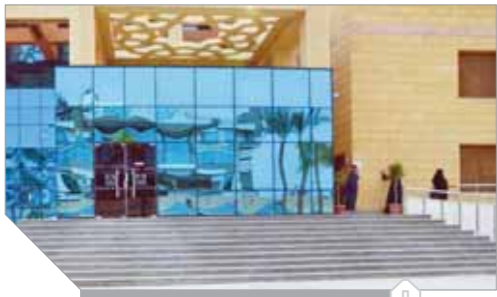
مركز تدريب العاملين ببنية الخدمات العمالية والمدن الجديدة