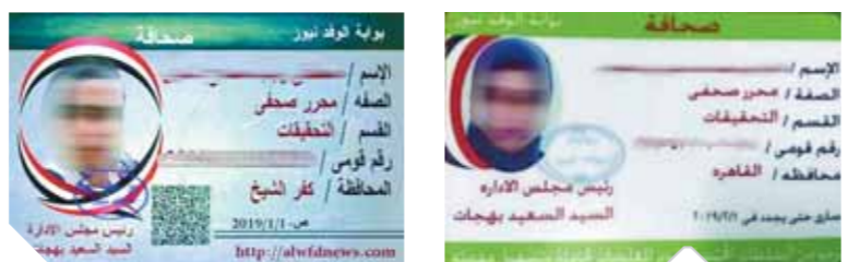
بطاقات صحفية مزورة منسوبة إلى بوابة الوفد الإلكترونية

عادت بوابة الوفد الإلكترونية مزيفة تحمل اسم «بوابة الوفد نيوز»، للظهور مجدداً على شبكة الإنترنت، فى مخالفة صريحة وانتهاك للقانون، ولحقوق الملكية الفكرية للعلامة التجارية لبوابة الوفد، وللشروط المنصوص عليها فى قانون تنظيم الإعلام، فيما يتعلق بتأسيس المؤسسات والوسائل الصحفية والإعلامية والمواقع الإلكترونية. وتتقدم جريدة الوفد، ببلاغ للمجلس الأعلى لتنظيم الإعلام، لاتخاذ الإجراءات القانونية ضد الموقع، خاصة عقب انتشار عدد من