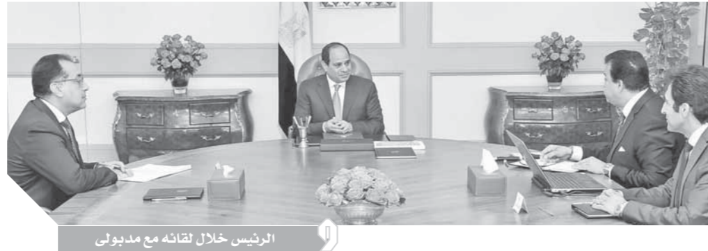
الرئيس خلال لقائه مع مديولى