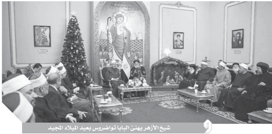
شيخ الأزهر يهنئ البابا تواضروس بعيد الميلاد المجيد

والإخوة الأقباط بعيد الميلاد المجيد. وأعرب فضيلة الإمام الأكبر عن خالص تهانته لقداسة البابا تواضروس وجميع الإخوة المسيحيين بمناسبة عيد الميلاد المجيد، كما قدم التهئة بمناسبة المرق العجيد للكاتدرائية فى العاصمة الإدارية. ورحب قداسة البابا تواضروس الثانى وقدم خالص شكره وتقديره للتهئة القلبية الصادقة من فضيلة الإمام الأكبر والوفد المرافق له، موضحاً أن مشاعر الحب والود المتبادلة نعمة من الله على الشعب المصرى، وتأتى الأعياد والمناسبات الإسلامية والمسيحية كفرصة لإظهار هذه النعمة. وتابع البابا تواضروس أن تعاليم السيد المسيح كلها تدعو للمحبة للأخرين، وهذه المحبة تشر الفرح والسعادة فى المجتمع، وهو ما يعنى أن يسود السلام النفسى والمجتمعي، ولذلك فإن زيارات فضيلة الإمام الأكبر للكاتدرائية فى مختلف المناسبات تسهم فى نشر الفرح والسلام والسعادة فى المجتمع المصرى.