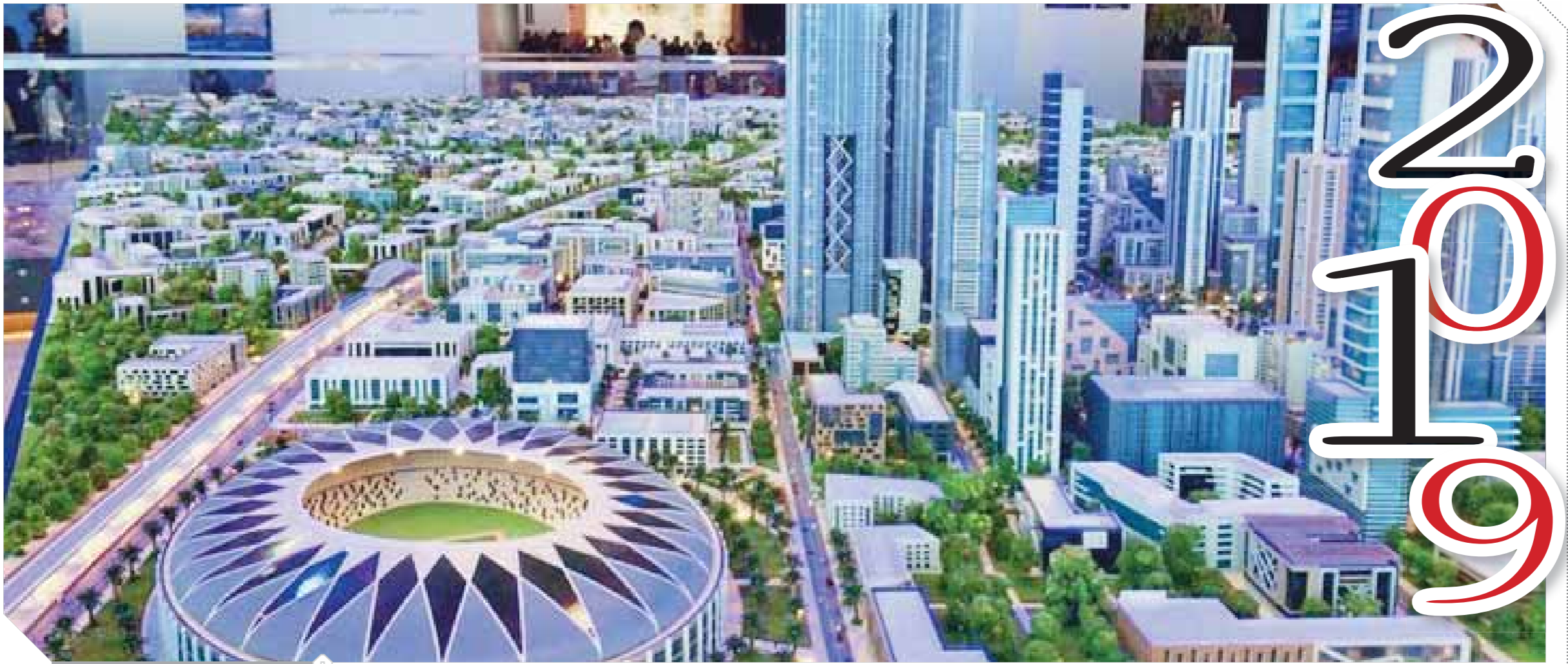
العاصمة الإدارية الجديدة