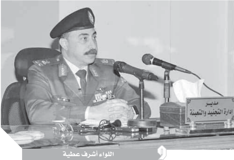
اللواء أشرف عطية