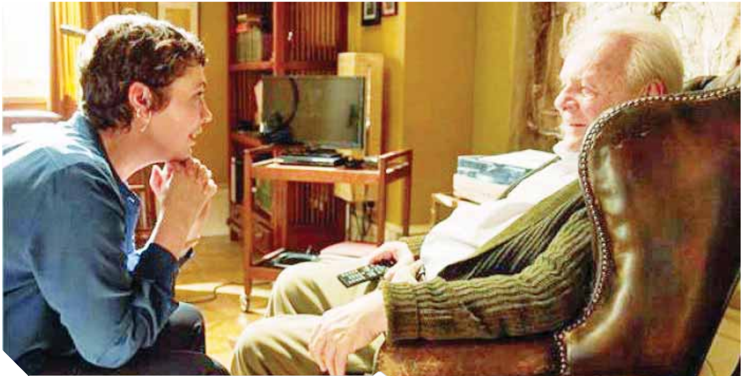
الفيلم الأرجنتيني المحروض في المسابقة غير الرسمية