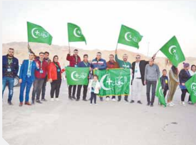
شباب الوفد يرفع علم بيت الأمة في سانت كاترين

عبدالباقي سرور نعيم والزعيم سعد زغلول، عندما تولى الشيخ جمع توكيلات الشعب للزعيم ورفاقه لتمثيل الأمة في مؤتمر الصلح بباريس، وكان الشيخ مسؤولاً عن مديرية البحيرة، فقد التقى بالزعيم في القاهرة وعاد إلى البحيرة حاملاً عشرات الآلاف من التوكيلات، وتمكن من جمع التوكيلات وإعادتها إلى إدارة الوفد ماهرة بتوقيعات ويصمات واختام أبناء البحيرة. ● لم يكتف الشيخ عبدالباقي سرور نعيم بجمع التوكيلات ولكنه تولى قيادة المظاهرات الأولى في مارس ١٩١٩ ليقود الثورة الأم في البحيرة، ليتم القبض عليه، وتثور البحيرة ويقرر المتظاهرون التجمع في مهنور يوم ٢١ مارس، ولم يبرحها إلا بعد الإفراج عن الشيخ عبدالباقي الذي أصبح يقود ثورة ١٩١٩ في البحيرة. ● من الوثائق التي تلقيتها من الأسرة ما كتب عن الشيخ عبدالباقي أنه تم تقديمه لمحاكمة عسكرية أقامها الاحتلال لمحاسبة قيادات الثورة عقب تطبيق