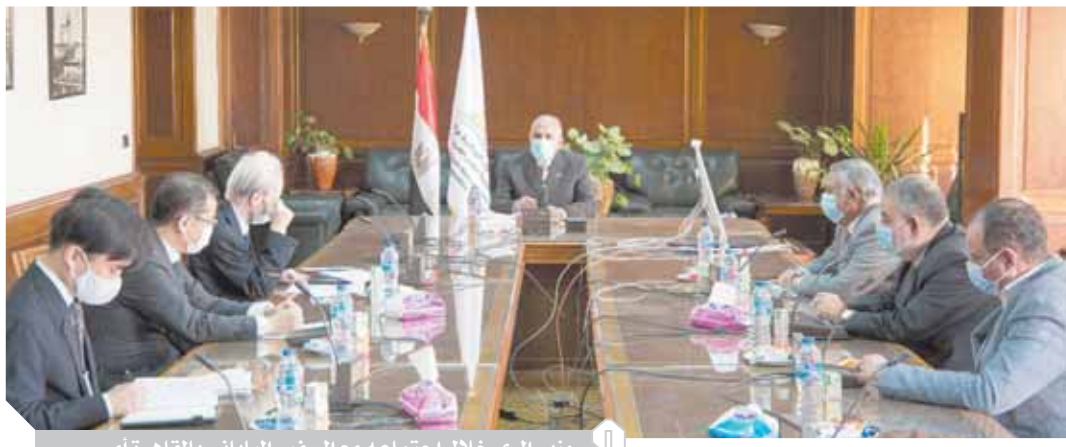
وزير الري خلال اجتماعه مع السفير الياباني بالقاهرة أمس

كتبت: نغم هلال، استعرض الدكتور محمد عبدالعاطي وزير الموارد المائية والري مع نوكي مساكى سفير اليابان بالقاهرة الموقف الراهن، إزاء المفاوضات الخاصة بسد النهضة الإثيوبي، ورغبة مصر الواضحة في استكمال المفاوضات، مع التأكيد على ثوابت مصر في حفظ حقوقها المائية وتحقيق المنفعة للجميع في أي اتفاق حول سد النهضة، والتأكيد على السعي للتوصل لاتفاق قانوني عادل وموزن للجميع يلبى طموحات جميع الدول في التنمية.