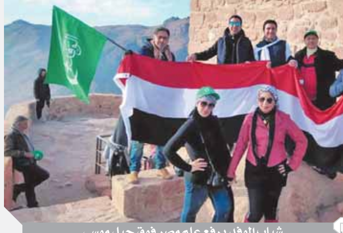
شباب الوفد يرفع علم مصر فوق جبل موسى

كتب: محمود عبد المنعم، اختتم أول فوج سياحي من حزب الوفد زيارته التي استهدفت منطقة مشروع التجلى الأعظم فوق أرض السلام بمنطقة الأراضي المقدسة جبل موسى ودير سانت كاترين والتي استمرت ثلاثة أيام بالتقاط الصور التذكارية بعلم مصر وعلم حزب الوفد.