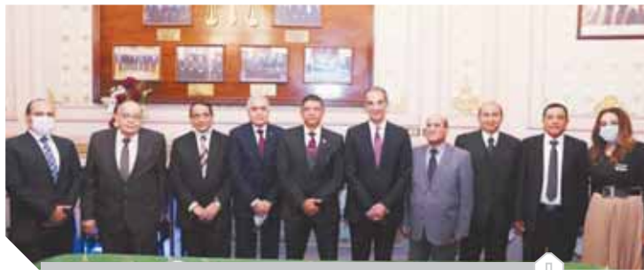
وزير الاتصالات مع رئيس محكمة النقض وعدد من المستشارين

وأناط الطرفان توقيع البروتوكول، المستشار محمد حسن عبداللطيف نائب رئيس محكمة النقض ورئيس العلاقات الدولية، والمهندسة غادة لبيب وزير الاتصالات وتكنولوجيا المعلومات للتطوير