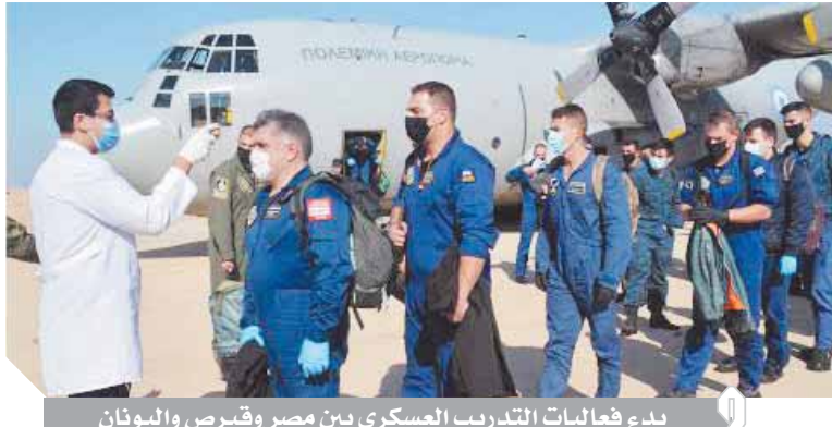
بدء فعاليات التدريب العسكري بين مصر وقبرص واليونان

الأنشطة، منها قيام القوات المشاركة فى التدريب بأعمال التخطيط وإدارة أعمال قتال بحرية وجوية مشتركة لصقل مهارات القادة والضباط فى إدارة العمليات المشتركة، وكذا تبادل الخبرات بين القوات المشاركة، وصولاً إلى أعلى معدلات الكفاءة والاستعداد لتنفيذ أى مهام مشتركة تحت مختلف الظروف، خاصة فى ظل ما تشهد الساحة الإقليمية والعربية من متغيرات سريعة ومتلاحقة. وأعرب المشاركون فى التدريب من كل الدول عن مساهمتهم بحفاوة الاستقبال والتنظيم الجيد، الذى يأتى فى ضوء تنامي علاقات الشراكة والتعاون العسكري بين القوات المسلحة المصرية والدول الصديقة والشقيقة، وتسويق الجهود والعمل المشترك لمواجهة التحديات بمنطقة البحر الأبيض المتوسط.