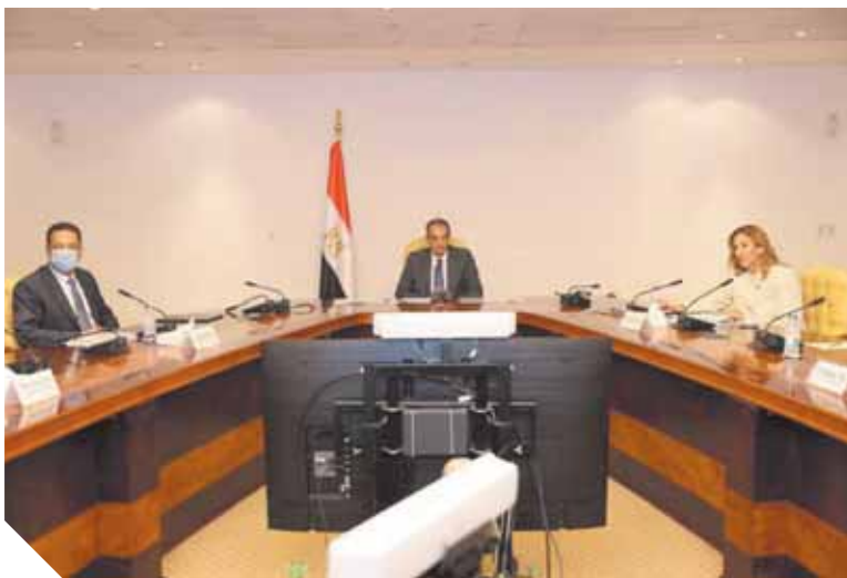
العلية في كندا طبقا لتصنيف & News S.U Rankings Report World.

وقد مذكرة التقام المهندس رأفت هندی، نائب وزير الاتصالات وتكنولوجيا المعلومات للبيئة التحتية، والدكتور جاك فرمون، رئيس جامعة أوتاوا الهندسة، وشارك في حفل التوقيع الافتراضي المهندس عمرو محفوظ الرئيس التنفيذي لهيئة تنمية صناعة تكنولوجيا، وشيرين الجندي، مساعد وزير الاتصالات وتكنولوجيا المعلومات للاستراتيجية والتشغيل، والدكتور أحمد طنطاوى المشرف على مركز الابتكار التطبيقي، وعدد من قيادات وزارة الاتصالات وتكنولوجيا المعلومات، وأساتذة الهندسة وعلوم الحاسب، والمستشارين الأكاديميين للوزارة، والدكتور ساني بابا نائب رئيس جامعة أوتاوا للشؤون الدولية والفرانكفونية، والدكتور جاك بوفيه عميد كلية الهندسة بجامعة أوتاوا.