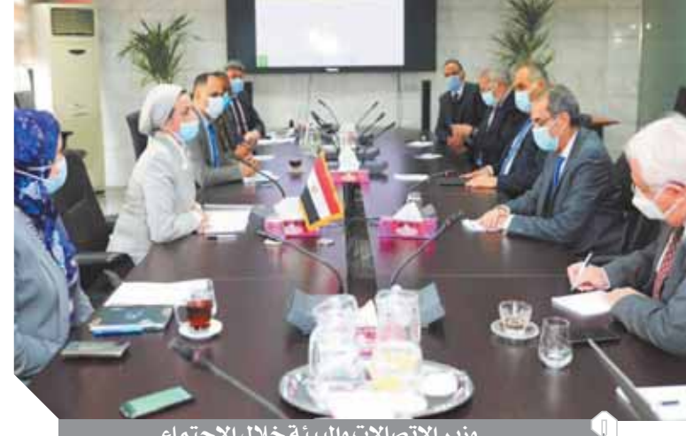
وزير الاتصالات والبيئة خلال الاجتماع

أشار المهندس خالد المعطار، نائب وزير الاتصالات وتكنولوجيا المعلومات لتنمية الإدارية والرقمي والميكنة، إلى أن هناك اتفاقاً بين الحكومتين المصرية والسويسرية لتنظيم العمل في مجال المخلفات الإلكترونية والعرض منه هو تقديم أكبر قدر من المخلفات الإلكترونية للمصانع وأن يتم