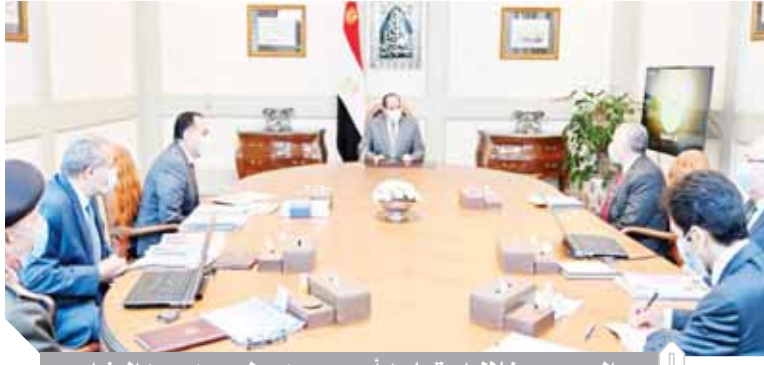
«السياسى» خلال إجتماعه أمس مع مديولى وعدد من الوزراء

فيها المشروع القومى للبتلو، ومشروع ملء الفراغات واستكمال الطاقات الإنتاجية، بالمزارع بهدف زيادة الثروة الحيوانية، ومشروع التحسين الوراثى، وجهود تطوير الحجر البيطرى والمجازر الآلية، والتعاون القائم فى هذا الصدد بين وزارة الزراعة وجهاز مشروعات الخدمة الوطنية، حيث وجه الرئيس بزيادة أعداد القوافل الطبية البيطرية على مستوى المحافظات للتحسين والكشف عن أمراض الحيوان فى المزارع حفاظاً على قيمة الثروة الحيوانية.