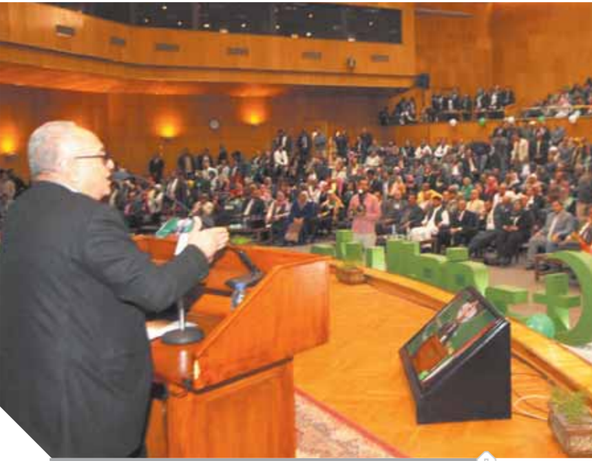
أبوشقة خلال إلقاء خطابه أمام الجماهير الحاشدة بجامعة أسبوط

«أبوشقة»: الوفد داعم للدولة المصرية والمشروع الوطني للرئيس «السيسي»