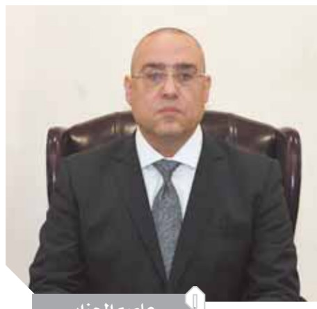
كتبت - ياسمين سعيد:

الإسكان: هيئة المجتمعات العمرانية الجديدة تشارك في مؤتمر ومعرض Cairo ICT