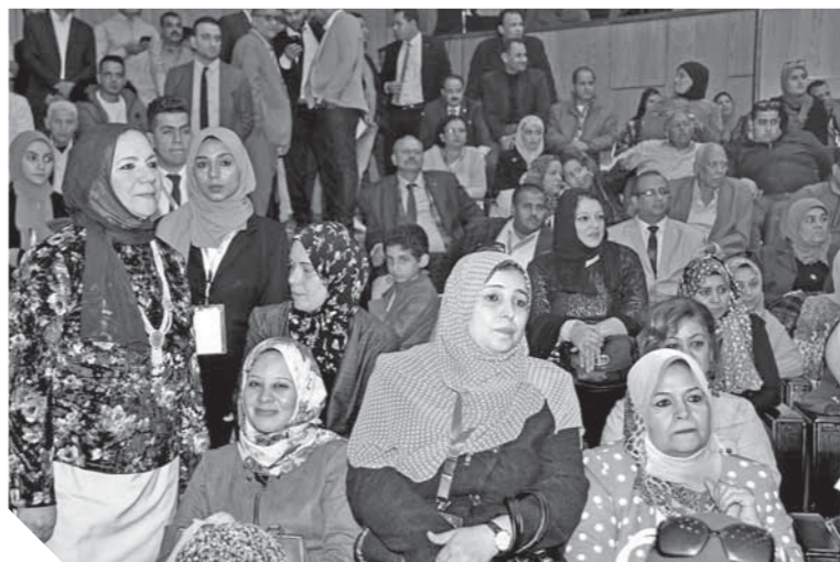
المرأة المصرية حثيطة بالتمتع بالغ في عهد السيسي