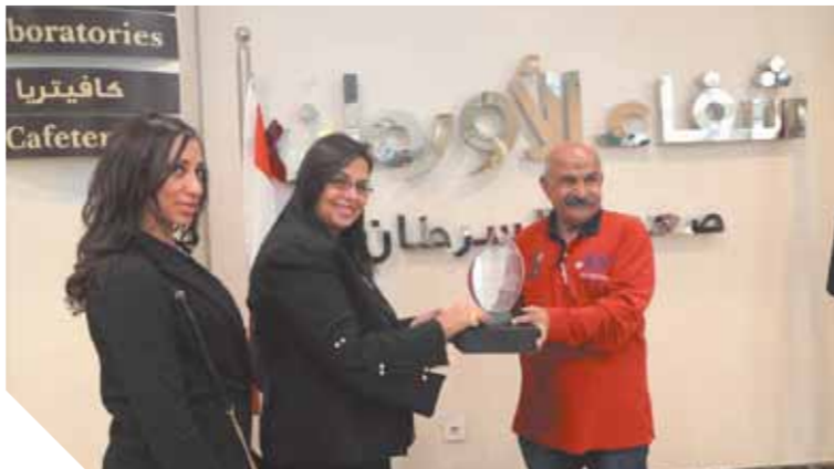
كتب: أحمد جمال؛

تقديم الدعم لأول صرح طبي لعلاج السرطان في الصعيد مصر. وقدم وفد الشركة خلال الزيارة الهدايا لمرضى السرطان في مختلف أقسام المستشفى من غرفة العلاج الكيماوي والعلاج الإشعاعي وغرف العمليات والإقامة الداخلية، وسط أجواء من البهجة والسعادة وحسن استقبال المرضى لوفد الشركة، كما قدم