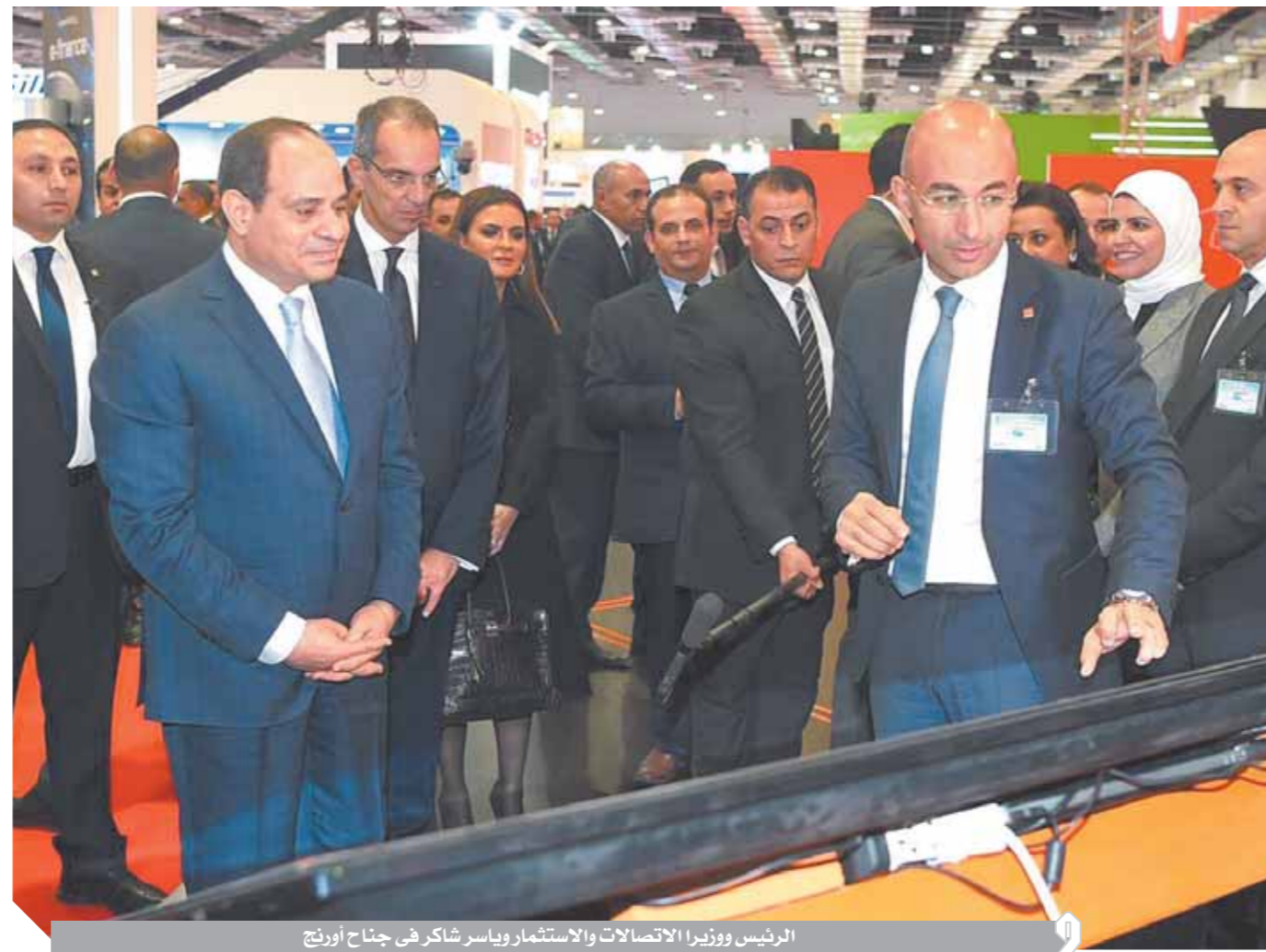
الرئيس وزير الاتصالات والاستثمار ياسر شاكر في جناح أورنج

في مجال النقل والمواصلات على رأسها شركة مواصلات مصر. ويهدف التحالف إلى تقديم المنصة المتكاملة لحلول النقل الجماعي الذكي بجمهورية مصر العربية.