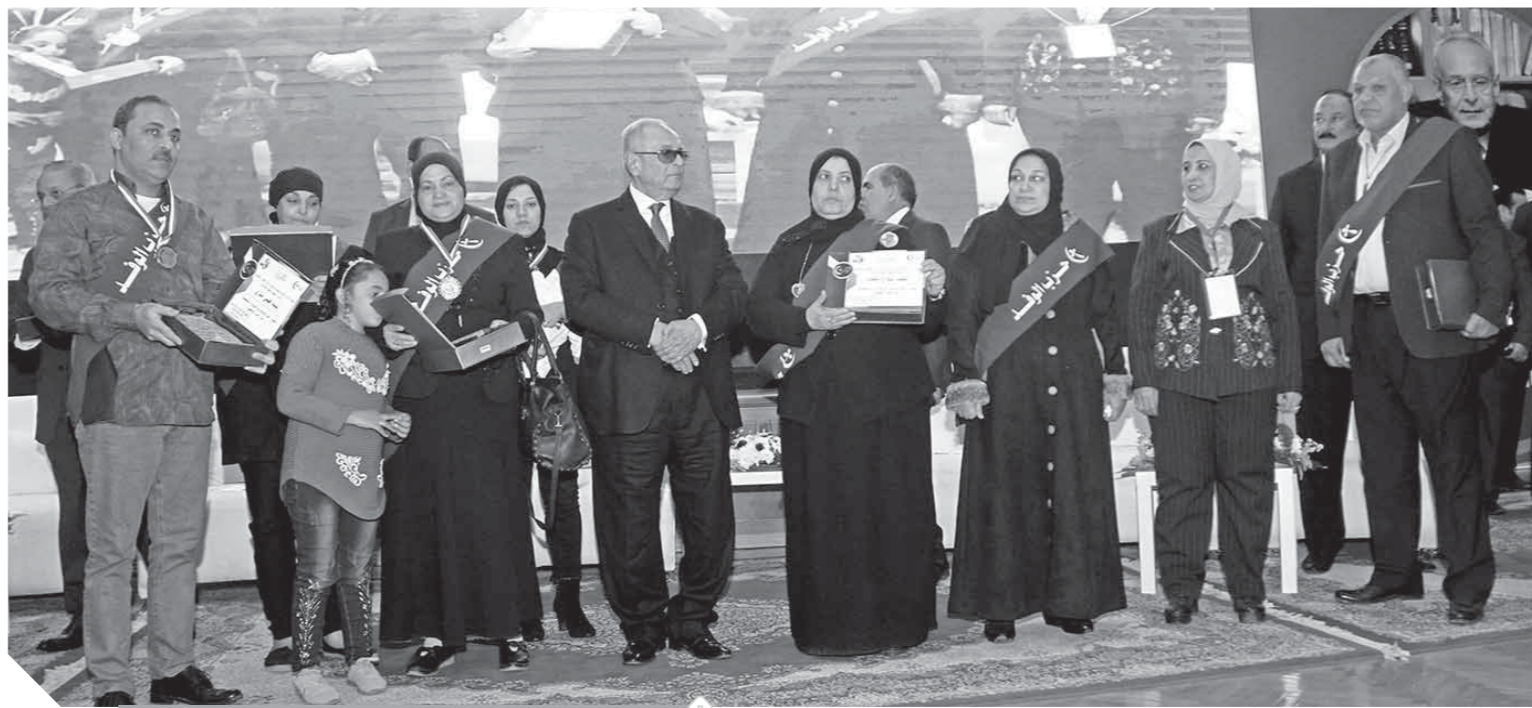
أبوشقة، خلال تكريم أسر الشهداء

وكان من بينها سقوط الدولة المصرية كما سقطت دول مجاورة مثل ليبيا والعراق وسوريا، لكن إرادة المصريين وخبرتهم ووعيهم كانت الصخرة الصلبة التي تحطمت عليها تلك المؤامرات، وكانت تلك الإرادة التي تجلت في ثورة ٢٥ يونيو بخروج ٣٣ مليون مصري في وقت واحد وفي كل ربوع مصر يضحون بكل ما يملكون لحماية الدولة المصرية. وعندما نقول إن ثورة ٢٥ يونيو هي الوجه الآخر لثورة ١٩١٩ فإن هذا الأمر لأنها ثورة شعبية وطنية وكنة أمام جيش وطني وشرطة وطنية وفقاً إلى جوار هذه الإرادة فتحية من القوات المسلحة والشرطة وشهدائهم.