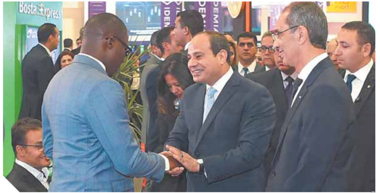
كتب - ناصر عبد المجيد:

٢٣ مؤتمر القاهرة الدولي للاتصالات وتكنولوجيا المعلومات - وهو الملتقى الذي يعقد سنوياً تحت رعايته - يؤكد اهتمام الرئيس «السيسي» بالرقمنة والتكنولوجيا الحديثة في كافة قطاعات الدولة. وأضاف في تصريحات على هامش افتتاح الرئيس للمؤتمر أن ذلك يأتي في إطار استراتيجية بناء الإنسان المصري، ومواكبة العصر، والارتقاء بالخدمات المقدمة للمواطنين والتحول الرقمي، وكذلك فصل مقدم الخدمة عن طالبها، لتحديد العامل البشري في إطار جهود الدولة، لتنفيذ خطة الإصلاح الشامل للجهات الإدارية للدولة. وشدد المتحدث على اهتمام الرئيس بمواكبة التطور والنقل للعاصمة الإدارية الجديدة، والذي لن يكون نقلاً جغرافياً فقط، وإنما يواكب التنمية ومن جانبه، أكد السفير بسام راضي، المتحدث الرسمي باسم رئاسة الجمهورية، أن افتتاح الرئيس الدورة