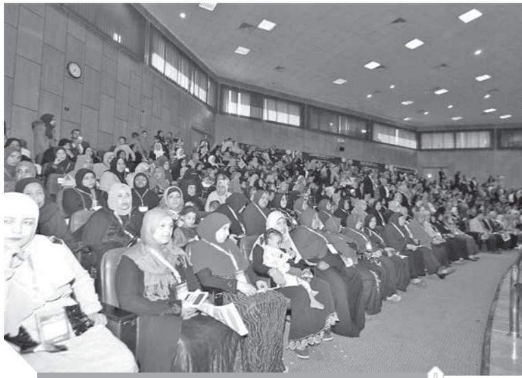
جانب من السيدات أثناء الخطاب