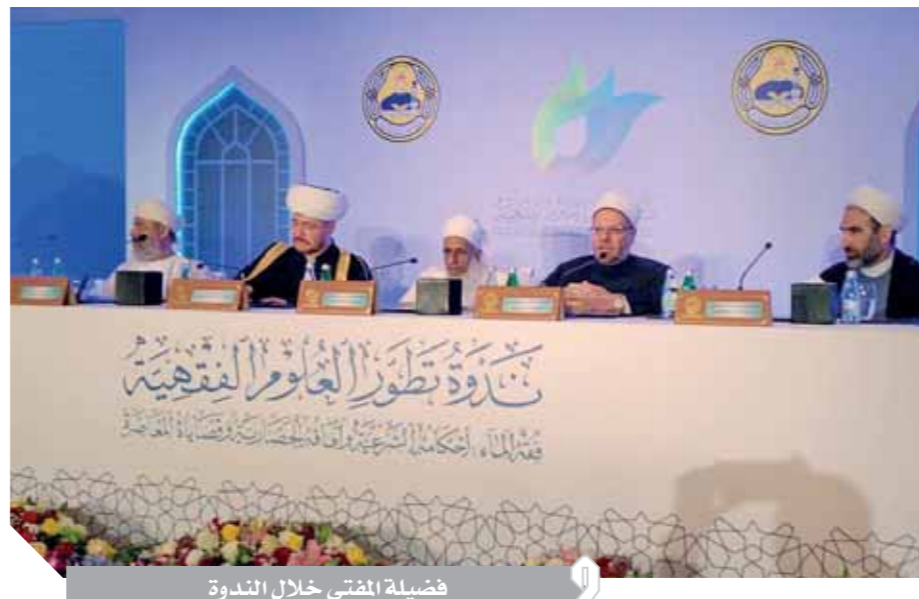
فضيلة المفتي خلال الندوة

أكد الدكتور شوقي علام، مفتي الجمهورية، أن الماء هو أساس الحياة على الأرض، كما أكد أن الحياة كلها تتوقف على الماء، والأصل أن يكون الماء مشاعاً بين الناس، ولا يتم احتكاره. وأشار المفتي في كلمته بالنود الدولية حول «تطور العلوم الفقهية» المنعقدة في سلطنة عمان، إلى أن القوانين الدولية اهتمت بعقد الاتفاقيات والمواثيق الدولية للحفاظ على الحقوق المشتركة بين دول المنبع ودول المصب، بما لا يضر بمصالح الشعوب، ويحقق أفضل استغلال للموارد المائية، كما أشار إلى أن الصراعات تنشأ بين الدول وتنفجر الحروب بسبب الطمع والخروج عن المواثيق والمعاهدات الدولية. ووصف المفتي آيات المياه في القرآن الكريم، بأنها نبع ثرى للأبحاث التي تبرز الجوانب الحضارية لقضايا المياه، من خلال تدبر آيات القرآن الكريم. كما وصف قضية التجديد والتطوير في البحوث الفقهية بأنها ضرورة الضرورات حالياً