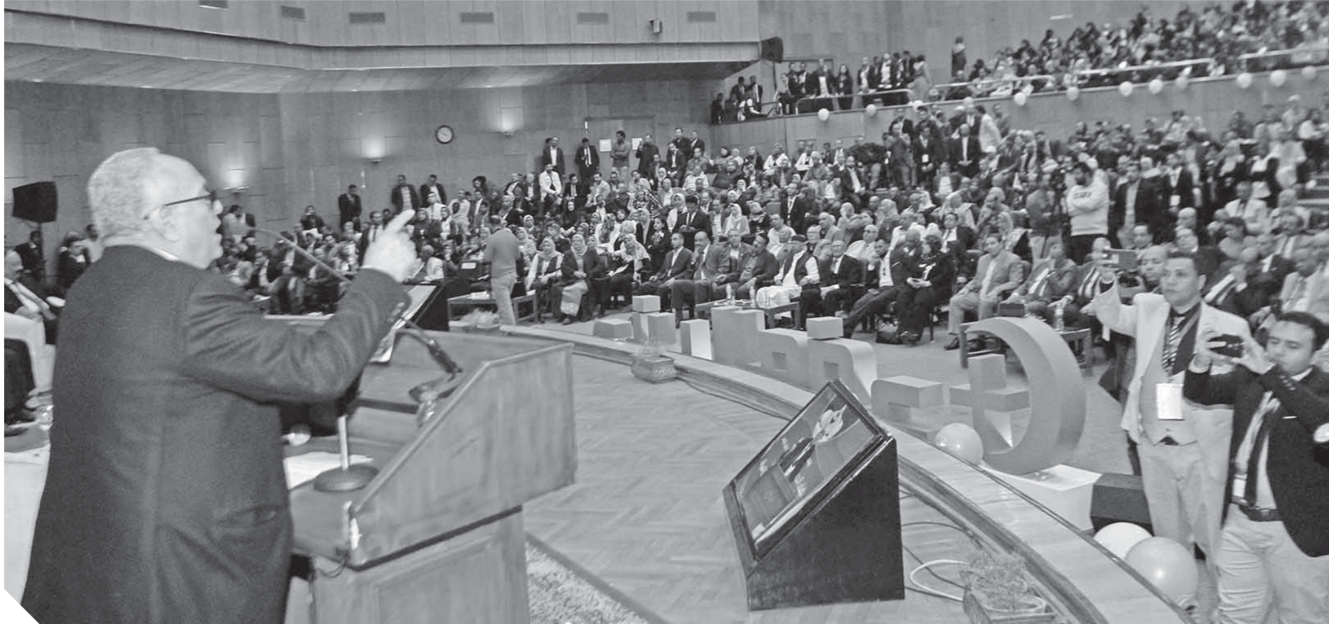
أبو شقة أثناء إلقاء خطابه في جامعة أسيوط