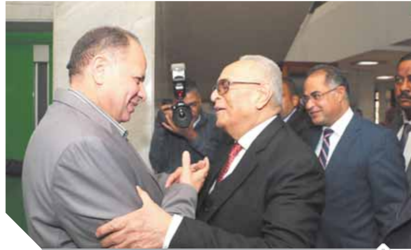
استقبال حار من اللواء عصام سعد محافظ أسبوط للمستشار أبوشقة

أطالب الإعلام بالتسلح بالوعى والخبرة لمواجهة حروب الجيل الرابع