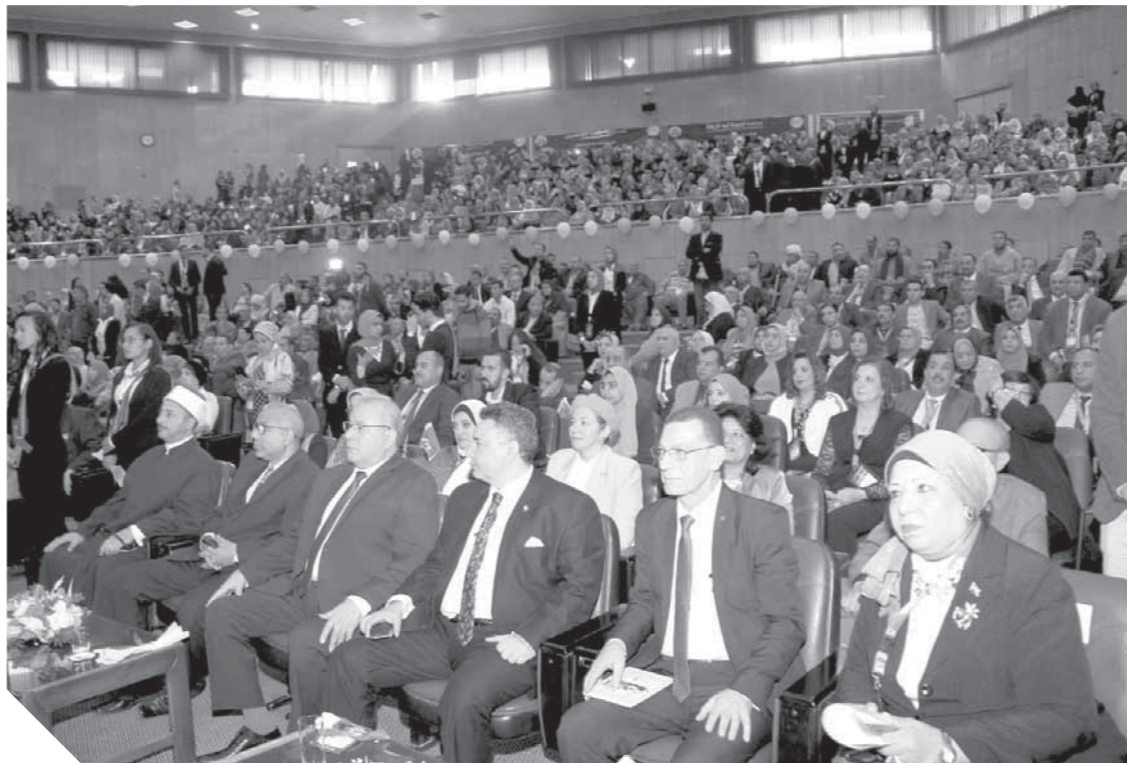
جانب من الحضور في المؤتمر الجاشد بجامعة أسبوط