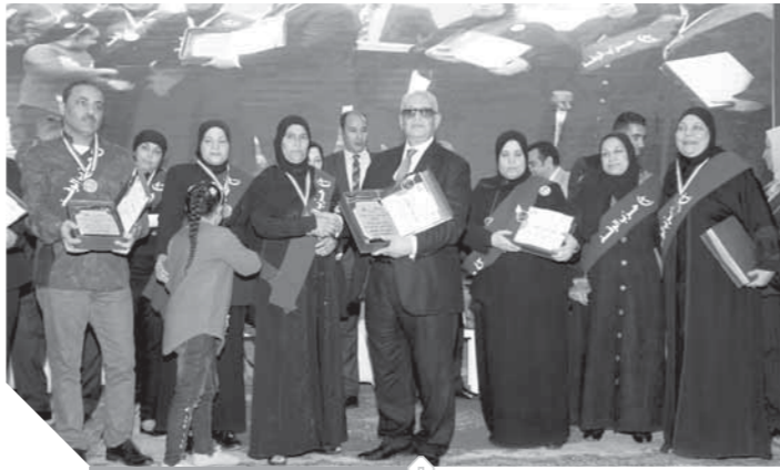
أبوشقة بين أسر الشهداء

ورحب محافظ أسيوط بالمستشار بهاء الدين أبوشقة والوفد المرافق له، مثنياً جهود ومبادرات الحزب لدعم قضايا المرأة وتمكينها اقتصادياً واجتماعياً، مشيراً إلى أهمية المشاركة المجتمعية والدور الذى تلعبه الأحزاب السياسية فى دعم مشروعات وخطط التنمية المستدامة، وبخاصة برامج تنمية الصعيد التى