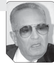
بهاء الدين أبو شقة