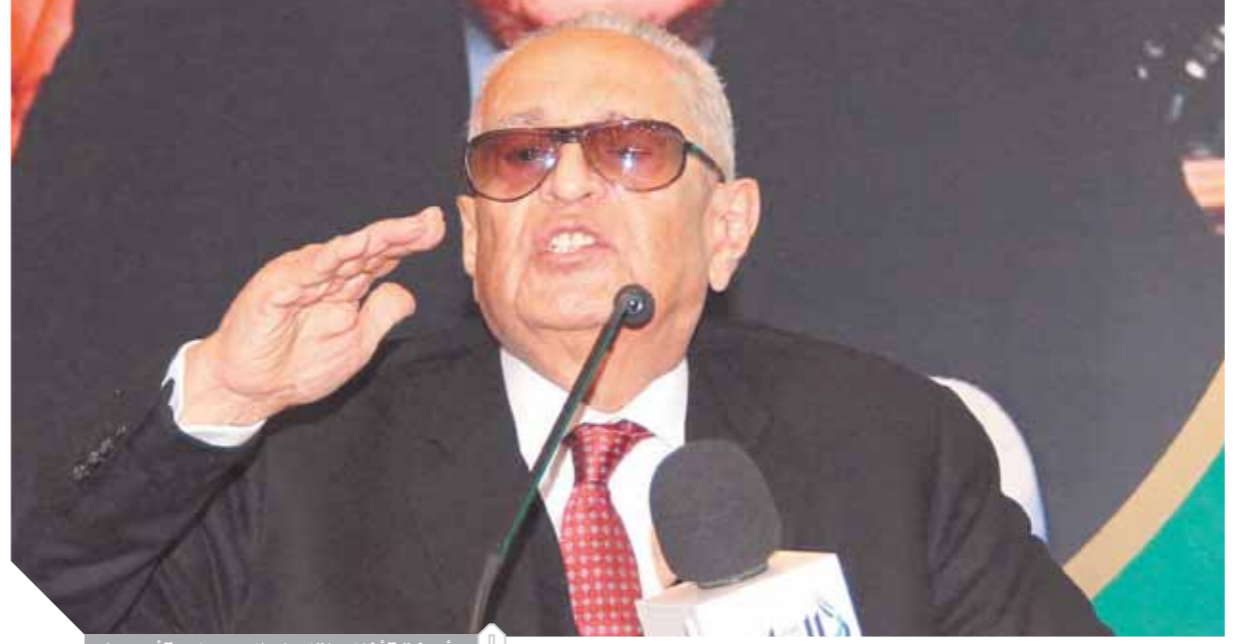
أبوشقة أثناء إلقاء خطابه بجامعة أسبوط

«أبوشقة»: الوفد داعم للدولة المصرية والمشروع الوطني للرئيس «السيسي»