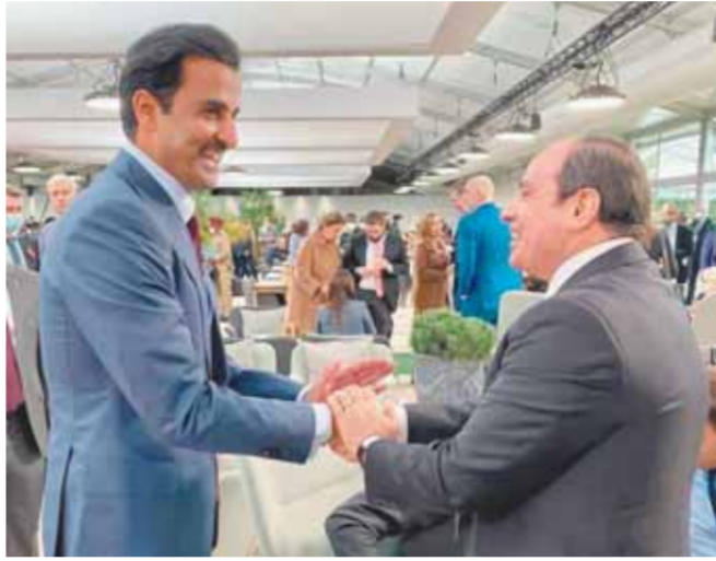
وخلال استقبله أمير قطر