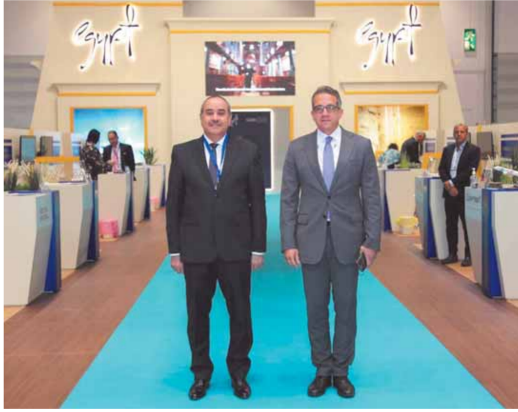
العناني ومنار في افتتاح الجناح المصري

بمشاركة أكثر من ١٤٠ دولة من مختلف دول العالم انطلقت أمس بورصة لندن السياحية WTM بعد توقف عامين بسبب تداعيات فيروس «كورونا»، حيث تم عقدها العام الماضي افتراضياً. وتعد بورصة لندن السياحية إحدى أهم البورصات السياحية الدولية بعد بورصة برلين ويشارك هذا العام في أكبر تجمع سياحي يمثل كبرى الشركات ومنظمي الرحلات العالميين واتحادات السياحة والسفر الدوليين وصناع القرار السياحي في العالم وكوكلاء السياحة والسفر من مختلف دول العالم. وشارك مصر بوفد رفيع المستوى برئاسة الدكتور خالد العناني وزير السياحة الذي افتتح الجناح المصري يرافقه الطيار محمد منار وزير الطيران المدني، كما شارك في الافتتاح اللواء خالد فودة محافظ جنوب سيناء وعمرو القاضى رئيس هيئة تشييط السياحة وأحمد الوصيف رئيس الاتحاد المصري للفرق السياحية. ويضم الجناح المصري عشر شركات سياحية وسبعة فنادق مصرية، حيث صمم الجناح المصري على شكل معبد فرعونى يمزج ما بين الماضى والحاضر ليعبر عن الروح المصرية المعاصرة.