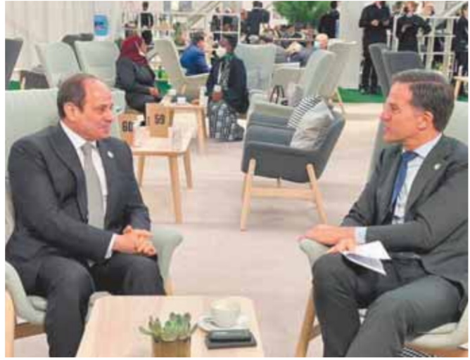
وخلال استقبله رئيس وزراء هولندا

كتب - ناصر عبدالمجيد: عقد الرئيس عبدالفتاح السيسي أمس سلسلة لقاءات مع زعماء وقادة العالم خلال مشاركته في قمة الأمم المتحدة لتغير المناخ في جلاسجو. واستعرض «الرئيس» خلال اللقاءات الدور الرائد لمصر في الدفاع عن قضايا البيئة، والجهود الرامية لحل الأزمات العربية والإقليمية والدولية. كما تناولت اللقاءات سبل دفع أطر التعاون الثنائي وكذلك التشاور وتبادل وجهات النظر والرؤى بشأن مختلف القضايا. وجاءت لقاءات الرئيس على التوالي مع عبدالحميد البديبة رئيس الحكومة الليبية، ومحمد اشتية رئيس الوزراء الفلسطيني، ونجيب ميقاتي رئيس الوزراء اللبناني، والسيدة أورسولا فون دير لاين رئيس المفوضية الأوروبية. كما التقى الرئيس مع المستشارة الألمانية أنجيلا ميركل، والأمير تميم بن حمد آل ثاني أمير دولة قطر، والشيخ صباح الخالد الصباح رئيس مجلس الوزراء الكويتي، والرئيس أرمنين سرغسيان رئيس جمهورية أرمينيا، ورئيس وزراء بريطانيا بوريس جونسون.