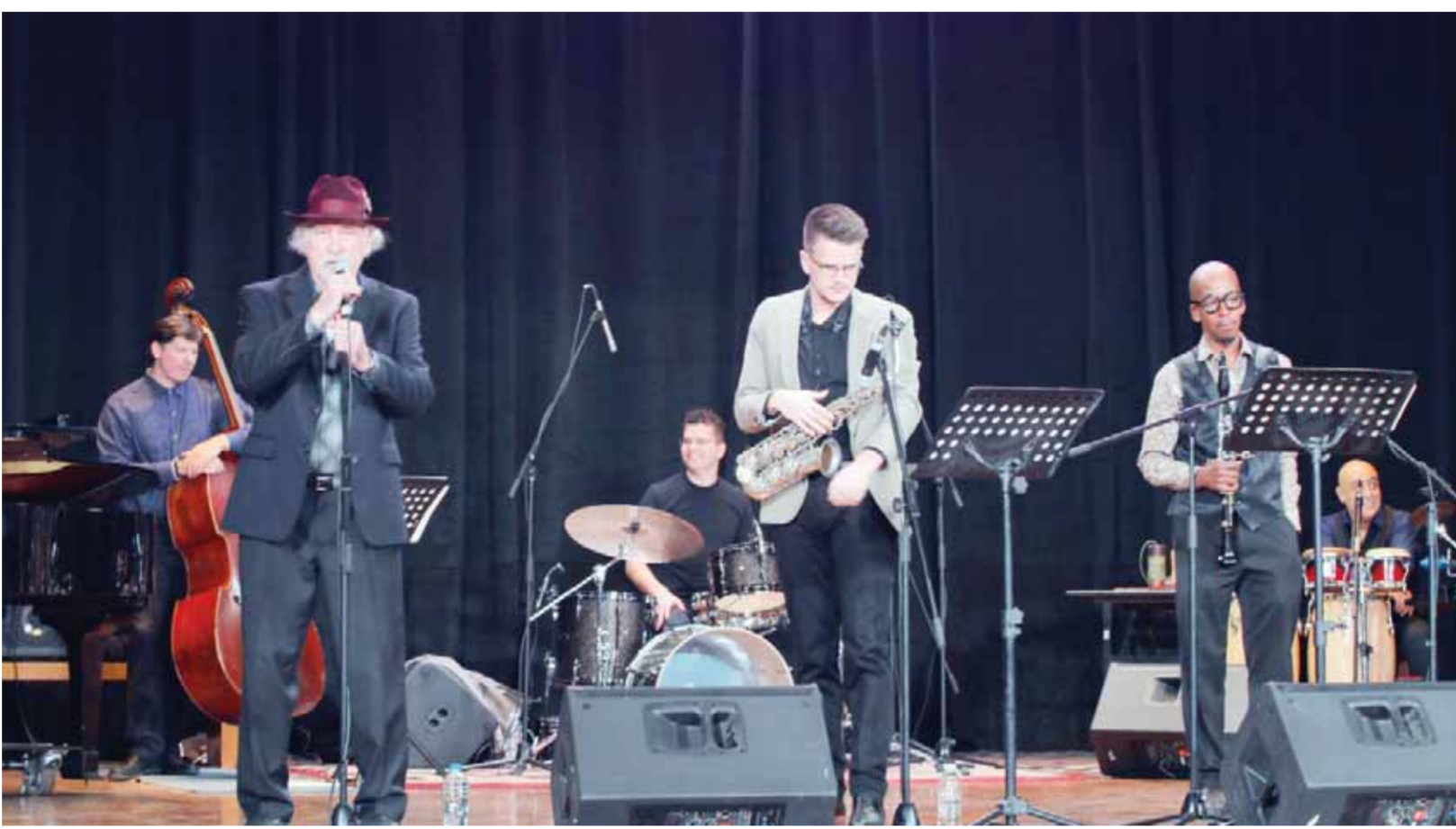
أساطير الجاز فى العالم على أرض الكنانة