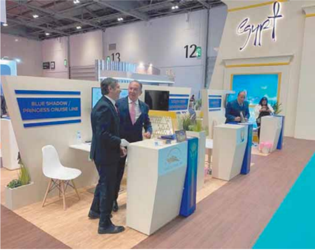
المستثمرون داخل الجناح المصري