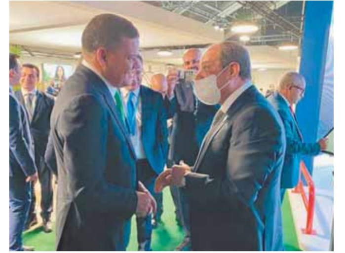
الرئيس خلال استقبله رئيس الحكومة الليبية