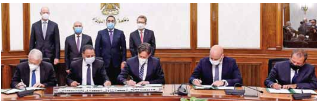
رئيس الوزراء يشهد توقيع عقد صيانة وتنفيذ الخط الأول للقطار الكهربائى «السخنة- مطروح»

وقال رولاند بوش، الرئيس والرئيس التنفيذي لشركة سيمس AG: «تفخر سيمس بنظم النقل بدعمها لمطوحات ووجود الحكومة المصرية لتطوير قطاع النقل فى البلاد، عن طريق إقامة أول منظومة للقطار الكهربائى السريع فى مصر، مؤكداً أن هذا المشروع الاستراتيجى سيخلق العديد من الوظائف، وسيدعم النمو الاقتصادى، كما سيعمل على تحسين جودة حياة ملايين المصريين، من خلال توفير نظام فعال وآمن ومتطور للنقل».