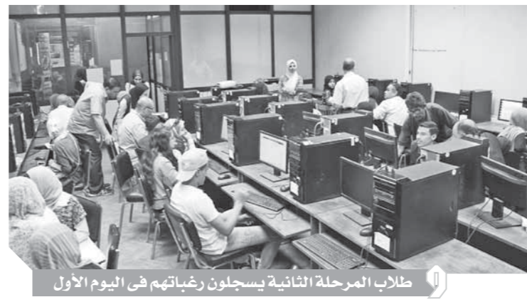
طلاب المرحلة الثانية يسجلون رغباتهم في اليوم الأول