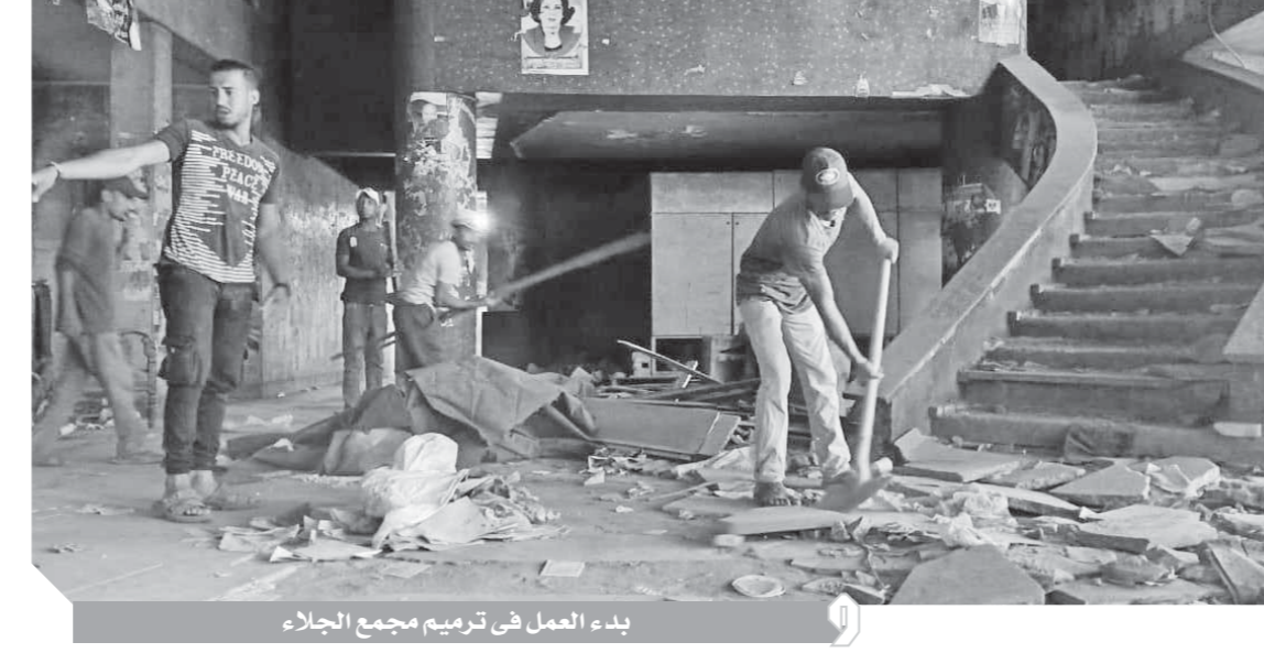
بدء العمل في ترميم مجمع الجلاء