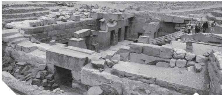
آثار إبيدوس بالبلينا

لجاهزية المواقع الأثرية والسياحية استعداداً للموسم السياحي القادم، خاصة معاديب فيلة ومتحف النوبة والذين طالبا بوضعهما على خارطة الزيارات السياحية لما يتعمنان به من قيمة أثرية مهمة، تضم أكثر من ٣ آلاف قطعة أثرية. وأضاف المحافظ أنه سيتم مراجعة جاهزية باقي المزارات الأثرية والمعالم السياحية، بدءاً من معاديب أبوسمبل وإدفو وكوم أمبو والأقمتين، وليس انتهاء بحديقة النوبات والسد العالي. وأكد «عطية» أنه سيتم متابعة دقيقة للمنشآت السياحية والمواقع الأثرية والمعالم السياحية، من أجل تطبيق الإجراءات الاحترازية والوقائية للحد