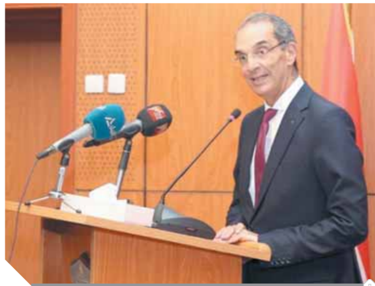
وزير الاتصالات يعلن تفاصيل الخدمات الجديدة على منصة مصر الرقمية

المقدمين لخدمات التوثيق فى مكاتب التوثيق والبريد ومركز خدمة المواطنين وكذلك مراكز الاتصال لتقديم الخدمات للمواطنين بشكل متميز؛ مضيقاً على المواطنين يستطيع الحصول على هذه الخدمات من خلال منصة مصر الرقمية والتي لا يحتاج إلى الذهاب إلى المكتب إلا للتحقق من شخصية المواطن واستلام التوكيل . كما أشار إلى أنه بالتعاون مع وزارة العدل فإنه تم إطلاق تطبيق التعرف على نسب التكدس داخل المكاتب المقدمة لخدمات التوثيق بما يتيح للمواطن تحديد الوقت المناسب له للحصول على الخدمة فى غير أوقات الذروة. قال وزير الاتصالات إنه فى إطار تنفيذ مشروعات بناء مصر الرقمية يتم إيلؤها اهتماماً كبيراً بالأمن