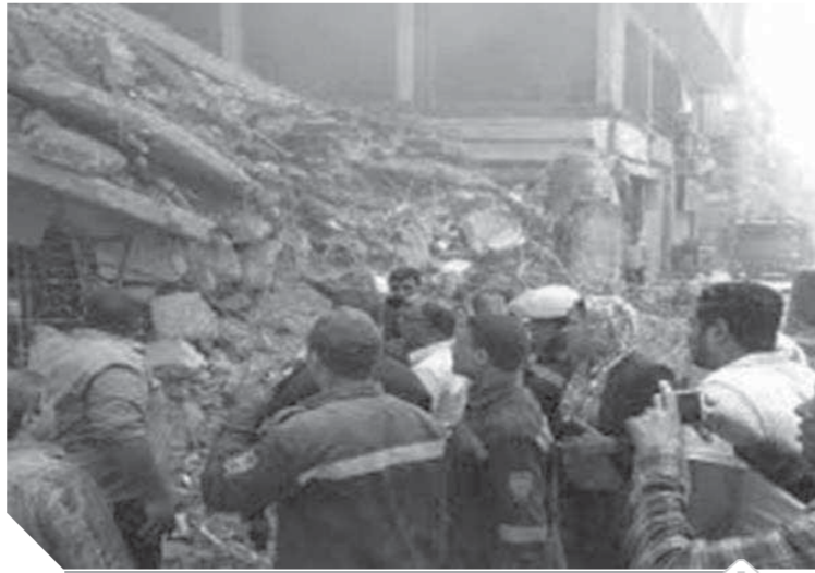
ضحايا بالعقارات جراء استمرار مسلسل انهيار المنازل