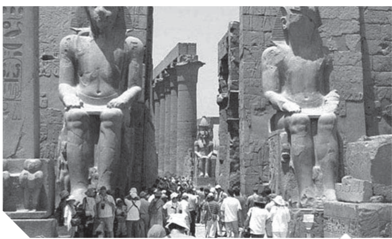
السائحون يعيدون الحياة إلى الأقصر