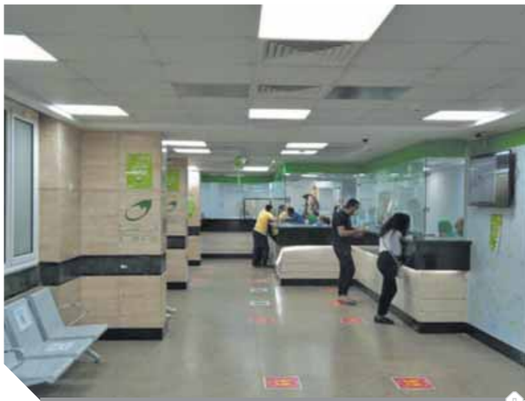
أحد مكاتب البريد المطورة إضافة لخدمة المواطنين