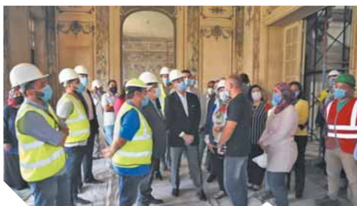
وزير الاتصالات يتفقد أعمال تطوير قصر السلطانة ملك

السلطانة ملك الذى يقع أمام قصر البارون بحى مصر الجديدة فى إطار بروتوكول التعاون الموقع بين كل من وزارة الاتصالات وتكنولوجيا المعلومات ممثلة فى الشركة المصرية للاتصالات، ووزارة قطاع الأعمال ممثلة فى شركة مصر الجديدة للإسكان والتعمير، ووزارة التربية والتعليم والفنى، بينما يتم تنفيذ مشروع مركز تنمية الإبداع وزيادة الأعمال بالبنى السرايات لجامعة القاهرة فى منطقة بنى السرايات فى إطار بروتوكول التعاون الموقع بين وزارة الاتصالات وتكنولوجيا المعلومات وجامعة القاهرة.