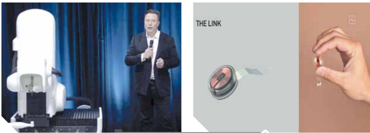
ماسك، يكشف عن شريحة ذكية بالبح