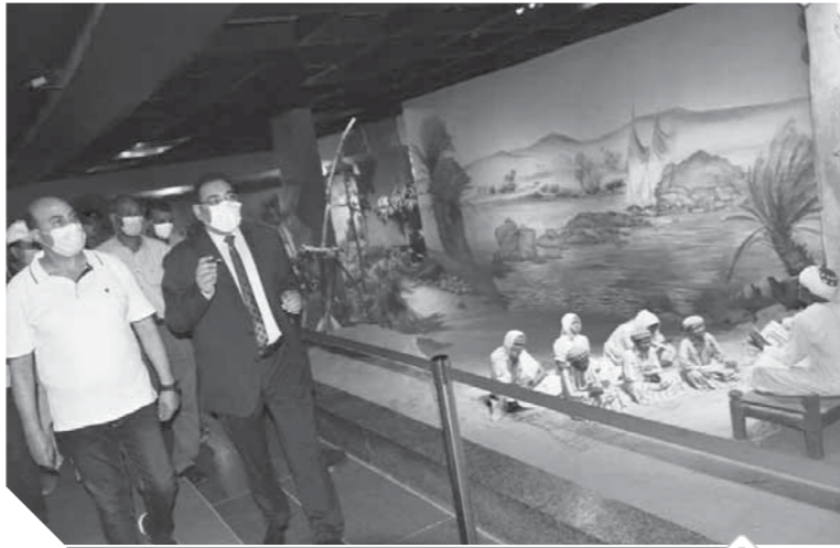
محافظ أسوان يتفقد بعض المناطق السياحية

المعمل على الإسراع معدلات تنفيذ هذا المشروع الحيوي، والذي يستهدف إحداث نقلة حضارية وإبراز الشكل الجمالي لواجهة عاصمة الشباب والثقافة الإفريقية. وقال اللواء أشرف عطية محافظ أسوان: وصلت معدلات تنفيذ المشروعات السياحية في أسوان إلى أكثر من ٦٠٪، ومن المخطط إنهاء هذا المشروع مع مطلع العام القادم، كما أننا نسابق الزمن لإنهاء مشروعات البنية التحتية من شبكات مياه الشرب والصرف الصحي والكهرباء والاتصالات، علاوة على رصف الطرق. وأكد المحافظ أنه سيتم اتخاذ حزمة من