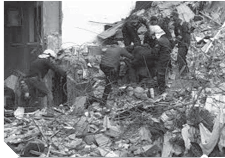
أحد المباني التي سقطت على السكان

في الأسبوع الماضي، وخلال ٢٤ ساعة هذه الفاجعة حسب ما روتها السيدة الثلاثينية، سببها البناء المخالف، فإلّا كان أراد تحقيق مكسب إضافي فقام ببناء أكثر من دور مخالف، ما هدد أمان المنزل وصعبت التشققات القدرة على العيش فيه خاصة أن العمارة أصبحت مهددة بالسقوط، وأشارت إلى أنها حاولت عشرات المرات أن ترسل شكوى للحى المسؤول لكن دائماً كان مصيرها الحفظ في أدارج المكتب، وبذلك ضاع عليها حقها المالى الذي دفعته للشقة في حال سقوط العمارة.. وبالفضل سقطت العمارة وضاع معها كل شيء.. المأوى والستر وتحوشية العمر. وأزمة انهيار العقارات طلت لعقود تطل برأسها من وقت لآخر، ووفقاً لآخر إحصائية رسمية للجهاز المركزي للتعبئة العامة والإحصاء، بلغ عدد العقارات الآيلة للسقوط في مصر ٩٧ ألف عقار عام ٢٠١٩.