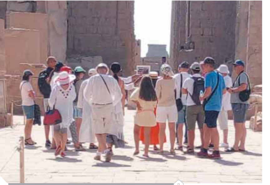
السياح يتوافدون على معبد الكرنك

كتب - أحمد عثمان، استقبل معبد الكرنك، أول الأفواج السياحية القادمة من مدينة الفردفة، في أول يوم لاستئناف مصر لحركة السياحة الثقافية، بعد تعليقها منذ شهر مارس الماضي ضمن الإجراءات الاحترازية التي اتخذتها الحكومة في ظل تداعيات فيروس كورونا المستجد في مختلف دول العالم. قال د. مصطفى وزيرى الأمين العام للمجلس الأعلى للآثار: إن هذه الأفواج تضم سائحين من أوكرانيا وفرنسا جاؤوا إلى مدينة الفردفة أمس لقضاء إجازاتهم على شواطئ مصر ثم قاموا برحلة إلى مدينة الأقصر لمشاهدة آثارها العظيمة والتعرف على الحضارة المصرية العريقة. وأكد أن جميع المتاحف والمواقع الأثرية ملتزمة بتطبيق ضوابط السلامة الصحية والإجراءات الاحترازية التي أصدرتها الوزارة لإعادة فتح المتاحف والمواقع الأثرية ضمن استئناف حركة السياحة الثقافية في مصر.