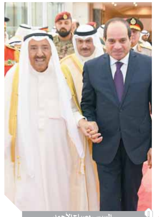
السيسي وصباح الأحمد

«السيسي» و«صباح الأحمد» يبحثان الفرص الاستثمارية في مصر