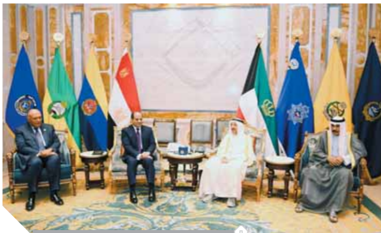
جانب من المباحثات بين الرئيس وأمير الكويت

الرئيس يجدد تأكيدات: أمن الخليج جزء لا يتجزأ من الأمن القومي المصري