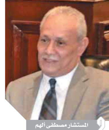
المستشار مصطفى فهم

كتب- أحمد عثمان: يفتح وزير الآثار ومحافظ الأقصر السبت المقبل مقبرتين أثريتين للزيارة أمام الجمهور بالبر الغربي بالأقصر، وذلك بعد الانتهاء من عملية ترميمهما وافتتاحهما للزيارة وتضامن رسوماً ونقوشاً بألوان جيدة وستتم إقامة معرض أثرى لاحتوائهما أمام الزوار، وتستمر زيارة وزير الآثار لمدة يومين يقوم خلالها بتفقد عدد من المشروعات الأثرية تمهيداً لافتتاحها مثل طريق الكباش وتأهيل بعض المناطق المحيطة بالآثار، وسوف يصطحب الوزير عدداً من سفراء الدول العربية والأوروبية من عشاق الآثار ومدينة الأقصر.