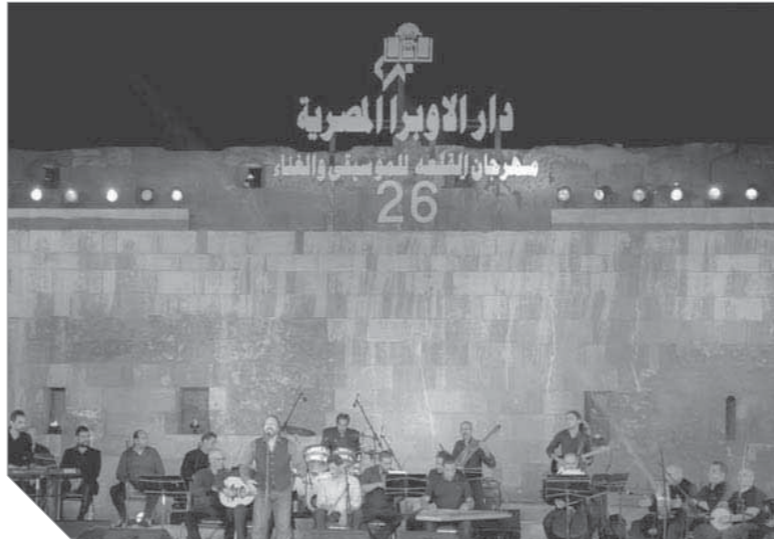
إحدى حفلات محكي القلعة التي جذبت الآلاف

رهان كبير على الفرق الموسيقية الغنائية.. ولأن النور دائماً مكانه في القلوب، تحدث أوركسترا «النور والأمل» الظروف الصعبة التي فرضتها قسوة الحياة بمخترارات من أشهر المؤلفات الكلاسيكية العالمية. وعلى امتداد نحو ساعة استمتع الجمهور الذي حضر بكثافة مسرح القلعة بمعروضات كلاسيكية متنوعة ومتعددة تراوحت بين موسيقى الروك والجاز والبلوز مع التراث الغنائي المصرى، لفرقة مسار إيجارى الذي عبروا حاجز المنوع، وقدموا كلمات تعبر عن المجتمع المصرى دون خطوط حمراء.