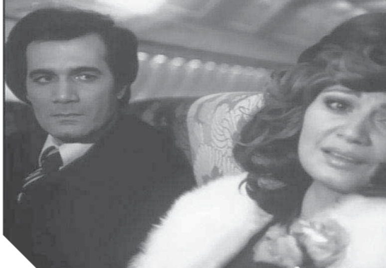
محمود ياسين ومديحة كامل فى مشهد من فيلم «الصعود إلى الهاوية»

آخر أفلامه «قاهر الزمن» عام ١٩٨٧، أحد إلهامات الخيال العلمى الذى لم يبدأ بأبحاث تهم الناس العادية وربما هذا ما أحدث أسلوب الصدمة لدى النقاد عند صدوره؛ فتدور قصته حول الشاب كمال والنسج تخرج فى كليه الآداب قسم الآثار ليبحث فى تاريخ الحضارة الفرعونية عن الإيمان بالبعث وحياة الخلود ومراكب الشمس، فيما يعمل ابن خالته فى جريدة ويحاول التحقيق فى جريمة اختفاء مريض من مستشفى؛ فى هذا العمل كان كمال الشيخ سابقاً عصره باستعراضه تصاريص الحياة ومتخياتها، خارجاً عن المألوف، ففاز من نمل يعيش فيه عامة الناس إلى نمل وزمن من يتعدهود.