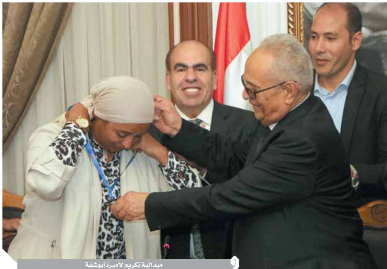
ميدالية تكريم لأميرة أبوشقة