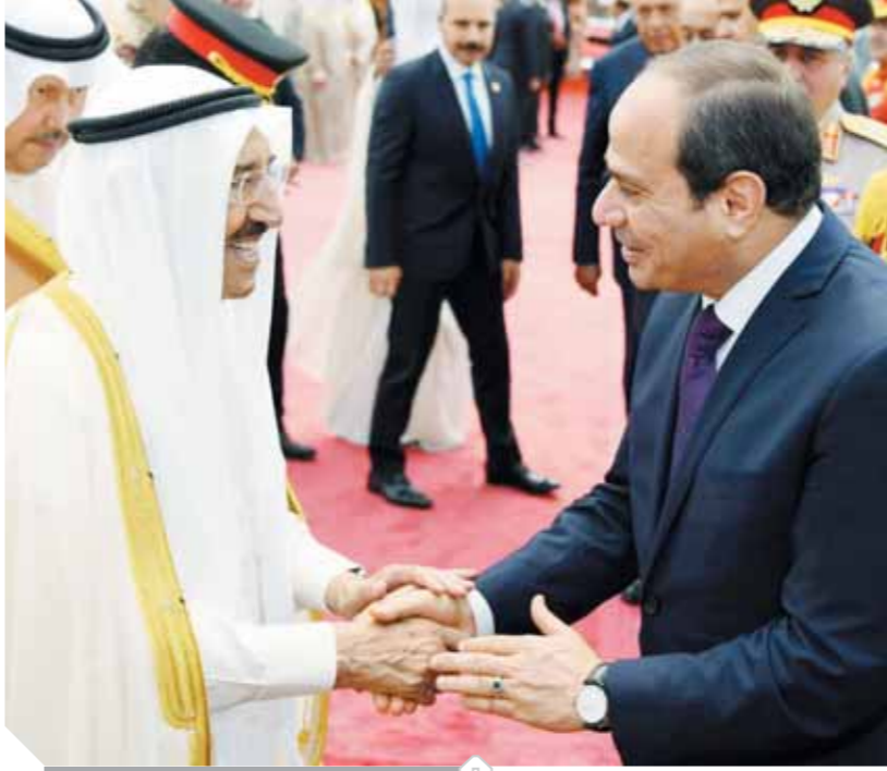
السيسي والشيخ صباح الأحمد

جسد الرئيس عبدالفتاح السيسي، أمس، تأكيده من أمن دول الخليج والكويت هو جزء لا يتجزأ من الأمن القومي المصري. وأعرب الرئيس عن تقديره مواقف الكويت الداعمة لإرادة الشعب المصري وجهوده التنموية، وأشاد «السيسي» بجهود الكويت في التوصل إلى تسويات سياسية للأزمات القائمة في الوطن العربي، ممثلاً الجهود الكويتية لتسوية الأزمة اليمنية، مؤكداً أهمية الإسراع في التوصل إلى حل سياسي للأزمة، لوضع حد لمعاناة الشعب اليمني. جاء ذلك خلال اجتماع القمة بين الرئيس السيسي وبين الشيخ صباح الأحمد الجابر الصباح أمير دولة الكويت، أمس، الذي تناول الفرص الاستثمارية المتاحة في مصر، في ضوء مزايا وحوافز قانون الاستثمار الجديد.