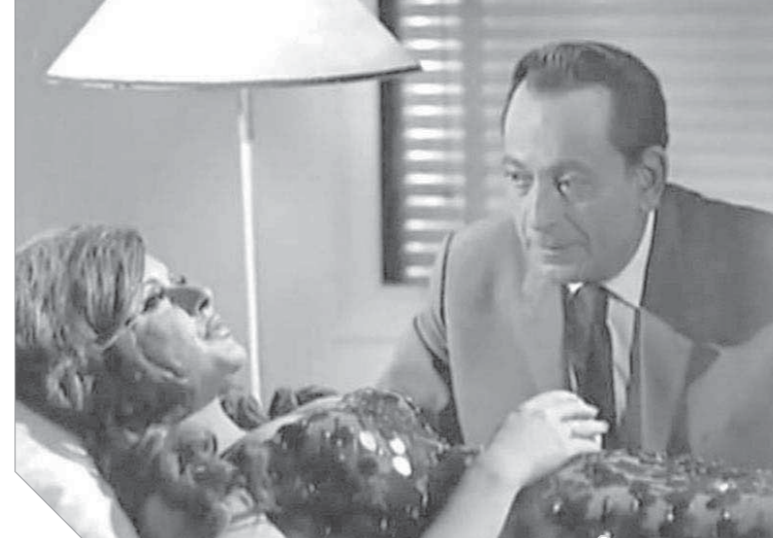
محمود المليجى وسعاد حسنى فى «بنر الحرمان»

رجعية كان همها أن تثمت من هزيمة مصر فى العام ١٩٦٧، وتدور أحداث الفيلم حول اقتحام المواطن مصطفى حسين (محمود ياسين) مكتب رشى يه (جميل راتب) رئيس مؤسسة «المقاولات المصرية» ليطلق عليه النار وينطلق هارباً إلى الشارع لتصدمه إحدى السيارات وينقل هو ورشدى يه إلى المستشفى نفسه. ومن خلال التحقيقات التي يقوم بها رجال البوليس تظهر على السطح قضايا ومفاسد كثيرة فى المجتمع. يقول لنا الفيلم انها هى ما كادت خلف الهزيمة فى ذلك الحين. وتاريخ كمال الشيخ الفننى طويل ورائع؛ وبه الكثير؛ ويكفى أنه أعطى مديحة كامل شهادة ميلادها من خلال فيلم «الصعود إلى الهاوية» عام ١٩٧٨، وأنتج لها فرصة الانطلاق من الأدوار الثانية إلى أدوار البطولة المطلقة فى أكثر من ٣٥ فيلماً سينمائياً، وحوار ممدوح الليثى، وقامت شادية بدور زهرة فحولتها مع كمال الشيخ إلى إنسان من