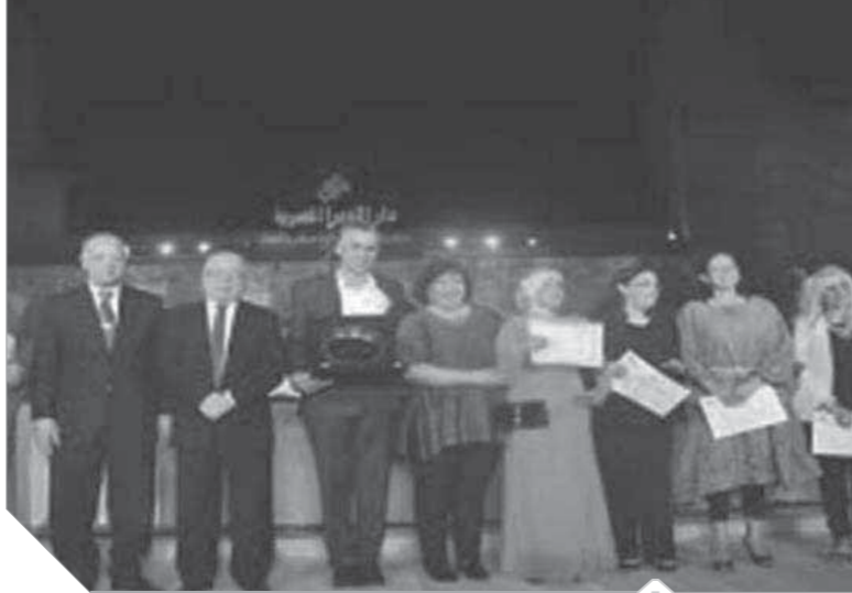
الدكتورة إيناس عبدالدايم مع المكرمين

وتأتى الدورة الـ ٢٨ لتعلن ارتفاع مؤشرات الوعى التي تدعو للفخر وتبرز قدرة الفنون الجادة على بناء الإنسان والمجتمع، والذي نجح في استقطاب شرائح مختلفة من الجمهور، حيث تم زيادة منافذ بيع التذاكر لحفلات مهرجان القلعة لاستيعاب أكبر قدر من الجمهور الذي تجاوز خمسة عشر ألفاً في ثالث يوم من فعالياته.