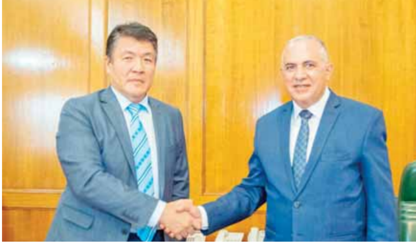
وزير الري لدى استقباله مدير المنظمة الإسلامية للأمن الغذائي

التي تواجه قطاع المياه في مصر وعلى رأسها زيادة السكان ومحدودية الموارد المائية المتاحة، مؤكداً أن مصر تعد من أعلى دول العالم جفافاً، وتعاثي من الشح المائي، حيث تقدر موارد مصر المائية بحوالي ٦٠ مليار متر مكعب سنوياً من المياه معظمها يأتي من مياه نهر النيل، بالإضافة لكميات محدودة للغاية من مياه الأمطار التي تقدر بحوالي مليار متر مكعب، والمياه الجوفية العميقة غير المتجددة بالصحرى، وفي المقابل يصل إجمالي الاحتياجات المائية في مصر لحوالي ١١٤ مليار متر مكعب سنوياً من المياه، ويتم تعويض هذه الفجوة من خلال إعادة استخدام مياه الصرف الزراعي والمياه الجوفية السطحية بالوادي والدلتا بالإضافة لاستيراد منتجات غذائية من الخارج تقابل ٢٤ مليار متر مكعب سنوياً من المياه.