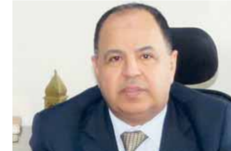
د. محمد معيط

وبذلك يتم الربط الإلكتروني بين كل المنافذ الجمركية، على النحو الذى يضمن تعزيز الحوكمة وحماية الأمن القومي المصرى، ومنع دخول أى سلع ضارة أو خطيرة إلى البلاد، خاصة فى ظل الجهود الأخرى المبذولة لاستكمال منظومة الفحص بالأشعة لتغطي ٨٥٪ من المنافذ الجمركية بنهاية عام ٢٠٢١. وأشار «معيط» إلى استمرار التشغيل التجريبي لنظام التسجيل المسبق للشحنات حتى نهاية سبتمبر المقبل، وتأجيل التطبيق الإلزامى بالموانئ البحرية إلى الأول من أكتوبر المقبل، بدلاً من الأول من يوليو ٢٠٢١، لمنع المستوردين ووكلائهم من المستخلصين الجمركيين والشركات المصدرة لمصر والشركات العالمية متعددة الجنسيات فرصة أخيرة للتسجيل على المنظومة الجديدة.