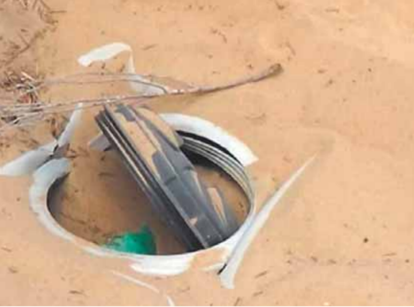
فتحة نفق تم اكتشافه وتدميره في شمال سيناء