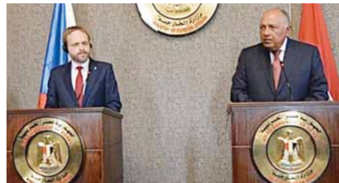
شكرى و جاكوب كولهاك وزير خارجية التشيك في المؤتمر الصحفي

وأضاف أن المباحثات مع نظيره التشيكى تضمنت