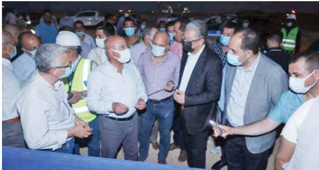
المهندس كامل الوزير خلال تفقده عمليات تطوير ميناء العين السخنة

وتابع الوزير، أنه تم تخطيط الموقع العام للميناء ليضاهى أحدث الموانئ العالمية، ليكون أكبر ميناء محورى بالبحر الأحمر يخدم حركة التجارة بين جنوب وشرق آسيا وجنوب وغرب أوروبا وشمال أفريقيا، وتتضمن أعمال التطوير إنشاء البنية الأساسية للأرصفة والمحطات الجديدة لتكون قادرة على تقديم كافة خدمات الشيراني بطول ١٤ كم تقريباً ليربط بين الأرصفة والميناء ككل بما يساهم في عدم اللوجيستية المحيطة به تنفذها مجموعة من الشركات المصرية تحت إشراف مكتب استشارى مصرى. ووصف وزير النقل ميناء العين السخنة بأنه أحد أهم الموانئ التابعة للمنطقة الاقتصادية، فضلاً عن أعمال