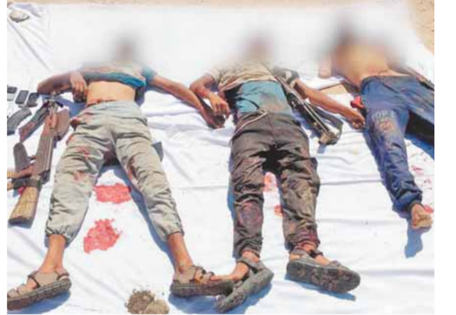
جثث التكفيريين بعد مصرعهم في عمليات القوات المسلحة