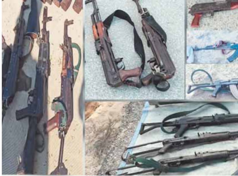
الأسلحة المصادرة خلال مطاردة العناصر الإرهابية