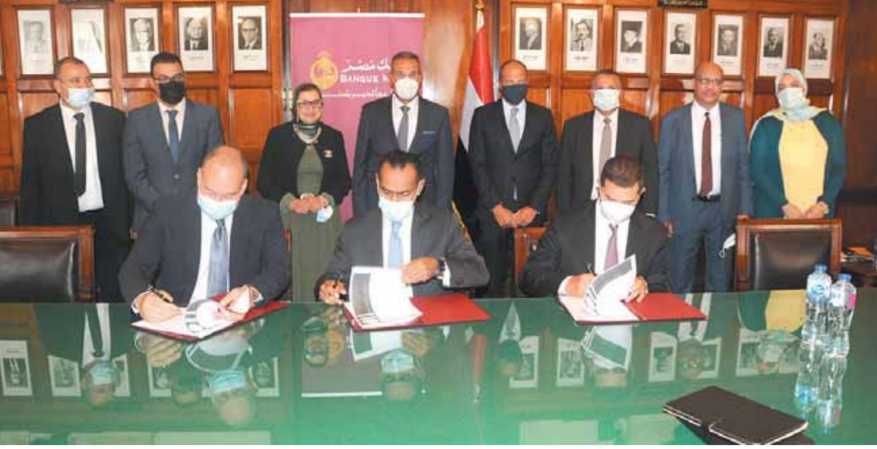
قيادات البنك والشركة خلال توقيع العقد

كافة الخدمات المصرفية الحديثة كإصدار كافة أنواع البطاقات بالإضافة إلى مجموعة متنوعة من المنتجات المستحقة لخدمة عملاء فروع المعاملات الإسلامية (كثافة) منها منتجات المراجحة المتنوعة مثل مراهجة الحج والعمرة ومراهجة السلع المعمرة ومراهجة الرحلات السياحية ومراهجة السيارة ومراهجة التعليم وتم تمويل المصروفات والمستلزمات الدراسية، كما تم طرح عملة التأمين البنكى التكافى من خلال فروع المعاملات الإسلامية (كثافة) بالتعاون مع الشركة المصرية للتأمين التكافى.