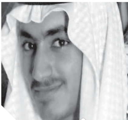
حمزة بن لادن

وفي مطلع ٢٠١٧ أدرجت الولايات المتحدة، حمزة بن لادن على لائحة السواد للإرهاب، ما يعني فرض عقوبات قانونية ومالية عليه. وتستدعي الآلية الإدارية الأمريكية في حال مماثلة فرض «عقوبات» مالية وقانونية على مواطنين أجانب «تبين أنهم نفذوا أعمالاً إرهابية أو يستعدون للقيام بذلك». وبالتالي تم تجميد كل الأصول والممتلكات والأرصدة المحتملة لحمزة بن لادن في الولايات المتحدة.