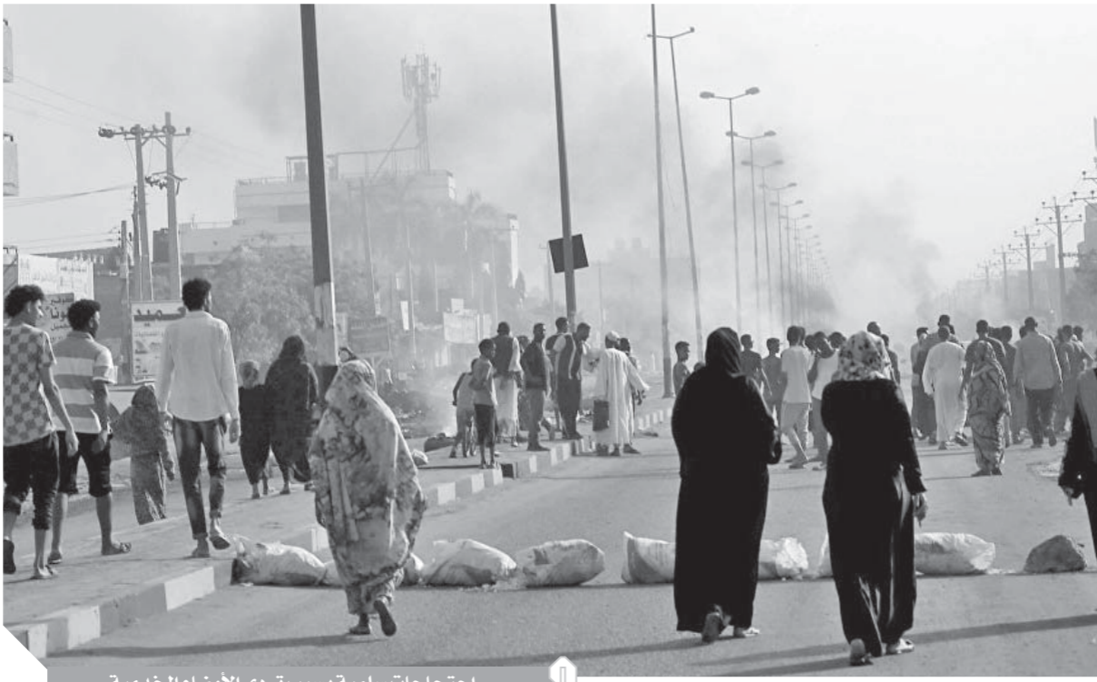
احتجاجات سلمية بسبب تردى الأوضاع الخدمية

وأشار إلى أن عدد الجرحى بلغ ٢٠، هم الآن بمستشفى الأبيض فيما غادر عدد من منهم المستشفى، موضحاً أنه تم التحفظ على جميع أفراد الحراسة وهم سبعة أفراد وحسب توجيه قيادة الدعم السريع تم رفقهم من القوة وتسليمهم لنيابة العامة بولاية شمال كردفان وذلك