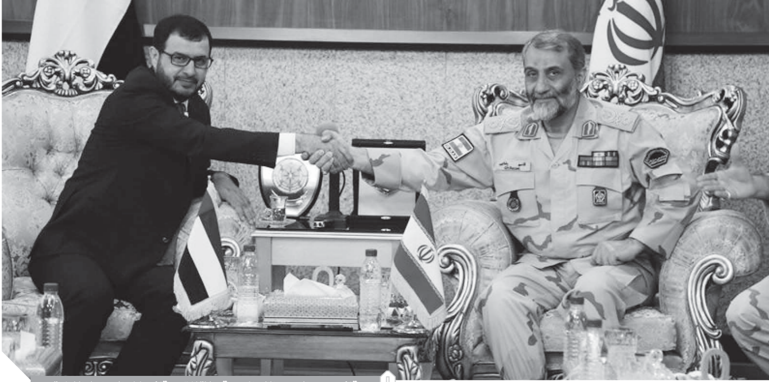
قائد حرس الحدود الإيراني يوقع الاتفاق مع قائد حفر السواحل الإماراتي