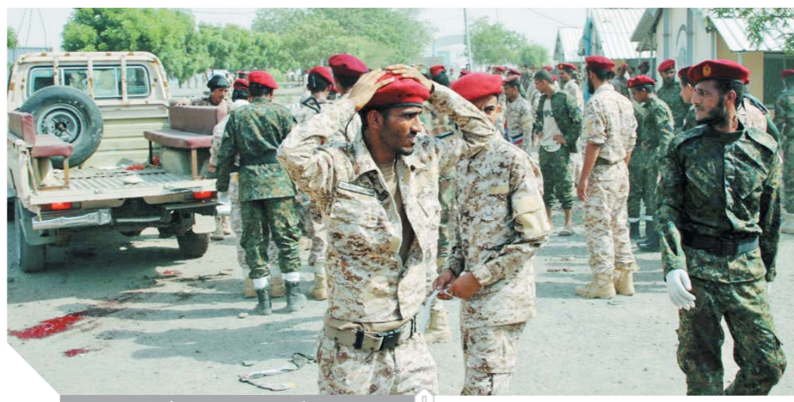
الجنز يكسو وجود جنود الجيش اليمنى

قالت مصادر أمنية وطبية لوكالة «رويترز» لأنها إن ٢٢ على الأقل قتلوا فى الهجوم على العرض العسكري فى عدن، صباح أمس، نقلت وكالة أسوشيتد برس عن مسئول فى الصحة اليمنية مقتل ٤٠ وإصابة العشرات فى هجوم صاروخى وتجهيز انتحارى آخر فى عدن، واستهدف الهجوم الانتحارى، مركزاً للشرطة فى وسط عدن، العاصمة المؤقتة للحكومة المعترف بها دولياً، واتهمت قوات الأمن متطرفين بتنفيذه.