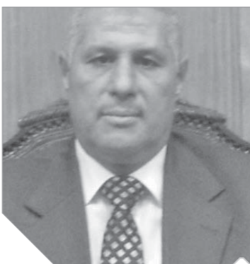
اللواء عصام الحملى

يقول اللواء عصام الحملى: فى شهر فبراير من عام ٢٠٠٩م، عندما كنت أعمل رئيساً للمباحث الجنائية بمديرية أمن سوهاج تلقينا بلاغاً من أهالى مركز طهطا شمال سوهاج بعثورهم على جثة لفتاة شابة تدعى أمل ٢٢ سنة حاصلة على مؤهل متوسط وتقيم فى مركز المنشأة جنوب سوهاج وبها عدة إصابات فى الرأس، فقمنا بإخطار النيابة العامة التى أمرت بتسريح الجثة لبيان سبب الوفاة وكلفتنا بالتحرى عن الواقعة وضبط الجانى، وكانت مهمة فريق البحث الجنائى الذى تم تشكيله بإشراف اللواء عصام حمزة مدير مباحث سوهاج - آنذاك - شاقه للغاية،