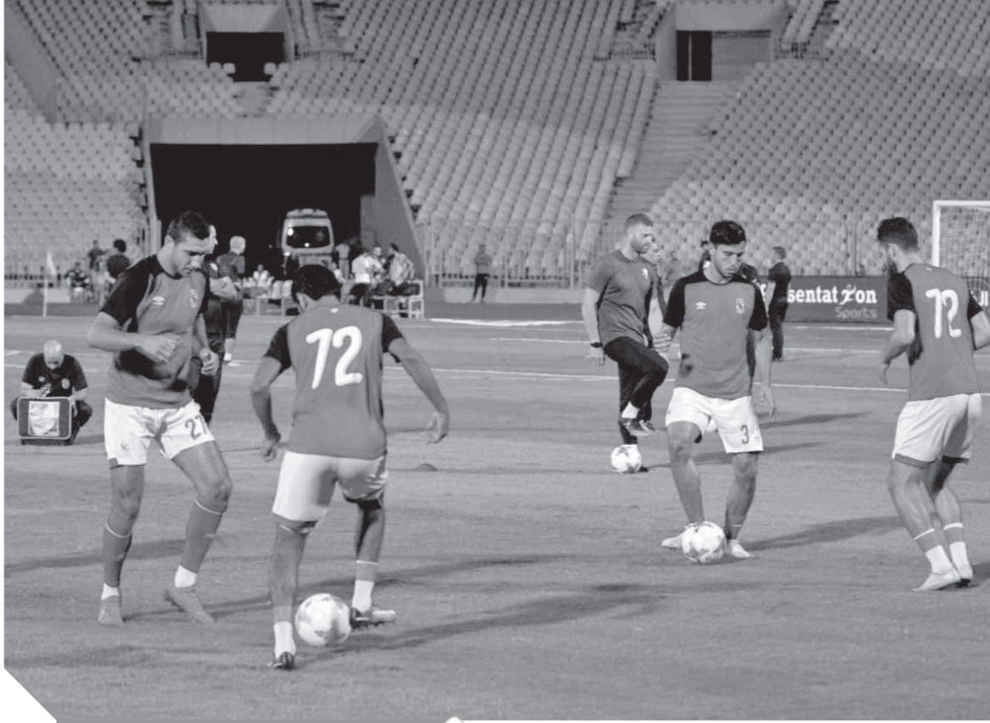
الأهلى يستأنف تدريباته اليوم