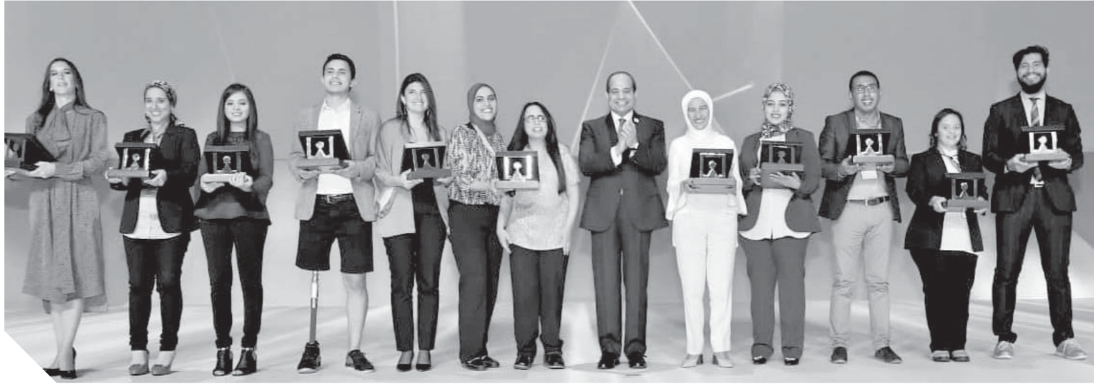
كتب: سيد العبيدي إيمان الشعراوي،

استمع الرئيس عبدالفتاح السيسي رئيس الجمهورية خلال مشاركته فقرة «اسأل وشارك الرئيس»، التي تضمنتها فعاليات مؤتمر الشباب الذي عقد على مدى يومين بالعاصمة الإدارية الجديدة للعديد من الاسئلة التي طرحت من جانب الشباب حول كثير من القطاعات التي تعاني مشاكل متراكمة وكذلك