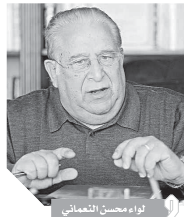
كتب: سيد العبيدي،

قال اللواء محسن النعماني وزير التنمية المحلية الأسبق، إن الإدارة المحلية هي عملية تكامل بين المجتمعات المحلية والحكم المركزي، والتكامل يشمل العمل والجهود والفكر والتنسيق من أجل إنجاح العملية التنموية في مصر، مضيفاً أن الحكومة تتحمل الآن عبئاً كبيراً، لأنها تؤدي الوظائف معاً وهذا أمر صعب إن لم يكن مستحيلًا.