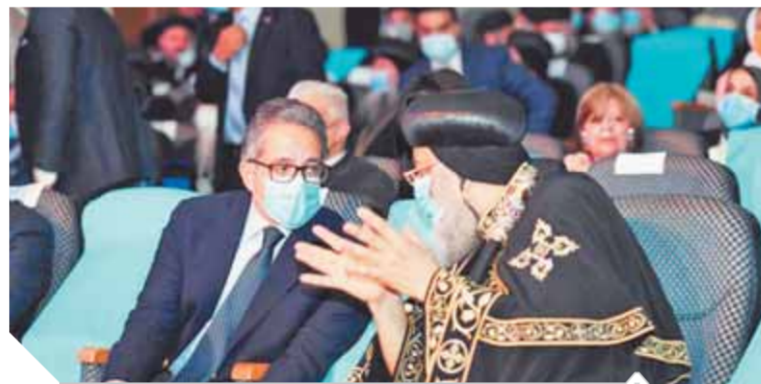
البابا تواضروس والعنانى فى الاحتفالية

وعن المحور الثانى، أوضح الوزير أنه يتعلق بتطوير ورفع كفاءة البنية الأساسية للمناطق المحيطة بنقاط مسار العائلة المقدسة الذى تقوم به وزارة التنمية المحلية بالتعاون مع الكنيسة المصرية، لافتاً إلى أنه خلال العام الحالى قام مع وزير التنمية المحلية بإقتراح ٣ مشاريع لتطوير البنية التحتية على نقاط مسار العائلة المقدسة فى سمندوط وسخا وتل بسطا، موضحاً أنه زار كنيسة السيدة العذراء والشهيد أنابوب بسمندوط مرتين، الأولى كانت عندما كان وزيراً للآثار عام ٢٠١٦ عند افتتاحها بعد الانتهاء من مشروع ترميمها، للمرة الثانية عند افتتاح مشروع تطوير ورفع كفاءة المنطقة المحيطة بها هذا العام.