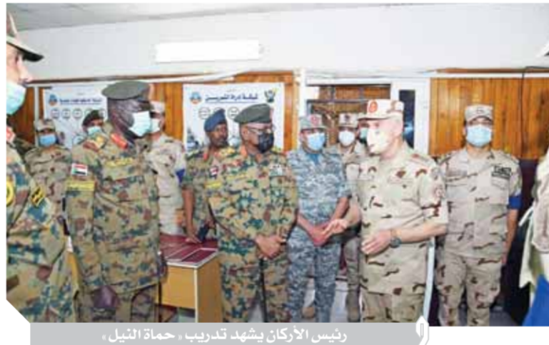
رئيس الأركان يشهد تدريب، حماة النيل،

كتب- محمد صلاح وأبوزيد كمال وسامية فاروق؛