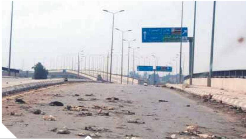
الإهمال يحاصر كبارى الدقهلية