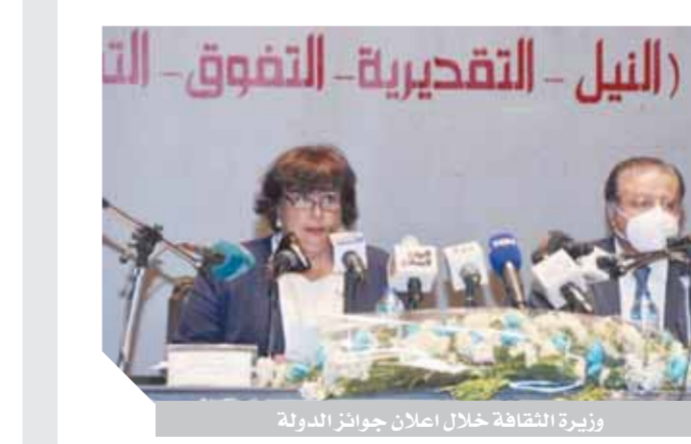
وزيرة الثقافة خلال إعلان جوائز الدولة