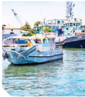
وحدات جديدة لمكافحة التلوث في قناة السويس

أعلن الفريق أسامة ربيع، رئيس هيئة قناة السويس، وصول ثلاث وحدات جديدة لمكافحة التلوث من طراز Multi cleaner ١٢٨ لرسيف ورشة قسم الحركات ببروسعيد، بعد اكتمال بنائها بترسانة EFINOR الفرنسية المصنفة كأكبر الترسانات العالمية المتخصصة في مجال بناء وحدات مكافحة التلوث. يأتي ذلك في إطار الجهود المبذولة لتطوير وتحديث أسطول الوحدات البحرية بالهيئة، وتعد الوحدات الجديدة المصنعة من الألومنيوم (كاشط ١، كاشط ٢، وكاشط ٣) هي الوحدات الأولى من نوعها في مصر ومنطقة الشرق الأوسط، وهي مصممة طبقاً لأعلى المواصفات العالمية للوحدات المعتمدة التي تعمل في مجال مكافحة التلوث البيئوي، وتتألف الوحدات الجديدة الجيدة احتياجات العمل بالقانعة، وتتألف من خصائصها ومواصفاتها، فيبلغ طول الوحدة الواحدة ١٢.٥ متر، وعرضها ٥ أمتار، فيما يبلغ غاطسها ١.٥ متر، وتصل سرعتها إلى ٩ عقد خلال الإبحار، فيما تتراوح بين ٥ و٥ عقد خلال مناورات مكافحة التلوث.