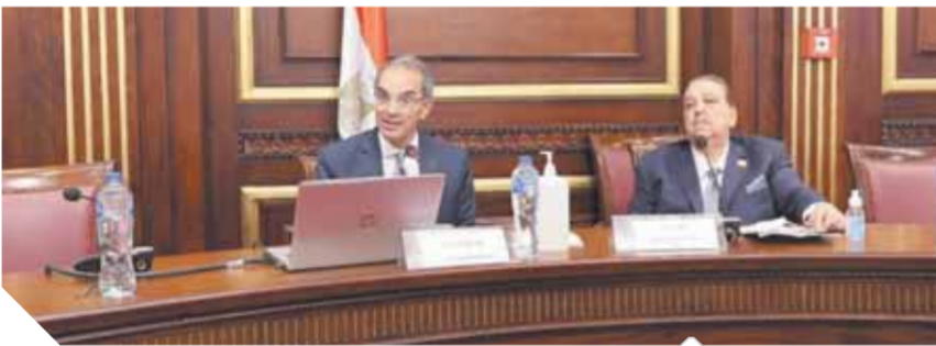
طلعت يستعرض استراتيجية مصر الرقمية لمجلس الشيخ

الجديدة باستثمارات ٨ مليارات جنيه، ثم التدرج وصولاً إلى قمة الهرم من خلال تنفيذ مبادرة بناء مصر الرقمية. أوضح طلعت أنه تم إنشاء مركز البحوث التطبيقية لتطوير حلول بالذكاء الاصطناعي في عدة مجالات ومنها الزراعة والصحة والتخطيط العمراني، وساهمت جهود مصر في هذا المجال في تقدم ترتيبها العالمي في مؤشر جاهزية الحكومة للذكاء الاصطناعي بالمركز ٥٦ عالمياً في ٢٠٢٠ مقارنة بالمركز ١١١ في ٢٠١٩. أشار طلعت أنه يتم تنفيذ خطة تطوير مكاتب البريد المصري وزيادة عدد فروعها باستثمارات أربعة مليارات جنيه خلال العام الحالي، ومن المستهدف إنشاء ٥٠٠ مكتب جديد لتصل إلى ٥٠٠٠ مكتب بريد بنهاية العام الحالي، مع تطوير ١٥٠٠ مكتب لتصل عدد مكاتب البريد المطورة إلى ٣١٠٠ مكتب.