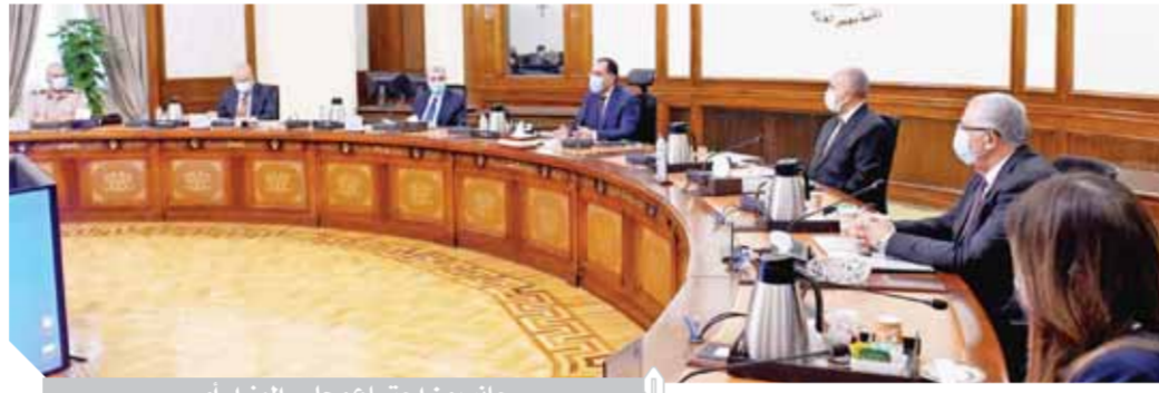
جانب من اجتماع مجلس الوزراء أمس