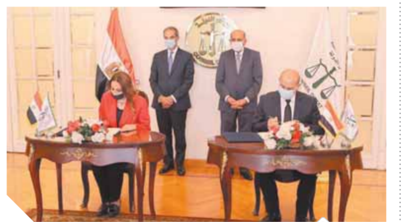
جانب من توقيع بروتوكول التعاون

زار المهندس عمرو محفوظ، رئيس هيئة تنمية صناعة تكنولوجيا المعلومات إيتيدا، جامعة قناة السويس بمحافظة الإسماعيلية وجامعة أسوان، لمناقشة سبل تعظيم استفادة طلبة الجامعات من المبادرات والبرامج التنموية التي تبنيها الهيئة، واستكشاف فرص التعاون في مجالات زيادة الأعمال والإبداع التكنولوجي بين الهيئة والباحثين بالجامعات، التي يحافظ خلال الزيارتين الأستاذ الدكتور أحمد زكي، رئيس جامعة قناة السويس، والأستاذ الدكتور أيمن عثمان، القائم بأعمال رئيس جامعة أسوان، واستعرض برامج ومبادرات الهيئة المعنية بتطوير مهارات طلبة الجامعات من خلال تدريب الشباب على التكنولوجيات الحديثة والأكثر طلباً في سوق العمل مثل مبادرة «رواد تكنولوجيا المستقبل» ومبادرة «مستقبلنا رقمي»، مشيراً إلى أن الهيئة تولي اهتماماً كبيراً ببناء القدرات الرقمية للشباب المصري في مجالات العمل الحر والعمل عن بعد. أكد محفوظ أن الهيئة تعمل حالياً على استراتيجية لتطوير القدرات والمهارات النوعية لطلبة الجامعات ومساعدتهم على إقتان وإجادة اللغات الأوروبية الأكثر طلباً بسوق عمل خدمات مراكز الاتصالات الدولية وخدمات الدعم الفني وعلى رأسها اللغات الألمانية والفرنسية والإنجليزية. وبدأت الهيئة بالفعل في تنفيذ نسخة تجريبية بجامعة جنوب الوادي بتدريب ١٠٠ شاب على اللغة الألمانية بالتعاون مع معهد جوتة.