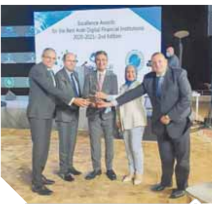
فاروق يتسلم جائزة التميز

فاز البريد المصري بجائزة التميز الرقمي كأفضل مؤسسة بردية عربية لتطبيق التحول الرقمي، خلال مشاركته في منتدى «تحديات الامتثال وتعزيز الممارسات» في المصرف المصرفية الذي تنظمه اتحاد المصارف العربية في بيروت، وسلم وشرف فائق رئيس مجلس إدارة البريد المصري، وسلم وشرف فائق أمين عام اتحاد المصارف العربية ومحمد بن عمر أمين عام المنظمة العربية للتكنولوجيا والاتصال والمعلومات والجائزة لرئيس البريد، بحضور نخبة من كبار الشخصيات المرموقة والفاعلة في المجال المصرفي والمالي والتكنولوجي في المنطقة العربية.