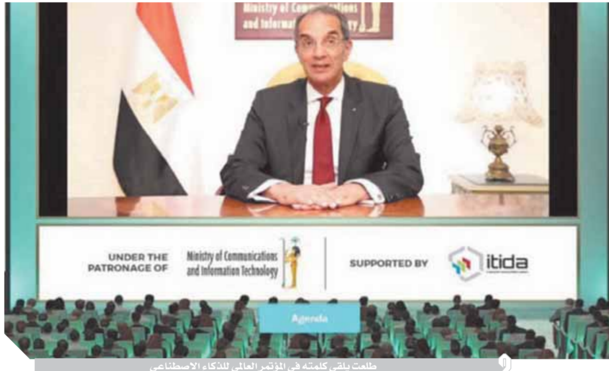
طلعت يلقي كلمته في المؤتمر العالمي للذكاء الاصطناعي

جاء ذلك في كلمة الدكتور عمرو طلعت أثناء افتتاح الدورة الخامسة والعشرين للمؤتمر العالمي للذكاء الاصطناعي والذي تستضيفه مصر لأول مرة تحت رعاية وزارة الاتصالات وتكنولوجيا المعلومات وتنظمه شركة «تريسكون جلوبال» العالمية عبر الإنترنت بالتعاون مع هيئة تنمية صناعة تكنولوجيا المعلومات «إيتيدا» تحت شعار «رعاية النظام البيئي للذكاء الاصطناعي في مصر»، بحضور نخبة من أبرز خبراء