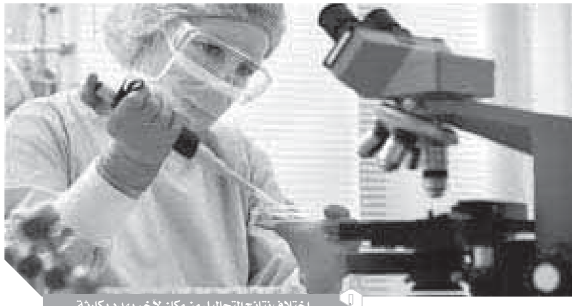
اختلاف نتائج التحاليل من مكان لآخر يهدد بكارثة