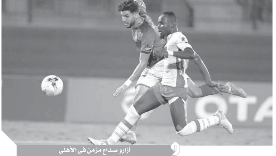
أزارو صداع مزمن في الأهلي