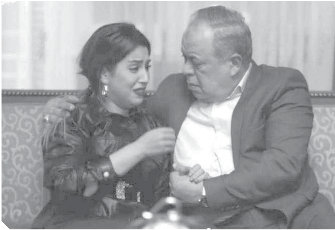
أشرف زكي وآيتن عامر فى مشهد من مسلسل «فرصة ثانية»

• بمناسبة مسلسل «البرنس» كيف ترى دور روجينا؟ - أمتن روجينا على هذا النجاح وهذا الدور الذى تفاعل معه الجمهور بشكل كبير وهو دور مؤثر وقوى تمثيليا والعمل كله متميز وخطوة جيدة والعمل نقله مهمة فى مشوار الفنانة روجينا ليس لأنها زوجتى شهادتى فيها مجرحة لكن لأنها ممثلة جيدة والعمل نقله مهمة فى مشوار الفنان محمد رمضان وكل فريق العمل قدموا أدوارا تعتبر فرصا مهمة فى مشوارهم. • هل كنت مع من ينادون بوقف المسلسلات بسبب كورونا؟ - الدراما والفن بشكل عام صناعة وإنتاج وإبداع ولا يمكن وقفه ونجح الموسم فى إشباع رغبة الجمهور فى الاستمتاع بالفن والإبداع والفكر أنا كنت مع اتباع الإجراءات الاحترازية والوقائية لأن حياة الإنسان مهمة والحمد لله الموسم نجح فى تقديم دراما قوية ومتميزة بدون مشكلات لأن الصناعة الفنية والإبداعية فاتحة بيوت كثيرة وأكل عيش ومصدر للحياة لناس كثير.