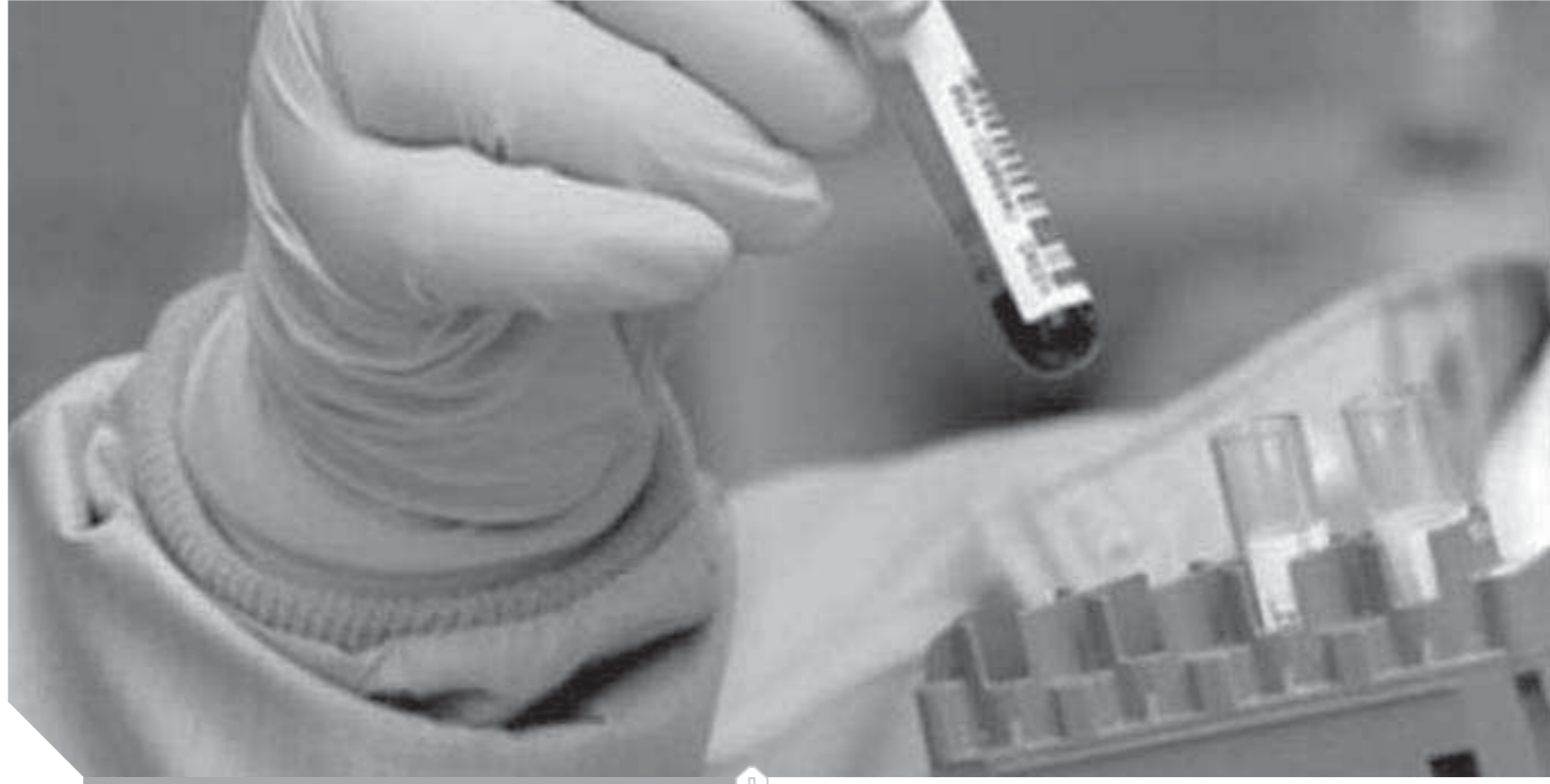
عدم الالتزام بمعايير الجودة وراء أخطاء المعامل

قد يقع الطبيب في حيرة من أمره عندما يأتي إليه المريض يشكو من آلام في جسده، وتأتي نتائج التحاليل بعيدة تماماً عن شكواه رغم أنه من المفترض أن تكون وسيلة مساعدة للطبيب في تشخيص الحالة بدقة، فيطلب بعض الأطباء إعادة مرة أخرى، وقد يضطر البعض الآخر لعلاج المريض بناء على ما جاء في نتائج التحاليل، أو إجراء عملية جراحية دون أن يكون المريض في حاجة إليها، لتتكون النهاية كارثية، فما يحدث الآن من فوضى في معامل التحاليل لم يعد يقتصر على المعامل العشوائية فقط، بل امتد الأمر لبعض المعامل المشهورة أيضاً، تلك الحالة الفوضوية جاءت نتيجة لمعايير الجودة، فضلاً عن قيام غير المتخصصين بالعمل بها، مع تفاوت في الأسعار من مكان لآخر في ظل غياب الرقابة من قبل الجهات المسؤولة فأصبح المريض بمثابة حقل تجارب لدى القائمين على تلك المعامل.