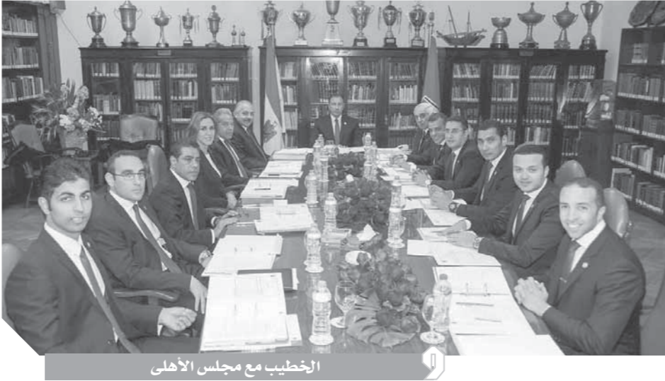
الخطيب مع مجلس الأهلي