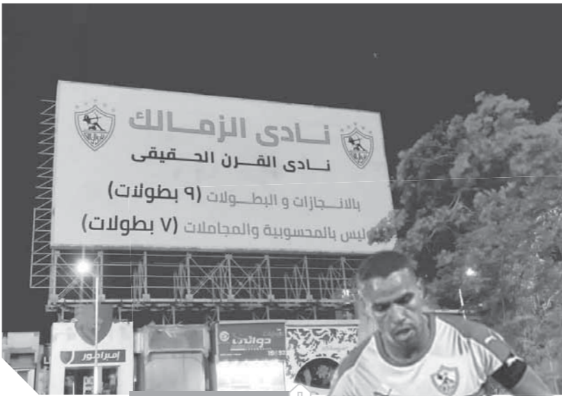
لافته الزمالك الجديدة