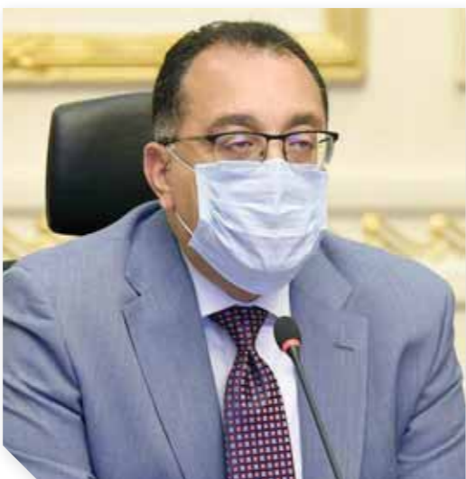
مجلس المحافظين خلال اجتماعه برئاسة مدبولي من خلال الفيديو كونفرانس

لاستفادة منها في تطوير وحدات الجهاز الإداري للدولة وتنمية قدرات موظفيها، بما يسهم في رفع كفاءة الخدمات المقدمة للمواطنين. وقال الدكتور صالح الشيخ: تهدف «طاقات» أيضاً إلى بناء قاعدة بيانات بالطاقات البشرية المتاحة داخل الدولة المصرية تخص الاستشاريين، والمدربين، والمتقاعدين من خبراء الجهاز الإداري للدولة؛ وذلك بهدف استكشاف الطاقات البشرية المتميزة التي تزخر بها الدولة المصرية، مشيراً إلى أن «طاقات» ستقوم أيضاً بتزويد الوزراء والهيئات وكل الجهات الحكومية بأبحاثها من الاستشاريين والمدربين المحترفين والخبراء المتقاعدين. وأوضح رئيس الجهاز أن «طاقات» تتضمن بداخلها ٣ قواعد، الأولى هي قاعدة المتقاعدين من خبراء الجهاز الإداري للدولة وهي مخصصة لخبراء الجهاز الإداري للدولة ممن بلغوا سن المعاش القانوني أو تقاعدوا بمعاش مبكر، وذلك للاستفادة من خبراتهم وخبراتهم عند الحاجة إليهم في أعمال استشارية أو تدريبية لوحدات الجهاز الإداري للدولة، والقاعدة الثانية هي قاعدة بيانات الاستشاريين المعنية بضم بيانات الاستشاريين العاملين في مصر وخارجها والراغبين في تقديم خدماتهم للوحدات الحكومية على المستويين القومي والمحلي، بينما تخصص القاعدة الثالثة لبيانات المدربين، وتستهدف هذه القاعدة المدربين المحترفين الذين يقدمون خدماتهم لجهات حكومية، كما ستتاح للراغبين في الاستفادة منها بالفئات الخاص. وأكد الدكتور صالح الشيخ أن إنشاء «طاقات» يأتي في إطار إعطاء الدولة المصرية اهتماماً كبيراً بموظفيها الإداريين للدولة، ولم يقتصر الاهتمام على الموظفين الحاليين، بل امتد أيضاً إلى المتقاعدين منهم، إيماناً بكنابتهم التي ينبغي ألا تتوقف عند بلوغهم سن التقاعد بل يجب مواصلة المسيرة ونقل خبراتهم لتجديد الأجيال المقبلة.