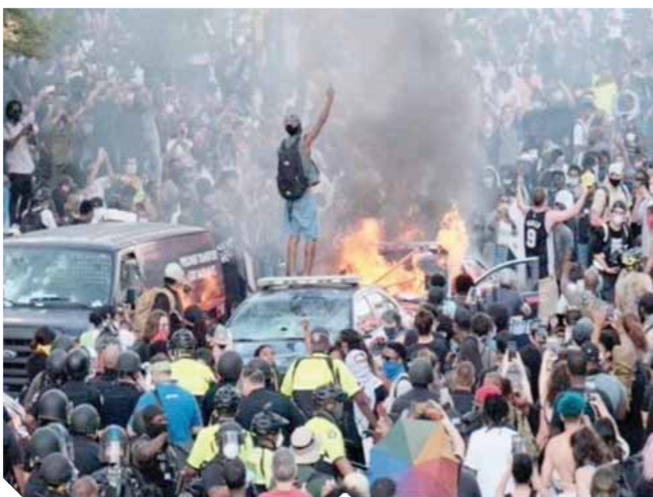
مظاهرات عاصفة ضد العنصرية فى أمريكا

كشفت صحيفة نيويورك تايمز أن ما لا يقل عن ٥ أشخاص لقوا مصرعهم فى الاحتجاجات والاضطرابات التي تشهدها أغلب المدن الأمريكية منذ أكثر من ٦ أيام، على خلفية مقتل الشاب الأمريكى الأسود جورج فلويد على يد شرطي، وأكدت الصحيفة أن أغلب الوفيات فى مدينتى ديترويت وإنديانابوليس، وقد نفت قوات الشرطة تورط أى من أفرادها فى هذه الحوادث. ووفقاً لما نشر على موقع قناة «الحره» الأمريكية، قال مايكل هيويت المتحدث باسم شرطة إنديانابوليس إن سبب هذه الوفيات لم يتضح بعد. وكشف مسئولون أن المتظاهرين فى فيلادلفيا قذفوا الشرطة بالحجارة وقنابل المولوتوف، بينما اقتحم اللصوص المتاجر والشركات فى أكثر من ٢٠ مدينة فى كاليفورنيا وسرقوا بقدر ما يمكنهم حملهم، من صناديق أحذية رياضية وملابس وهواتف محمولة وأجهزة تلفاز وغيرها من الإلكترونيات. ووفقاً لشبكة «سى إن إن» نقل الرئيس الأمريكى إلى القبو المحصن ويقيم هناك لمدة أقل من ساعة قبل صعوده إلى الطابق العلوى، فيما يظل من غير الواضح ما إذا كانت السيدة الأولى ميلانيا ترامب، وأينهما بارون، قد توجهتا برفقته إلى القبو أم لا. وأشاد ترامب بالخدمة السرية الخاصة بحمايته داخل مقره المحصن، مؤكداً أنه كان يشعر «بأمان تام» بينما تجمع المتظاهرون فى الخارج.