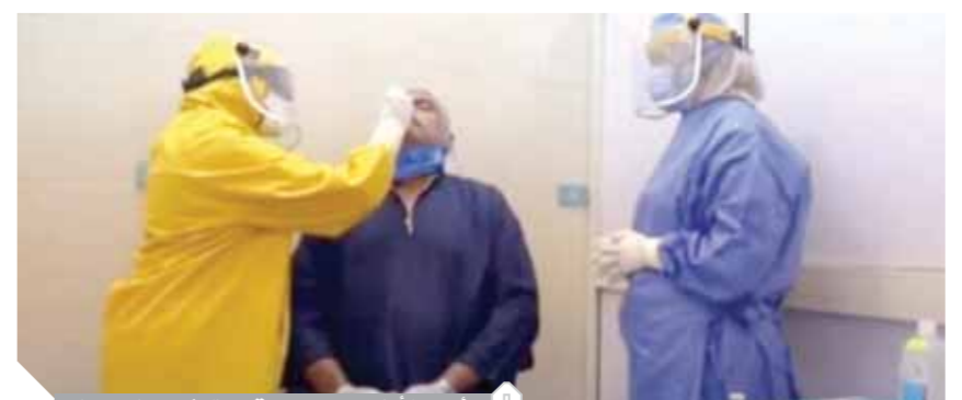
أحد الأطباء يقوم بتوقيع الكشف على نزير

كشفت صحيفة نيويورك تايمز أن ما لا يقل عن ٥ أشخاص لقوا مصرعهم فى الاحتجاجات والاضطرابات التي تشهدها أغلب المدن الأمريكية منذ أكثر من ٦ أيام، على خلفية مقتل الشاب الأمريكى الأسود جورج فلويد على يد شرطي، وأكدت الصحيفة أن أغلب الوفيات فى مدينتى ديترويت وإنديانابوليس، وقد نفت قوات الشرطة تورط أى من أفرادها فى هذه الحوادث. ووفقاً لما نشر على موقع قناة «الحره» الأمريكية، قال مايكل هيويت المتحدث باسم شرطة إنديانابوليس إن سبب هذه الوفيات لم يتضح بعد. وكشف مسئولون أن المتظاهرين فى فيلادلفيا قذفوا الشرطة بالحجارة وقنابل المولوتوف، بينما اقتحم اللصوص المتاجر والشركات فى أكثر من ٢٠ مدينة فى كاليفورنيا وسرقوا بقدر ما يمكنهم حملهم، من صناديق أحذية رياضية وملابس وهواتف محمولة وأجهزة تلفاز وغيرها من الإلكترونيات. ووفقاً لشبكة «سى إن إن» نقل الرئيس الأمريكى إلى القبو المحصن ويقيم هناك لمدة أقل من ساعة قبل صعوده إلى الطابق العلوى، فيما يظل من غير الواضح ما إذا كانت السيدة الأولى ميلانيا ترامب، وأينهما بارون، قد توجهتا برفقته إلى القبو أم لا. وأشاد ترامب بالخدمة السرية الخاصة بحمايته داخل مقره المحصن، مؤكداً أنه كان يشعر «بأمان تام» بينما تجمع المتظاهرون فى الخارج.