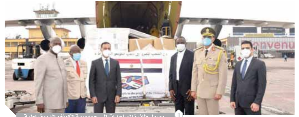
وصول طائرة المساعدات إلى جمهورية الكونغو الديمقراطية

وأضاف: تقدمت مصر بشكل كبير في دراسات الأبحاث السريرية على مستوى العالم، ومن خلال الجامعات المصرية والمعاهد والمراكز البحثية. وأشار الوزير إلى أن مصر تفوقت على دول كثيرة من دول الشرق الأوسط مثل إيران والأردن وإسرائيل ولبنان وقبرص وتركيا. وأشار الدكتور إلى أنه تقدم بعرض يوم ٢١ مايو واليوم يتم البناء على هذا العرض لمعرفة الأحداث التي اختلفت والأرقام التي تم تسجيلها، موضعا أهمية علوم البيانات في استخدام علوم الداتا في مواجهة فيروس كورونا المستجد للمساعدة في اتخاذ القرار مع الدولة ومع المواطنين من خلال العلم الخاص بعلوم البيانات.