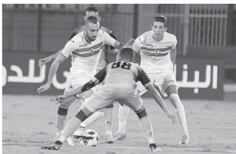
الزمالك تعادل مع الإنتاج مرتين في الدوري ويسعى للثورة عليه في كأس مصر