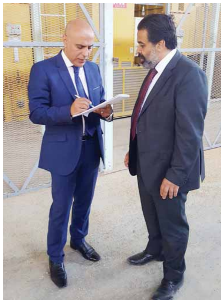
الوفد تتحاور المهندس الويللى