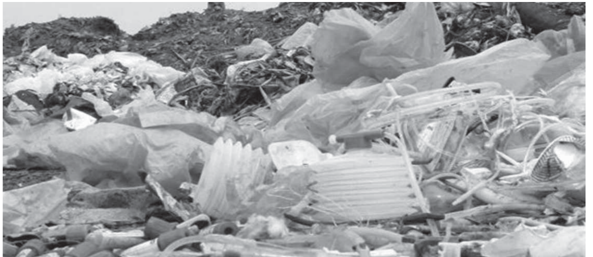
إلقاء النفايات الطبية في مقالب القمامة دون التخلص منها يندثر بكوارت صحية

شغلت قضية النفايات الطبية العالم منذ عقود عديدة، ومع التطور الكبير في المجال الطبي وانهماء العلماء بمنع انتقال العدوى بدأ الاهتمام بالتخلص الآمن من هذه النفايات الخطيرة، ومن ثم سُنّت الولايات المتحدة الأمريكية أول قانون للتخلص الآمن من النفايات الطبية عام 1988، وتوالى صدور قوانين مماثلة في دول العالم المختلفة، وبدأت منظمة الصحة العالمية ومنظمة الصليب الأحمر في دراسة الأمراض الناتجة عن التعرض لهذه المخلفات خاصة للعاملين في الحقل الطبي، وحددتها بعدة أنواع منها: أمراض الجهاز الهضمي الناتجة عن الإصابة بالكبديريا المعوية مثل السالمونيلا والشيغيلا التي تنتقل عن طريق الفئ أو البراز، وعدوى الجهاز التنفسي مثل أمراض السل وسارس، والأمراض الناتجة عن التعرض لإفرازات الجهاز التنفسي مثل العلقاب أو الحماق أو من خلال الاستنشاق، كذلك هناك الإصابة بأمراض الجلد عند التعرض لإفرازات الجلد كالتيف والصدئ، والتهاب السحايا عند