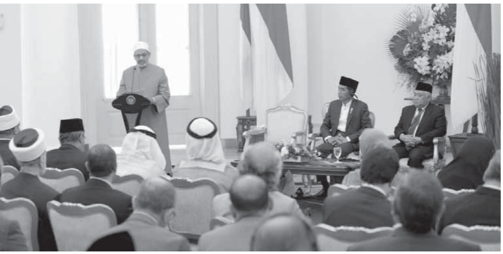
د. احمد الطيب يلقي كلمته في اللقاء التشاوري العالمي

من الله تعالى بأن أمة الإسلام إنما جاءت لتمثل «الأمة الوسط، والتي تتشدد ويغالي ويعزّم الحلال في الدين ليس أقل جرماً، ولا أنجى مآلاً من الذي يجعل ما حرم الله، كإلهاماً معتد على حرمة الإسلام، وكإلهاماً خارج على حدوده وتعاليمه، وكإلهاماً كاذب يزعم لنفسه حق التشريع في الدين بما لم يأت به الله.