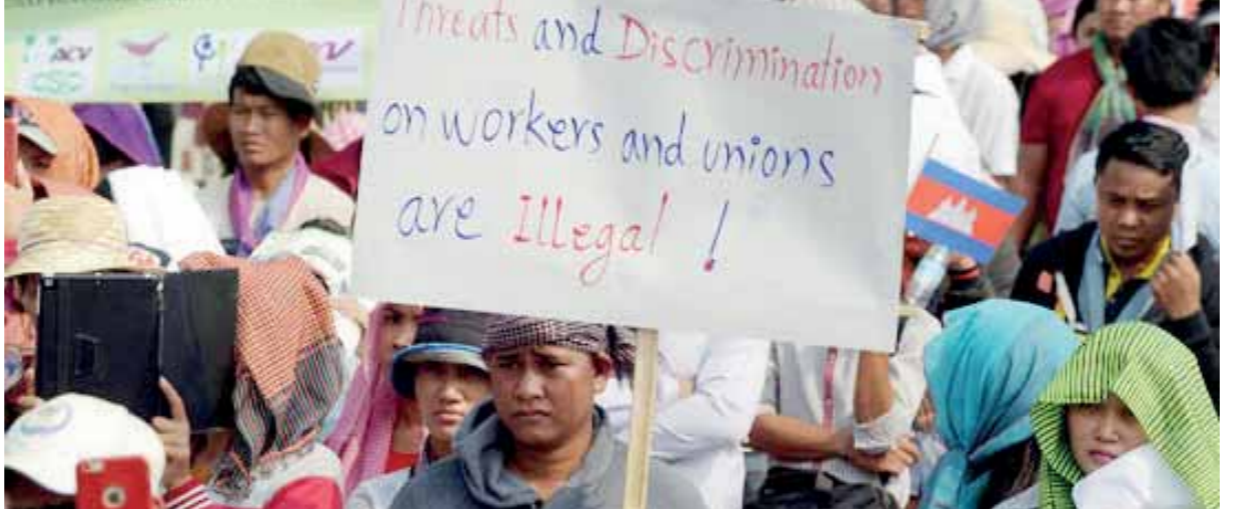
مسيرات غاضبة من العمال فى الفلبين وكمبوديا

موعدها ليتزامن مع يوم العمال العالمى، فى إطار فعاليات مماثلة فى جميع أنحاء العالم. وتحدثت عمال أمريكيون عن مخاوف بشأن تغييرات طرأت عليهم خلال عهد «ترامب»، بما فى ذلك حظر السفر المفروض على القادمين من عدة دول، وإلغاء برنامج يسمح لبعض المهاجرين الشباب بتجنّب الترحيل، وانتقلت بعض هذه السياسات إلى ساحات المحاكم، ولم يؤمن «ترامب» بعد تمويلاً لحدوده الحدود مع المكسيك، وقالت جماعات حقوق المهاجرين، إنها ستقاوم «ترامب» عند كل منعطف، وتستهدف أيضاً زيادة ونصف الكيلومتر.