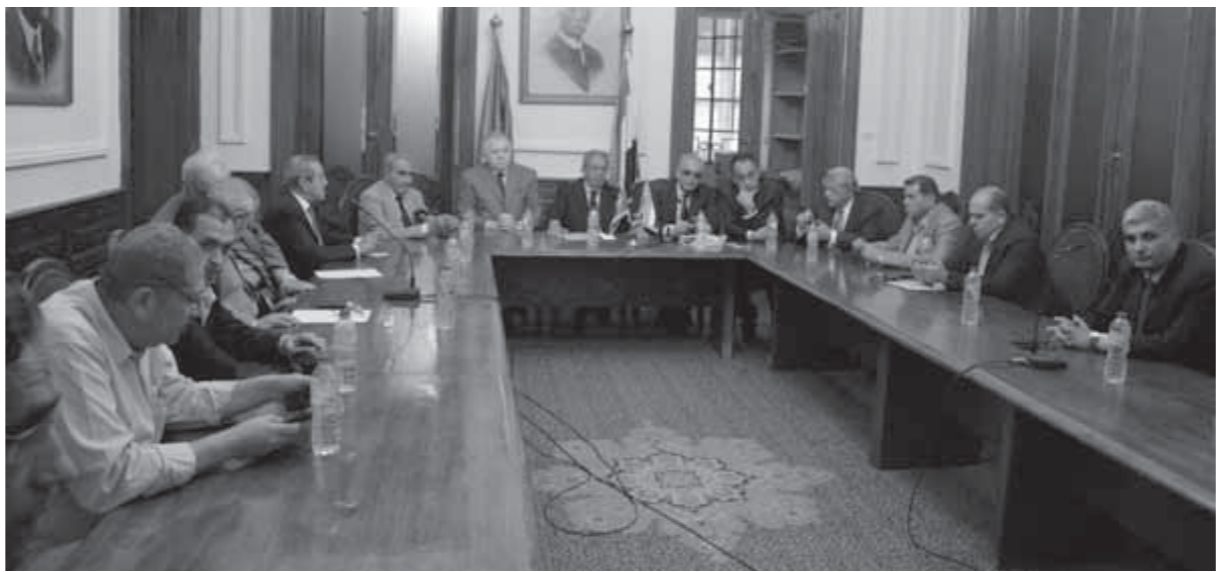
الجلسة الافتتاحية لمجلس الوفد الاستشاري