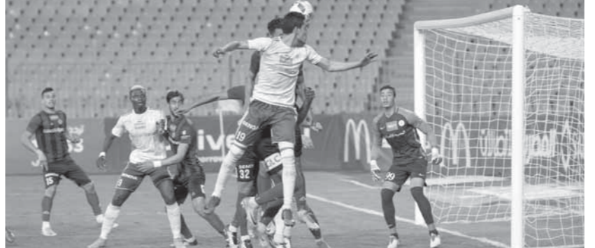
المصرى حقق نتائج جيدة في مبارياته الأخيرة بالدورى

إنبي والإسماعيلية والأهلي، حيث يحتاج الفريق البورسعيدى إلى 7 نقاط فقط لضمان وصافة الدوري والمشاركة مباشرة في بطولة دورى أبطال أفريقيا الموسم المقبل. وأكد حسام حسن المدير الفني للمصري أن طموح فريقه في الوصول لوصافة الدوري حق مشروع وهدف يسعى له الجميع، مشدداً على أن الجهاز الفني طالب اللاعبين بالتركيز الشديد وعرفة السيد.