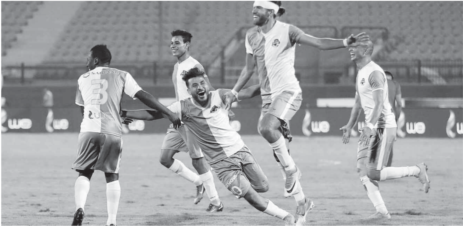
فرحة لاعبو الأسيوطي بالفوز على الأهلي

يا ريت نزي في التشكيل الوزاري القادم وزارة للأموال الطارئة وبها سلام لو كان وزيرها هو رئيس الهيئة الهندسية بالقوات المسلحة، لأن هذه الوزارة يجب وحثماً أن تكون تحت عباءة القوات المسلحة ووزارة الدفاع مثل الإنتاج الحربي لأن ما تتصدى له هذه الوزارة هو أمن قومي. بالله عليكم ويحق هذه الأيام المقترحة لو ما عجكمش كلامي تسامحوني وتسوا اللي قولته واعتبروه هلوسة وتقوموا تقترجوا على مسلسل تزكي أو تتكلموا على مشكلة الزمالك مع وزير الرياضة أي كها تسالي... اتمسوا على خير.