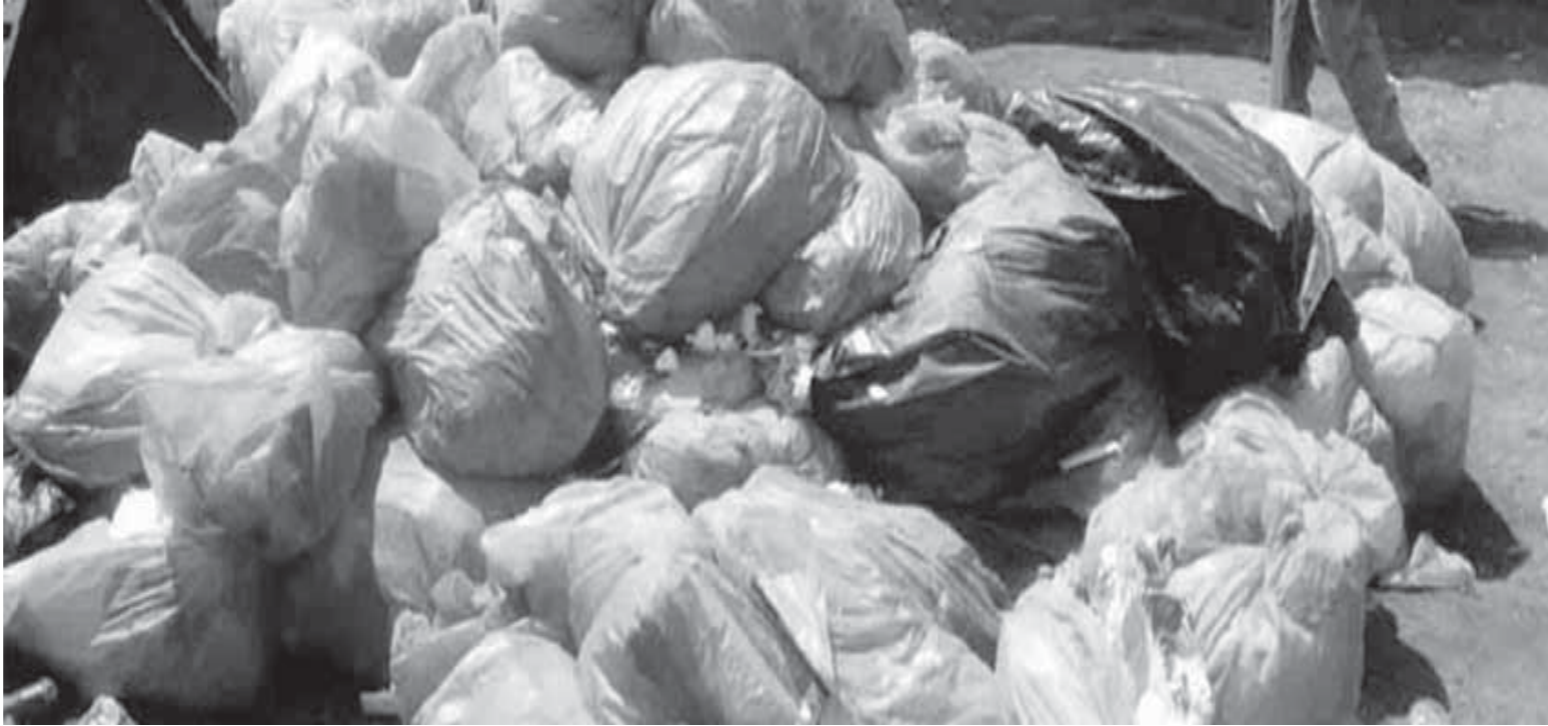
المخلفات الطبية لا تستوعبها المحارق الحالية