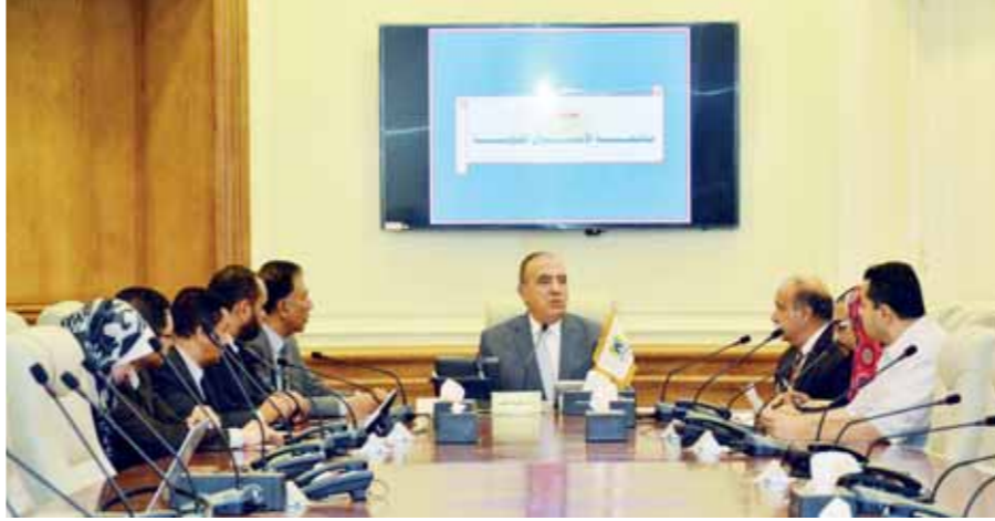
أبو بكر الجندي خلال اجتماعه بالمستشارين بالوزارة لتتابعه الأحوال الجوية

وأضاف وزير التنمية المحلية أنه وجه المحافظات برفع درجة الاستعداد اللازمة، وفتح غرف العمليات والطوارئ للإبلاغ عن الأحداث