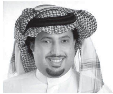
تركى آل الشيخ

خاصاً بمنتجات النادى ومسبجاً معلقاً بطل على اللاعب ومتحفين داخل الملعب أحدهما لكل الوسائل التكنولوجية، ومتحف آخر لعرض كؤوس وبطولات الأهلي بجانب أكاديمية للأهلى داخلية مغطاة، وأخرى خارجية وكل الوسائل التكنولوجية المتقدمة مثل، الواى فاي، وحجز التذاكر الإلكتروني ومسارح، ودور سينما، وحمامات سباحة بخلاف فندق اللاعب، ويضم 100 غرفة، جميعها مطل على الملعب، وستتم تسميته بأسماء أساطير الأهلي ونادى الرماية من جانبه، أعلن محمود الخطيب منح تركى آل الشيخ الرئاسة الشرفية للنادى الأهلي تقديرًا لدوره فائقًا لن آل الشيخ يذكره