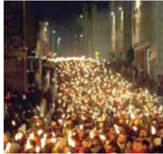
برج خليفة يتلألأ بأشعة الليزر

وفي مناطق أخرى من دبي، أضاءت الألعاب النارية سماء الإمارة، بينما تلك التي انطلقت من شواطئ شعبية، بينما ضاقت النوادي الليلية والمقاهي والمطاعم بالمحتفلين بالعام الميلادي الجديد.