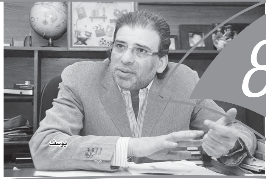
إشراف: أمجد مصطفى