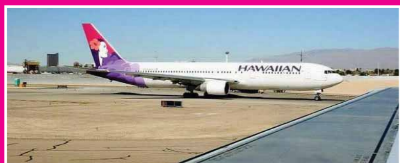
الطائرة التي عادت إلي الخلف

مع بداية عام جديد، لا تخلو فروق التوقيت بين الدول من مضارقات لا تحضر علي يال، وذلك بعدما أقلعت طائرة ركاب من مطار أوكلاند في نيوزيلاندا مع الدقائق الأولى عام 2018، غير أنها تعرضت لسيناريو «زمني» فريد من نوعه، إذ هبطت في مطار هونولولو بجزيرة هاواي الأمريكية في عام 2017. ووفقاً لصحيفة «مترو» البريطانية، كان