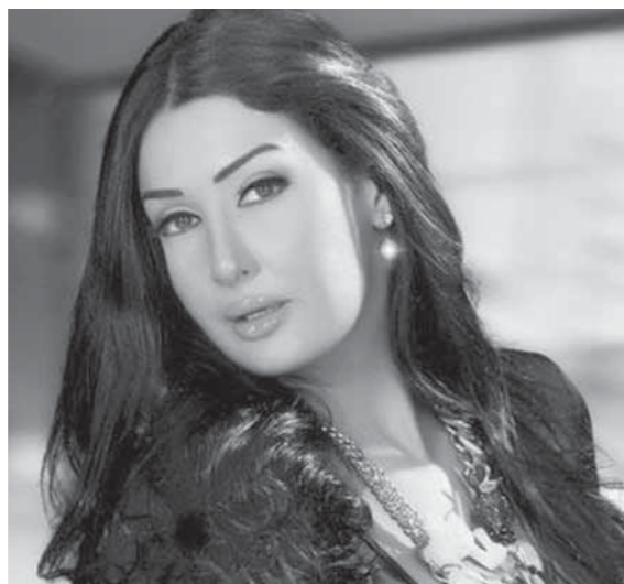
غادة عبد الرزق