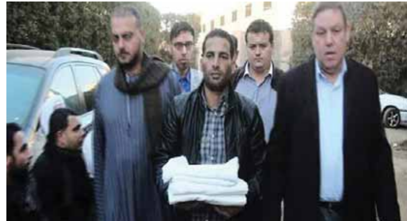
اجرات الصلح بين عائلتي عسران وأبوليمود

احتفلت الأقصر بليلة رأس السنة وسط رواج سياحي غير مسويق منذ 7 سنوات، وعادت الأضواء والألعاب النارية لتنتاللا في سماء المدينة التي اضطرت فنادقها للاستعانة براقصات روسيات وأوكرانيات في حفلات ليلة رأس السنة التي شارك فيها آلاف السياح الأجانب والمصريين، وذلك بسبب النقص في أعداد الرافعات المصرية وزيادة أعداد الحفلات بالتزامن مع ارتفاع نسبة الإشغال السياحي التي تجاوزت الـ 50%. وكانت فنادق الأقصر ومنشأتها السياحية قد عانت من أزمة من نوع خاص جداً هي النقص في أعداد الرافعات المصرية التي لم يُعدن يكفيين لتلبية الطلب المتزايد عليهم من قبل إدارات وملاك الفنادق والمنجعات والمنشآت السياحية في شرق