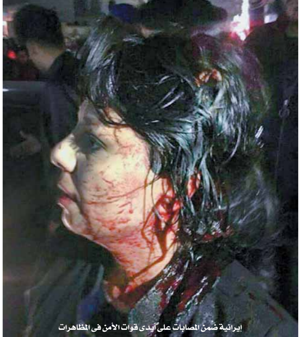
إيرانية ضمن المصابات على أيدي قوات الأمن في المظاهرات

نشرت وسائل إعلام إيرانية معارضة فيديو لعملية حرق مقر الحوزة العلمية ومبنى المحافظة في مدينة تابستان التابعة لمحافظة كيلان. وكشفت مصادر أن النظام الإيراني دفع بقوات من الحرس الثوري إلى مدن عدة لقمع المظاهرات، وأشارت المصادر إلى أن خارطة «فلايت ريدر» أظهرت طائرات حربية في الأجواء الإيرانية. ووصفت السفارة الأمريكية في الأمم المتحدة، نيكى هايلى، ما يجري في إيران بأنه اختبار من الشعب للسلطات، وذلك بعد 3 أيام من التظاهرات الاحتجاجية على الحكومة والأوضاع الاقتصادية، وقالت نيكى هايلى في بيان: «الشعب الإيراني المموغ منذ وقت طويل يرفع الآن صوته»، معربة عن أملها في أن تحترم الحرية وحقوق الإنسان في هذا البلد. وأعلن البيت الأبيض رسمياً تأييده الكامل للمتظاهرين المحتجين في إيران، وقالت المتحدثة باسمه، سارة ساندرز: «إننا نؤيد حق الشعب الإيراني في التعبير عن آرائه سلمياً، ويجب أن يسمع صوته»، وحذرت سارة ساندرز من قمع هذه الاحتجاجات قائلة: «نطالب جميع الأطراف بالدفاع عن هذا الحق الأساسي في التعبير السلمي وتجنب أي عمل يساعد على فرض الرقابة عليها». واشتعلت الانتفاضة الإيرانية بشعارات تطالب بإعادة العونات الاقتصادية لكنها سرعان ما تطورت إلى المطالبة بإسقاط النظام وتحيي المرشد، على خامنئي، من السلطة، وهتف المشاركون في الحراك الاحتجاجي الذي اجتاحت مدن إيران الكبرى ضد النظام الإيراني وتدخل إيران في سوريا، معتبرين نشاط طهران في الأزمة السورية جزءاً من تدوير اقتصاد البلاد.