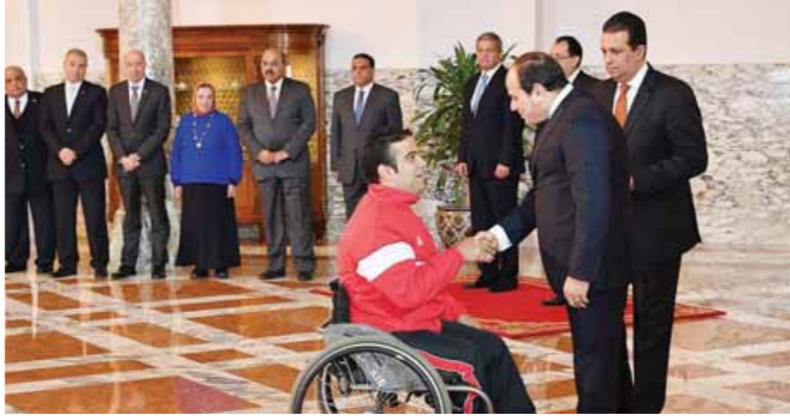
الرئيس يكرم أحد الأبطال

كرم الرئيس عبدالفتاح السيسي، أمس، الرياضيين الفائزين بميداليات وجوائز في البطولات الرياضية العالمية، والأجهزة الفنية التي تولت تدريبهم، حيث قام الرئيس بمنح أوسمة الجمهورية للأبطال الرياضيين. وقد حضر مراسم التكريم الدكتور مصطفى مدبولي، القائم بأعمال رئيس مجلس الوزراء وزير الإسكان، والمهندس خالد عبدالعزيز، وزير الشباب والرياضة، فضلاً عن رؤساء جهاز الرياضة للقوات المسلحة، واللجنة الأولمبية واللجنة البارالمبية، بالإضافة إلى عدد من رؤساء الاتحادات الرياضية المصرية.