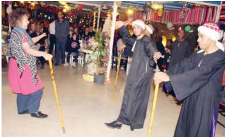
احتفالات الأقصر في رأس السنة