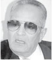
الإرادة المصرية القوية