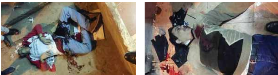
شقيقان قتلوا حتمهما على أيدي أحد الإرهابيين

إطلاقها من بندقية آلية وجار تحديد نوعها بعد الانتهاء من فحصها بعد أن تم تجميعها بواسطة خبراء المعمل الجنائي، كما تم رفع عينه من دماء الضحايا، واستمعت النيابة إلى أقوال شهود العيان.