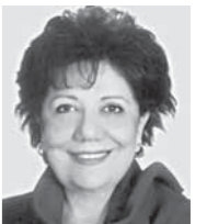
الإرهاب يا وزير التعليم