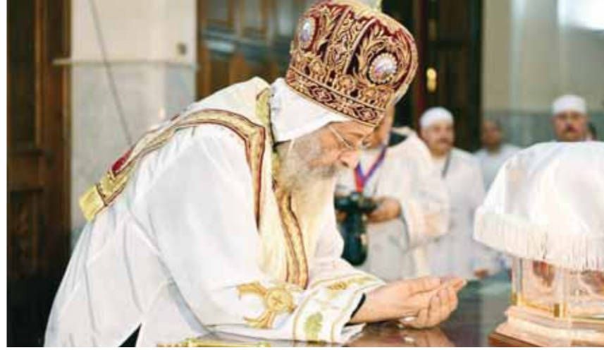
البابا يرأس القداس

وأضاف أن الكاتدرائية المرقسية بالعاصمة خصصت نحو 30 أتوبيساً: لنقل الأقباط المدعوين لحضور القداس؛ بسبب بُعد المسافة، لافتاً إلى وجود تنسيق مستمر مع القوات المسلحة في التأمين وتنظيم الاحتفال. وأوضح المصدر، أن الكنيسة ستؤمن الاحتفال بـ150 فرداً من شباب الكشافة، مؤكداً أن مهامهم تأتي في تنظيم الدخول، ومساعدة