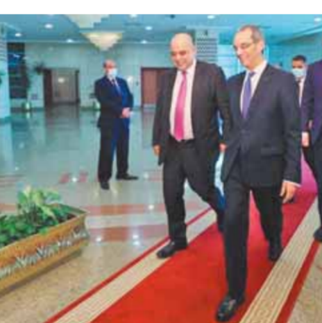
د. عمرو طلعت أثناء استقباله نظيره الأردني

أوضح طلعت محاور التعاون المقترحة بين الدول الثلاث والتي تشمل بناء القدرات الرقمية ودعم ريادة الأعمال، وإتاحة الفرص للشباب في البلدان الثلاثة لتأسيس شركات تركز على المعطيات الحديثة؛ مشيراً إلى أنه تم أيضاً بحث التعاون في مجال تقنيات الذكاء الاصطناعي والتي يمكن الاستفادة منها في عدة مجالات منها الرعاية الصحية