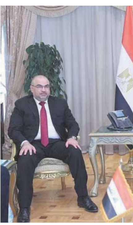
د. عمرو طلعت أثناء اجتماعه بوزيري الاتصالات العراقي والأردني

إدارة الموارد المائية والبيئة والزراعة ومعالجة النصوص العربية؛ والتعاون في مجال الربط البيني وإتاحة النفاذ إلى الفضاء السببراني لعدد أكبر من المواطنين في البلدان الثلاثة بما يساهم في تحقيق الوحدة الرقمية والنهضة التكنولوجية. أكد المهندس أركان شهاب الشيباني وزير الاتصالات بجمهورية العراق أن المحاور الاستراتيجية الثلاثة للتعاون تفتح الأفق للتعاون في محاور متعددة؛ عربياً عن تطلعه لإقامة شراكات بين القطاع الخاص في البلدان الثلاثة مع توفير الدعم من الحكومة لإقامة هذه الشراكات التي ستسهم في إتاحة فرص عمل للشباب؛ مشيراً إلى أنه تم طرح مقترح أن يتم دعوة شركات القطاع الخاص والشركات الناشئة العاملة في البلدان الثلاثة إلى ملتقى يقام في إحدى المدن الثلاث (شرم الشيخ أو البصرة أو العقبة) من أجل تحقيق التعاون وإقامة شراكات فيما بينهم.