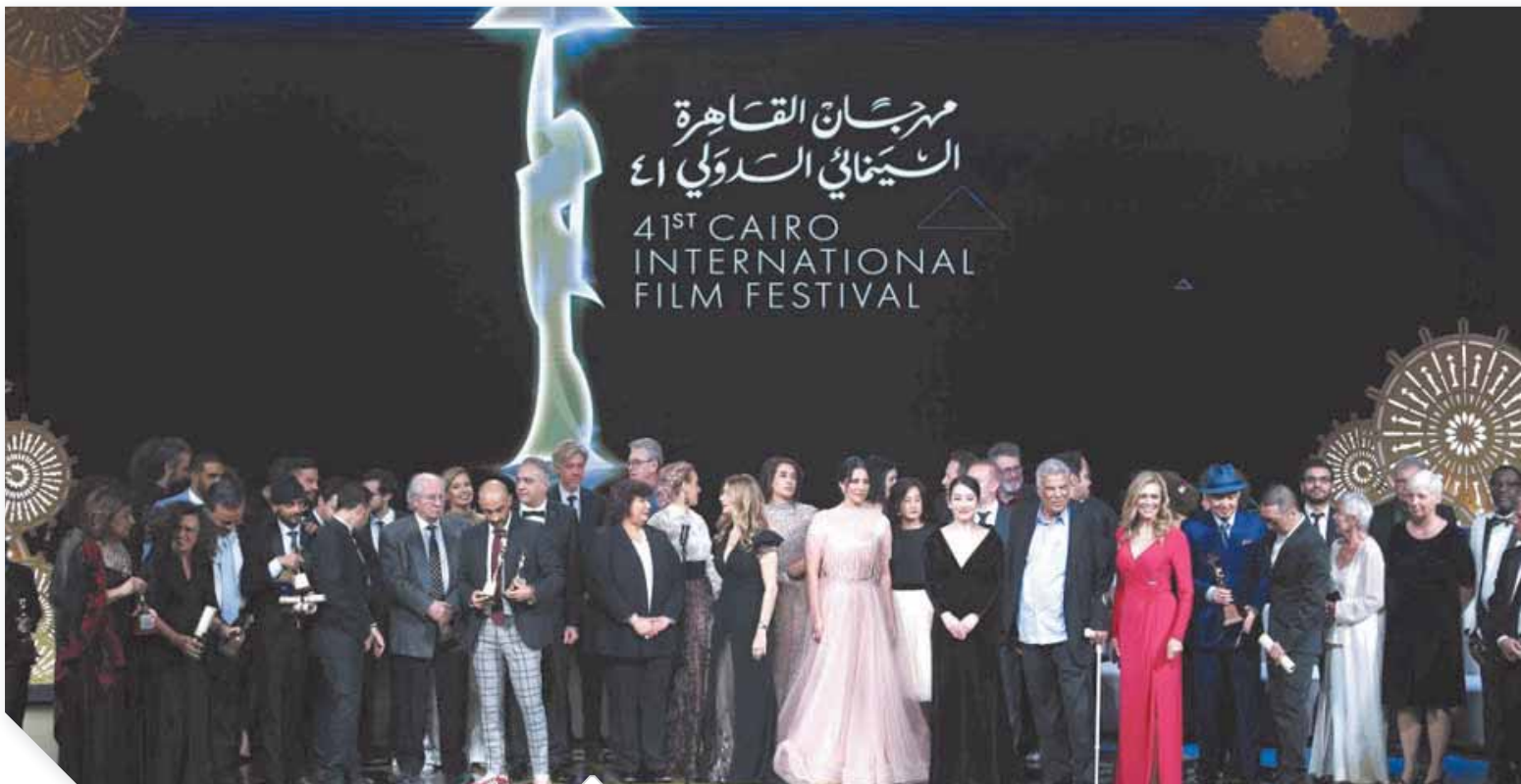
مشهد تذكاري من القاهرة السينمائي في دورته ٤١

كتبت - أنس الوجود رضوان ويوسى عبدالجواد: