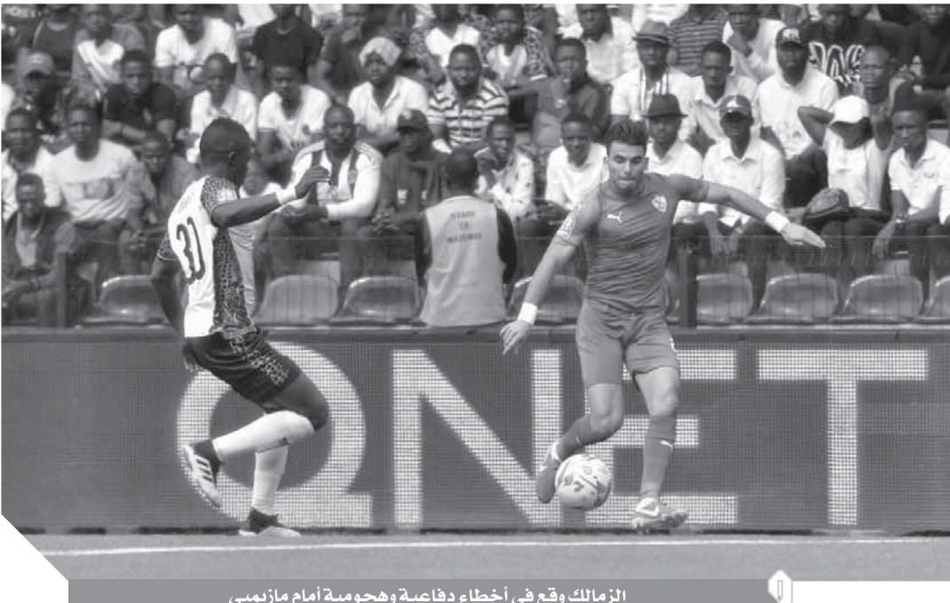
الزمالك وقع في أخطاء دفاعية وهجومية أمام مازيمبي