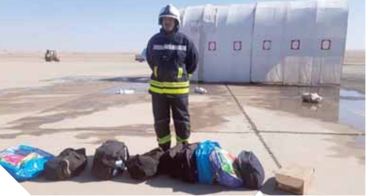
جزء من تجربة الطوارئ بمطار الأقصر

«النشار»: في صدارة تجارب الطوارئ التي تتعامل مع الأخطاء وحطام الطائرة بعد تحطمها