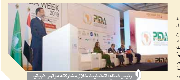
رئيس قطاع التخطيط خلال مشاركته مؤتمر إفريقيا