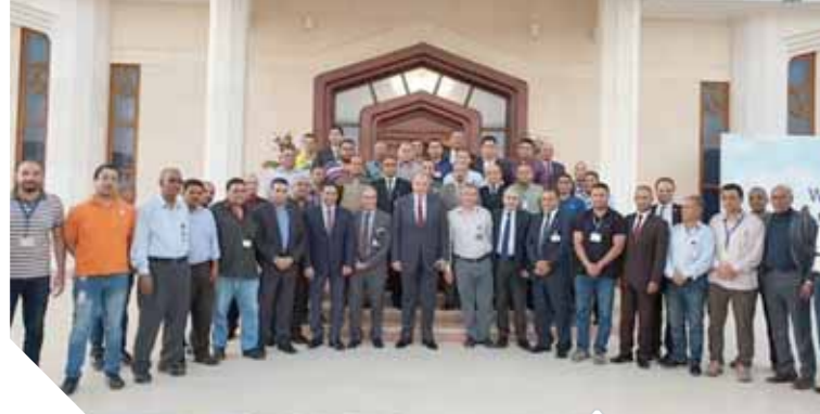
اللواء وائل النشار وسط العاملين بمطار شرم الشيخ

شارك وفد من وزارة الطيران المدني برئاسة المهندس أشرف شادى رئيس قطاع التخطيط بالوزارة في فعاليات الأسبوع الخامس لبرنامج البنية التحتية (PIDA) تحت عنوان «إعداد أفريقيا لتنفيذ أجندة ٢٠٢٣»، كما شارك ممثلون عن شركة مصر للطيران والأكاديمية المصرية لعلوم الطيران وشركة سيف لتأجير الطائرات في المؤتمر من خلال أجنحة تسويقية مختلفة لعرض أنشطتهم وخدماتهم.