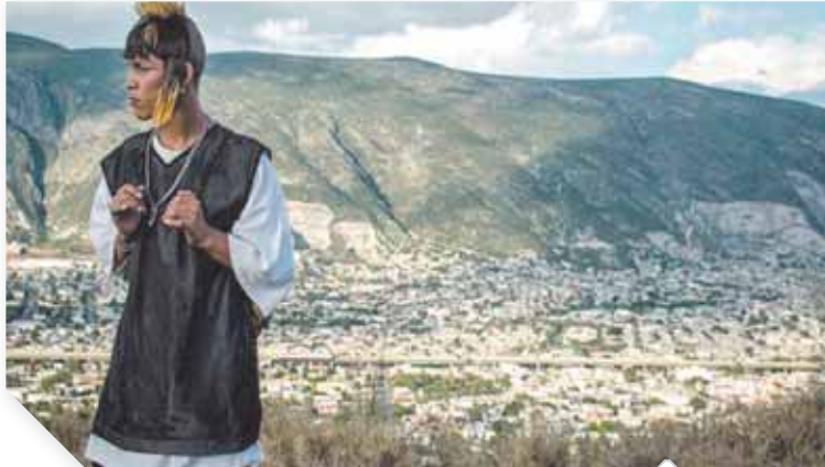
الفيلم المكسيكى الحاصل على الجائزة الذهبية

تمثلى، وفاز الفيلم الرومانى «اعتقال» للمخرج أندريه كون، بجائزة فتحي فرج جائزة لجنة