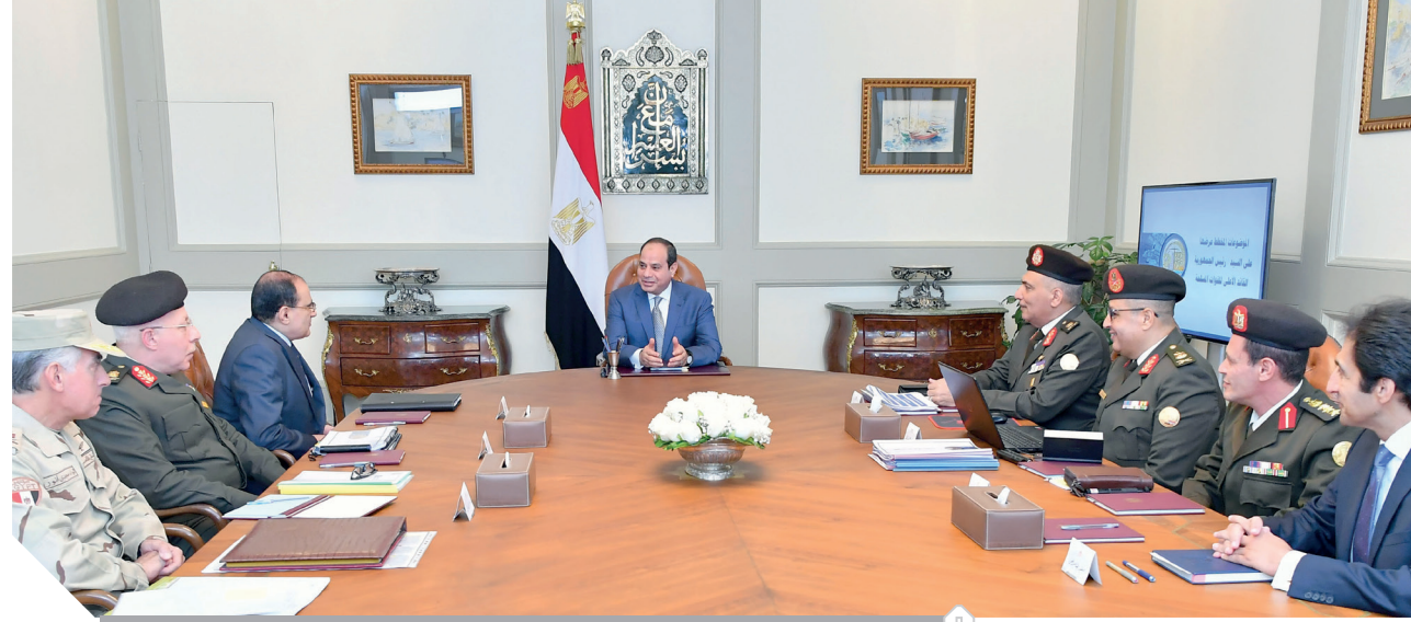
السيسي خلال اجتماعه مع رئيس الهيئة الهندسية وعدد من المسؤولين