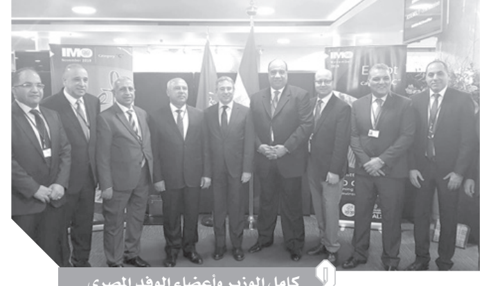
كامل الوزير وأعضاء الوفد المصرى

كتب - محمود شاكر- تهانى شعبان- أميرة فتحى: فازت مصر بعضوية المجلس التنفيذي للمنظمات البحرية الدولية عن دول المجموعة «C» خلال الاجتماع الذى عقد بلندن، حيث حصلت مصر على ١٢٢ صوتاً من إجمالي ١٦٥ دولة لها حق التصويت، ويعد الفوز بعضوية مجلس المنظمة البحرية الدولية له أهمية كبيرة بالنسبة لمصر، التي تعتبر من الدول الرائدة فى مجال النقل البحري، وخاصة ما تتمتع به من موقع جغرافى يمثل قلب العالم، وبما لها من حدود بحرية ممتدة على ساحل البحر المتوسط والبحر الأحمر وقناة السويس، وأكد الفريق كامل الوزير