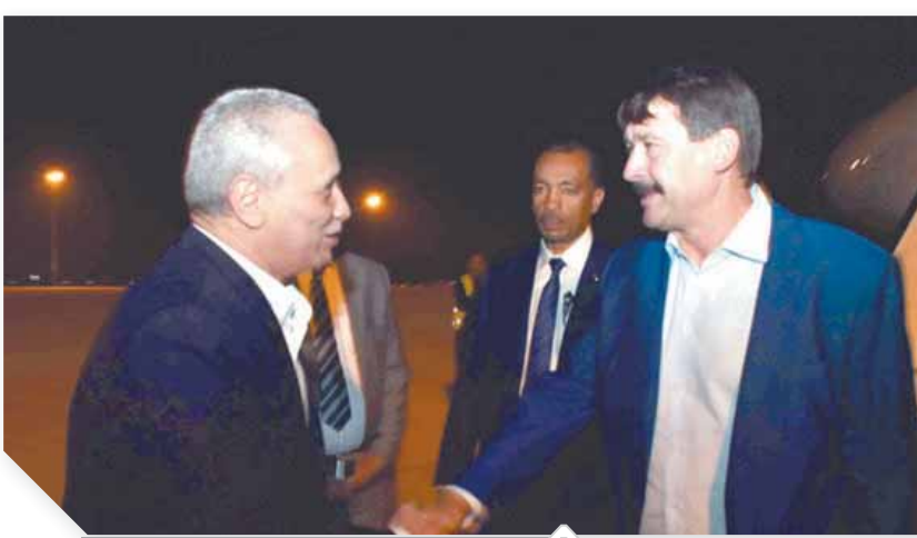
محافظة الأقصر خلال استقباله رئيس المجر

والغربي لمدينة الأقصر. وكان الرئيس المجرى قد أجرى خلال زيارته الرسمية لمصر، محادثات مع الرئيس عبدالفتاح السيسي، تناولت سبل تعزيز العلاقات الثنائية بين البلدين، والتعاون المشترك فى عدد من المجالات.