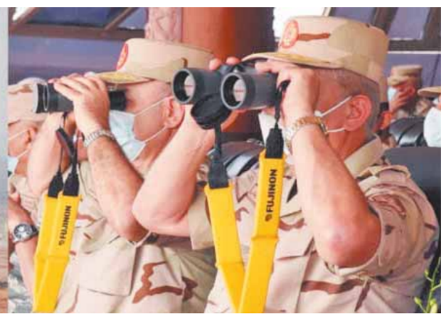
البيان العملى «مجد ١٦»