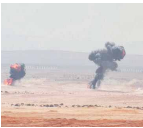
البيان العملى «مجد ١٦»

كتبت - نغم هلال: نفت وزارة الزراعة واستصلاح الأراضى ما تم تداوله عبر وسائل التواصل الاجتماعى من مصادر غير معلومة عن خبر كاذب مصحوب بفيديو يزعم ورود شحنة موز فاسد من الصومال تحتوى على ديدان تسبب تسهما فى المعدة، ويدعو المواطنين إلى الامتناع عن شراء واكل الموز هذه الأيام وفقاً لما جاء بالخبر الكاذب. وأكدت وزارة الزراعة عدم صحة هذا الخبر تماماً، وأنه لم