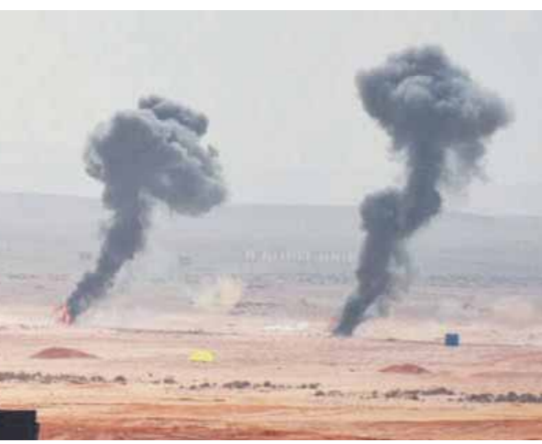
البيان العملى «مجد ١٦»