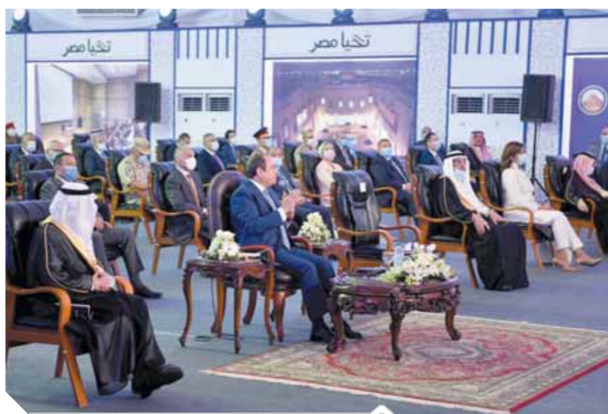
السيسي، أثناء كلمته في افتتاح الجامعة

نسعى لإنشاء جامعات بمواصفات عالمية.. وقمنا بترميم ٧٥ كنيسة