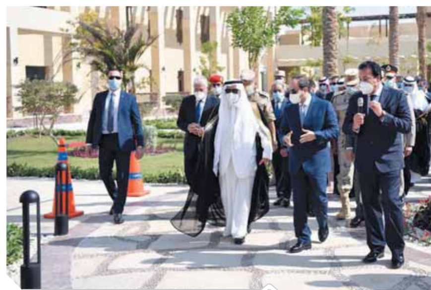
الرئيس خلال جولته في جامعة الملك سلمان