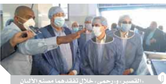
القصور، ورجمي، خلال تفقدهما مصنع الألبان