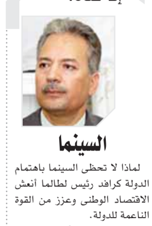
السينما لماذا لا تحظى السينما باهتمام الدولة كرافد رئيس لظلمة أنش الاقتصاد الوطنى وعزز من القوة الناعمة للدولة.