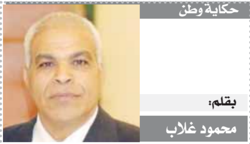
بقلم: محمود غلاب

صدر الحكم فى الدعوى رقم ٣٦٨٥١ لسنة ٧٤ ق،