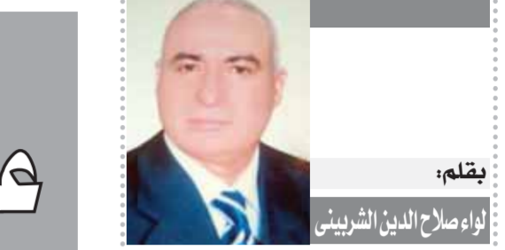
بقلم: لؤى صلاح الدين الشربيني

المجموعات الست السابقة هى الأساس لتوطين التنمية المستدامة فى كل خطواتها لضمان وضع أسس المؤسسات الاجتماعية للأعمالية الحديثة بصورة تضمن تحقيق التوافق بين الاخلاق المصرية الاميلة مع العدالة المجتمعية فى النظام الراسمالى الجديد الذى تقوده الدولة المصرية يفكر استراتيجى تضمن به ضبط ايقاع المعاملات والانظمة بعيدا عن سيطرة قوى السوق وما يرتب علىه من قوى احتكارية تهاوى فيها منظومة القيم المصرية التى يجب ان تكون داعمين لهذه المنظومة الاخلاقية التى ترى فيها انها سبب تقدمنا المستقبلى، بشرط احدث التناغم والتنسيق والتكامل المشترك بين المجموعات الست السابقة لكسب الثقة المحلى والعالمى لمواجهة اسد مشوار التنمية الصعب وسط اذن صراع الحضارات والتي تزد فيها ان تكون مصر مؤهلة لقيادة العالم الاسلامى.