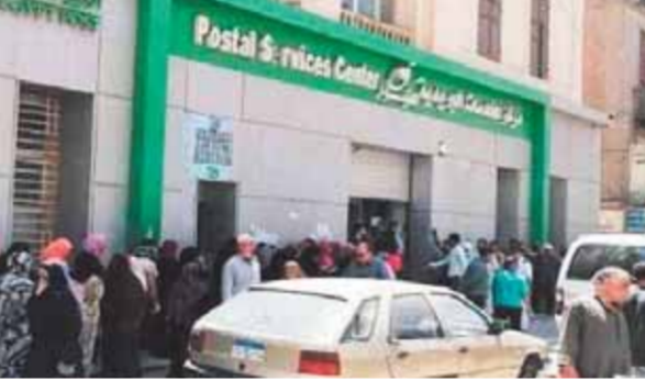
زحام امام مكتب بريد الفيوم

تشهد مكاتب البريد بقرى ومراكز محافظة الفيوم معاناة يومية لكبار السن والسيدات وأصحاب الأمراض المزمنة بسبب الزحام الشديد فى ظل ارتفاع درجات الحرارة والحاجة لصراف معاشاتهم لسد احتياجاتهم ما بين معاشات كبار السن وتكاليف وكرامة وسط زحام شديد تحت لهيب حرارة الشمس وعدم التزام الغالبية العظمى بالإجراءات الاحترازية المتبعة للوقاية من عدوى انتقال فيروس كورونا سواء بارتداء الكمامة أو مراعاة التباعد الاجتماعى بينهم بسبب غياب التنظيم أمام المكاتب تارة وتقاوس الموظفين تارة أخرى، بالإضافة إلى سوء معاملة من بعض الموظفين للسيدات وكبار السن الذين يترددون على المكاتب وما زالت المعاناة تزداد يوماً بعد يوم دون تدخل أو محاولة للتخفيف عنهم.