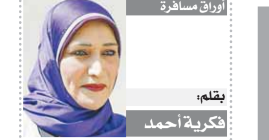
بقلم: فكرية أحمد