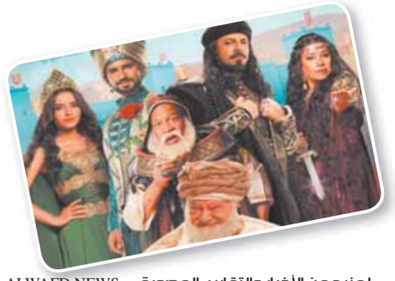
لمزيد من الأخبار والتقارير المصورة ALWAFD.NEWS

الذين لا توجد به بيروقراطية لأنها تقضى على الإبداع، ولا بد أن تكون ميزانية كل مسرح منفصلة من مساح الدولة، لكي يتم الاهتمام بالمنتج الذي يقدم، فلا يمكن أن يتم التعامل مع العروض المسرحية بهذا الشكل، وهذا من الأسباب التي دفعتني للعمل مع القطاع الخاص الذين يوفرون كافة الإمكانيات للعرض