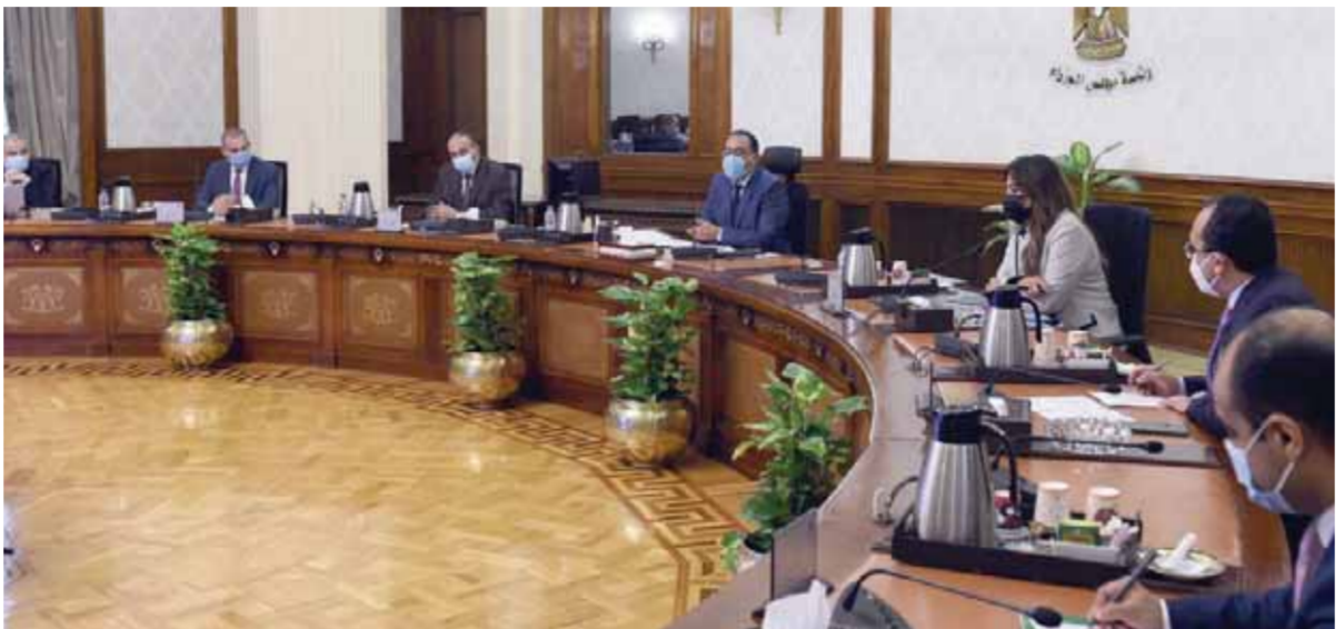
رئيس الوزراء خلال اجتماعه بالمستولين عن تطوير منطقة القاهرة التاريخية

على محاور الحركة الرئيسية بالدرب الأحمر، وترميم مبان ذات قيمة معمارية وتاريخية مثل وكالة نقيسة البيضاء وكالة رضوان بك، مع التعامل وفق إجراءات احترازية مع المبانى المجاورة للمبانى الأثرية أدوات القيمة أثناء التطوير للحفاظ عليها.