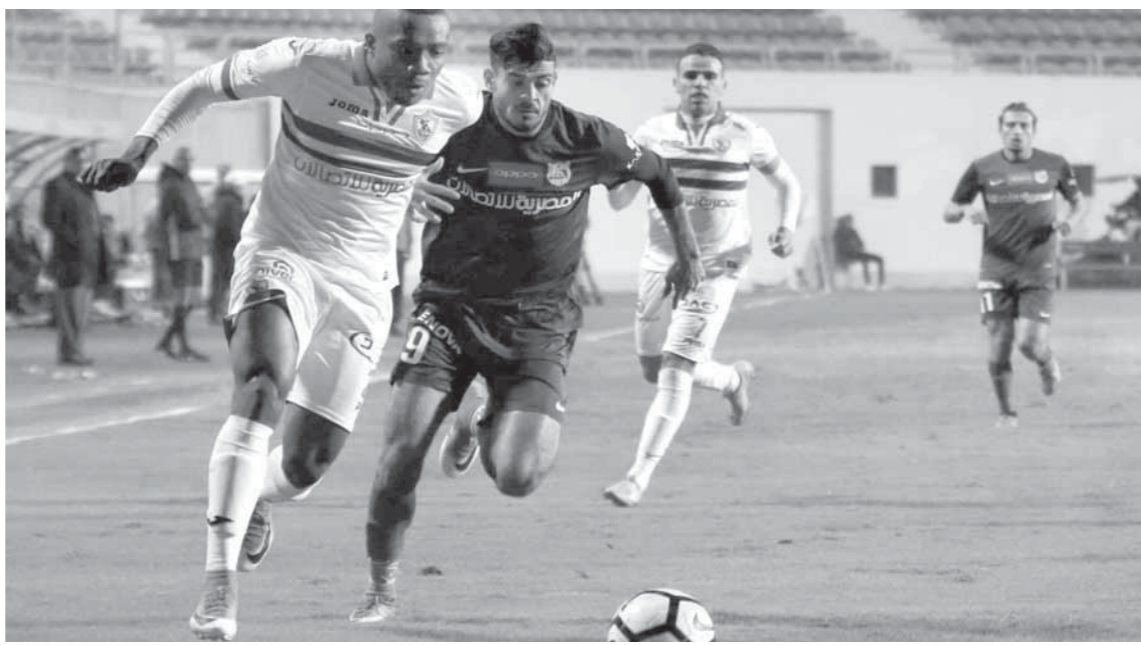
الزمالك فى مهمة صعبة أمام إنبي بعد هزيمته من النجوم