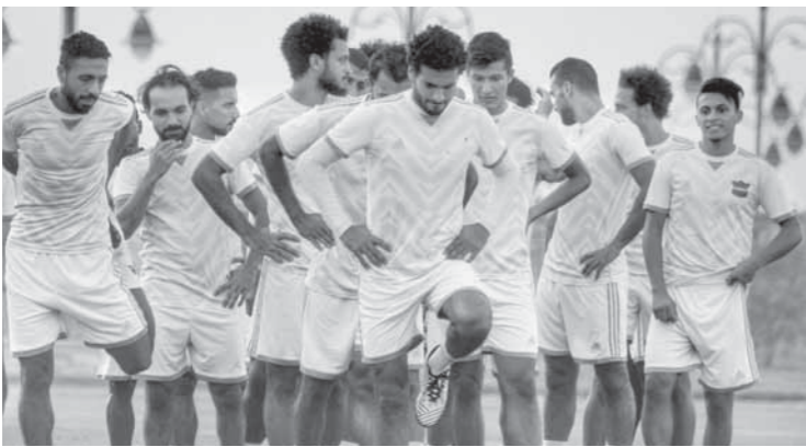
المقاصة يستعد بجديفة لمواجهة المصرى

كما أجرى عامر حسين عدة اتصالات هاتفية بهانى رمزى مدرب المنتخب لمعرفة طلبات الجهاز الفنى لتوفيرها، وتمثلت معظم الطلبات فى ضرورة توفير وسائل الاستشفاء للاعبين داخل الفندق وتجهيز ملعب المباراة وقاعة المحاضرات والمجهزة بوسائل العرض الحديثة. وعلمت «الوفد» أن خافيير أجيرى رفض تلبية دعوات العشاء المعتادة بأحد المطاعم البيوتية