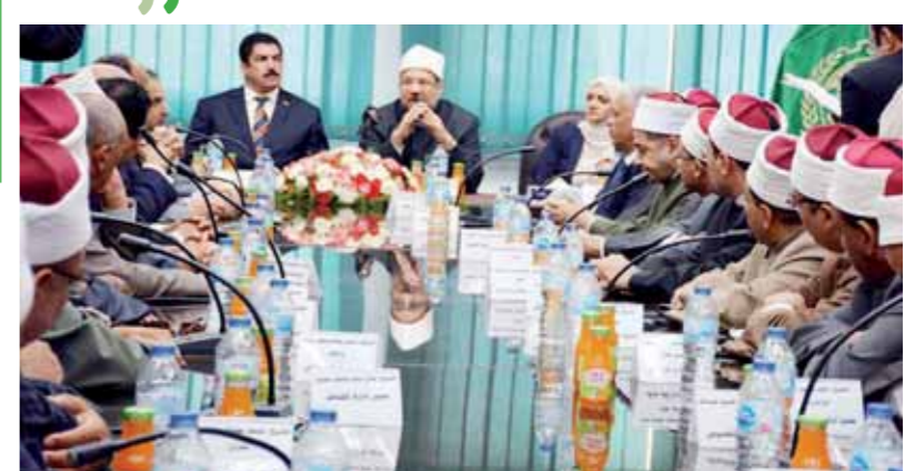
جانب من المؤتمر الصحفى بحضور وزير الاوقاف وفضيلة المفتى ومحافظ القليوبية

انطلاقاً من حرص القيادة العامة للقوات المسلحة على رعاية المتفوقين لتحفيزهم على مواصلة التفوق والعباء، نظمت القوات المسلحة احتفالها السنوى لتكريم الطلبة المتفوقين فى مختلف الشهادات العامة والجامعية والدراسات العليا من أبناء الضباط العاملين والمتقاعدين وضباط الصف والعاملين المدنيين والحاصلين على درجة الدكتوراه فى مختلف المجالات عن العام الدراسى 2017/2018. بدأ الاحتفال بالمحرمات الوطنية للموسيقىات العسكرية والترحيب بضيوف الحفل وعزف الأناشيد الوطنية وسط جو أسرى عمه الفرح والسرور. والقى اللواء مدحت النحاس مساعد وزير