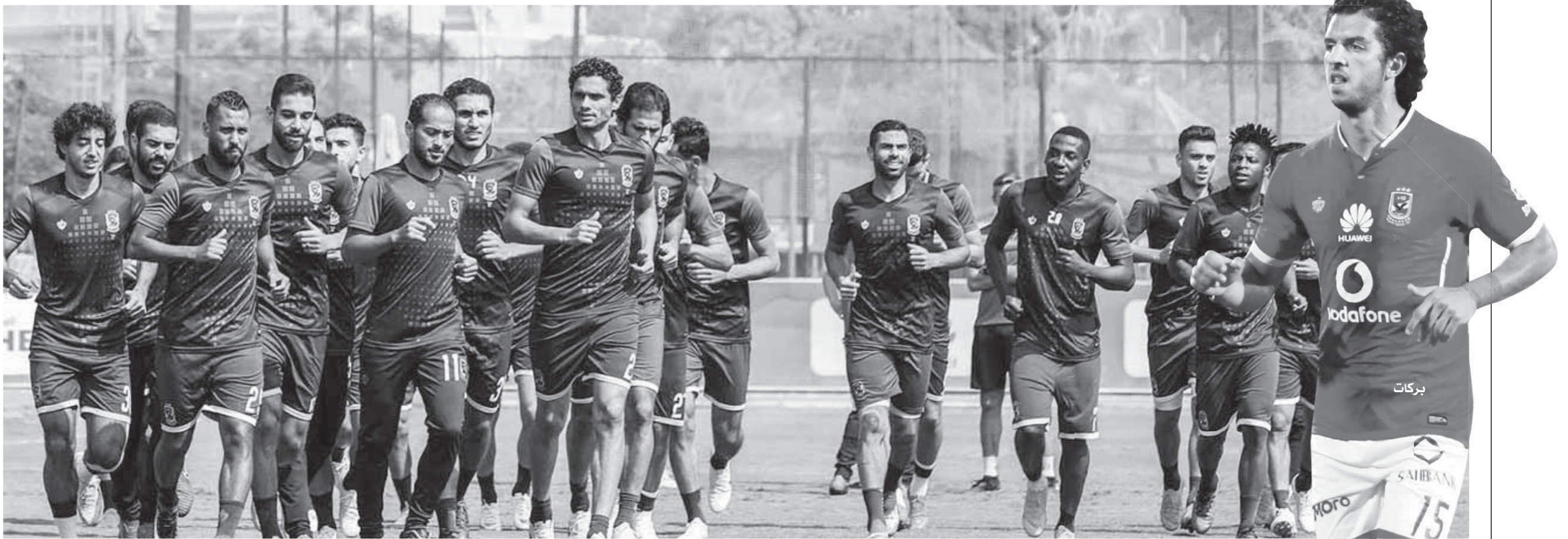
الأهل يخبّتم تدريباته استعداداً للإنتاج

التشفيذ فتح باب الحجز للجماهير عبر شبة الانترنت بنظام الآون لاين» للحصول على تذكار مباراة الأهل والإنتاج الحربي وهنّما لقرار إتحاد الكرة الأخير بعودة الجماهير تدريجياً. وتم طرح ألف تذكرة موحدة فته 30 جنيتها، و300 تذكرة أولى «شمال» فته 50 جنيتها، و200 تذكرة مقصورة رئيسية فته 300 جنيتها، بالإضافة الى 1500 تذكرة بنفس النسب والأسعار. سيتم طرحها لأعضاء النادي في الفروع الثلاثة، أما حصّة الفريق الضيف ستكون 500 تذكرة أولى وبين فته 50 جنيتها، وهناك 1500 دعوة لطلبة الجامعات سيتم تسليمها لوزارة الشباب والرياضة ليصل الحضور الجماهيري إلى 5 آلاف مشجع. وناشد مرجان جماهير الأهل الواعية الحرص على نجاح تجربة عودة الجماهير في مرحلتها الأولى لتكون بداية للعودة الكاملة خلال الفترة القادمة، خاصة أن الأهل يحتاج جماهيره ويراهن على دعمها ومساندتها في كل المواقف.