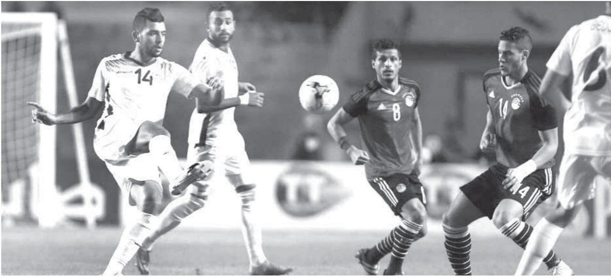
المنتخب يسعى للفوز على النيجر بعد الهزيمة أمام تونس

حسن «سموحة» - إسلام جابر «الداخلية».. بينما ينضم الـ 13 لاعباً المحترفين فى الخارج يومي 3 و4 سبتمبر. وأعلن هانى رمزى مدرب المنتخب أنه تواصل هاتنياً مع محمد صلاح وتحدث معه بشأن الأزمة التى أثرت مؤخراً بين صحابه واتحاد الكرة، وقال صلاح إن تلك الأزمة لن تؤثر على انتظامه فى معسكر المنتخب ومشاركته فى المباراة. وتضم قائمة المحترفين الذين تم استدعاؤهم لمباراة النيجر كلاً من محمد عواد «الوحدة»