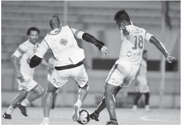
الاتحاد يستعد بجديّة للقاء الترجي