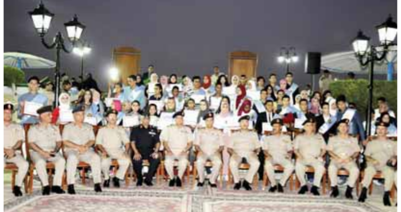
جانب من حفل التكريم السنوى

الدفاع كلمة نيابة عن الفريق أول محمد زكى القائد العام للقوات المسلحة وزير الدفاع والإنتاج الحربى وجه من خلالها التحية والتقدير للطلاب المتفوقين من أبناء أسر القوات المسلحة مباركا لهم نجاحهم، وقدم الشكر لأولياء الأمور لما بذلوه من الجهد طوال العام الدراسى، لإعداد الكوادر التي تعد أمم مصر وسيلها نحو الحلق بركب التقدم العلمى الذى يشهده العالم فى كافة المجالات مطالباً بإيحاءهم بمزيد من الاجتهاد والتفوق من أجل رفعة الوطن. من جانبهم أعرب الطلاب وأسرهم عن سعادتهم البالغة لما لمسوه من وفاء القوات المسلحة لأبنائها لبتقى دائما متماسكة ترحمى العلم وتشجع الشباب نحو غد أفضل لمصرنا الغالية.