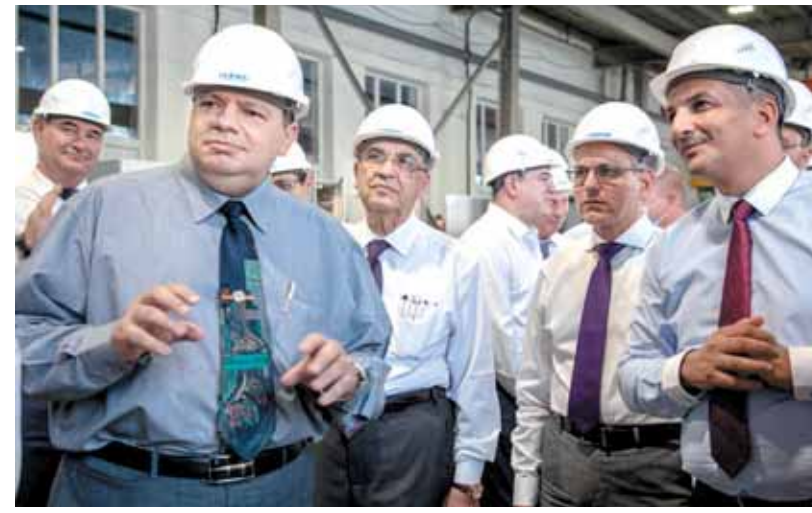
وزير الكهرباء يشهد تصنيع أول أجزاء مفاعل الضبعة في روسيا