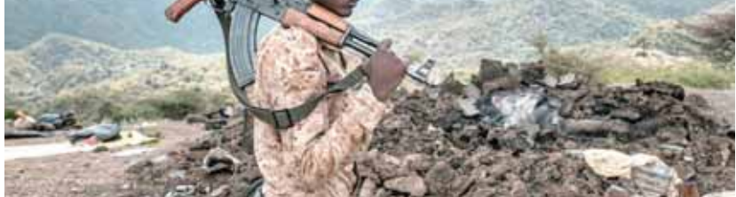
الحرب تأكل الأخضر واليابس فى تيجراى

انسانية وحدثت مجاعة فى الإقليم. وأضافته المجلة، فى تقرير لها أن الحكومة الإثيوبية مصرة على مواصلة الحرب رغم الخسائر التى تكبدها أمام قوات تيجراى، مشيرة إلى أن الجرحى لا يجدون رعاية طبية هناك ويرقدون على رقعات أمام المخيمات، وأن مراسل المجلة جرى اعتقاله بمجرد وصوله إلى هناك وجرى احتجازه لساعات. وأشارت إلى أن المواجهات المستمرة أضعفت الجيش الإثيوبى، ونجحت قوات تيجراى- فى المقابل- فى التوغل لمسافة ٨٠ كيلومتراً من جوندرا، العاصمة التاريخية لإثيوبيا، مضيفة أنه قبل بضعة أسابيع، عندما استولت قوات تيجراى على المنطقة، بما فى ذلك العاصمة الإقليمية ميكيلي، كانت هناك فرصة لإنهاء الحرب الأهلية فى إثيوبيا عن طريق التفاوض، ولكن بدلاً من ذلك، دخلت الحرب أخطر مراحلها بالنتيجة إلى الوضع الحالى.