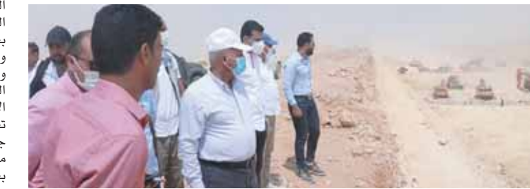
وزير يشهد تفجيرات إزالة الصخور التي تعترض مسار القطار الكهربائى

التفصلى لتنفيذ بالإضافة إلى أنه تم تحديد موقع الورشة الرئيسية الخاصة بأعمال الصيانة والتي تقدر مساحتها بحوالى ٤٧٠ هكتاراً بقرع شرق الطريق الدائرى الإقليمى وجنوب طريق السخنة ويتم تنفيذ كافة الأعمال المدنية والإنشاءات السائلة (الكبارى وبواسطة كيريات الشركات المصرية المتخصصة فى هذه المجالات بالإضافة إلى الأعمال الصناعية على الطرق المتقاطعة مع مسار القطار تحت إشراف الاستشارى العام للمشروع سيسنتر. كما أنه جار البدء الفورى بالتزامن مع هذه الأعمال، فى تنفيذ منظومة الإشارات والاتصالات والتحكم ونظم الكهرباء بجانب تصنيع وتوريد ٣٥ قطار ركاب سريع وإقليمية و١٠ جرارات لنقل البضائع.