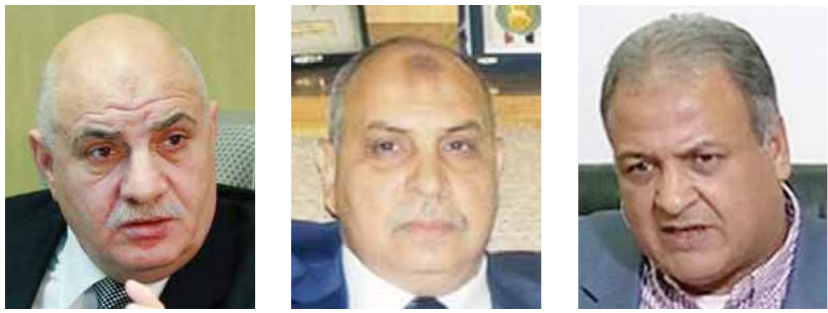
منصور، شحاتة، عبد الباري

صحيفة يومية أسسها فؤاد سراج الدين عام 1984 برئاسة تحرير مصطفى شردى - تصدر عن حزب الوفد المصري