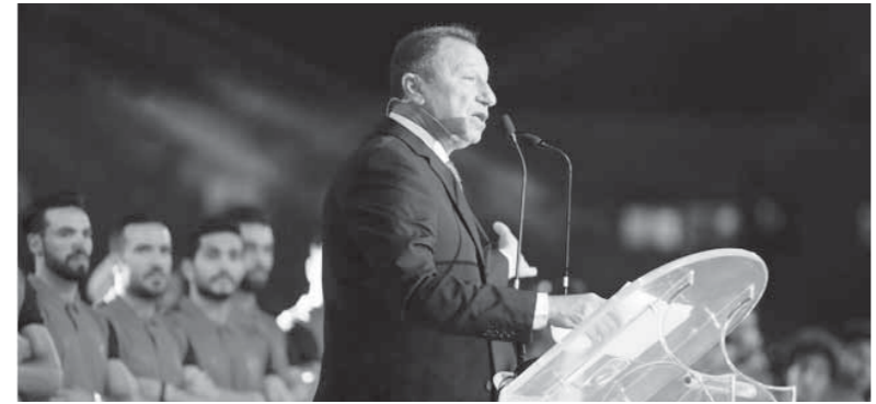
الخطيب في حفل تكريم أبطال الأهلي

وأضاف: «حققنا في الموسم المنقضى على مستوى الألعاب 296 بطولة وهو رقم أعلى ولذلك كان ضرورياً أن يقام حفل تكريم لهم