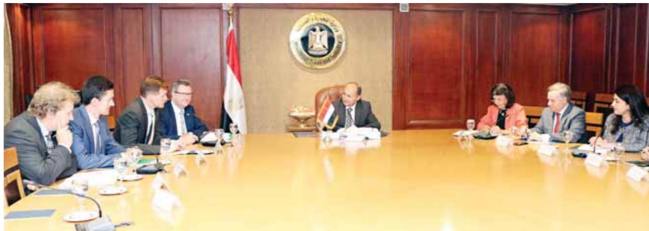
وزير التجارة خلال لقائه والمبعوث البريطاني

مشيرا إلى أن أسواق دول شرق أفريقيا الواقعة في نطاق اتفاقية الكوميسا تعد من الأسواق المحورية للصادرات المصرية بالقارة الأفريقية. كما أن هناك فرصا كبيرة لزيادة الصادرات المصرية لأسواق سوريا والعراق، خاصة في ظل مشروعات إعادة الإعمار الحالية. وأشار الوزير إلى أن وزارة التجارة والصناعة تسعى لزيادة الاستثمارات الأجنبية المباشرة الموجهة للقطاعات كثيفة العمالة في مجال الصناعة