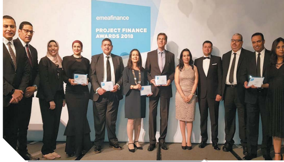
فريق قطاع القروض المشتركة مع قيادات البنك

بالقطاعات الحيوية في مجالات الزراعة، والصناعة، البترول والكهرباء والنقل والمواصلات، ومواد البناء، والمخاطبات الغذائية والتنمية العقارية وهو ما يساهم في خلق قيمة مضافة للاقتصاد القومي المصري وتوفير الكثير من فرص العمل بما يدعم خطط الدولة ويدفع بعجلة التنمية، مشيراً إلى أن البنك حريص على المشاركة في مثل هذه المؤتمرات والاجتماعات المحلية والخارجية التي تتوافر لديها الثقة في قدرة البنك الأهلي على إتمام وإدارة الصفقات الكبرى بمهنية وحرفية عالية مستنداً في ذلك إلى قاعدة رأسمالية كبيرة تتيح له فرصة ضخ تمويلات كبيرة سواء منفرداً أو مع خلال الاشتراك في تحالفات مصرفية، معرباً عن اعتزاز البنك بالحصول على هذه الجوائز باعتبارها صادرة من مؤسسات عالمية مرموقة ذات مصداقية وثقل دولي.