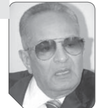
بهاء الدين أبو شقة