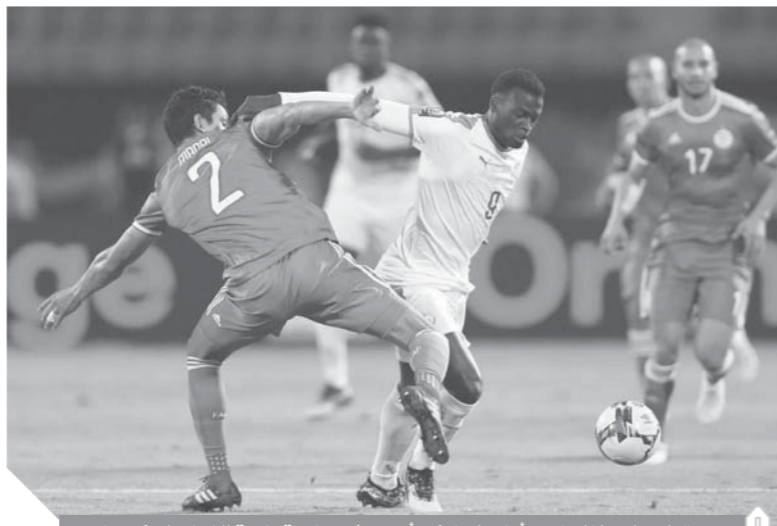
منتخب السنغال خسراً أمام الجزائر وأصبح في حاجة ماسة للفوز على كينيا

يبقى هذا اللقاء الأقوى الليلة في ظل الخسارة المباشرة للسنغال أمام الجزائر وهو ما وضع أسود التيرانجا في موقف حرج بضرورة الفوز لحسم التأهل عبر الوصافة، كما أن منتخب كينيا حقق فوزه الأول بالبطولة منذ ١٥ عاماً كاملة وأصبح يملك الفرصة لتحقيق المفاجأة على حساب السنغال. ويملك منتخب السنغال تفوقاً كبيراً على كينيا فقد فاز عليها في نسختي ١٩٩٢ و ٢٠٠٤ بثلاثية دون رد وتعادلا في نسخة ١٩٩٠. ويبقى الفوز مهما لمصالححة الجماهير السنغالية وهو ما أكده المدير الفني أليوسيسيه في حديثه قبل اللقاء، وحتى بعد الهزيمة أمام الجزائر، موضحاً أن المنتخب السنغالي عانى