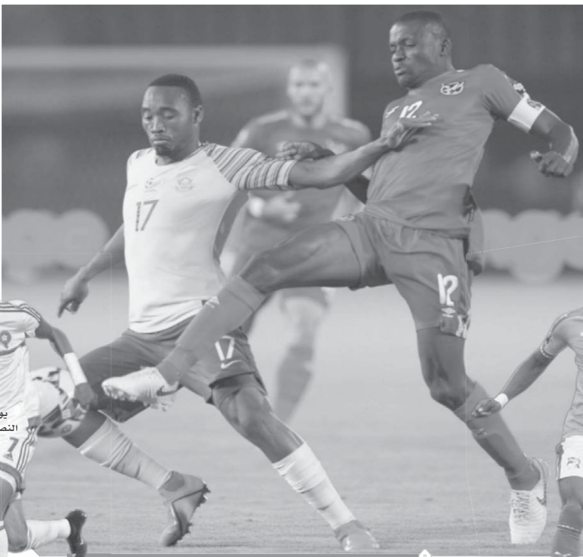
كوت ديفوار تسعى لتحقيق الفوز أمام ناميبيا لضمان الفوز

وضمن أسود الأطلس التأهل لدور الـ 16 بعد فوزه على كوت ديفوار بهدف دون رد ليصل إلى 6 نقاط مع منتخب جنوب أفريقيا الذي لديه 3 نقاط، ويطمح المغرب في الفوز لتأكيد صدارته للمجموعة، بينما تعقد موقف كوت ديفوار بعد فوز جنوب أفريقيا على ناميبيا بهدف وتساوى جنوب أفريقيا مع كوت ديفوار في رصيد 3 نقاط لتصبح الجولة الأخيرة حاسمة. ويتنظر أن يعتمد رينارد على تشكيل مكون من: ياسين بونو في حراسة المرمى، وخط الدفاع: أشرف حكيمي، وغانم سايس، ومهدى بن عطية، ونيل درار، وخط الوسط: مبارك بوضوفا، وكريم الأحمدى، ويونس بلهندة، وخط الهجوم: حكيم زياش، ونور الدين أمرايط، يوسف النصيري. بينما يعتمد جنوب أفريقيا على تشكيل مكون من: دارين كيت في حراسة المرمى، وفي خط الدفاع: تامسانكا مخيزي، سيفيسو هالانتسي، ثولاني هلالشوايا، بوهلي مخوانزي، وفي خط الوسط: هومفو كيكانا، ثيمبا زوانسي، بونجاني زونجو، سييسيسو فيلاكازي، وفي خط الهجوم: بيرسي تاو، ليو موثيا. كوت ديفوار ناميبيا ويلتقي كوت ديفوار مساء اليوم مع