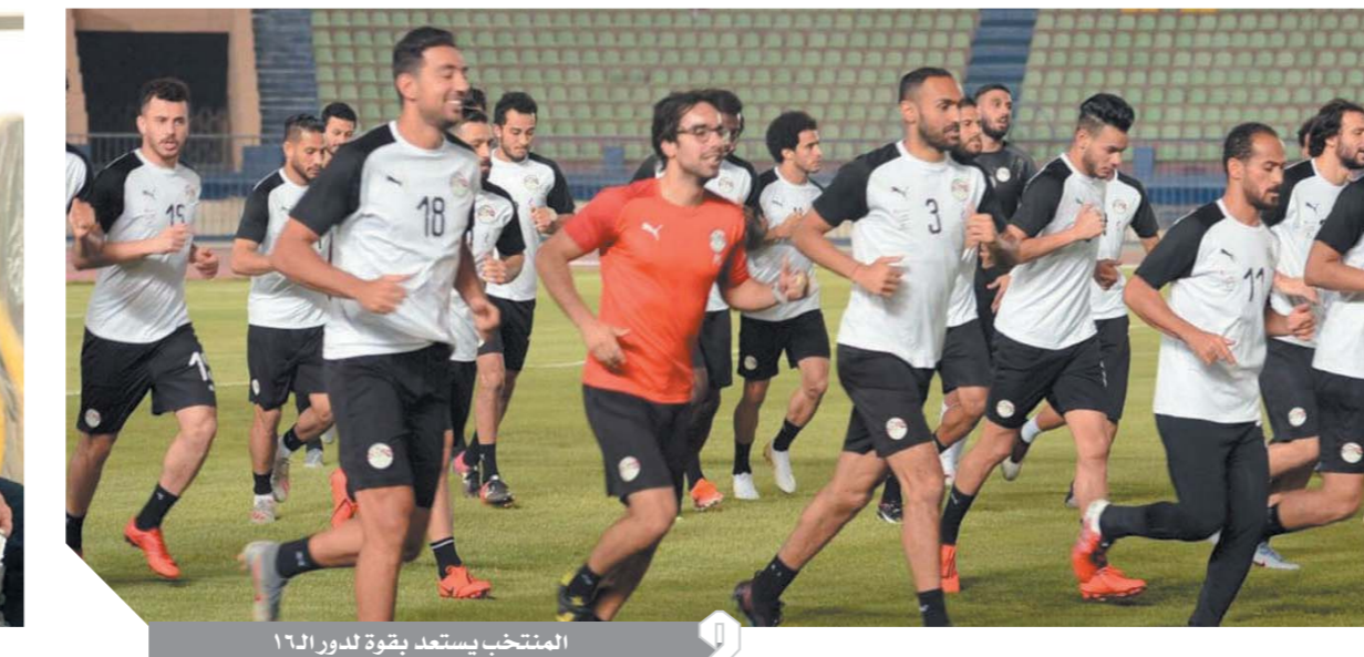
المنتخب يستعد بقوة لدور الـ١٦

المباريات لا يعنى توجهنا إلى الخطة الدفاعية، لكنه مجرد حرص على تحقيق الهدف المطلوب وهو النقاط الثلاث من المباريات. وشدد المدير الفني على أن منتخب مصر مثله مثل أي منتخب في أمم إفريقيا، باستثناء منتخب مالي فقط، وذلك من الناحية التهديفية فقط، ولا يتعدى أي منافس عنه بفارق كبير في تسجيل الأهداف، وذلك نظراً لصعوبة المنافسة والخطط المحكمة والتعامل التكتيكي مع اللاعبين. وكان أجيري قد ثمن من قدرات لاعبيه في الخط الهجومي، قائلاً: «من يملك وليد سليمان وعبدالله السيد وترزيجييه وصلاح لا يجب أن يدافع».