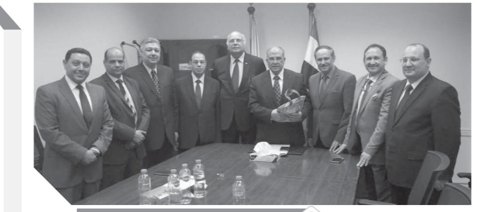
جانب من حفل تكريم وتوديع المستشار درويش

توجه الدكتور على عبدالعال رئيس مجلس النواب على رأس وفد برلمانى، أمس الأحد، إلى جمهورية روسيا الاتحادية، بناء على دعوة من رئيس مجلس الدوما الروسى للمشاركة فى المنتدى الدولى الثانى حول «تطوير النظام البرلمانى»، وكذلك المؤتمر البرلمانى الثانى أفريقيا، والمقرر عقدهما خلال الفترة من ١ إلى ٣ يوليو ٢٠١٩. من المقرر أن يتضمن المنتدى الدولى الثانى مناقشة بعض الموضوعات البرلمانية ذات الأهمية خلال جلساته التي تمتد على مدار يومين، ومن بينها دور البرلمانين في تعزيز السلام والاستقرار على المستوى العالمى، ودور التكنولوجيا الرقمية في تطوير العمل البرلمانى، وتكيفية مواجهة الحروب الإعلامية، ودور الشباب في تطوير العمل البرلمانى. أما المؤتمر البرلمانى روسيا - أفريقيا فيتناول سبل تعزيز العلاقات الروسية مع دول القارة الأفريقية، ومن المقرر أن يلقي الدكتور على عبدالعال كلمة خلال المؤتمر تتناول العلاقات الأفريقية مع روسيا وسبل تطويرها وفقاً للرؤية المصرية.