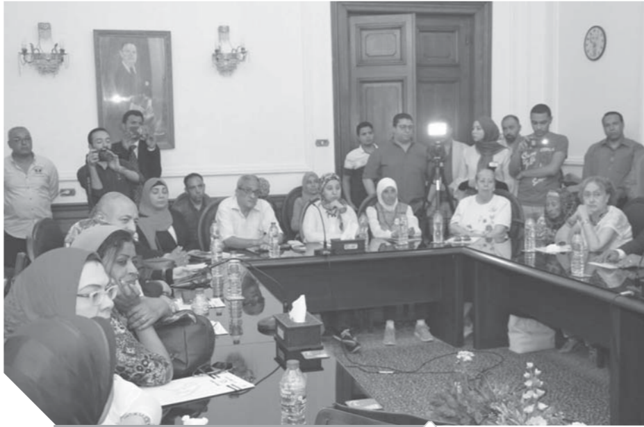
جانب من حضور الاحتفال

وأردف قائلاً: «حزب الوفد كان جزءاً رئيسياً فى الحركة الوطنية المصرية خلال المئة عام الماضية وهذا ما أكده المؤرخون، واستمر هذا الدور التاريخى الوطنى حتى ثورة ٣٠ يونيو، ودور الوفد فى تلك الثورة الشعبية، لتعلن أنه سيطر مديناً ومقاتلاً من أجل مصلحة الدولة المصرية، ولن يسمح الوفد بتهدى الدولة المصرية، وسيظل الوفد فى الحال والمستقبل مدافعاً عن الوطن والمواطن والدولة، وعلى استعداد تام لأن يضحى بكل شيء من أجل الحفاظ على الدولة، وعلى المصرى أن يتذكروا ما حدث من مخططات إجرامية من قوى الشر التى كانت تريد إجهاض ثورة ٣٠ يونيو واستمرار اختطاف الدولة المصرية، قبل الاحتفال بها؛ لأن الذكرى تفتح فى العمرة والمومطة، لذلك قال الله تعالى: وَذَكِّرْ فَإِنَّ الذِّكْرَ تَفْعُ الْمُؤْمِنِينَ ».