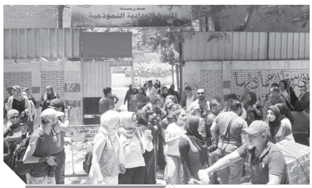
الطلاب يودعون الاختبارات

ارتفاع نسب النجاح، ومن المنتظر انتهاء كافة أعمال التصحيح نهاية الأسبوع المقبل، تمهيدا لإعلان النتائج النهائية منتصف يوليو الجارى. ومن المقرر أن يتم تخفيض أعداد المقبولين بكلليات الصيدلة وطب الأسنان، ما يؤدي إلى رفع الحد الأدنى لقبول الناجحين فى الثانوية العامة بالكليات الحكومية، وزيادة الإقبال على الكليات الخاصة، كما يتم زيادة أعداد المقبولين بكليات الطب ما يؤدي إلى خفض الحد الأدنى لقبول بهذه الكليات عن الأعوام الماضية، وتراجع الإقبال على كليات الطب الخاصة.