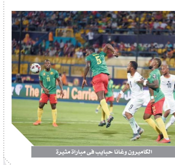
الكاميرون وغانا يجابه في مباراة مثيرة