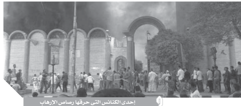
إحدى الكنائس التي حرقها رصاص الإرهاب

فمنذ ذلك التاريخ وعقب تكليف الرئيس عبد الفتاح السيسي، للهيئة الهندسية بالقوات المسلحة، بإعادة بناء وترميم الكنائس التي طالتها يد الإرهاب، وتعمل الدولة ليل نهار من أجل إعادة الإعمار والبناء والترميم لترسم البسمة على وجوه الإخوة المسيحيين. ففي المنيا سيطرت حالة من السعادة والفرحة على المواطنين المسلمين والمسيحيين، بعد إعادة بناء وترميم الكنائس التي دمرها الإخوة بالحرق والهدم عقب فض اعتصام رابعة والنهضة في أغسطس ٢٠١٣. وقصد «الوفد» -بالأسماء والأرقام، الكنائس التي تمت إعادة ترميمها وبنائها. فقد نجحت الهيئة الهندسية للقوات المسلحة، بإعادة ترميم تلك المنشآت التي تعرضت للتخريب، وعددها ٦٩ كنيسة وملحقاتها لطوائف الثلاث الأرثوذكسية والإنجيلية والكاثوليكية. وجاءت كنيسة الأمير تادرس الشطبي بمدينة المنيا التابعة لمحافظة الأقباط الأرثوذكس في أولى تلك المراحل، والتي تمت إعادتها في تحفة فنية رائعة وكنيسة «العائلة المقدسة» بملوي، ومينى الخدمات المحق والكنيسة الإنجليزية بملوي أيضا، حيث أنها حوت وهدمت بالكامل بعد أحداث فض اعتصام رابعة والنهضة. كما تم ترميم كنائس الآباء اليسوعيين بحى أبو هلال، وواجهة مبنى الخدمات الداخلية وواجهة المركز الطبى التابع لها في كنيسة مارمينا للأقباط الأرثوذكس بمنطقة أبوهلال بمدينة المنيا، والكنيسة الإنجليزية بالكامل بمنطقة جاد السيد بالمنيا، ومدرسة ودير راهبات القديس يوسف بالمنيا، وكنيسة الأنبا موسى الأوسد بمنطقة أبوهلال بالمنيا، ومار يوحنا بشارة السوق بالمنيا، وكنيسة مارمرقس للأقباط الكاثوليك بحى أبو هلال، والكنيسة الرسولية الثالثة بعزبة إسكندر، وأبو هلال