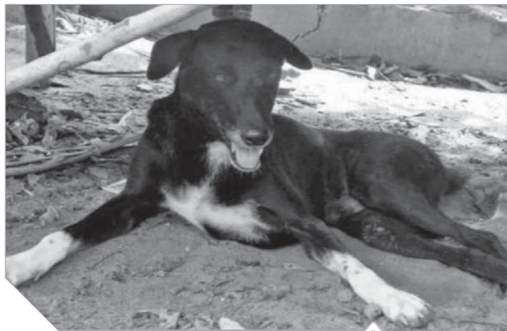
الكلب الأخرج الذي أنقذ الوليد