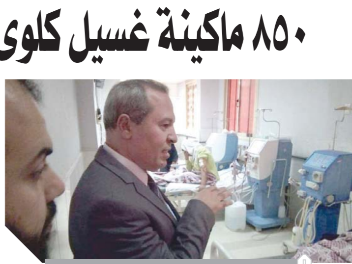
شاروبيم يتفقد وحدات الفسيل والكلى

المحافظة، وأشار مكي إلى أن القدرة الاستيعابية لها تبلغ ٣٥٠٠ حالة ولا توجد قوائم انتظار لمرضى الكلى، كما توجد أماكن متاحة لاستيعاب الحالات الجديدة، بالإضافة إلى تطوير العديد من الوحدات المختلفة مثل أجا، دماص، كلى ومسالك ميت غمر، منية النصر، المطرية، دكرنس، الجمالية، كوم النور، شربين، بلقاس، المنصورة الدولى، تم الأمديد، المنزلة، كفر الزترعة، المعصرة، وتوسعة القدرة الاستيعابية بها، وإحلال وتجديدا ما يقرب من ١٠٠ مآكنة غسيل كلوى جديدة هذا العام بتكلفة وصلت إلى ٢٠ مليون جنيه لخدمة مرضى الفشل الكلى بالمحافظة والبالغ عددهم ٢٧٥٠ مريضاً على مستوى