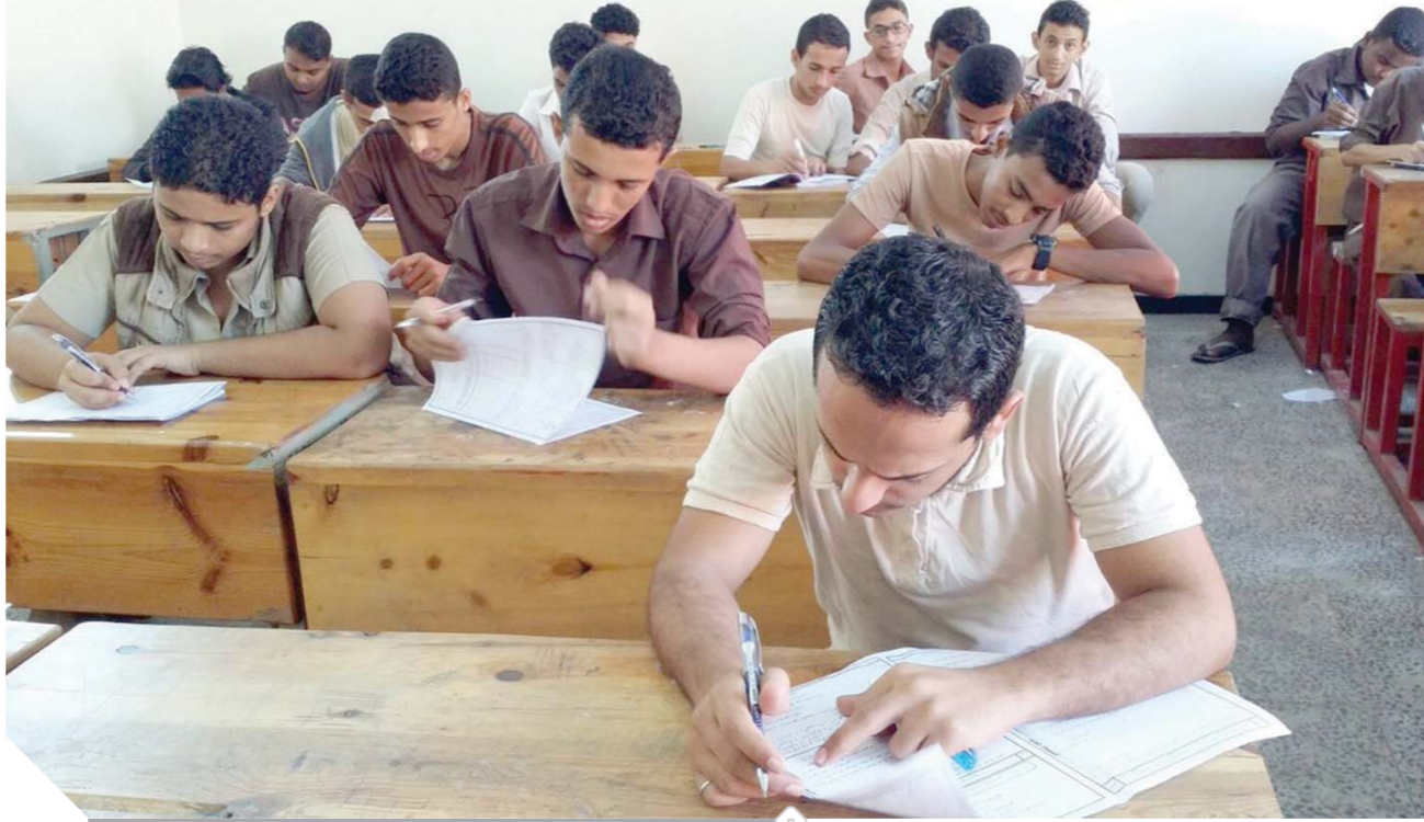
طالبة الثانوية العامة يؤدن الامتحان (صورة أرشيفية)

بالتواجد داخل لجان سير الامتحانات. وأكد على تلافى السبلات التى تعرضت لها أعمال الامتحانات الأعوام السابقة وإيجاد الحلول التى تساهم فى القضاء على تلك السبلات والتى منها تأخر نتائج التحقيقات التى تجرى داخل لجان سير مع الطلاب. وشدد على منع وجود هواتف محمولة داخل اللجنة