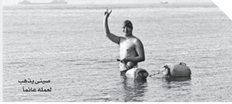
صيني يذهب لعمله عائلاً