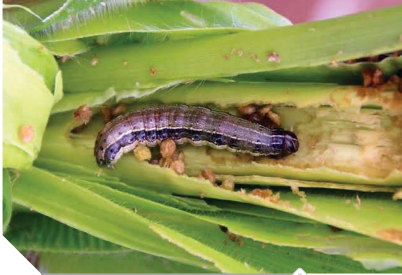
«الزراعة»، تواجه أخطر حشرة فى العالم

أعلنت وزارة الزراعة واستصلاح الأراضى حالة الطوارئ ويده تسجيل دخول دودة الحشد الخريفية، أو ما تعرف بالحشرة الفتاكة» إلى مصر والتي تهدد بإتلاف ٨٠ محصولاً زراعياً. ووفقاً للتقرير الخاص بنتائج تحليل عينة حشرية تم أخذها من قرية العقية بمركز كوم أمبو بأسوان، بأحد حقول الذرة الشامية، قام معهد بحوث أمراض النباتات بتعريف العينة ظاهرياً على أنها دودة الحشد الخريفية، كما تمت المطابقة بتقنية البصمة الوراثية. وتم اتخاذ التدابير اللازمة والإجراءات الفورية لإدارة هذه الحشرة فى البلاد، بما فى ذلك مخاطرها تحت الظروف المحلية، مع التحقق من إتباع الطرق العلمية للردود والحصر والتعريف، واستخدام التقنيات الحديثة، وإجراء تحليل مخاطر الحشرة طبقاً للقواعد والمعايير الوطنية والدولية ذات الصلة بتسجيل أفة جديدة.