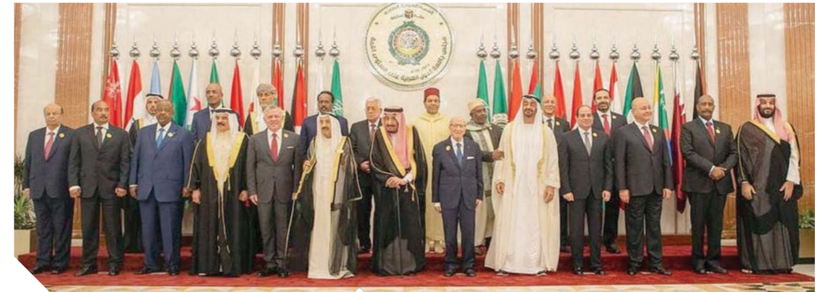
الملوك والرؤساء والأمراء العرب خلال القمة في مكة المكرمة

الدول العربية تطالب المجتمع الدولي باتخاذ موقف حازم في مواجهة إيران