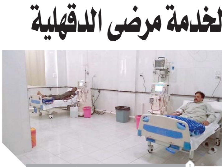
وحدات الفسيل الكلى بالدقهلية

شبيه السادات ينام فى الشارع كتب: محمد عبد الحميد: مشهد غريب آثار فضول ودهشة مواطنى مدينة بنها والواحدين عليها.. مواطن يشبه إلى حد كبير الرئيس الراحل محمد أنور السادات يجلس بين عمارتين سكنيتين على الطريق السريع بشارع فريد ندا. وما آثار دهشة المواطنين هو التزام المواطن الصمت وعدم التحدث مع أحد والاعتماد على كتابة عبارات على لوحات ورقية يضعها أمامه. وكانت أبرز تلك اللوحات ما كتبه المواطن (أنا خالد الأولاى ابن الرئيس المتوفى أنور السادات)، طالب مواطنون بنها بسرعة تدخل أجهزة المحافظة لبحث حالة المواطن وما يظهر من عبارات ورفع معاناته وخاصة في ظل رفضه قبول أي مساعدات منهم ونومه فى الشارع بشكل مهين.