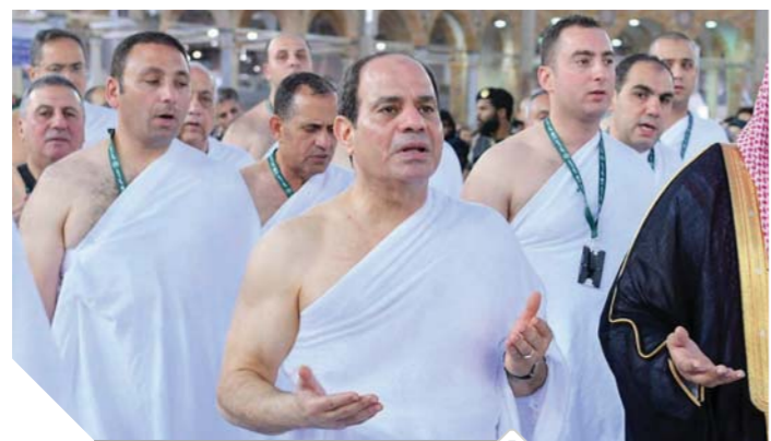
الرئيس خلال أدائه مناسك العمرة

المنطقة والأوضاع الراهنة وتعزيز العمل العربي المشترك وسبل مواجهة التحديات المشتركة. وكان الرئيس استمع فور وصوله مطار الملك فهد بن عبدالعزيز إلى شرح مفصل من العقيد تركي المالكي، المتحدث باسم قوات التحالف العربي، عن الاعتداءات على الأراضي السعودية، حيث شاهد «السيسي» بقايا بعض الأسلحة والصواريخ التي اعترضتها قوات الدفاع الجوي السعودي مؤخرًا.