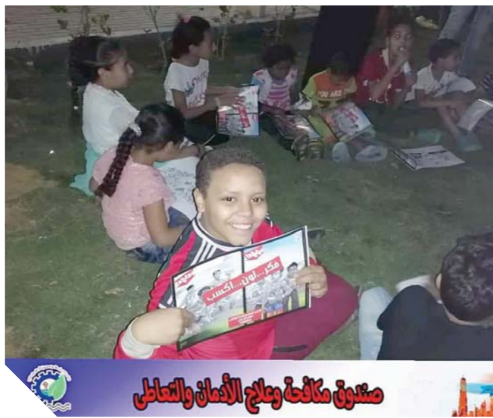
صندوق مكافحة وعلاج الإدمان والتعاطى