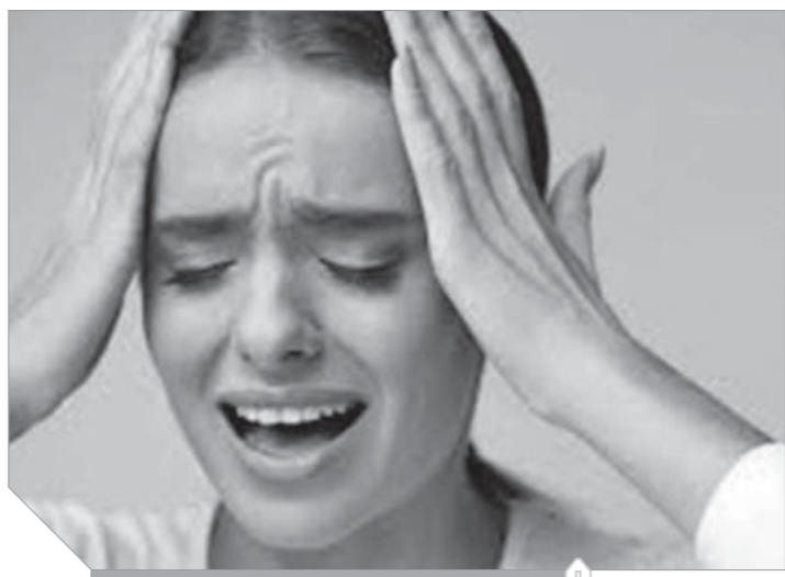
مادة بالدماع تنبئ برغبة الانتحار

هل يمكن التنبؤ العلمي برغبة أي شخص في الانتحار مستقبلاً؟، الإجابة الدينية لا لأن ذلك سيكون في علم الغيب بالطبع، ولكن علماء جامعة «ييل» الأمريكية تمكنوا من خلال التوصل إلى مادة كيميائية في دماغ الإنسان، هذه المادة بمثابة المرشد إلى أن هذا الشخص سيفكر في الانتحار لاحقاً، أو قد يقرر بالفعل الانتحار، هذه المادة الكيميائية ترتفع معدلاتها عندما يفكر الشخص في وضع حد لحياته، ويمكن رصد مؤشرات مستقبلاً. ومعلوم أن محاولات سابقة كثيرة من الباحثين في الطب النفسي وعلم النفس، تمت من أجل العثور على مؤشرات للأفكار الانتحارية، من أجل معرفة الأشخاص المعرضين للخطر في وقت مبكر، وتطوير عقاقير تستهدف أنشطة الدماغ، وتهدئ من انفعالات هذا الشخص الغاضبة، وتجعله أكثر احتمالاً للحياة وضغوطها. وأخيراً نجحت هذه المحاولات، وتمكن العلماء في جامعة «ييل» من التوصل إلى هذه المادة ورصد معدلات أنشطتها في الأدمغة، وأثبتت النتائج أن هذه المادة في خلايا المخ، ومرتبطة بالقلق واضطرابات المزاج والاكتئاب، وتتواجد في خمس مناطق في أدمغة الذين يعانون من اضطرابات ما بعد الصدمة أو الاكتئاب،