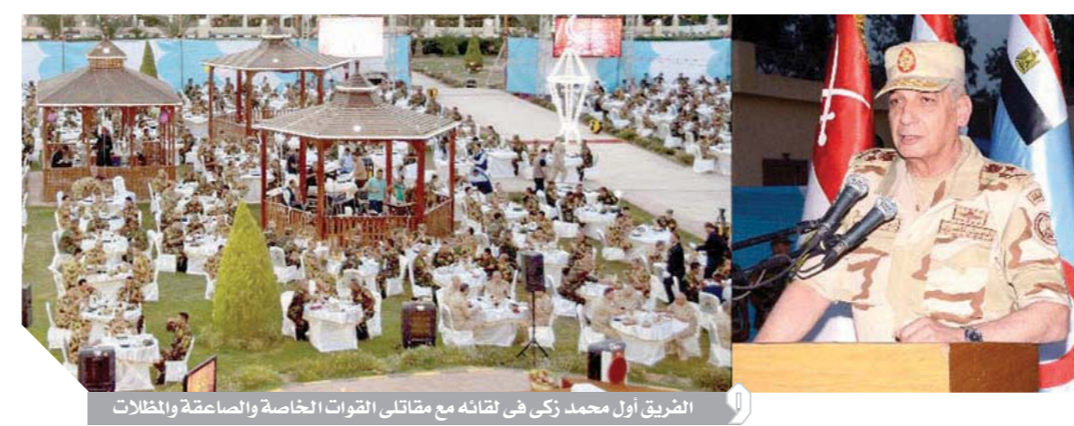
الضريق أول محمد زكي في لقاءه مع مقاتلي القوات الخاصة والصاعقة والمظلات

وطالهم بالحفاظ على أعلى معدلات الجاهزية والاستعداد القتالي لتنفيذ كافة المهام التي توكل إليهم. وأكد القائد العام أن القدرة العسكرية هي أحد مكونات قوى الدولة الشاملة والركيزة الرئيسية لتأمين الدولة المصرية ضد كافة التهديدات والعدائيات والتحديات داخلياً وخارجياً، وأن رجال القوات المسلحة يراودهم القوية وعزيمتهم التي لا تلين ماضون في أداء مهامهم المقدسة المكلفين بها لحماية الوطن والتصدي لكل من يحاول استباحة أرض مصر وسيادتها ومصالحها. واستعرض القائد العام التحديات وتطورات الأوضاع في المنطقة وانعكاساتها على أمننا القومي وجهود القيادة السياسية للارتقاء بالوطن في شتى المجالات، وطالب رجال القوات المسلحة باليقظة والانتباه