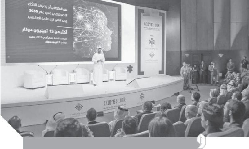
شهدت العاصمة الأردنية عمان إطلاق مبادرة مليون مبرمج أردني بمشاركة وفد رفيع المستوى من دولة الإمارات العربية المتحدة ضم معالي محمد عبدالله القرقاوي، وزير شؤون مجلس الوزراء والمستقبل، وعددًا من المسؤولين برعاية وحضور الأمير الحسين بن عبدالله الثاني ولي عهد المملكة الأردنية الهاشمية، وفي إطار الشراكة الاستراتيجية بين دولة الإمارات والمملكة الأردنية الهاشمية في مجال التحديث الحكومي وتعزيز الابتكار وتمكين الخبرات والمهارات الشبابية ضمن رؤية مستقبلية أشمل تهدف إلى تمكين المجتمعات العربية.

والإنترنت في الإمارات، واحتلت الإمارات المركز الثالث عالمياً في الرضا عن خدمات الإنترنت السريعة، وتقدمت الإمارات على دول الصين وتركيا، كما جاءت بين أفضل ٥٠ دولة في العالم في خدمة توفير أرقام الهاتف المتحرك.