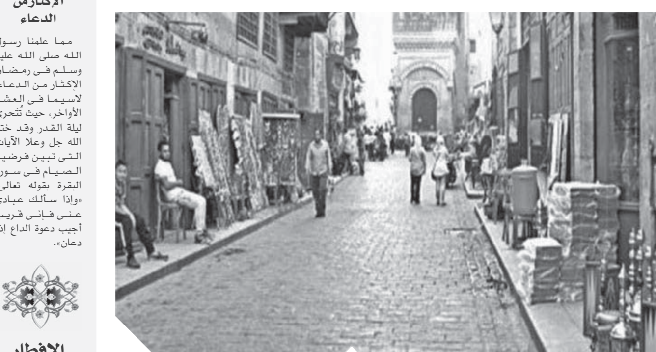
شارع المعز قبلة السياح في القاهرة الفاطمية