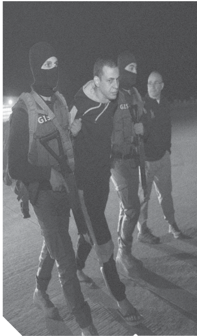
لحظة وصول الإرهابي إلى مصر

وأوضح عضو المجلس القومي لمكافحة الإرهاب، أن المخابرات العامة المصرية كانت تدرك أننا أمام نشاط إرهابي عالمي وليس محلياً، لافتاً إلى أن المخابرات العامة لديها دراية بضرورة مكافحة الإرهاب خارج مصر، فالعمليات التي كان يذيع المتحدث العسكري مقاطع منها، كانت أحد تجليات الجهود الاستخباراتية لحماية أمن مصر من التدفقات الإرهابية الخارجية. وأكد اللواء محمد الشهاوي، مستشار كلية القادة والأركان والخبير العسكري، أن القبض على الإرهابي هشام عشاوي أصاب