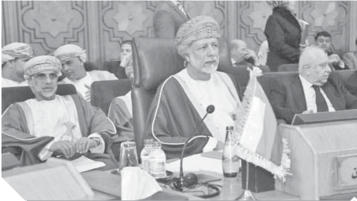
يوسف بن علوي بن عبدالله الوزير المسؤول عن الشؤون الخارجية في سلطنة عمان يترأس وفد السلطنة في أحد الاجتماعات العربية المهمة التي تبحث التحديات الراهنة

وهكذا لم يكن يتقنى سوى أن يغزل ترامب أشعار الغزل في الإيرانيين.