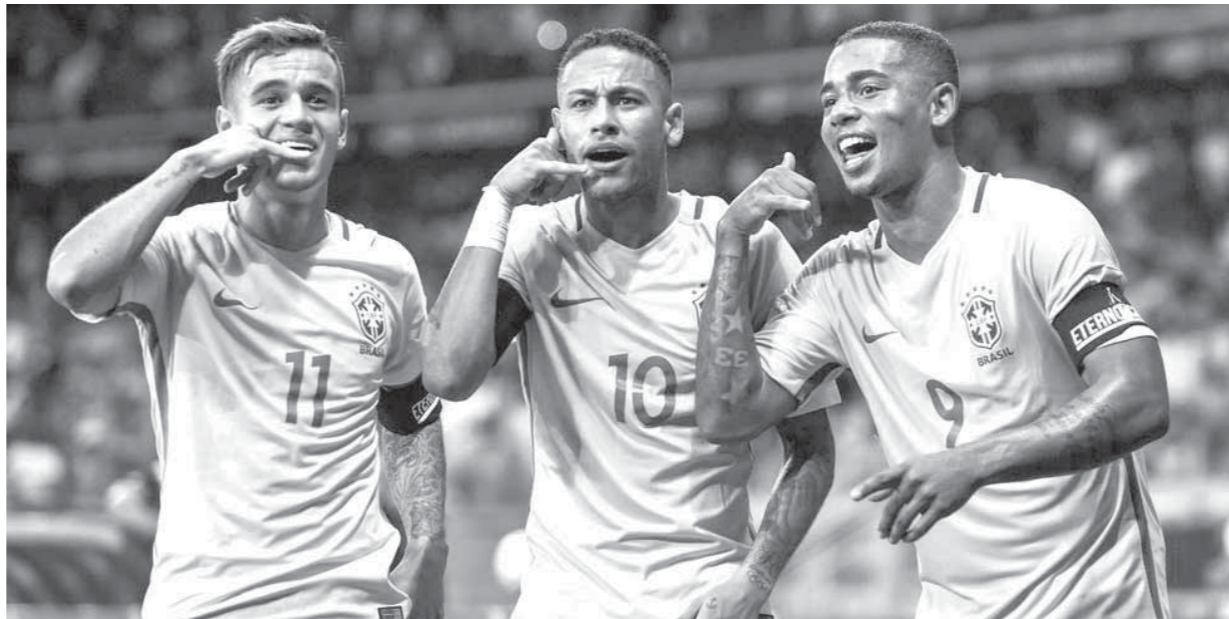
نيمار وخيسوس وكوتينيو