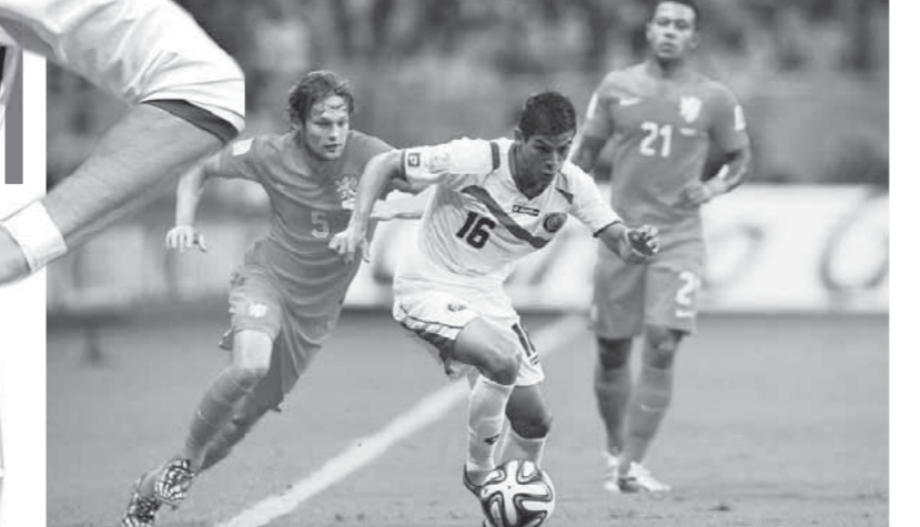
منتخب كوستاريكا حقق المفاجآت في مونديال 2014

منتخب كوستاريكا الكثير من اللاعبين الكبار وأصحاب شهرة كبيرة، وعلى رأسهم كيلور نافاس، حارس مرمى ريال مدريد الإسباني الذي توج معه ببطولة دوري أبطال أوروبا والكثير من الألقاب وهو أهم أسلحة المنتخب الكوستاريكي. ويعتمد منتخب كوستاريكا على أبرز لاعبيه المهاجم جويل كاميل لاعب نادي أرسنال الإنجليزي السابق وريال بيتيس سندرلاند الإنجليزي وإيفرتون السابق.