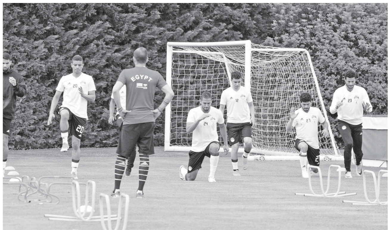
المنتخب استعداد بقوة لودية كولومبيا