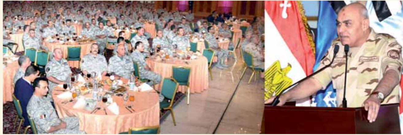
وزير الدفاع خلال لقائه مقاتلي القوات الجوية وبعض طلبة الكلية الحربية

أكد الفريق أول صدقي صبحي القائد العام للقوات المسلحة وزير الدفاع والإنتاج الحربي أن وقسم اللواء للوطن المقدس ستظل الدرع الواقي، والحصن المنيع لشعبنا العظيم، جاء ذلك خلال لقائه عددًا من أبطال ومقاتلي القوات الجوية وعددًا من طلبة الكلية الجوية، حيث شاركهم وجبة الإفطار، معرباً عن اعتزازه بمستوى الاستعداد والجاهزية والجهود التي يبذلها مقاتلو القوات الجوية للدفاع عن سماء مصر وتنفيذ كافة المهام التي تسند إليهم تحت مختلف الظروف، مؤكداً أن ذلك يعد مدعاة للفخر في ظل تحديات كثيرة تواجه الوطن وأمنه القومي.