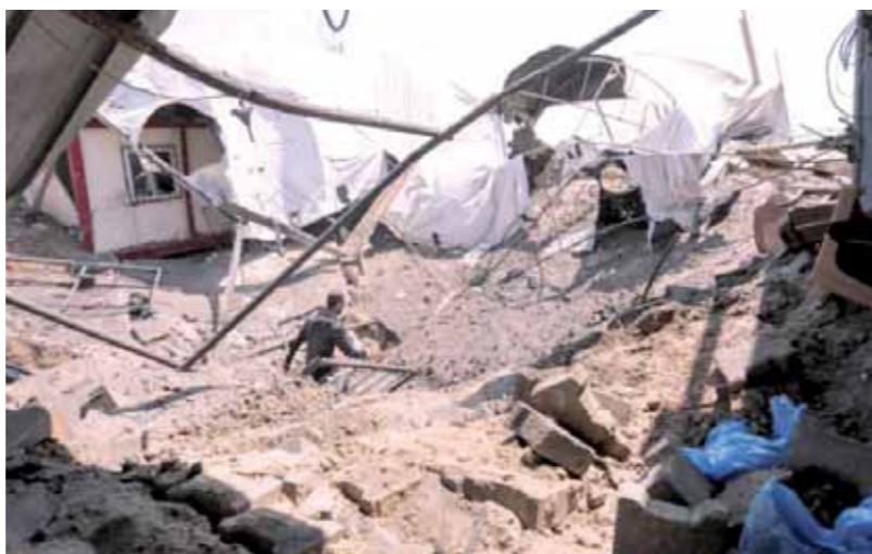
الدمار في خان يونس

أكد منسق الأمم المتحدة للشرق الأوسط نيكولاي ملادينوف لمجلس الأمن الدولي، أن أعمال العنف الأخيرة بين إسرائيل وحركة حماس، تضع قطاع غزة على حافة الحرب، وقال ملادينوف، الذي كان يتحدث عبر الفيديو من القدس، إن «هذه الجولة الأخيرة من الهجمات، تشكل إنذاراً للجميع بأننا على حافة حرب كل يوم». وأعلنت شركة توزيع الكهرباء في قطاع غزة أنها تواجه أزمة حادة في توفير التيار الكهربائي، حيث تصل ساعات قطع التيار الكهربائي إلى 30 ساعة مقابل 4 ساعات وصل، بسبب تعطل عدة خطوط إسرائيلية مغذية للقطاع، وشغلت سلطة الطاقة الفلسطينية «مولداً واحداً فقط في محطة توليد الكهرباء المتوقفة