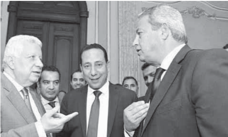
مرتضى منصور يهاجم وزير الرياضة