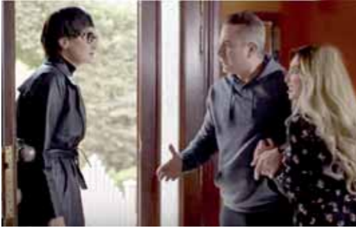
مشهد من مسلسل ضد مجهول