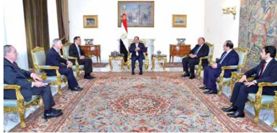
السيسي خلال استقباله وفد مجلس النواب الأمريكي

من جانبه، أعرب أعضاء الوفد الأمريكي عن شكرهم للرئيس «السيسي»، وأكدوا حرص الولايات المتحدة على تعزيز العلاقات الثنائية مع مصر ودعمها المستمر في دورها المحوري كركيزة لاستقرار في منطقة الشرق الأوسط، كما أشاد أعضاء الوفد الأمريكي بما تشهده مصر من إنجازات على صعيد مواجهة الإرهاب