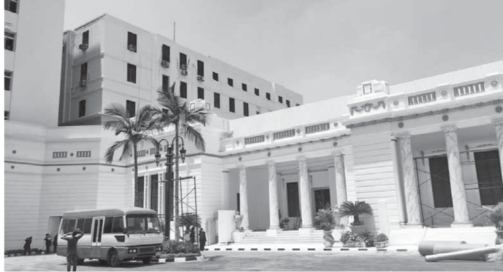
مجلس النواب في صورته النهائية لاستقبال الرئيس

ويتوقع أن تحمل كلمة الرئيس رسائل هامة وملاحم العمل خلال المرحلة القادمة، وبعد ذلك يتجه الرئيس إلى مقاررة القاعة، وجدير بالذكر، أن فترة ولاية جديدة مدتها 4 سنوات، تنتظر الرئيس عبدالفتاح السيسي، بعد فوزه في الانتخابات الرئاسية 2018 بواقع 97.08% من الأصوات الصحيحة، تبدأ بعد انتهاء المدة الحالية، وذلك في 2 يونيو 2018 بإتمامه 4 سنوات على توليه مقاليد السلطة في مصر، وتحديداً من يوم إعلان النتيجة النهائية للانتخابات في 3 يونيو 2014، ويشار في هذا الصدد، إلى أن القسم الذي سيدلى به الرئيس أمام مجلس النواب - السلطة التشريعية - منذ ثورة 25 يناير، وبعد دستور 2014، حيث أدلى الرئيس القسم بعد فوزه في انتخابات 2014 أمام الجمعية العمومية للمحكمة الدستورية لعدم وجود برلمان وقتئذ .