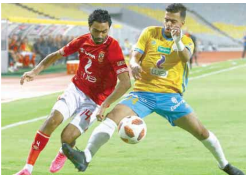
لقاءات الأهلى والإسماعيلى دائماً ما تشهد مواجهات مثيرة

بالدورى بالخسارة من البنك الأهلى ٢-٤ والتعادل مع انبى ٢-٢ والفوز على زد ١-١ وأخيراً الخسارة من الزمالك. وقرر السويسرى مارسيل كولر المدير الفنى للدورى بالخسارة من البنك الأهلى ٢-٤ والتعادل مع انبى ٢-٢ والفوز على زد ١-١ وأخيراً الخسارة من الزمالك، فى المرحلة الحالية، لمواجهة ضغط المباريات المحلية،