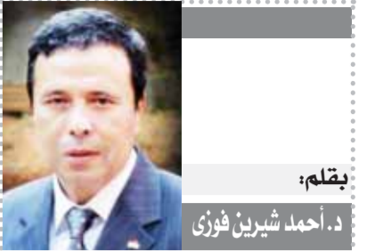
يقلم: د. أحمد شيرين فوزي