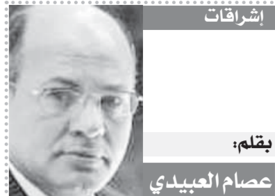
بقلم: عصام العبيدي