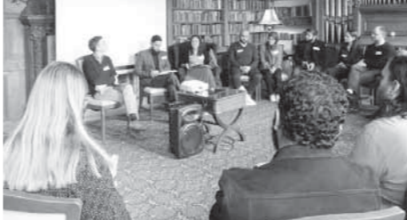
جانب من ملتقى الزمالة ببريطانيا