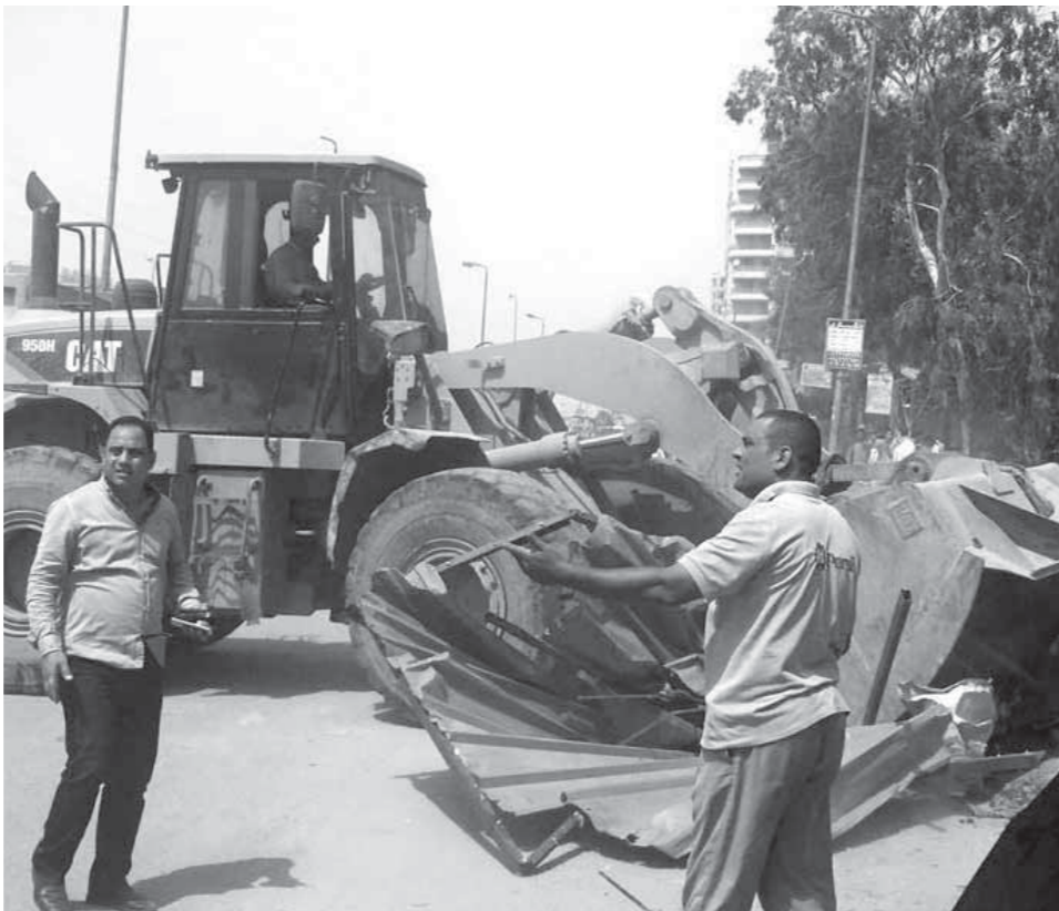
حملات الازالة مستمرة