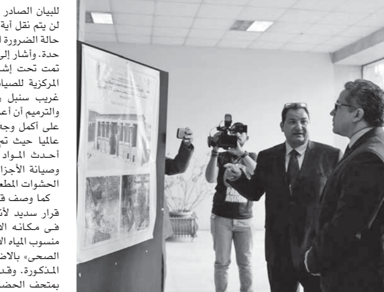
عنانى خلال افتتاحه مؤتمر الآثار

للبيان الصادر من وزارة الآثار الأسبوع الماضى لن يتم نقل أية منابر أثرية من المساجد إلا فى حالة الضرورة القصوى بعد دراسة كل حالة على حدة، وأشار إلى أن عملية الفك والنقل والتركيب، وأشار إلى أن أعمال ترميم كافة أجزاء المنبر تمت على أكمل وجه وفقا للمعايير العلمية المعتمدة عالميا حيث تم تقوية أجزاء المنبر باستخدام أحدث المواد العلمية المستخدمة فى ترميم وصيانة الأجزاء الخشبية بالإضافة إلى تثبيت الشواطىء الملمعة بالعاج والعظام. كما وصف قرار نقل منبر أبو بكر مزهر بأنه قرار سديد لأنه أنقذ المنبر من التلف بوجوده فى مكانه الأصلى بالمسجد بسبب ارتفاع منسوب المياه الأرضية «مياه المطر والصرف غير الصحى» بالإضافة إلى غلق المسجد للأسباب المذكورة، وقد تم إعادة تركيب ونصب المنبر بمتحف الحضارة لاستمتاع الزائرين بمشاهدة أحد أهم المنابر التى ترجع للعصر المملوكى.