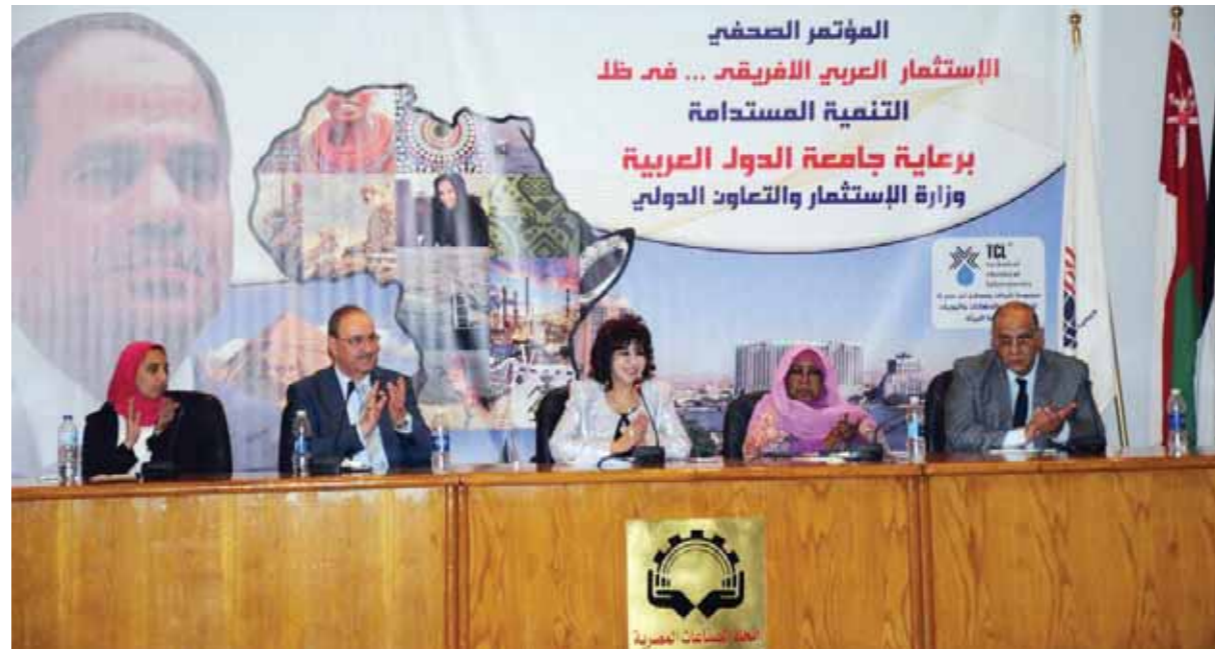
المؤتمر الصحفي للإستثمار العربي الأفريقي... قم ظل التنمية المستدامة برعاية جامعة الدول العربية وزارة الإستثمار والتعاون الدولي

«الصدر»: 1100 فرصة استثمارية للشركات المصرية والعربية