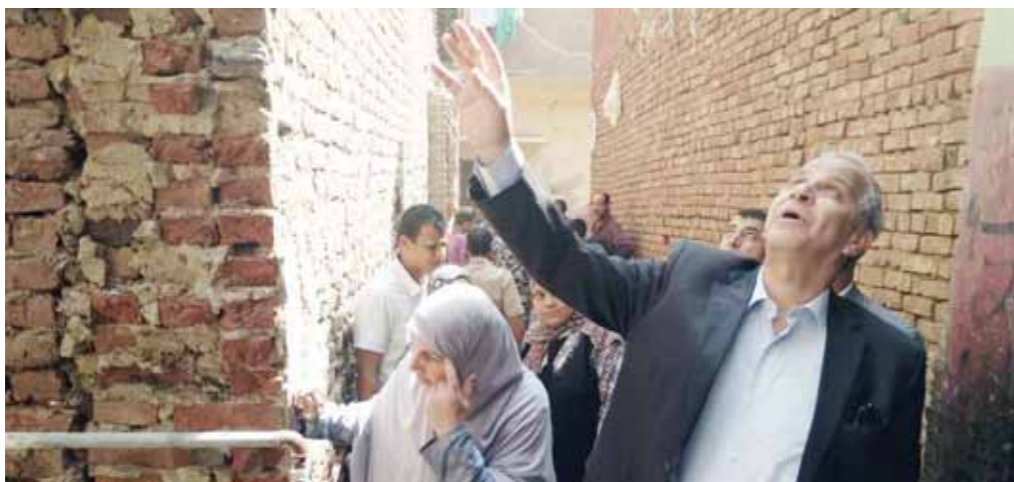
محافظ القليوبية يتفقد المنازل المتصدعة

وتم التنسيق مع محافظ القليوبية اللواء محمود عشماوى وجار إخلاء السكان ومنعهم شقق إيجار لحين الانتهاء من أعمال الترميم، وقام المحافظ بزيارة لمنطقة «العلوة»، أمس للاطلاع على الموقف وقرر توفير سكن لكل عائلة على نفقة المحافظة بمشاركة رجال الأعمال لحين إعادة بناء المنازل وإعادة تخطيط الشوارع. وفي الزقازيق قررت نيابة قسم أول برئاسة المستشار أحمد سلام حيس 6 أشخاص 4 أيام على ذمة التحقيقات لاتهامهم بالتقريب عن الآثار بجوار معبد بيبى الثانى بالقرب من منطقة التجديد وقررت النيابة تشكيل لجنة فنية لفحص المضبوطات التي شملت شواهد أثرية وأواني فخارية، كشفت التحريات أن المتهمين استغلوا الحديقة الخلفية للعمارة المجاورة لمعبد الملك بيبى الثانى للوصول للمقتنيات الأثرية، وقاموا بحفر حفرة على عمق 9 أمتار.