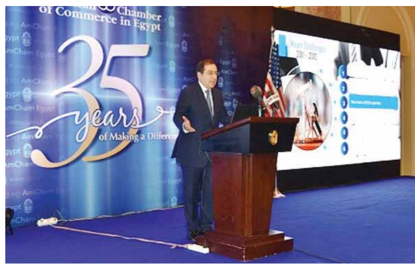
وزير البترول خلال لقائه بأعضاء غرفة التجارة الأمريكية

من ناحية أخرى أعلن وزير البترول أن الوزارة بصدد طرح مزايدة عالمية جديدة للبحث عن الغاز الطبيعي في البحر المتوسط خلال الفترة المقبلة والتخطيط لطرح مزايدة عالمية للبحث عن البترول والغاز في منطقة البحر الأحمر قبل نهاية العام الحالي عقب انتهاء المشروع الحالي للمسح السيزمي الجاري تنفيذه بهذه المنطقة موضفاً أن طرح المزايدات العالمية للبحث والاستكشاف في البحر المتوسط والبحر الأحمر يأتي في إطار استراتيجية الوزارة للتوسع في الأنشطة الاستكشافية في المناطق البكر التي تتمتع باحتمالات بترولية وغازية واعدة، لافتاً إلى أن حجم الاستثمارات الأجنبية المخطط ضخها خلال العام المالي 2019/2018 في مجالات البحث والاستكشاف وتنمية الحقول المكتشفة يصل إلى نحو 10 مليارات دولار.