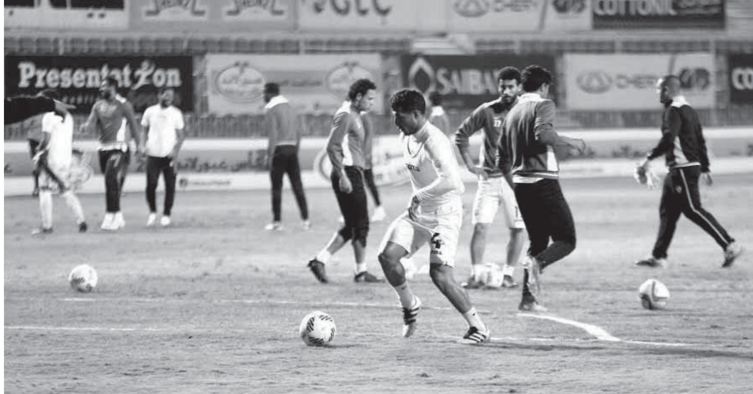
تدريبات مكثفة للزمالك استعداداً لمباراة الإنتاج فى الكأس