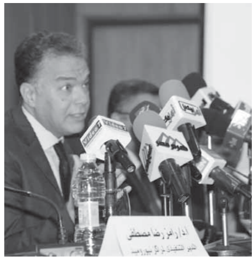
كلمة وزير النقل فى الندوة

حضر الندوة جميع الهيئات والشركات التابعة لوزارة النقل وشركات القطاع الخاص العاملة فى نقل الركاب تحت إشراف وزارة النقل وجمعيات نقل البضائع وشركات القطاع العام والخاص العاملة فى نقل الركاب والبضائع.