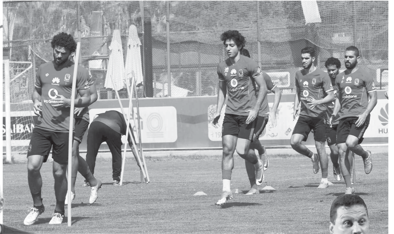
الأهلى يستعد دون راحة لمواجهة الترجى