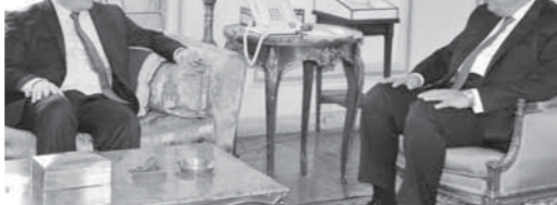
وزير الخارجية يستقبل نظيره الأوكرانى